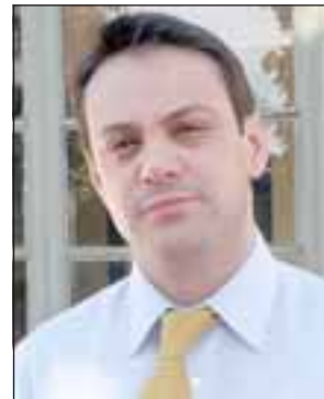
El Diputado Gaspar Rivas explicó que la asignación de recursos sería para el trabajo en los distritos y no va al sueldo de los Senadores.

pero en este tema, los diputados realizaron los cuestionamientos necesarios. Según el Diputado Rivas, estos recursos serían destinados para asesorías y gastos en el distrito, y no irían directamente al sueldo de los Senadores, tal como sucede con los Diputados.