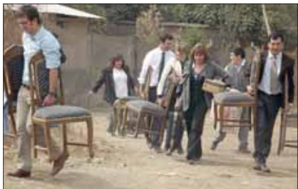
Los enseres fueron trasladados de las viejas viviendas a las nuevas, cada vecino sintió alivio y alegría en este día inolvidable para ellos.

par Rivas y el Alcalde (S) Claudio Díaz, las autoridades visitaron una de las viviendas, para luego concurrir a la casa que hasta ahora habitaba una familia y ayudarlo a trasladar sus enseres a la nueva vivienda.