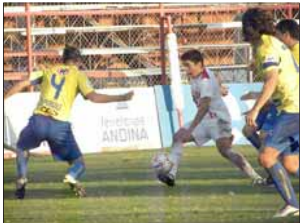
El Uní dominó gran parte del partido contra el 'Campanil', pero no fue suficiente para quedarse con los tres puntos.