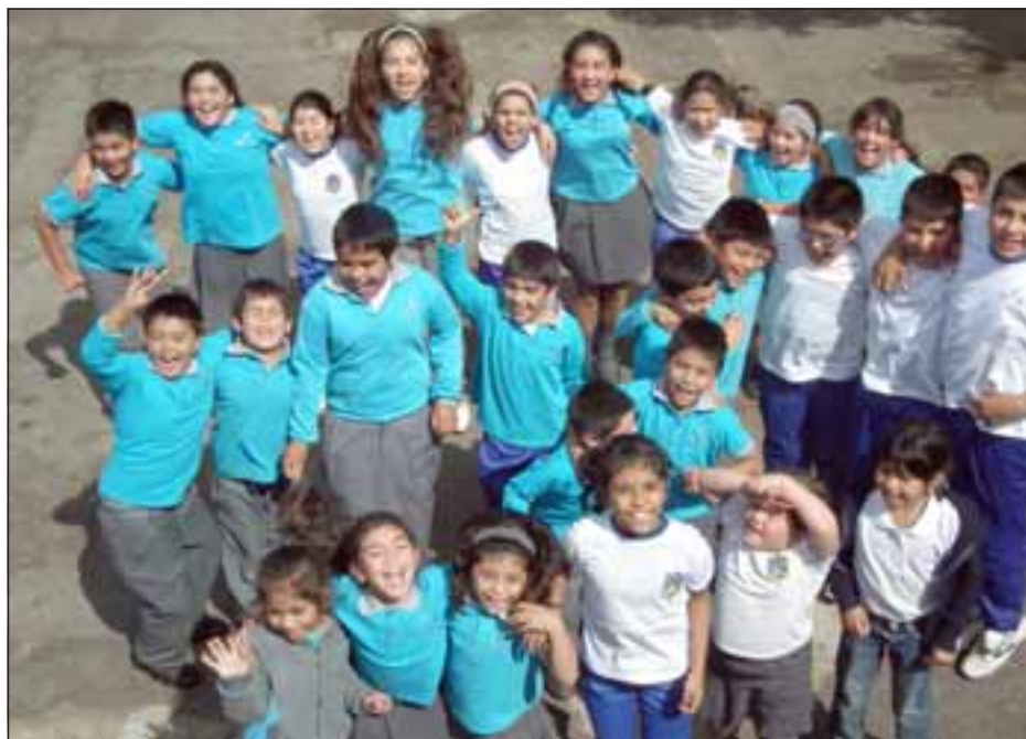
Los estudiantes poco a poco recuperan sus ganas de salir adelante mientras el 2012 transcurre con aumento en la matrícula escolar a nivel nacional. (Foto estudiantes de la Escuela José Bernardo Suárez, El Asiento).

En la práctica llegaron 153 alumnos más al Sistema Municipal, es decir el año se perdieron 900 matrículas y este año ya se re-