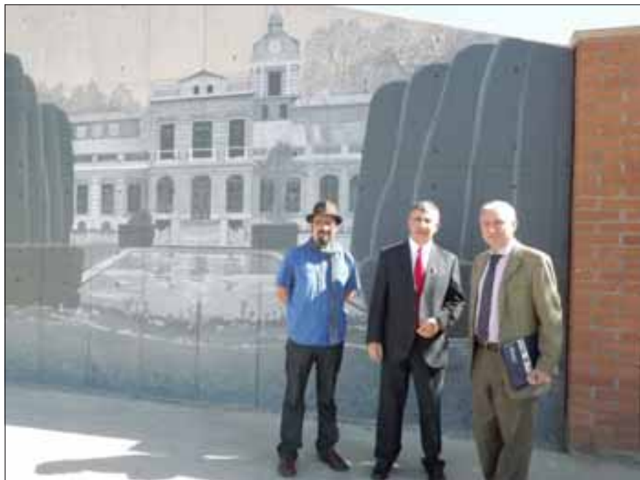
La Estación de Trenes de 1910, además del Palacio de la Hacienda de Quilpué, fueron los temas centrales de los dos murales elaborados por el profesor Rodrigo Álvarez, en los muros que conforman la fachada del edificio institucional en La Troya.

para inaugurar la instalación de dos murales que rescatan la historia, la memoria, la intimidad, de quienes habitan en San Felipe. Tiene entonces un componente singular, porque es una forma inteligente de dar elocuencia y pertinencia para señalar y dar testimonio del compromiso que tiene la Universidad de Valparaíso con la comunidad y con quienes han formado parte de la historia de San Felipe», dijo la autoridad universitaria.