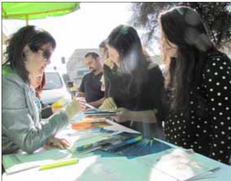
Decenas de personas se informaron sobre muchos aspectos de interés general en las tantas mesas colocadas para esta gestión.

Este Primer Gobierno en terreno finalizó pasadas las 13:30 horas y la próxima feria se realizará en la comuna de Llay Llay, en un lugar que será informada oportunamente.