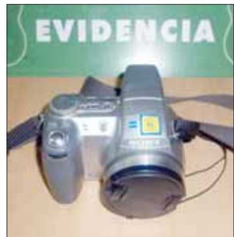
Esta cámara filmadora fue parte de los artículos robados y recuperados por las autoridades policiales en poder de la hermana de la sospechosa principal.