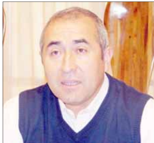
El concejal dijo que comprobó en terreno que la tarifa se mantenía en 250 pesos, a pesar de que los microbuses lucen el distintivo que establece la rebaja del pasaje escolar.

“Yo considero que esto es una burla a la comunidad, porque lo que han hecho algunas empresas es subir la tarifa local para mantener la tarifa escolar a un precio más bajo, pero es el mismo precio que tenían en marzo del año pasado, por lo tanto señores, yo les digo adónde está la rebaja, adónde han ido a parar los recursos del Transantiago que tenían como objetivo beneficiar a los estudiantes de nuestra