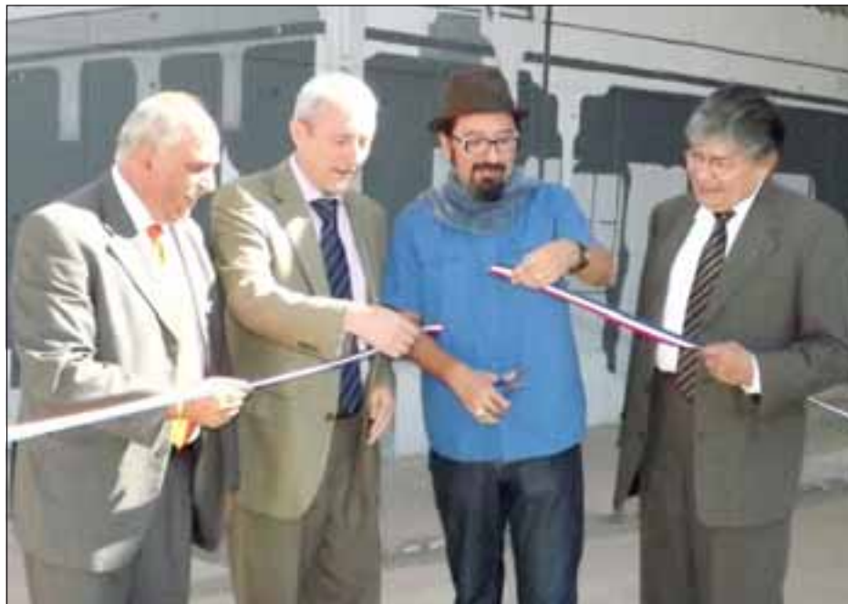
El corte de la cinta oficializó este monumento a la historia de Aconcagua y el presente 'Años Académico' en la UV San Felipe.