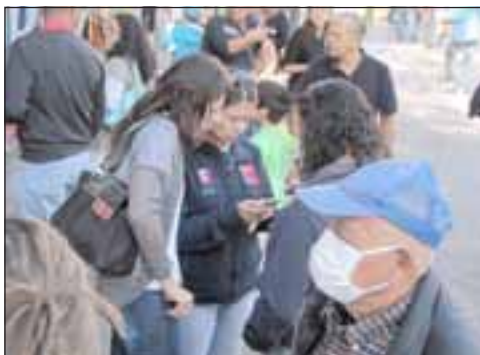
Algunos se tomaron más en serio que otros el tema de la salud personal en esta actividad.