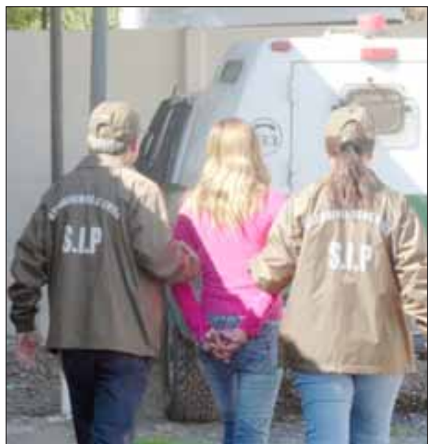
La sospechosa fue detenida y llevada ante el Fiscal de Turno, quien luego la dejó en libertad.