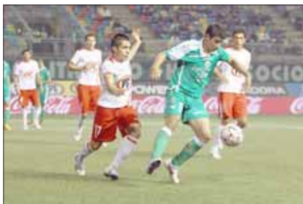
El viernes el Uní cortó la racha de triunfos de los itálicos. Ahora los albirrojos ya piensan en Cobreloa.