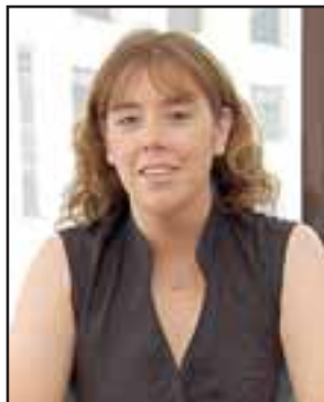
Loreto Seguel King Subsecretaria Ministerio Desarrollo Social

Esta transferencia será un complemento mensual al sueldo que recibe la mujer, y se calcula dependiendo del monto de su remuneración.