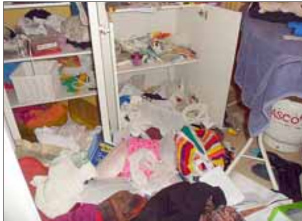
Las imágenes hablan por sí solas y muestran el estado en que quedó la vivienda afectada por este robo.

El avalúo preliminar de las especies robadas superaría los $800.000, sin embargo la familia aún se encontraba revisando e indagando ante la eventualidad de que otras especies pudiesen haber sido sustraídas, en lo que fue un robo aparentemente bien planificado, pues el o los sujetos ingresaron a la vivienda con la seguridad que no habían moradores, a pesar de que en la citada vivienda está resguardada por dos perros que al parecer no fueron inconvenientes para el actuar de los sujetos.