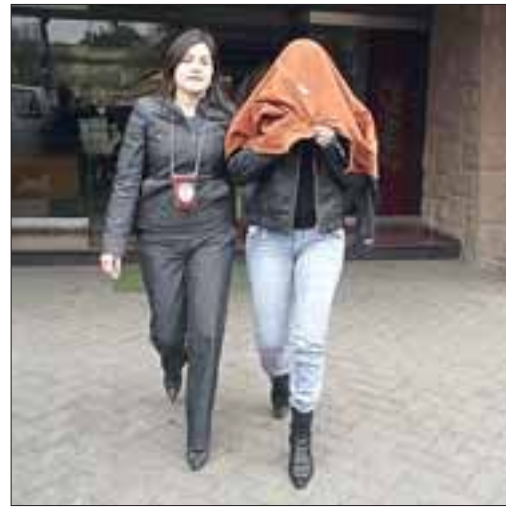
La joven madre es conducida por personal de la PDI hasta el Tribunal donde finalmente quedó en libertad con firma mensual.

No obstante, el domingo 29 de julio, la joven por remordimiento contó a su padre lo que había hecho y fue éste quien descubrió el cuerpo de la recién nacida dando