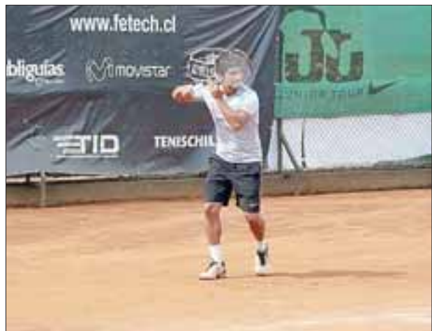
El aconcgüino quiere comenzar en Ecuador su recuperación tenística y física.