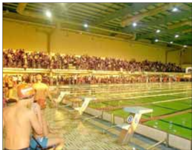
Las aposentaduras de la Piscina de la Escuela Naval lucieron repletas, lo que habla de la importancia y gravitación del certamen en que compitieron los sanfelipeños.

consigan sobresalir en cuanto competencia participan, independiente del