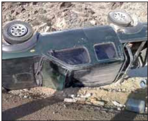
Esta es la camioneta de Seguridad Austral, así quedó el vehículo luego de derrapar en la Ruta C-455.

furgoneta. En Diario El Trabajo hacemos públicas nuestra felicitación a este sanfelipeño que, sin