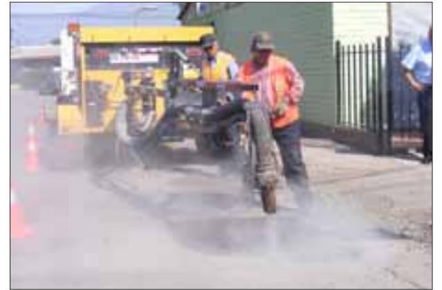
A partir de hoy la máquina bacheadora volverá a trabajar tapando los numerosos agujeros que existen en distintas calles de San Felipe.

“Ese proyecto esperamos que esté recomendado técnicamente de aquí a unos 10 ó 15 días más y postulando a ejecución a través de FNDR, hicimos un cambio de estrategia, nos permitieron algunos que eran necesarios que el Minvu en la parte técnica nos autorizara