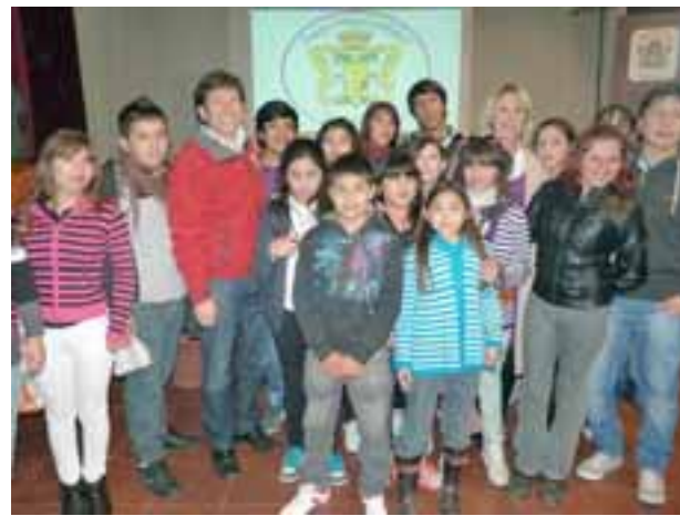
Ministro Golborne agradeció el trabajo y compromiso de la Senadora Lily Pérez con la gente de la Región Valparaíso Cordillera.

El Ministro Golborne, además hizo un reconocimiento público al trabajo de la Senadora Lily Pérez, por su compromiso con la gente de la Región Valparaíso Cordillera, expresando que: «Cuando llegué al ministerio tuve inmediatamente, inmediatamente, el llamado de una persona que es una trabajadora incansable por la comunidad y que muchas veces lle-