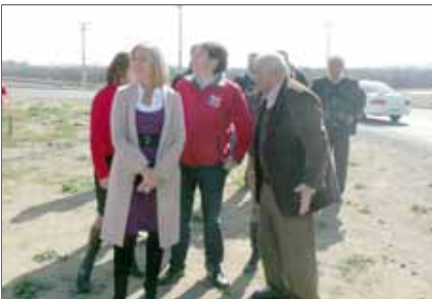
En visita realizada por el Secretario de Estado, se le pidió iluminar el puente sobre el Río Aconcagua y desarrollar proyecto para aumentar a cuatro pistas la calle Chercán Tapia.

«Esa es una situación donde todavía se dan vueltas los estamentos internos, porque poco se ha avanzado y esa es nuestra preocupación, porque nosotros estimamos que ese proyecto ingenieril, debe estar listo el 2012 para iniciar la ejecución el 2013», expresó el jefe comunal.