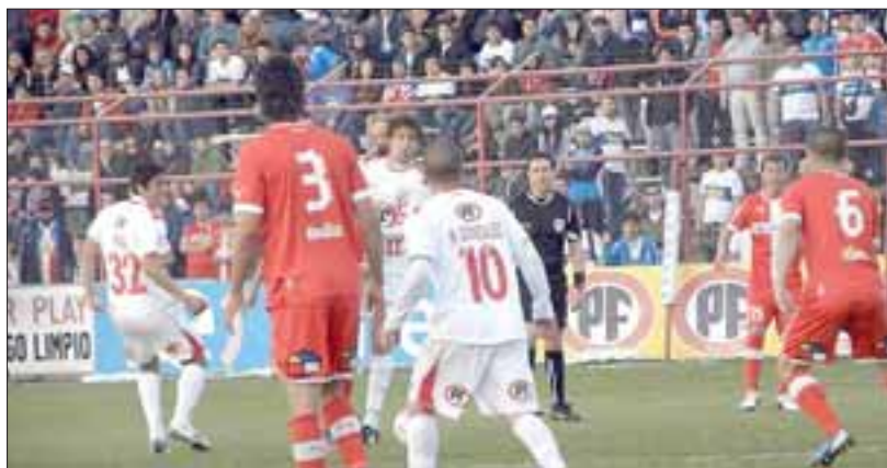
Unión San Felipe debutará como local en la Copa Chile, torneo que ganó el año 2009.

San Marcos - Iquique; Iberia - Universidad de Concepción; Puerto Montt - Unión Temuco; Lota Schwager - Deportes Concepción; Ñublense - Huachipato; Colchagua - Rangers; Magallanes - Unión Española; Santiago Wanderers - Santiago Morning; Coquimbo - La Serena; Cobresal - Trasandino; Unión San Felipe - Barnechea.