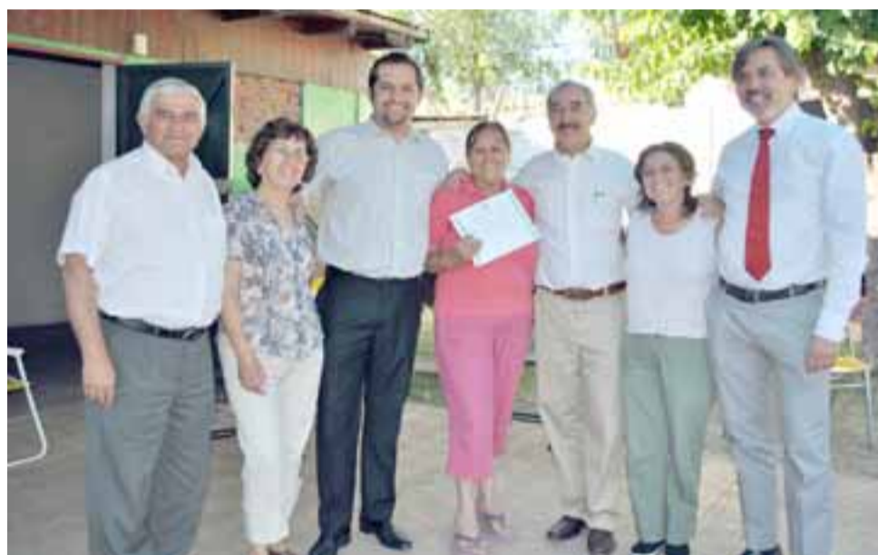
Las mujeres fueron certificadas por los cursos que realizaron durante el año y durante la fiesta con que finalizaron las actividades, recibieron sus diplomas.

Además el jefe comunal destacó la capacidad emprendedora de las mujeres que participan de estos talleres durante el año, tiempo durante el cual realizan una importante cantidad de trabajos manuales, por lo que se considerará la posibilidad de que ellas puedan vender esos productos a la comunidad.