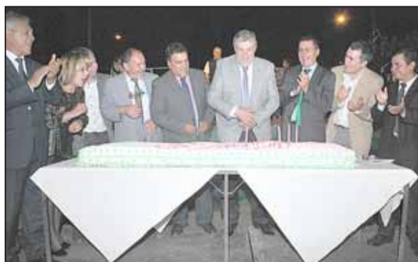
En el frontis del municipio se cantó el cumpleaños a la comuna, el Alcalde y los concejales soplaron las velas de la torta que se repartió a más de 2.500 personas que asistieron a la celebración.

Luego en el frontis del municipio se cantó el cumpleaños a la comuna, el Alcalde y los concejales soplaron las velas de la torta que se repartió a más de 2.500 personas que asistieron a la