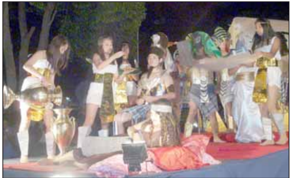
Esta es la carroza 'Egipto', ganaron el primer lugar y se fueron con 300.000 pesos como premio. Diario El Trabajo los felicita por su grandioso trabajo.