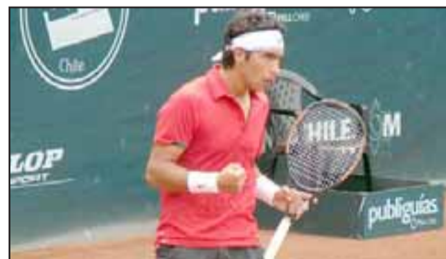
El sanfelipeño pudo avanzar más de 20 lugares tras su actuación en el Futuro de Osorno.