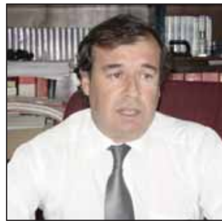
El Subprefecto Iván López señaló que la PDI mantiene las fiscalizaciones de manera reforzada para que la comunidad pueda disfrutar con tranquilidad de las fiestas de fin de año.

El Subprefecto López dijo que continuarán con los servicios reforzados hasta fin de año, con el objetivo de que la comunidad pueda celebrar con tranquilidad de estas fiestas.