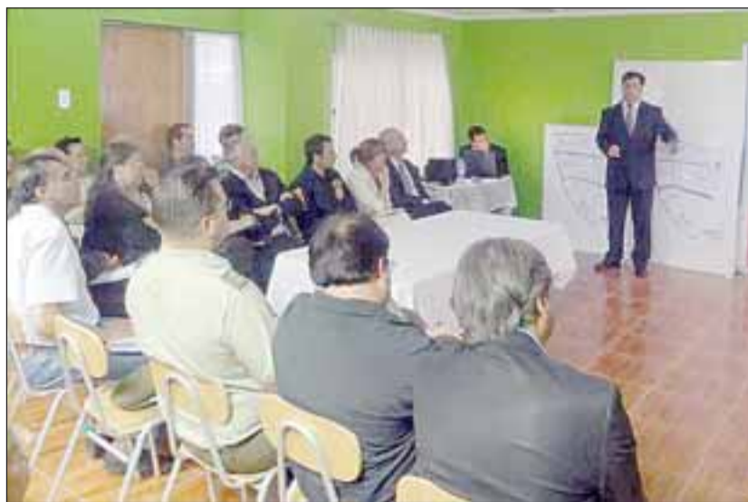
La mesa técnica barrial que se realizó la semana pasada contempló la revisión de los proyectos que se ejecutaron este año y se definió lo que se realizará el año 2013.

Esos son los 3 sectores donde se trabajará el año 2013 a lo que se suma el proyecto psico-social, que forman parte del programa Barrio en Paz Residencial.