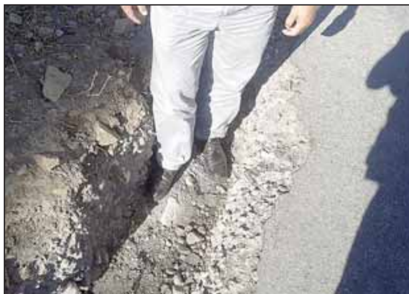
La profundidad de la zanja llega incluso hasta la altura de las rodillas de una persona en algunos lugares.