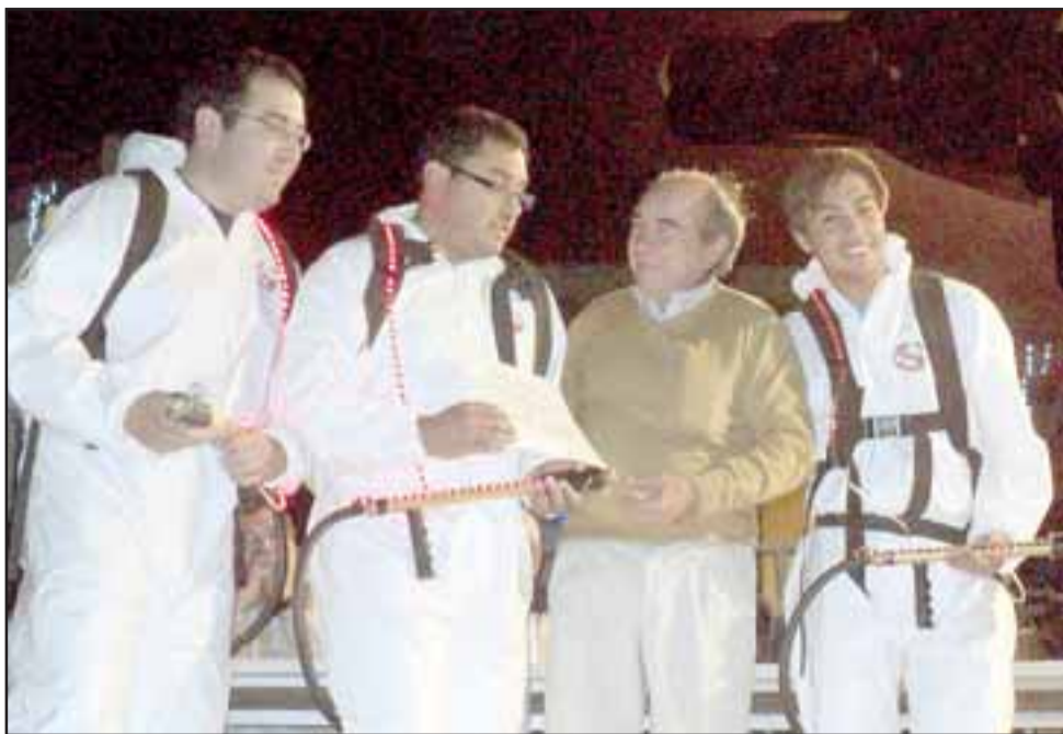
Los intrépidos Cazafantasmas llegaron con todo su arsenal anti-terror, para dar cuenta de toda aparición del 'Más allá'.

Roberto González Short rgonzalez@eltrabajo.cl