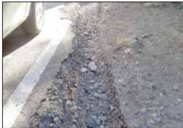
La zanja constituye un verdadero peligro al que las autoridades no le han tomado la atención necesaria.