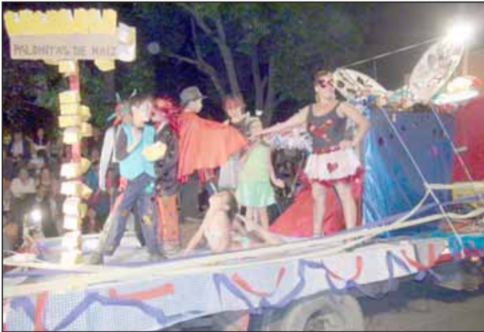
El Circo Familiar 'La Mariposa Encantada' de Las Cabras, sorprendió a los presentes, pues toda una familia hizo su mayor esfuerzo para animar al público presente.

acá, pues con sus potentes armas 'chupa-fantasmas', dieron cuenta de cuanto zombie andaba en la ciudad. Los aplausos fueron más que merecidos para quienes durante muchas semanas se las ingeniaron para elaborar cada una de las propuestas artísticas.