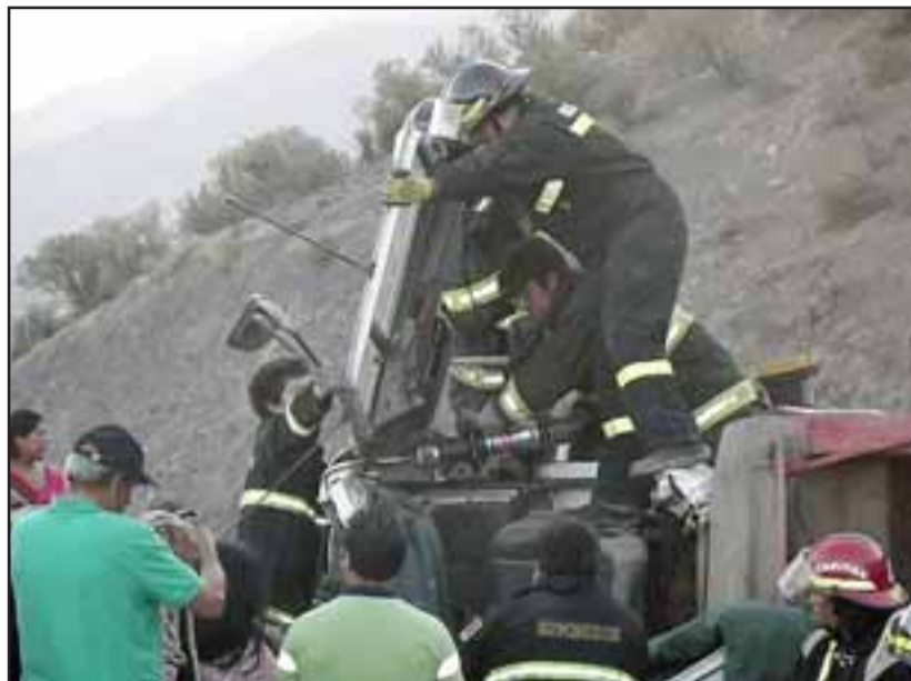
Bomberos trabajó por más de una hora para liberar al conductor, debiendo realizar varios cortes en una difícil maniobra que se dificultó por el estado y la posición en que quedó la cabina.

mión Mercedes Benz color blanco, placa patente ZB-66 19, bajaba la mencionada cuesta en dirección a Putaendo, cargado con material minero proveniente de la comuna de Cabildo, el que se dirigía a la fundición Chagres en la comuna de