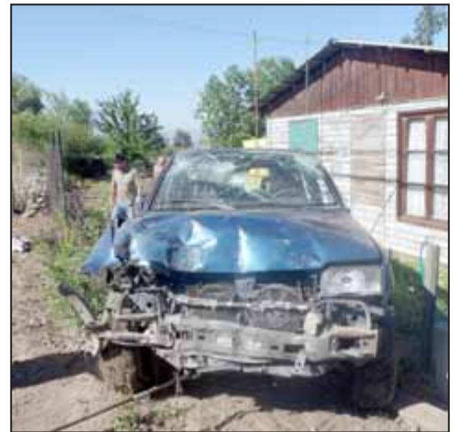
Por pocos metros, este accidente casi arrebató la vida a un niño de 12 años que dormía al interior de esta vivienda.