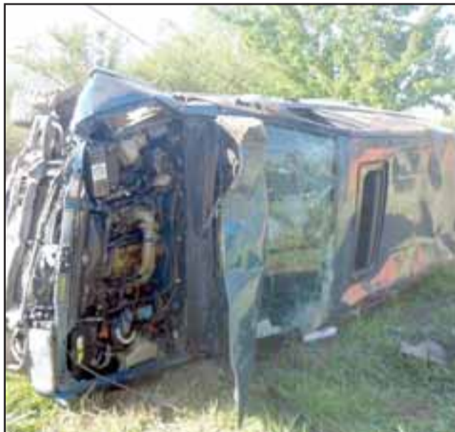
Así quedó la camioneta Nissan modelo Terrano, luego de que entrara 'disparada' en el patio de esta casita en el sector de Las Coimas.

ist , a la vanguardia en gestión preventiva