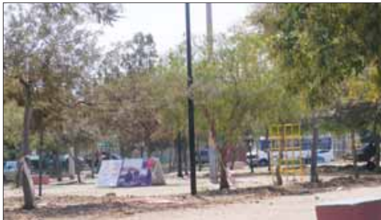
Hace dos semanas partió la instalación de catorce luminarias ornamentales, además del mejoramiento de diez cabezales de los focos que ya existen.

Estos trabajos forman parte de un gran proyecto que se está realizando en el bandejón central en ese sector, que contempla su recuperación a través de la instalación de áreas verdes, cruces peatonales, tres atravesos del bandejón y bancas con respaldo, con la idea de que la plazuela sea utilizada todo el año por los vecinos y se vuelvan a reunir en este lugar.