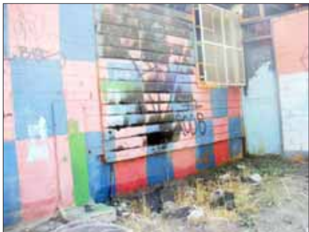
En esta pared habría comenzado el incendio, luego de que algunas personas hicieran fuego en la pared de madera.

Sin embargo, durante las noches el lugar es utilizado por jóvenes que fuman y toman bebidas alcohólicas, situación que preocupa a los vecinos, especialmente por los niños más pequeños que se ven obligados a presenciar la situación.