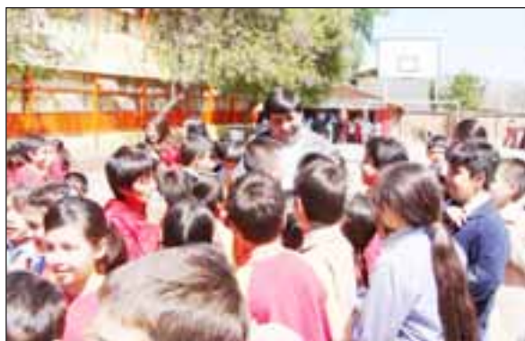
Con unos 37 millones de pesos, la Municipalidad de Los Andes pretende fortalecer las Becas que favorecen a alumnos de la Enseñanza Básica, Media y Superior

"En este mismo contexto, la Beca para Pasajes de Estudiantes Superiores se situó en dos millones de pesos", apuntó Díaz, recordando que esta beneficiará a diez jóvenes que viajen a Santiago y diez que lo hagan a Viña del Mar o Val-