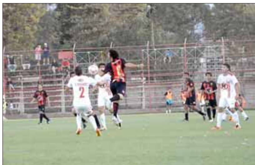
La escuadra aconcgüina aún no sabe de triunfos en el actual torneo.

U. La Calera-Palestino, 12:30 horas, Estadio 'Lucio Fariña' de Quillota (CDF). Cobresal-Colo Colo,