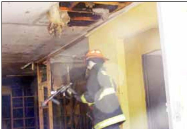
En este estado quedó la Sede Social que fue afectada por las llamas durante la mañana de este jueves.

El control del incendio demoró alrededor de 20