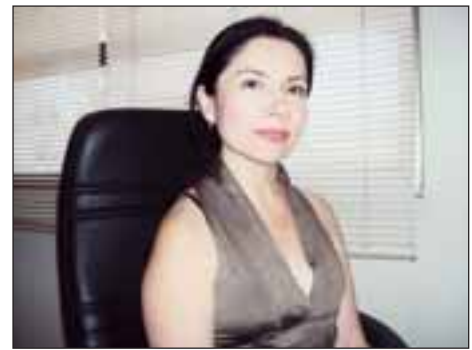
Yasmina Aspe, fiscal a cargo del caso.

Por su parte, la Fiscal a cargo del caso, Yasmina Aspe, explicó la formalización a la fueron sometidos los antisociales "Fueron formalizados por el delito de Robo en lugar habitado Tentado dado a que no alcanzan a sustraer alguna especie y quedaron con medidas cautelares de firma diaria