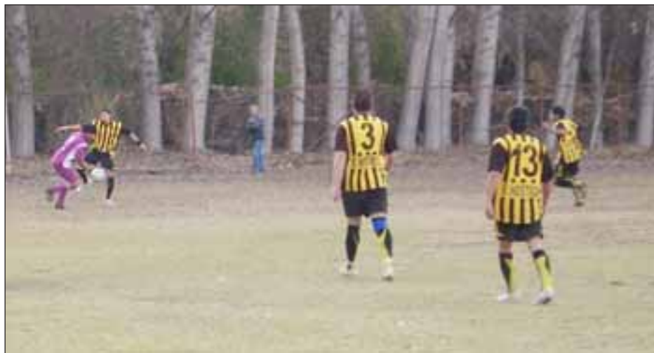
En el "Amor a la Camiseta" ya empiezan a aparecer los favoritos para quedarse con la Sexta Edición del Torneo Estival.