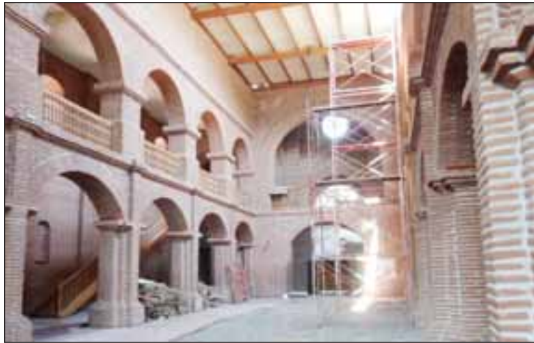
Con los $62.000.000 recibidos, le permitirán la Iglesia continuar y terminar las obras de reparación del templo dañado a raíz del último terremoto.