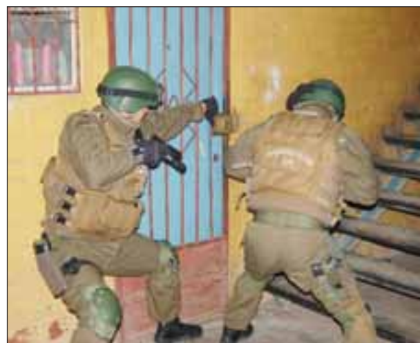
Carabineros tuvo que emplearse a fondo para poder contrarrestar las pedradas de la enardecida turba.