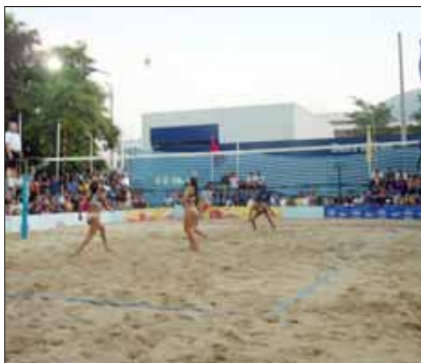
La idea del comité organizador de los certámenes es sacar el mayor partido posible a la cancha de arena que cada año se prepara para el Circuito Nacional de Voleibol Duplas.

Aprovechando la infraestructura que quedará tras la fecha nacional del Voleibol Arena que tendrá lugar en San Felipe durante este mes, el Departamento de Deportes de la Ilustre Municipalidad de la "Ciudad Fuerte y Feliz", se encuentra trabajando en dos torneos que prometen transformarse en todo un suceso en el Valle de Aconcagua.