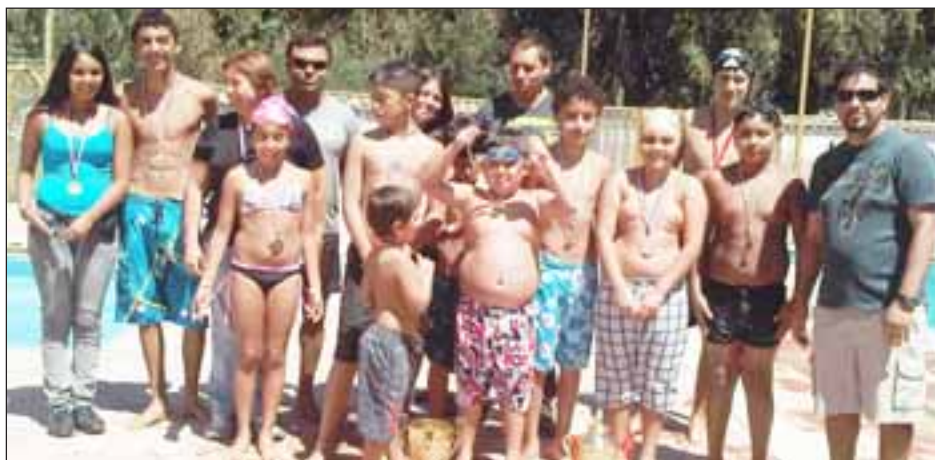
El evento deportivo espera reunir a deportistas de todas las edades. En la imagen, parte de los integrantes del Taller de Natación.