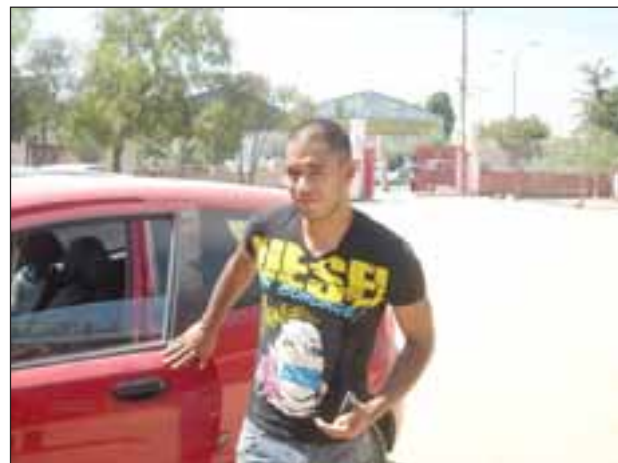
Tras dos temporadas, el Volante volverá a vestir la casaquilla albirroja.

“Uno siempre debe acomodarse a cualquier sistema de juego, lo importante es estar bien para