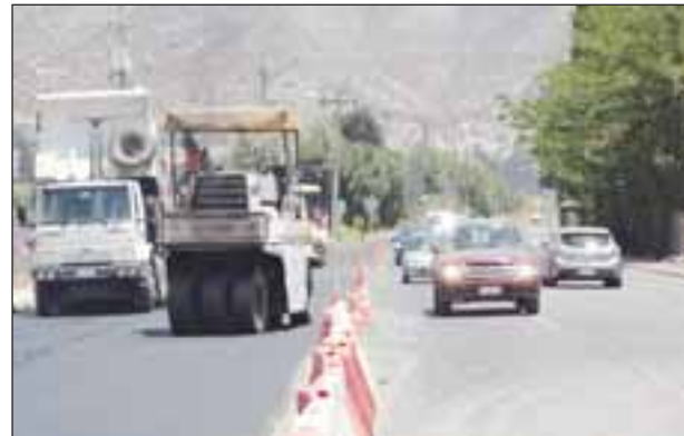
El alcalde señaló que el Estudio tienen un costo superior a los 160 millones de pesos y debería estar terminado en seis meses más.

Con este Estudio, el proyecto quedaría con la recomendación técnica del Ministerio y podría ingresar a la etapa de Estudio de Proyecto.