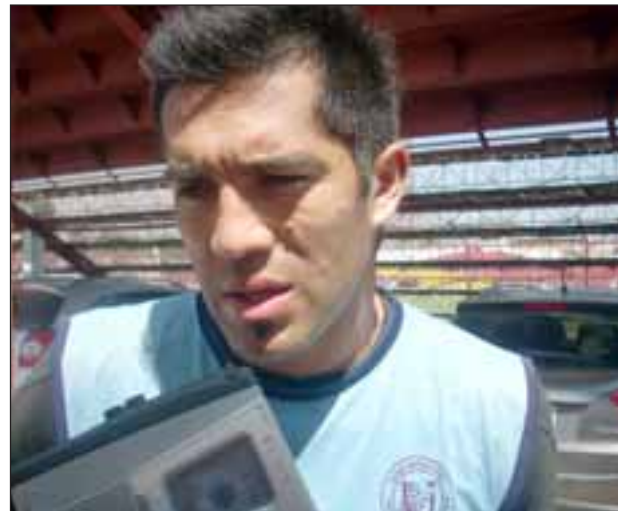
El Capitán de Unión San Felipe es uno de los jugadores más regulares del equipo y al mismo tiempo uno de los más respetados por la hinchada.

“Equipos como la UC, están acostumbrados a jugar con presión, lógicamente los resultados mandan siempre en el fútbol pero debemos estar preocupados de nuestro juego porque tenemos nuestra propuesta y esa debemos intentar hacerla prevalecer en San Carlos, aunque sa-