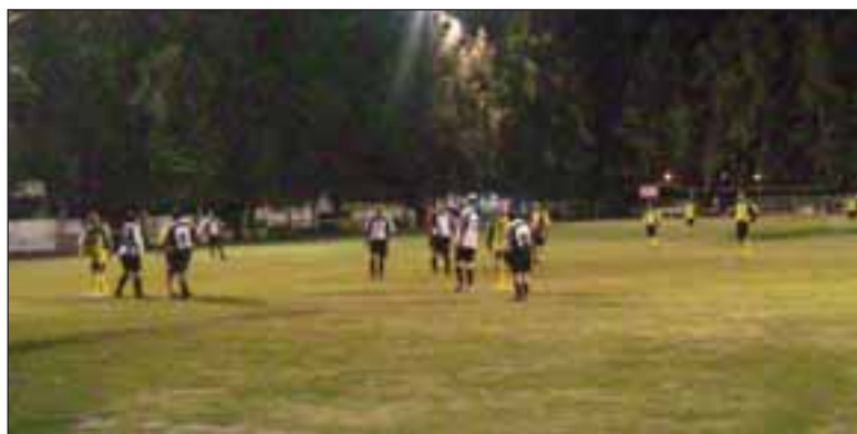
Dos partidos que pueden marcar el destino del torneo tendrá esta noche la serie sub-55 de la Liga Vecinal.