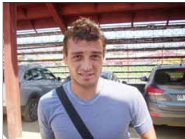
El ‘Punta de lanza’ con mucho trabajo, goles y gran sacrificio, se ganó su oportunidad en Unión San Felipe.

“Creo que la titularidad nadie la tiene segura, más aún cuando estás en un equipo donde hay muy buenos jugadores, siempre