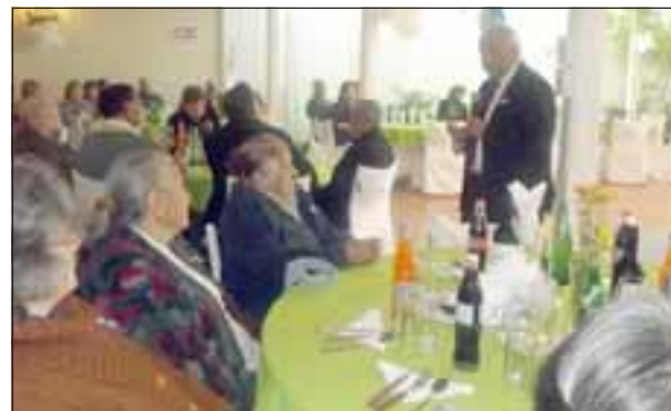
Con una ceremonia-almuerzo se dio por finalizado el trabajo con los 50 adultos mayores.

La formación de un club de adulto mayor por