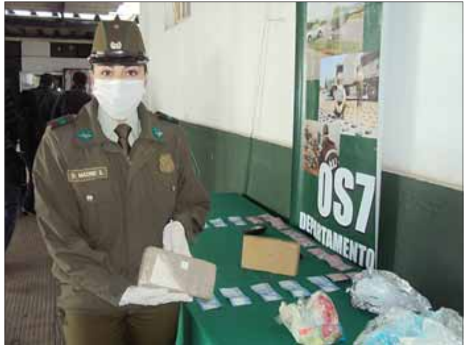
Personal de la OS7 de San Felipe incautó la droga que pretendía ser comercializada a los adictos de la provincia, avaluada en sumas millonarias.

El trabajo de inteligencia de los efectivos policiales comprobó que los sujetos portaban una bolsa de nylon con una caja de cartón que en su interior mantenían dos paquetes revestidos en cinta adhesiva que correspondían a un kilo y quince gramos de clorhidrato de cocaína, equivalente a 5.075 dosis las que generarían ganancias por más de 25 millones de pesos, y 925 gramos de marihuana prensada que equivalen a 1.850 dosis, las que generarían ganancias por más de dos millones de