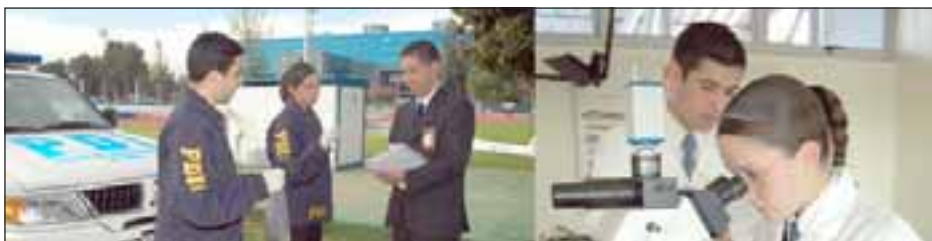
Una carrera de cinco años, con trabajo inmediato una vez egresado.

tiene al ingresar a las instituciones, una vez que ellos egresan de inmediato comienzan a trabajar, por lo tanto no tienen que andar buscando trabajo ni andar haciendo práctica, porque la práctica se hace durante el período de vacaciones en primero, segundo y tercer año, salen con trabajo remunerado y el primer sueldo lo reciben en enero de forma inmediata”, subrayó el oficial.