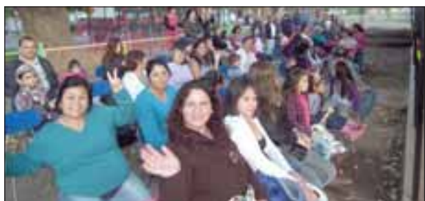
Los padres y apoderados no cabían de contentos en sus asientos.