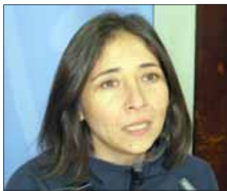
La directora provincial de Prodemu señaló que son 160 mujeres las que están participando, tanto en el programa Mejorando mi negocio como en los oficios.

En tanto los cursos de intermediación son dictados por profesionales de la fundación Prodemu, que son asistente social e ingeniero comercial, mientras que los oficios son contratados con Otec especializadas en cada una de las áreas.