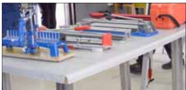
El proyecto contempló la habilitación de salas de clases con las herramientas necesarias para ambas especialidades.

La carrera de atención de párvulos será dictada por asistentes sociales, nutricionistas y educadoras de párvulo, mientras que en terminaciones en construcción los docentes son técnicos en construcción, y podrían sumarse ingenieros y arquitectos.