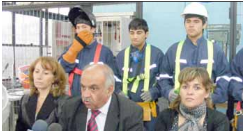
En conferencia de prensa en el Liceo, el Alcalde y la Directora del establecimiento explicaron lo que significa el cambio, especialmente para los alumnos

“Después de hacer un estudio al interior del establecimiento del mercado laboral que existía, porque no podíamos lanzarnos con una carrera en la cual no tuviese nichos laborales pertinentes, optamos por