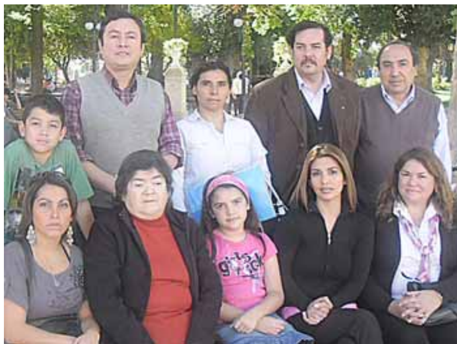
Parte de los afectados, quienes denunciaron sentirse estafados por la Egis.

Aseguraron que el Serviu también tiene mucha responsabilidad, ya que es el responsable de la inspección técnica de las