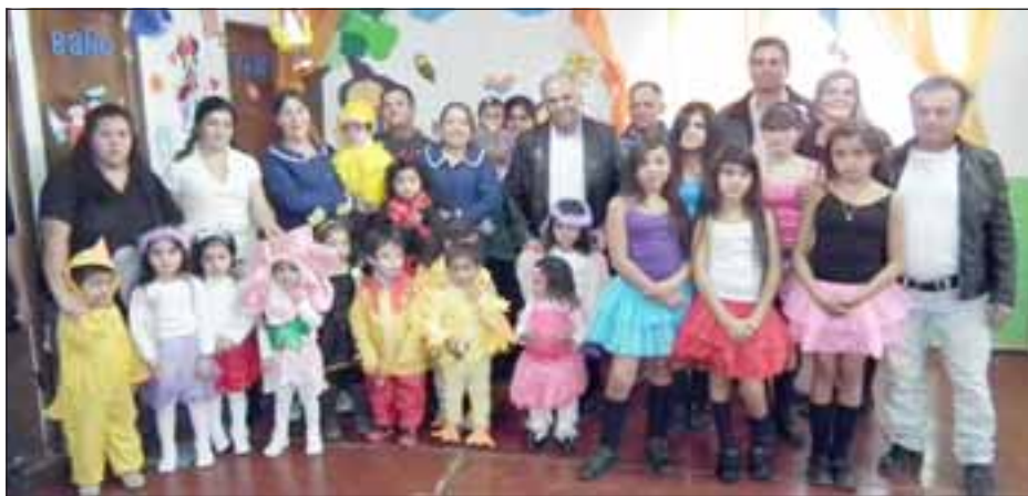
Esta es la nueva sala de atención para los 22 pequeñitos del jardín 'Nuestro Sueño' en La Troya, el valor de lo invertido es de dos millones aproximadamente, sin contar la mano de obra de los voluntarios involucrados.