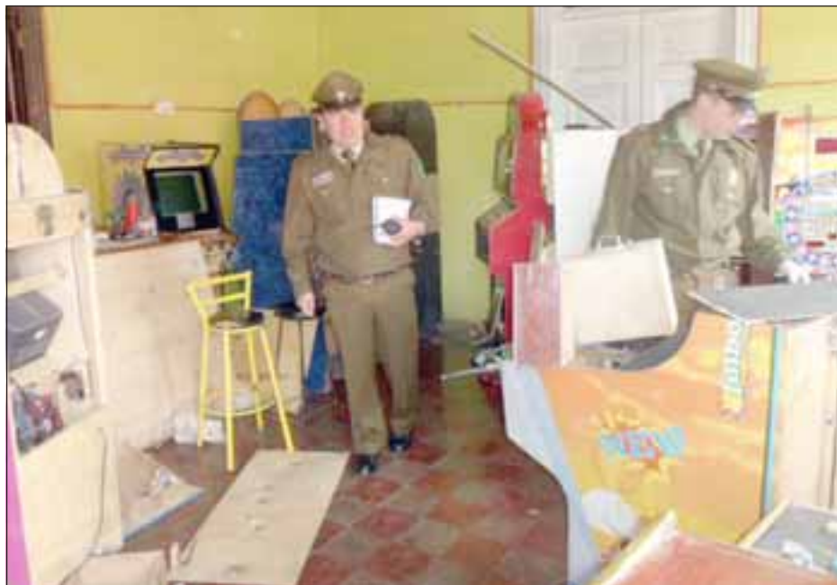
Personal de Carabineros en el sitio del suceso adoptó el procedimiento de rigor.

El monto del dinero sustraído superaría los dos millones de pesos, a lo que sumarían los daños a las máquinas que en total darían alrededor de tres millones doscientos mil pesos, según informaron los propietarios. Por otra parte Carabineros de Putaendo maneja otras cifras que serán materia de investigación.