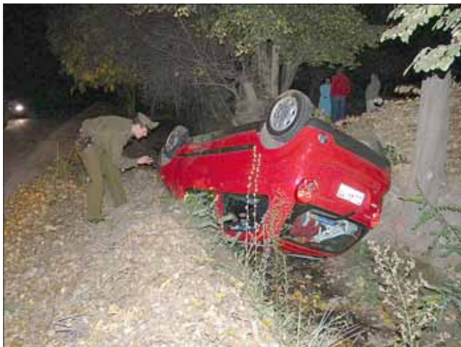
Los ocupantes se dieron a la fuga, lo que hace presumir que el conductor pudo haber estado bajo los efectos del alcohol.

De todas maneras, el lugar del accidente es bastante oscuro, donde sólo existen parcelas de agrado.