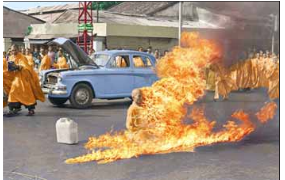
El primer monje Bonzo en quitarse la vida quemándose vivo, Thich Quang Duc, en 1963, en una fotografía que ganó el premio Pulitzer.

La expresión tiene su origen en la ola de suicidios de monjes budistas, por su nombre en francés bonze durante la ocupación de Indochina, en protesta contra el régimen vietnamita. Concretamente con el de Thich Quang Duc, monje budista vietnamita que se suicidó quemándose vivo en una zona muy concurrida de Saigón