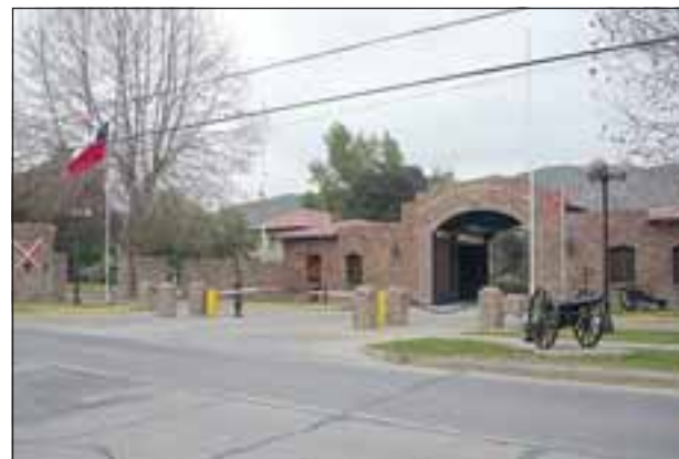
Por razones que se desconocen, el funcionario de Ejército habría acabado con su vida al interior de la unidad militar.

«El Regimiento expresa sus más sentidas condolencias y especial sentimientos de pesar a sus familiares, y a su vez se encuentra brindando el apoyo correspondiente ante tan dolorosa pérdida», concluye el comunicado.