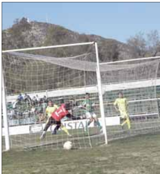
Por ahora los andinos aún miran desde lejos a los líderes del grupo sur de la Tercera División A.

Un triunfo cómodo por 4 a 1, que le permite seguir manteniendo muy vivo el sueño de lograr el ascenso al profesionalismo, consiguió Trasandino la tarde del domingo en el estadio Regional de Los Andes, en el cual doblegó a un discreto Deportes Rengo.