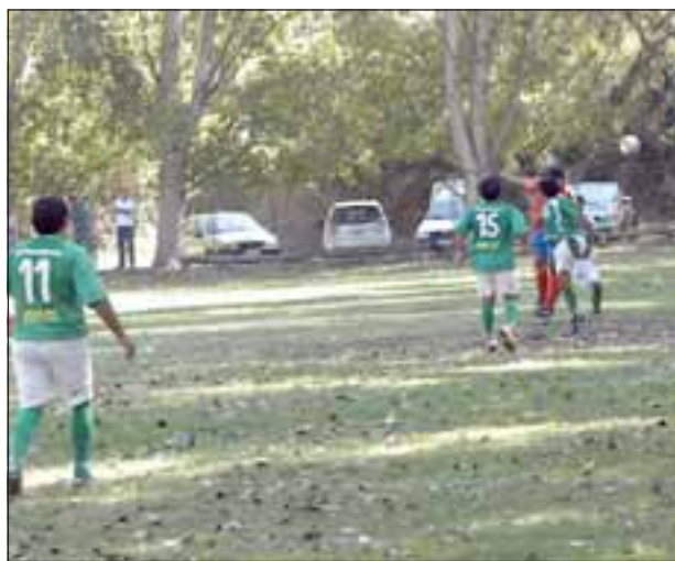
El torneo de Afava es considerado por muchos como el más importante del balompié aficionado del valle de Aconcagua.

Almendral Alto 2. Viejos Tercios: 28 de Marzo 3 – Almendral Alto 4. 1ª Serie 28 de Marzo 2 – Almendral Alto 1.