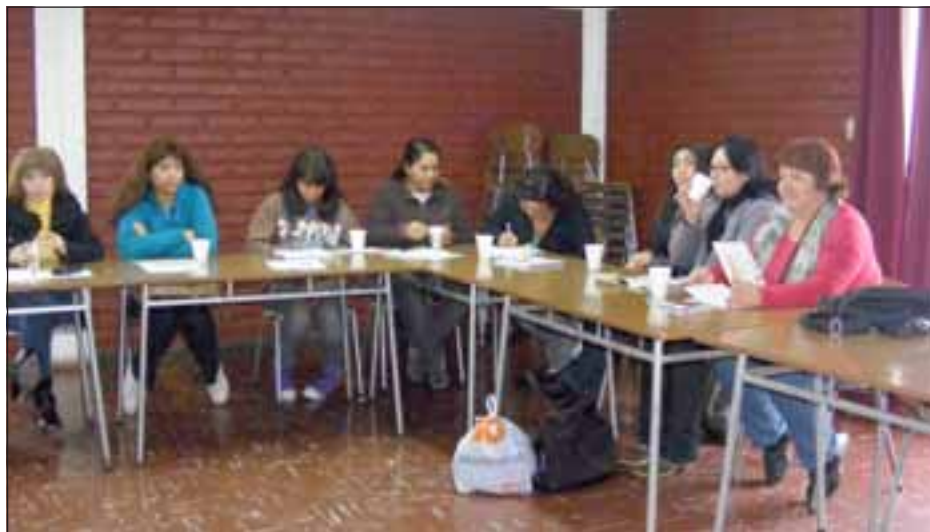
El programa Mejorando mi negocio se dicta en dos horarios, donde las mujeres adquieren distintas competencias para hacer funcionar de mejor manera sus emprendimientos.

"Tenemos una gama bastante amplia de negocios, tenemos mujeres que hacen dulces, chocolates, que venden fósforos, hay negocios súper distintos y entretenidos, mujeres que