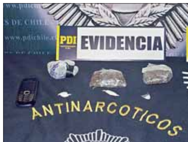
Un celular y abundante droga alojaba la mujer en su cavidad vaginal.

rio de la droga, el oficial sostuvo que es materia de investigación, «pero se están haciendo todos los análisis para lograr identificar a esta persona, ya que habría cierta coordinación con la imputada».