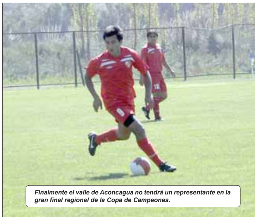
Finalmente el valle de Aconcagua no tendrá un representante en la gran final regional de la Copa de Campeones.

timonel de los hombres de negro señaló a Diario El Trabajo que los partidos se desarrollaron en completa normalidad, aunque claro, con la lógica tensión que siempre existe cuando está en juego un título, más aún si es de la importancia de Afava.