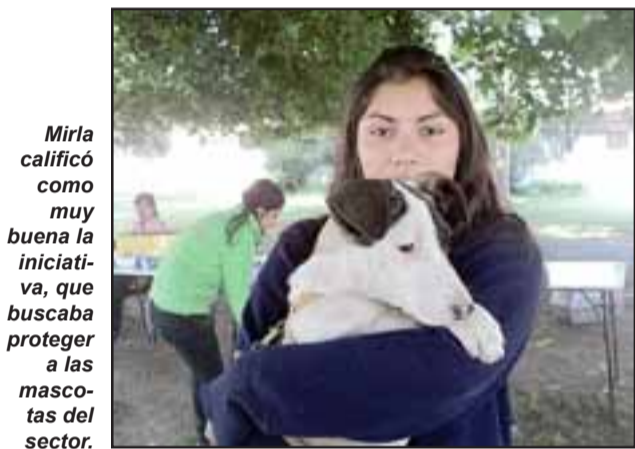
Mirla calificó como muy buena la iniciativa, que buscaba proteger a las mascotas del sector.