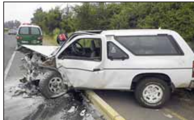
El estado en que quedó la Nissan Terrano da cuenta de la violencia del impacto frontal con el Chevrolet Aveo, el que dejó cinco heridos, entre ellos dos menores y una mujer embarazada.

Personal de Carabineros del Retén Curimón adoptó el procedimiento de rigor a fin de establecer las responsabilidades de ambos conductores y cual habría traspasado el eje central de la calzada.