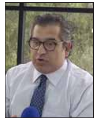
El actual alcalde Eugenio Cornejo señaló que no se referirá al tema hasta después del 6 de diciembre, cuando entregue el cargo.

AVISO: Por extravío queda nulo cheque N° 3470, Cuenta Corriente N°69049815 del Banco BCI, sucursal San Felipe.