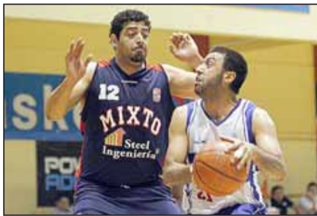
Ante la Universidad de Concepción Liceo Mixto buscará mantener su supremacía y retener el cetro de la Dimayor

La llave final que comienza mañana en el Juan Muñoz Herrera de Los Andes, será al mejor de cinco partidos, y es la segunda del año que animan universitarios y liceanos acon-