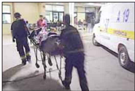
Momento en que el anciano ingresa al servicio de urgencia, gravemente herido.

Afortunadamente el golpe lo lanzó hacia un costado y no hacia la línea, de lo contrario habría muerto horriblemente mutilado.