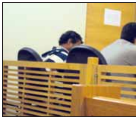
El imputado fue formalizado por los delitos de abuso sexual y violación en carácter de reiterado, quedando en prisión preventiva dentro de 90 días para la investigación del caso.

Tras su detención y posterior formalización en el Juzgado de Garantía de San Felipe, la Fiscalía cree que existiría un