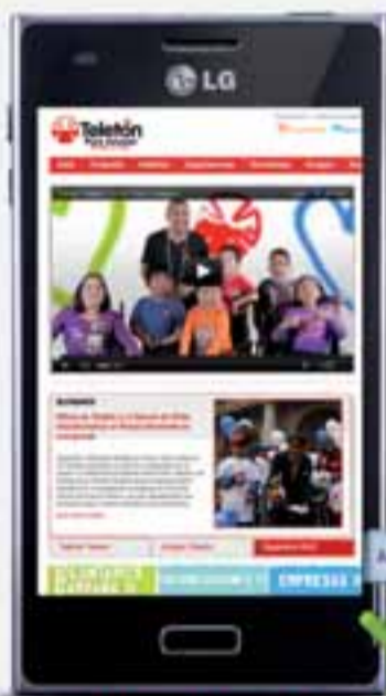
LG E612 Optimus L5