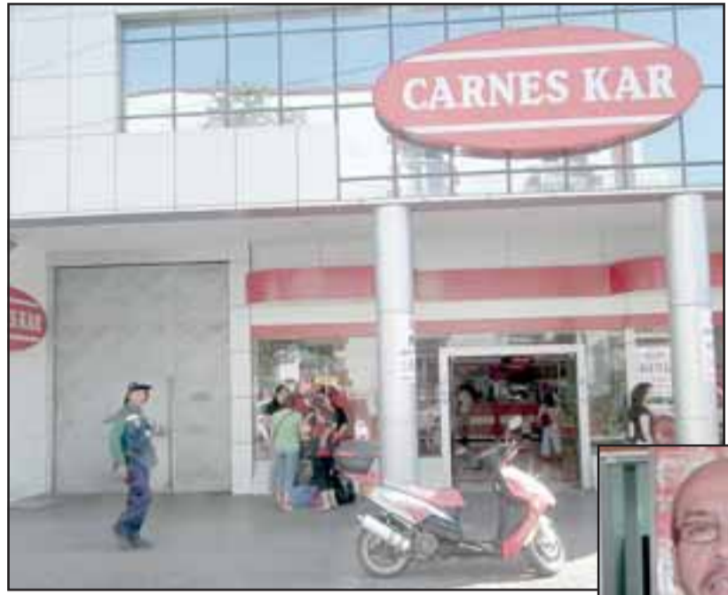
Empresas como Carnes KAR, en pleno centro sanfelipeño, se verán afectadas durante la mañana y tarde de este sábado.