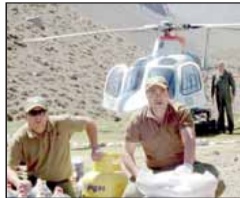
Diario El Trabajo registró la llegada de los suministros y personal de Carabineros en la Avanzada Los Ciénagos, al interior de la cordillera de Los Patos.

Como todos los años y desde el mes de noviembre hasta el mes de abril del año entrante, Carabineros envía patrullas que durarán 30 días en cada