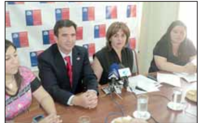
Las autoridades hicieron un llamado a la comunidad a participar hoy en la actividad, que busca que se tome conciencia de la violencia contra la mujer.

Aunque este centro ha recibido una importante cantidad de casos de violencia contra la mujer, lamentablemente se da la situación de abandonar la denuncia o de volver con el agresor, porque existe una tendencia de parte de las mujeres de normalizar la conducta de violencia al interior de las familias,