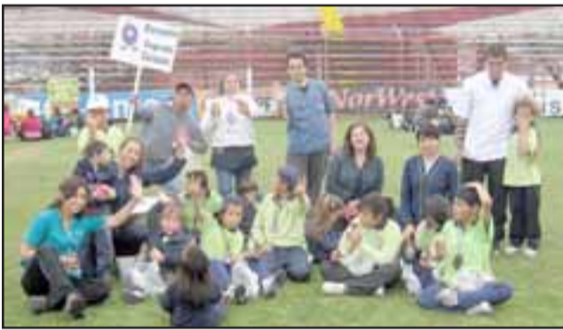
Las 'Tías' y 'peques' de la Escuela Sagrado Corazón saludan a los lectores de Diario El Trabajo.

Más de 720 niños de educación pre escolar de jardines infantiles y establecimientos municipales, participaron en el Encuentro de Motricidad realizado en el Estadio Municipal de San Felipe.