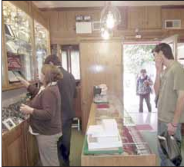
La Joyería Los Portales y otros negocios sanfelipeños, tendrían que cerrar sus puertas si la empresa Chilquinta no re-agenda estos trabajos para otro horario.

Roberto González Short rgonzalez@eltrabajo.cl