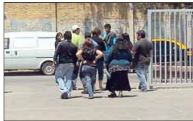
Los imputados junto a sus familiares se retiraron del Tribunal dada la suspensión de la audiencia que se reanudará en horas de la mañana de hoy, donde podrían ser absueltos o condenados.

ñón, declaró a Diario El Trabajo que esta situación causó la dilatación del juicio que debía finalizar el día de ayer, quedando de manifiesto la falta de preparación que tuvo la Defensa a la hora de presentar sus pericias: "Al parecer en la mañana (ayer) hubo una comunicación interna del Servicio Médico Legal entre el Tribunal y el Defensor, quien desistió de esta orden de arresto, lo que informó el Tribunal es que no dejaron entrar a Carabineros lo que obviamente provocó un tumulto en dicho servicio y ante ello el Defensor se desistió a la orden de detención y solicitó al Tribunal la suspensión de la presente audiencia de juicio oral hasta mañana (hoy), donde el perito se comprometió ante el Defensor a concurrir a prestar la declaración sobre su peritaje. Esto trae como consecuencia la dilatación de este juicio sino también deja en claro la falta de preparación que tuvo la Defensa, la falta de preparación del juicio oral", planteó el