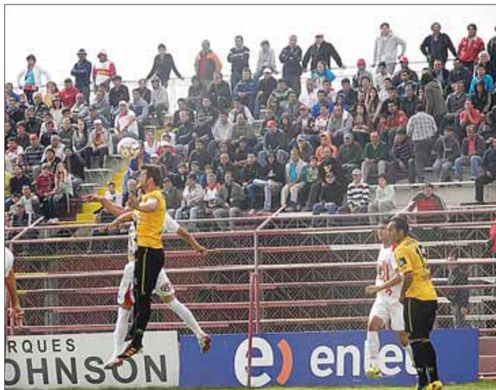
El horario no fue impedimento para que una buena cantidad de público llegara a presenciar el importante duelo al reducto de Avenida Maipú.