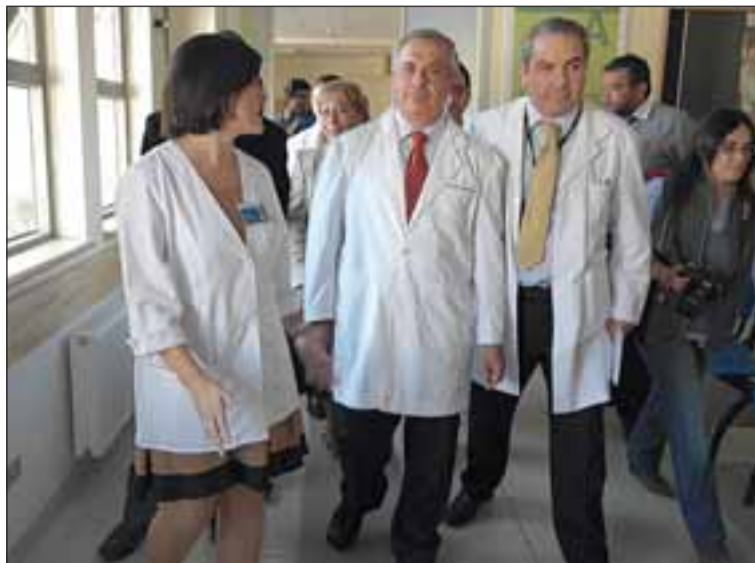
Tras la inauguración, el Ministro de Salud, Jaime Mañalich, efectuó un recorrido por las dependencias del nuevo Cesfam.

El Secretario de Estado dijo que están trabajando para implementar adecuadamente la UCI pediátrica en el Hospital San Camilo.