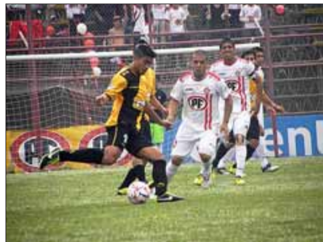
Unión San Felipe tuvo muchas dificultades para pasar la poblada zona defensiva de los del norte chico.