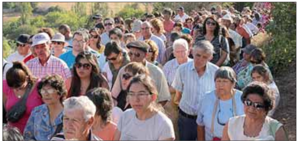
Más de 500 fieles católicos asistieron con fervor a los pies del Cristo de Madera, lugar en donde se realizó la Misa en su honor.