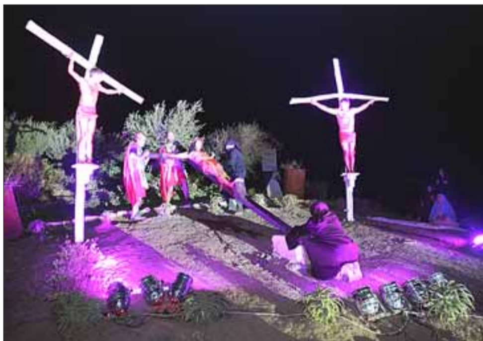
El momento más representativo de esta jornada religiosa, fue cuando fue elevado en cruz al Cristo hebreo entre los dos ladrones.