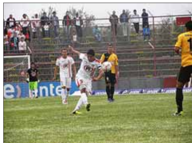
La derrota sufrida ayer ante Coquimbo, impidió que el Uní tomara posesión del liderato del Grupo Norte. Ahora quedó relegado a la tercera posición.