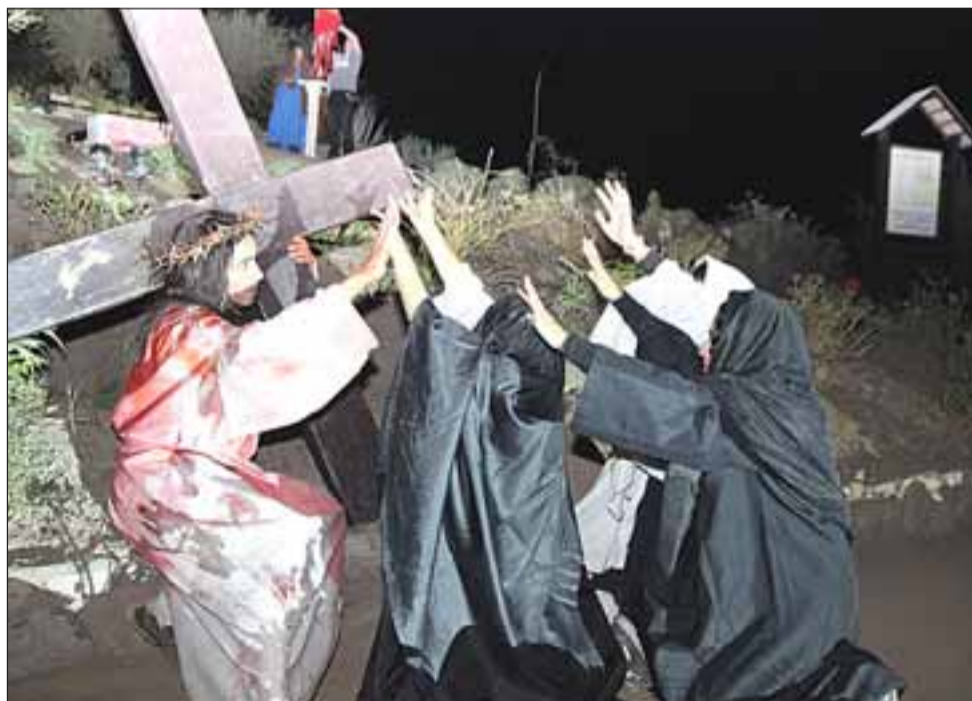
Estas mujeres lloran a los pies de Jesús, camino al Monte Calavera, sitio citado por la Biblia en varios pasajes que señalan el lugar donde eran llevados los condenados a muerte en la época de Cristo.