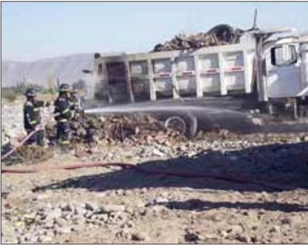
Un amago de incendio afectó a un camión tolva que descargaba escombros en el sector de El Trapiche la tarde del Jueves Santo.