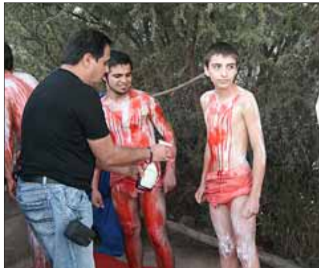
Desde temprano los actores comenzaron con la labor de maquillaje y caracterización de sus respectivos personajes.