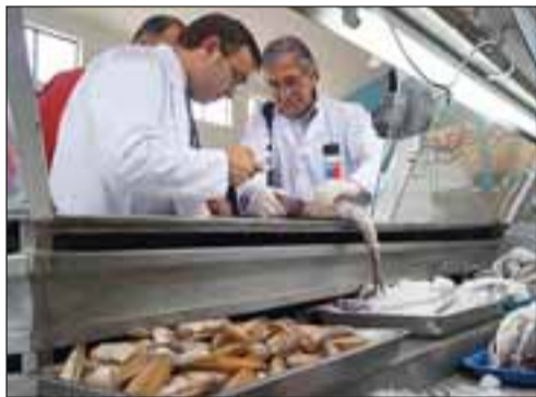
Un incremento en las fiscalizaciones de locales de venta de pescados y mariscos, realizó la Seremi de Salud durante Semana Santa.

Es por ello que se aumentaron las fiscalizaciones en Semana Santa, pero no solamente en puntos de venta sino también en restaurantes. Precisó que hasta el momento se han realizado cerca de 300 fiscalizaciones en toda la región y se han decomisado más de cuatro toneladas de productos en mal estado, además de cursar trece sumarios sanitarios. La autoridad de salud recomendó a la población adquirir los productos sólo en locales establecidos y que mantengan la cadena de frío de pescados y mariscos. Asimismo, llamó a denunciar la venta clandestina de productos del mar que en esta fecha se incrementa, sobre todo en barrios y poblaciones.