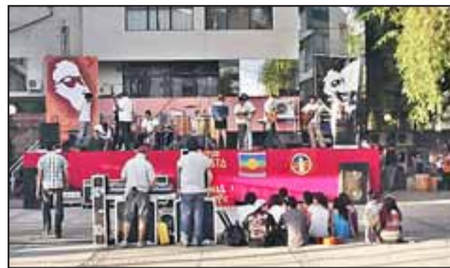
El festival permitió disfrutar de la música de distintos grupos de la zona a lo que se sumó la entrega de ropa y alimentos no perecibles, para ir en ayuda de los damnificados del incendio en Valparaíso.

Durante la jornada se recibieron alimentos no pe-