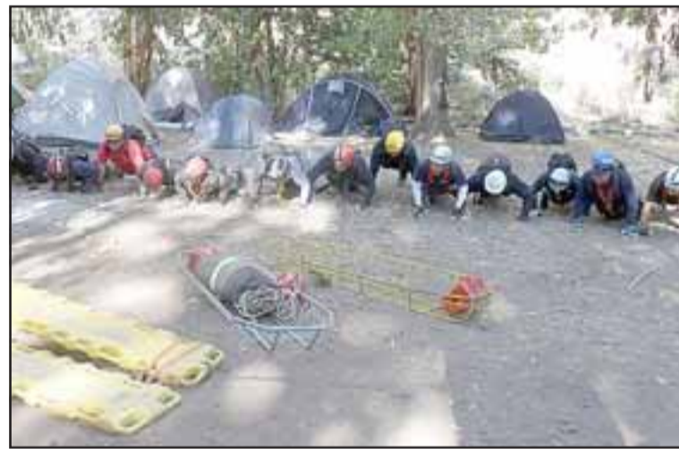
Cuatro Bomberos de Cabildo, 4 de Putaendo y 28 de las distintas Compañías del Cuerpo de Bomberos de San Felipe, fueron intensamente capacitados durante el fin de semana al interior de Los Patos por instructores del alto nivel