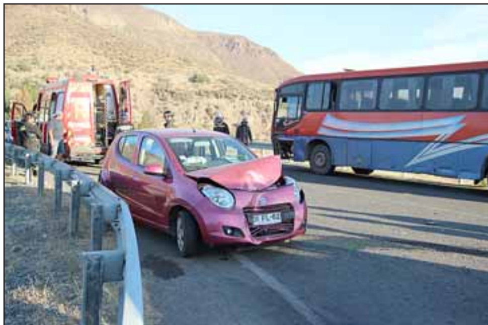
El impacto se produjo cuando el vehículo menor se encontraba detenido en el disco Pare para ingresar a la carretera y el bus viraba para ingresar al puente.

Bomberos y Carabineros llegaron al lugar, donde éstos últimos tomaron los antecedentes del caso para ser puestos a disposición del tribunal correspondiente