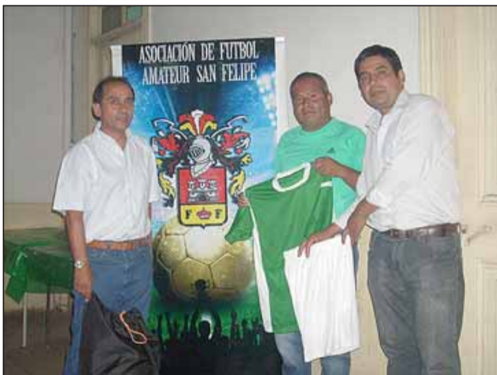
El club Ulises Vera, recibió como premio una implementación completa por haber ganado el campeonato general en la categoría adulto.