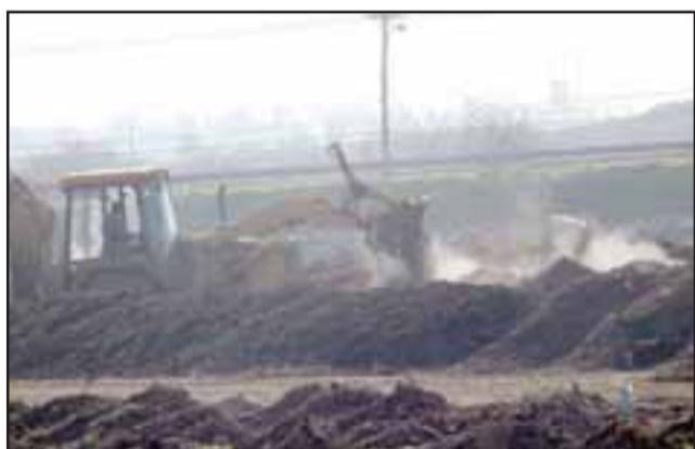
El guano de pavo genera insoportables olores cuando no es tratado adecuadamente.

La situación podría generar la realización de un sumario sanitario, a lo que se podrían sumar infracciones.