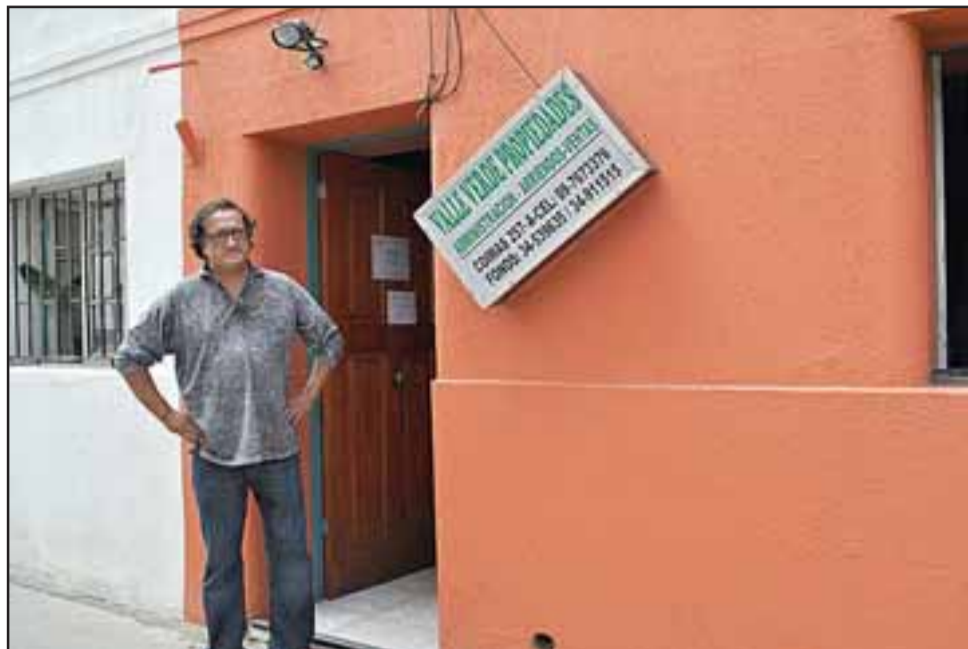
La administración del local estimó en más de un millón y medio de pesos las pérdidas producto del robo y dicen sentir miedo de que vuelvan a ingresar a las oficinas.

La oficina no contaba con cámara de vigilancia y según la encargada de la corredora además, el pasaje donde se encuentran es bastante oscuro en las noches, por lo que piden mayor protección de Carabineros, ya que tienen miedo