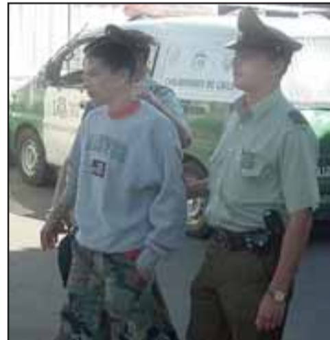
El imputado deberá pagar su delito con 41 días de cárcel tras ser condenado por el Juzgado de Garantía de San Felipe.