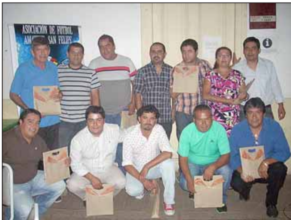
Delegados de todos los clubes, que forman parte de la Asociación de Fútbol, asistieron a la ceremonia de clausura de la temporada 2012.