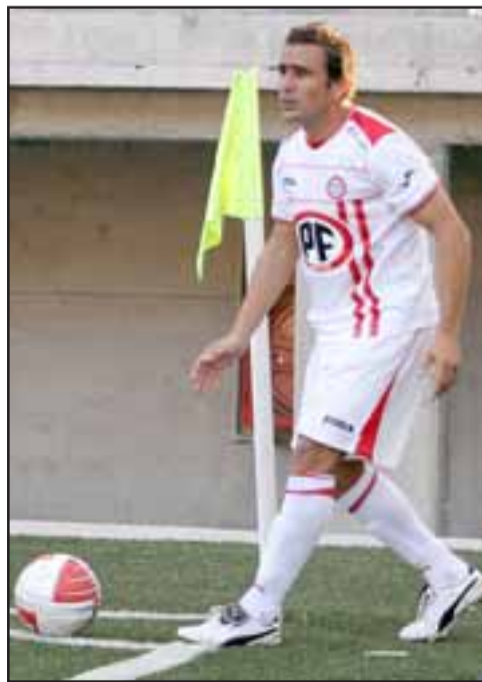
El artillero tras su paso por el fútbol colombiano, nuevamente volverá a vestir la camiseta albirroja.