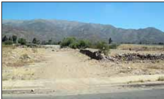
El municipio ve con muy buenos ojos los terrenos ubicados en Avenida Alejandrina Carvajal, a un costado del puente Putaendo, pues son terrenos municipales.

recibles y ropa en buen estado, artículos que fueron trasladados hasta Valparaíso para ir en apoyo de las cientos de personas afectadas.