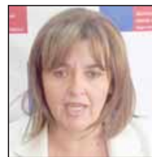
Este es un esfuerzo del gobierno que busca mejorar la calidad de vida de las personas, a través de más y mejores obras de pavimentación, señaló la Gobernadora Boffa.

En tanto, el Seremi de la Vivienda indicó que fueron 30 de las 38 comunas de la región, las que postularon al nuevo llamado del programa y todas resultaron con sus proyectos seleccionados.