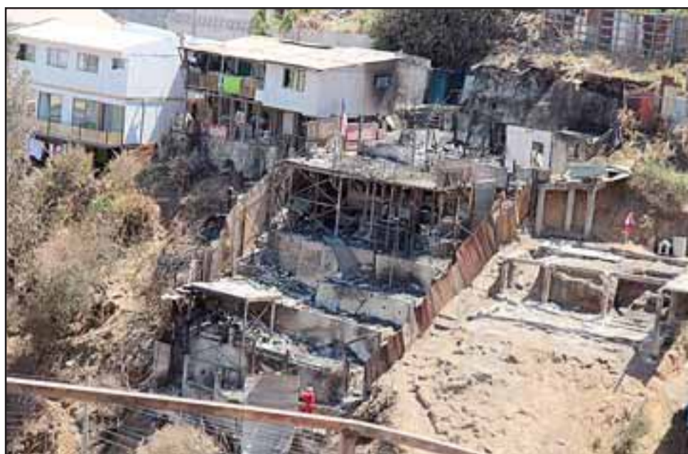
La campaña «Putando ayuda a Valparaíso» se centrará definitivamente en ayudar a las más de 80 familias que conforman la Población Alessandri del Cerro Los Placeres, que literalmente desapareció por efecto del voraz incendio registrado la semana pasada.

Los dirigentes de la junta de vecinos del sector realizaron un completo catastro de todas las familias afectadas, indicando que en