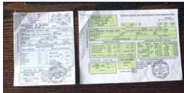
En esta época del año resulta común que personas ofrezcan la obtención de estos certificados de manera fraudulenta, así como también los permisos de circulación.