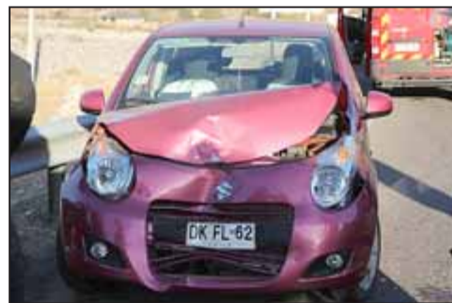
El vehículo Suzuki resultó con serios daños, mientras la conductora que era acompañada por tres de sus hijas, entre ellas una menor de tres años de edad, resultaron con lesiones leves.