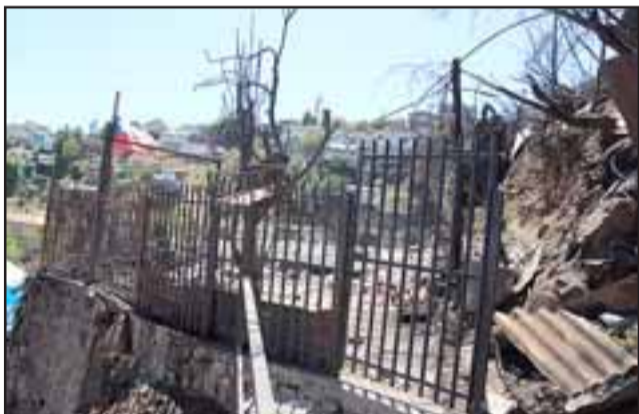
Lo que alguna vez fue la Población Alessandri, en una quebrada con estrechas escaleras y una angosta calle, donde el escenario parecía más bien sacado de una película de guerra, pues se asemejaba a un bombardeo con casas totalmente destruidas, donde solo se mantenían en pie algunos pilares y lo que quedó de rejas y baldosas.

En imágenes verá a continuación la dramática situación de los habitantes de la Población Alessandri del Cerro Los Placeres de Valparaíso.