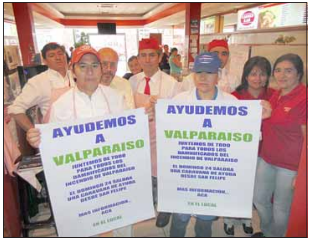
Los empleados de Carnes KAR vienen coleccionando toda donación, a fin de que este domingo 24 de febrero, a las 15:30 horas, un camión o los que se llenen, salgan en dirección a Valparaíso.

- «Luego de que nos enteramos de este infierno vivido por tantas familias; luego de entender que una tragedia de estas nos puede