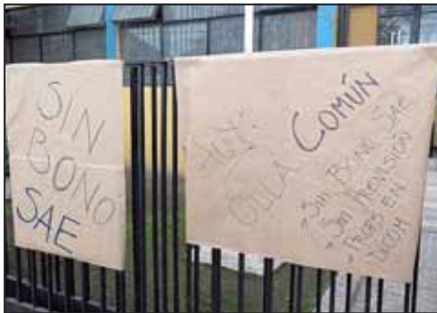
Mediante papelógrafos los docentes hacían saber su descontento.