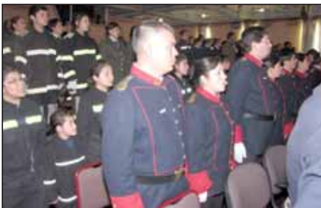
Bomberos jóvenes participantes en la ceremonia.