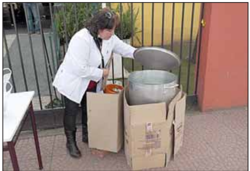
La olla común fue preparada en las afueras del establecimiento, medida con la cual profesores del Liceo Max Salas expresaron su molestia.