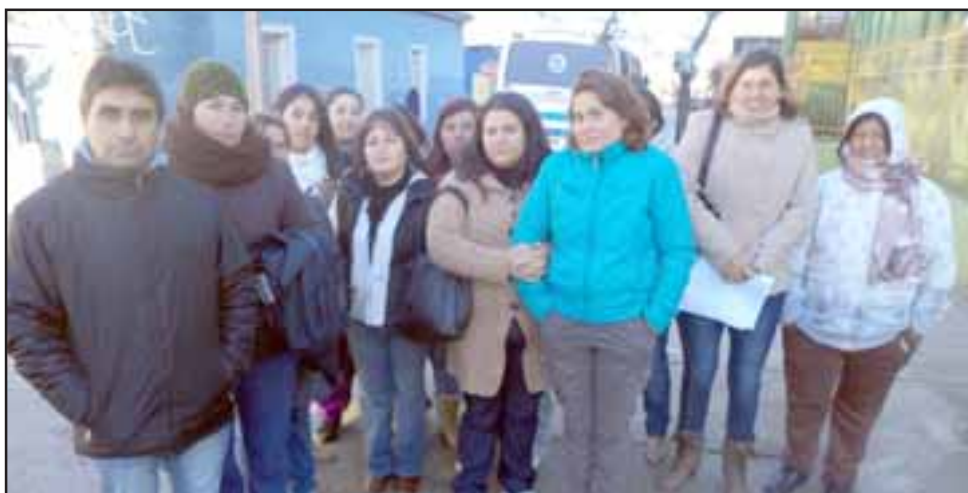
El grupo de apoderados ayer en la mañana frente a la Escuela José de San Martín.

Comenta otra situación de una menor, de Tierras Blancas, que sería amarrada en el terminal para quitarle la mochila, llegando a su casa a eso de las 19:30 a 20:30 horas, en circunstan-