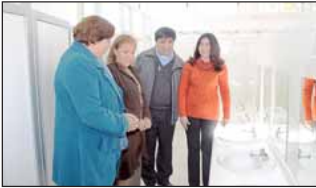
Los trabajos consistieron en la construcción de bebederos, además de la remodelación completa de la infraestructura, artefactos, revestimientos e instalaciones del pabellón de baños y duchas.