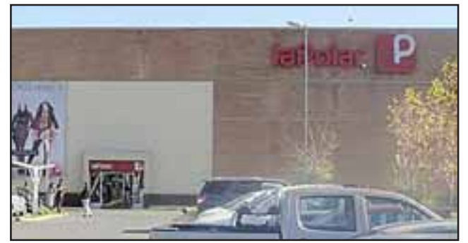
Los clientes de La Polar pueden revisar el sitio http://www.lapolar.cl/internet/buscaclientes e ingresar su RUT para saber si tienen devolución o no.

- Reducción de un 30% sobre la tasa de interés preferencial ya aplicada a la deuda, originada en operaciones hasta el 31 de julio de 2011.