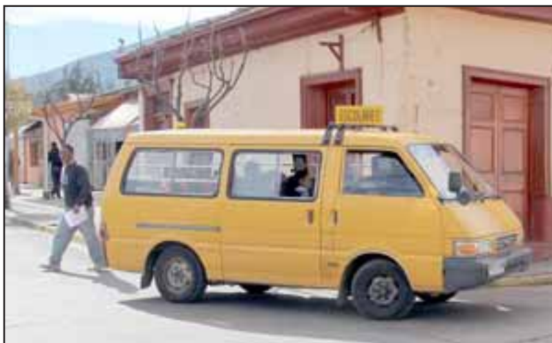
Un menor de edad del Jardín Infantil del Pakarín, del sector El Tártaro, resultó lesionado luego que el furgón escolar que lo transportaba colisionara con un vehículo menor la tarde del lunes recién pasado.