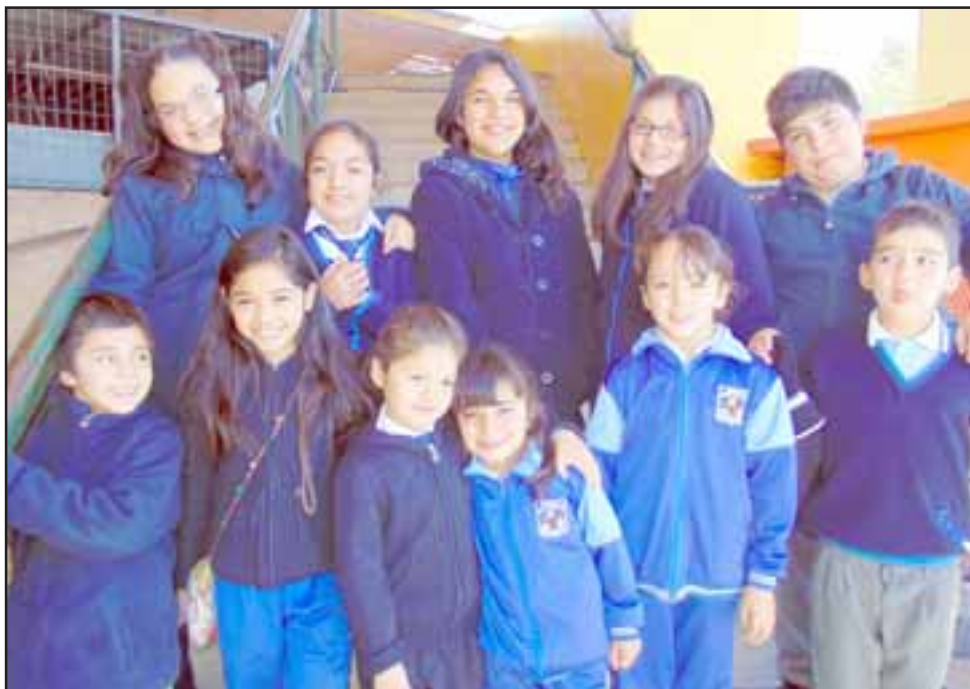
Ellos son los niños con Mejor Promedio de la Escuela Buen Pastor, sus altas calificaciones hoy los tienen en boca de todos, pues las cámaras de Diario El Trabajo los han hecho más populares aún.