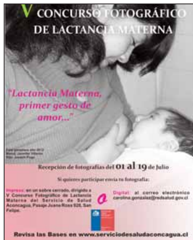
Esta es la imagen ganadora del concurso el año 2012.

reserva el derecho de que las fotografías enviadas al concurso serán consideradas de uso institucional.