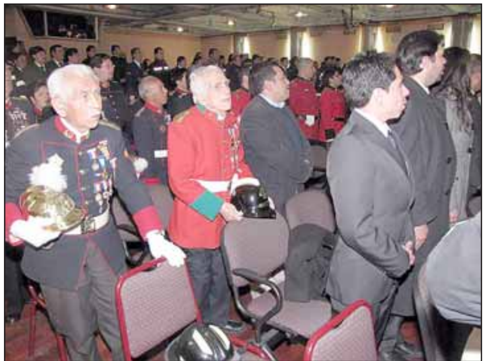
Algunos de los voluntarios que estaban en la ceremonia.

Anunció además el Superintendente que las sesiones del Cuerpo de Bomberos serán transmitidas en vivo por internet.