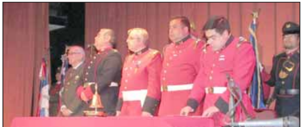
La directiva en pleno durante la ceremonia.