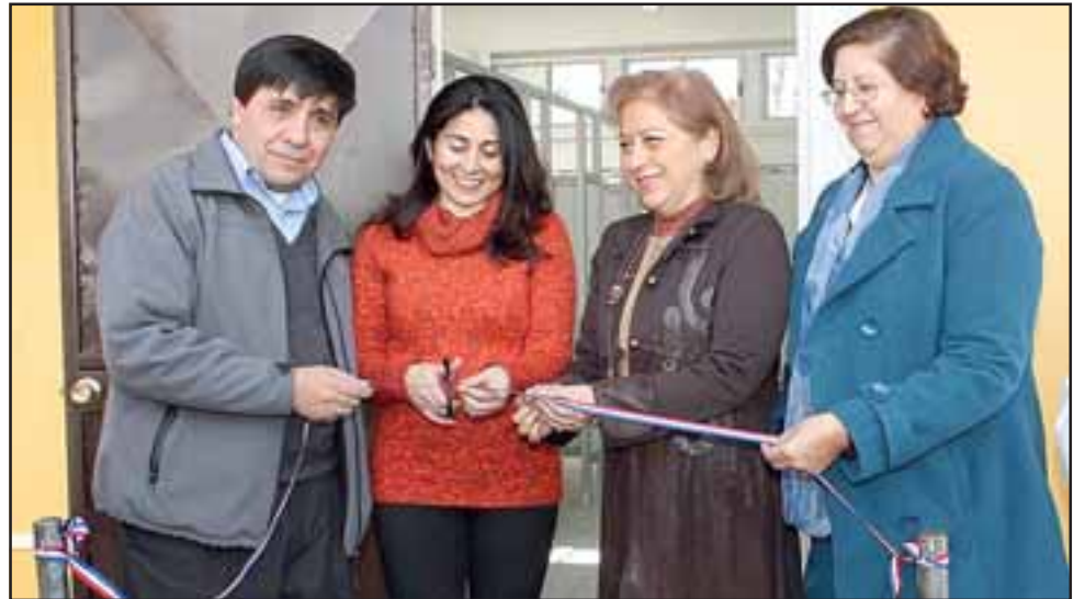
Las autoridades locales encabezadas por la Gobernadora Edith Quiroz y el Alcalde Mauricio Navarro, en el tradicional corte de cinta.

Luego del tradicional corte de cinta, el jefe comunal sostuvo que “esta es una ciudad en la que se están desarrollando múltiples y grandes proyectos y en esa misma lógica, hay una preocupación respecto a los establecimientos educativos.