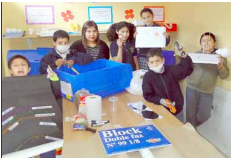
Ellos son los pequeñitos del 3º Básico de la Escuela Escorial, cuentan con tierra, cartón, plumones, tubos de ensayo, lupas y todas las cosas para que puedan durante el año aprender a crear sus propios inventos en clases.

Roberto González Short rgonzalez@eltrabajo.cl