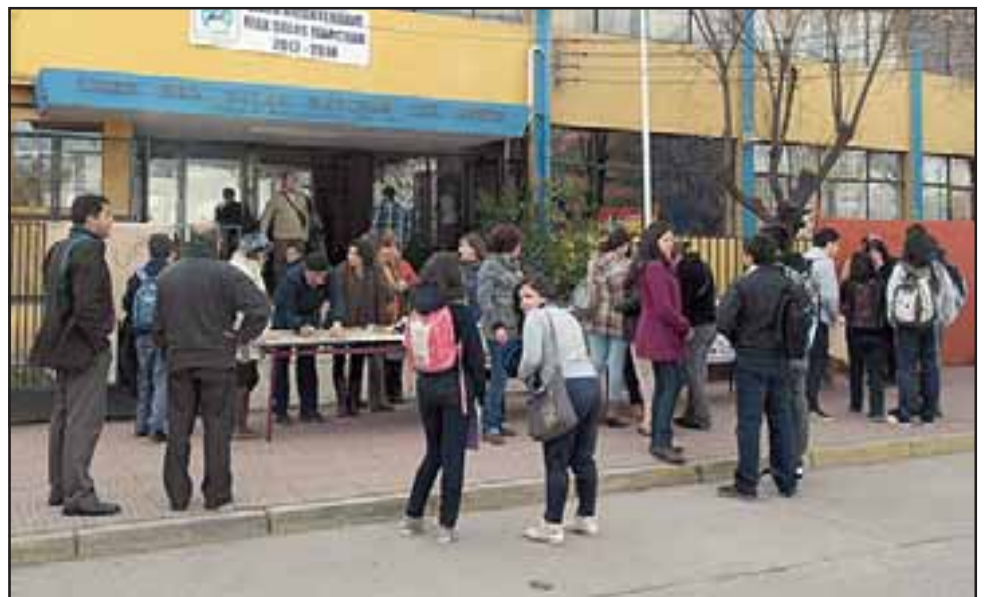
Los profesores protestaron en las afueras del Liceo Max Salas por el no pago del bono SAE y las cotizaciones previsionales que les adeuda el municipio de Los Andes.

Finalmente, declaró que esta olla común es sólo el comienzo de las advertencias públicas hacia el municipio para que cumpla con su compromiso.