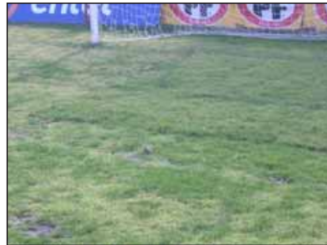
El área del arco norte deja a simple vista muchas imperfecciones.

no menor es que en la actualidad la cancha recibe cuotas de aguas en contadas ocasiones, a través de camiones aljibes y una rustica manguera. "Ya son 8 los meses en que no funciona el pozo, menos mal que ha llovido" indicó otro de los fun-