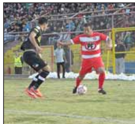
El encuentro fue entretenido de principio a fin