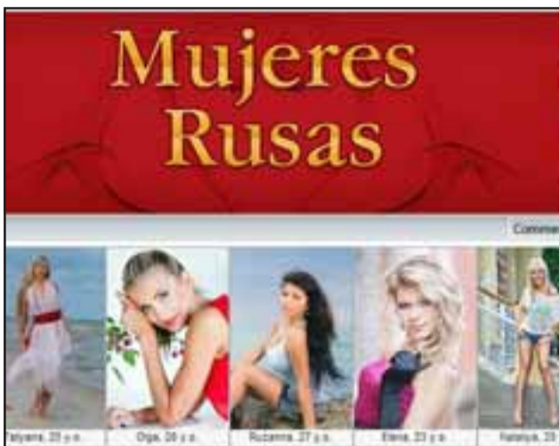
Estas deslumbrantes mujeres son las que 'enganchan' a las víctimas en Chile, luego que sus fotos son colocadas en Internet y con ello una novela dirigida a sacarles dinero a los incautos.

Sin embargo, esto no es nada más que una vil estafa y por ello la Policía Rusa a través de Interpol, hizo llegar a la PDI una advertencia respecto a esta modalidad de estafa. El Jefe de la Brigada de Delitos Econó-