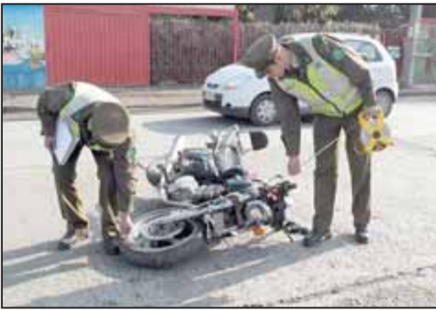
Esta es la motocicleta involucrada en este aparatoso accidente que dejó a los protagonistas mal heridos.

El oficial precisó que habría una obstrucción de pista por parte del automóvil a la moto, «pero la situación del por qué se produjo, es la que estamos investigando». Escobar agregó que ambos móviles no se encontraban con su documentación al día y por ello quedarán a disposición de la fiscalía para realizarles un peritaje mecánico.