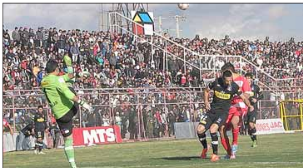
El partido se disputó ante unos 5.000 espectadores en el Estadio Municipal de San Felipe, que por esta vez hizo de local en este recinto.