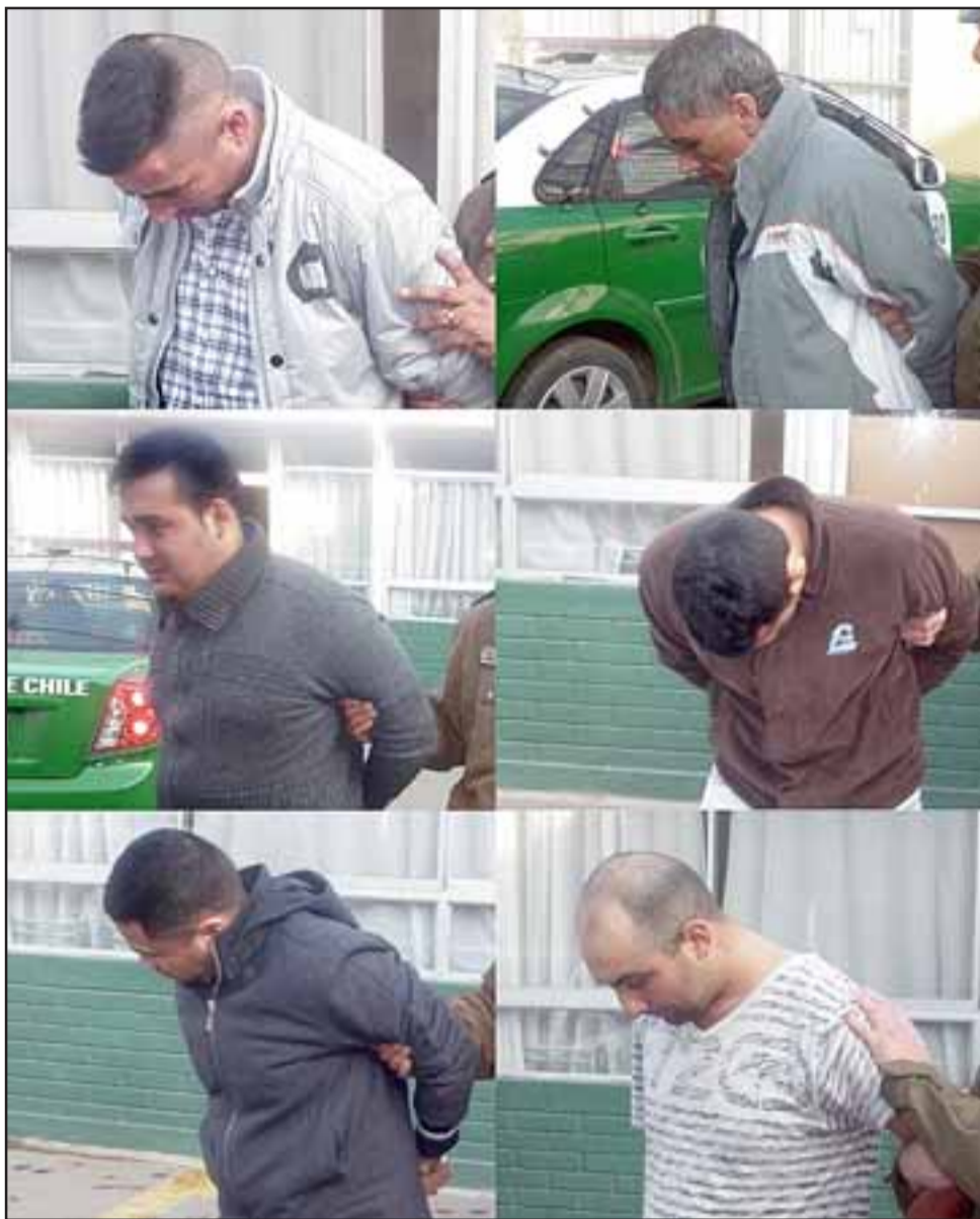
Seis de los siete imputados cuando son trasladados al Tribunal de Garantía de San Felipe.

En el primer vehículo continuó solamente el conductor quien fue detenido,