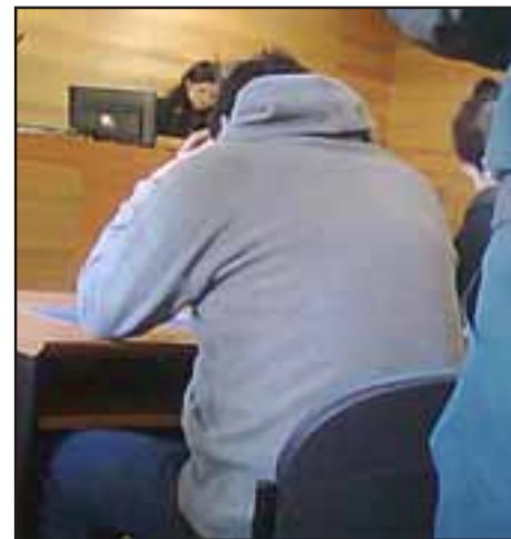
L.A.G.Ch. quedó en Prisión Preventiva, luego que él fuera denunciado por la mujer de su sobrino por el delito de Violación Reiterada.

Sin embargo, la abogada defensora se opuso a esta medida cautelar ya que el