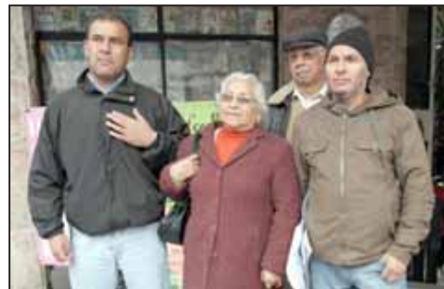
Los dirigentes de juntas vecinales reclamaron por haber sido excluidos de un encuentro en el que ellos, de seguro habrían sido escuchados por las autoridades de gobierno.

Afirmó que a idea es que se vayan dando soluciones al pliego de peticiones y por ello