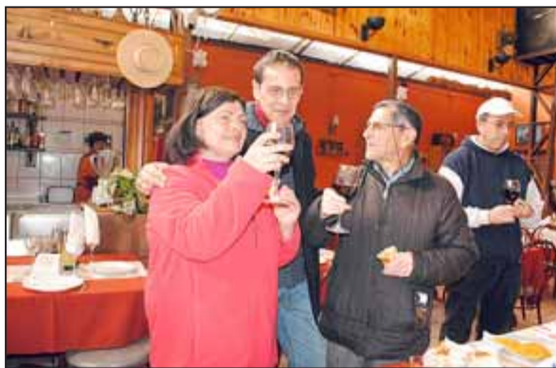
Brindis y muy buen apetito es lo que abundó en esta jornada cultural de la Ruta de la Picada Patrimonial 2013.

sellos que el Alcalde Patri- cio Freire ha querido darle a su gestión, buscando ser