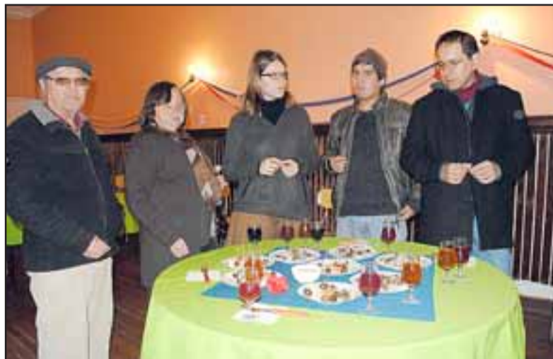
El recorrido partió en la Sociedad de Artesanos La Unión, ubicada en Calle Coimas, hasta donde llegaron varios asistentes de todas las edades.