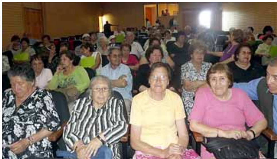
Cientos de abuelos se dieron a la cita en el Teatro Municipal de Santa María para participar en el 1º Encuentro de Gerontología 2013.

El Colegio de Gerontólogos A.G., es una Asociación sin fines de lucro, creada por un grupo de profesionales del área que quisieron aportar sus conocimientos para mejorar la calidad de vida de la población adulta mayor.