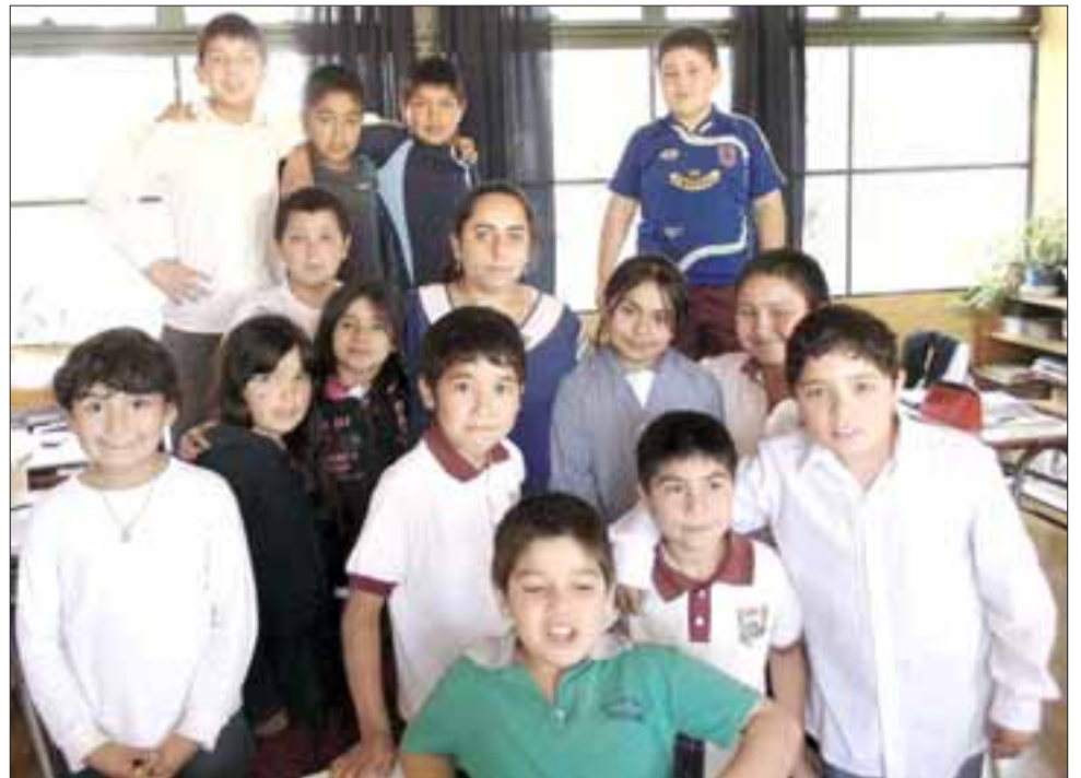
Las iniciativas científicas y de robótica que estos pequeñitos desarrollan, son parte de los resultados obtenidos por ellos y su profesora.