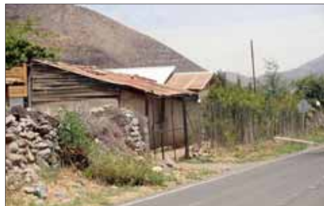
En esta humilde casa vive el abuelo y sus dos violentos hijos alcohólicos.

El detenido pasó a disposición de los tribunales por los delitos de Lesiones Intrafamiliar y por el delito