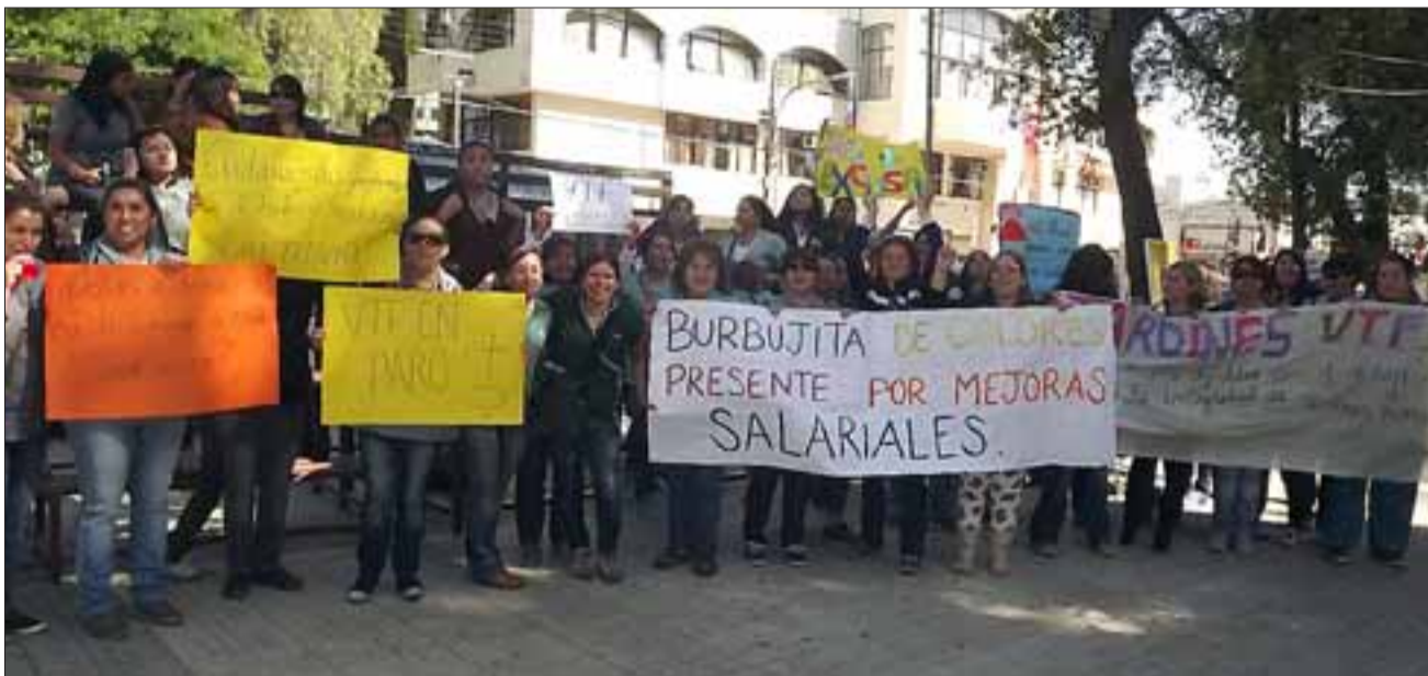
Las tías de los jardines Junji-Municipio, paralizaron sus actividades el viernes. Solo dos jardines atendieron.

«Nosotras estamos de acuerdo en venir a protestar por el reajuste y porque la municipalidad, el alcalde y las personas que lideran