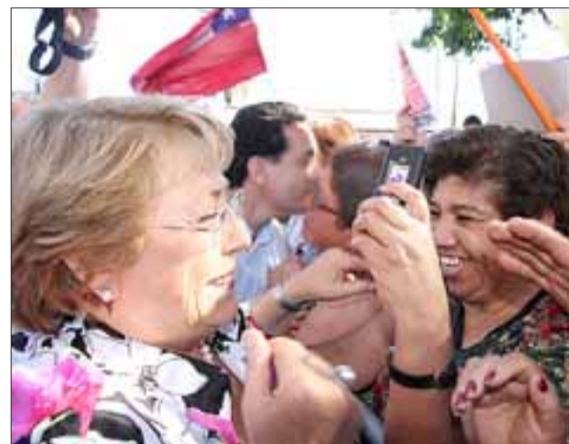
Michelle Bachelet sostuvo un encuentro cálido y cercano con las fuerzas vivas de la comuna de Putaendo.