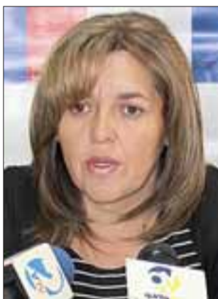
Patricia Boffa Casas, Gobernadora Provincial de San Felipe.

Con la continuidad del paro de los municipales en todo caso, se mantendría el cese de los turnos éticos de los funcionarios, por lo que no se vislumbra cuándo vuelva a retomarse el servicio de extracción de basura.