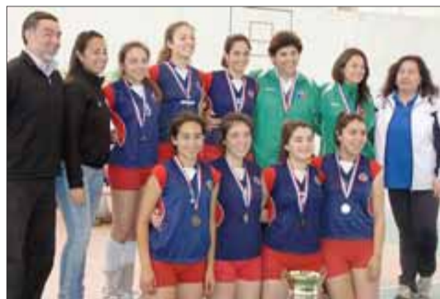
Las dinámicas chicas del equipo de Talca (2º lugar), quienes dieron mucha pelea durante todo el campeonato.