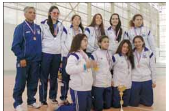
El tercer lugar en este campeonato fue para Lo Prado, representado por Boston College.