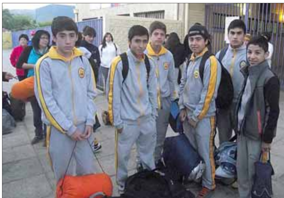
Estos jovencitos estaban que no cabían de contentos antes de salir a esta gira deportiva.