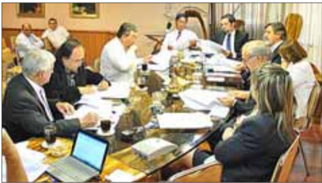
En sesión extraordinaria del concejo municipal, se discutió la propuesta del Padem que no considera cerrar colegios, ni despedir a profesores titulares.

Con la ejecución de estos pagos, ya no quedarían juicios pendientes por pagar por estos montos, con profesionales de la Educación, confirmando el espíritu de la administración alcaldía de pagar todo lo que estaba pendiente.