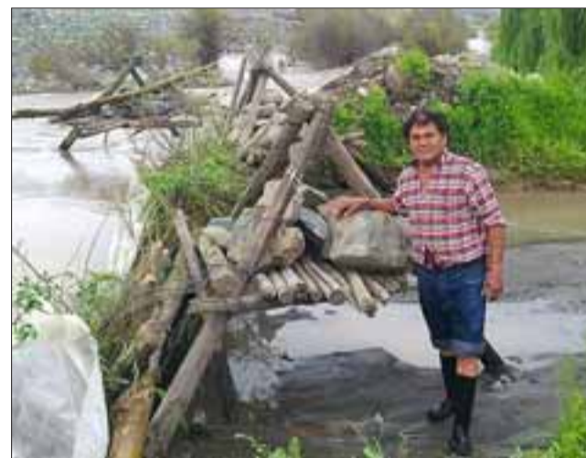
Ayer, el agua del Canal El Pueblo fue desviada hacia el río. En la fotografía, el tomero a cargo de las labores.