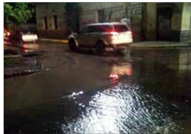
Completamente anegada estaba Alameda Chacabuco producto del desborde del canal que pasa por ahí.