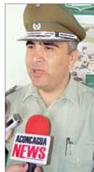
El Comandante Francisco Castro confirmó la notificación de cargos a efectivos policiales eventualmente implicados en el bullado caso.