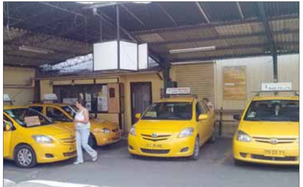
A diferencia de las líneas de colectivo local, Ataxcoa mantendrá sus tarifas al menos hasta que la asamblea de socios decida su modificación.

Pedro Araya es chofer de la línea N°7 y dice que ellos pagan “más de 2 millones de pesos en impuestos al año”, refiriéndose al despreciado impuesto específico al com-