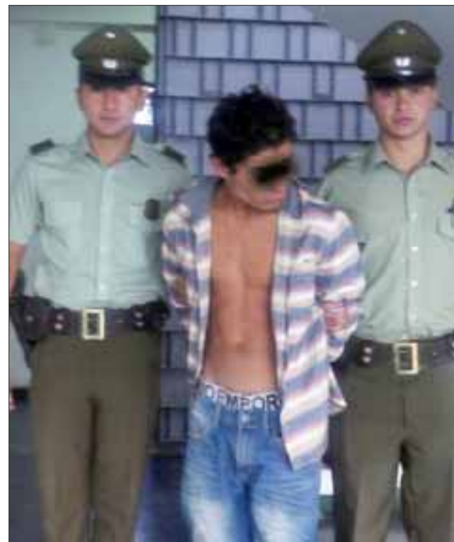
El peligroso delincuente apodado ‘El Cara de Tuto’ fue una vez más detenido, esperando que esta vez no lo dejen en libertad.

Las redes sociales comenzaron a emplazar a los medios de comunicación para que develaran el nombre del juez que dejó en libertad al ‘Cara de Tuto’, y tras revisar los archivos e informes de audiencias pudimos constatar que se