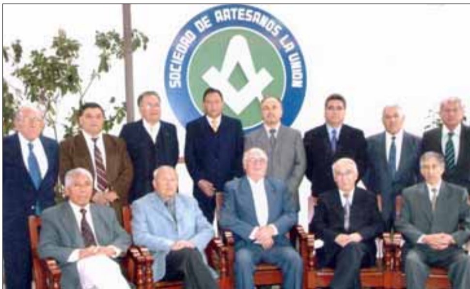
LA DIRECTIVA.- Esta es la actual Directiva de la Sociedad de Artesanos La Unión de San Felipe. Diario El Trabajo los felicita en su día.