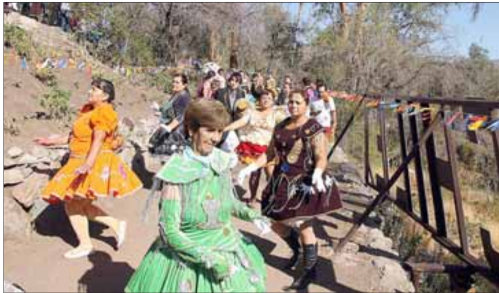
La Agrupación 'Morenas de Aconcagua' animó a los servidores y seguidores de la Carmelita de la Ermita que la llevaban sobre sus hombros.

La Agrupación 'Morenas de Aconcagua', con su tradicional entusiasmo, logró animar el caminar que los servidores de la Carmelita de la Ermita llevaban en sus hombros a turno, en tanto que la Banda Carmelitana Fundada por el Sacerdote