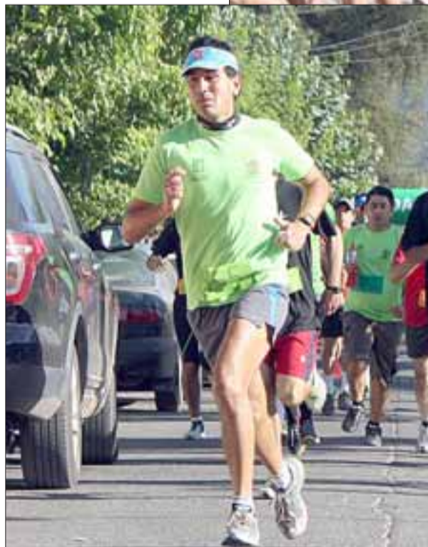
El atleta Máster tuvo una actuación de calidad que le permitió ganar la Corrida Familiar de Panquehue.

Trabajo Deportivo, el destacado deportista que al igual que otros runners de la región Cordillera se encuentra en pleno proceso de preparación para la Maratón de Santiago, la que se realizará en el mes de abril próximo. “Bueno para nadie es un misterio que la Maratón de Santiago es el gran evento para quienes nos dedicamos a este deporte, y por lo mismo al igual que mis com-