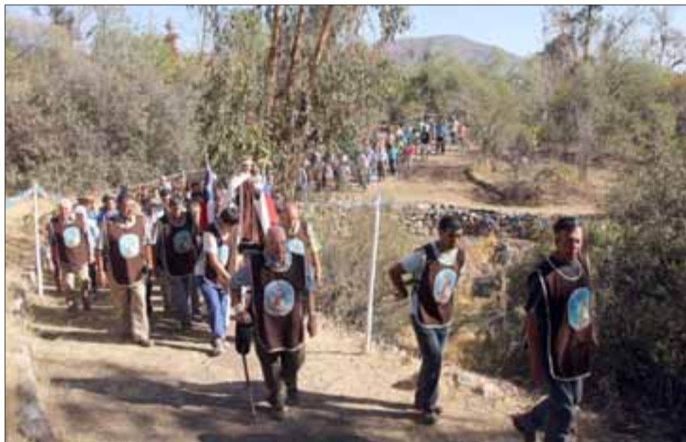
El lento caminar de los servidores de la Carmelita de la Ermita sirvió una vez más para dar término al tiempo estival, orando y solicitando bendiciones para el resto del año laboral que se aproxima.