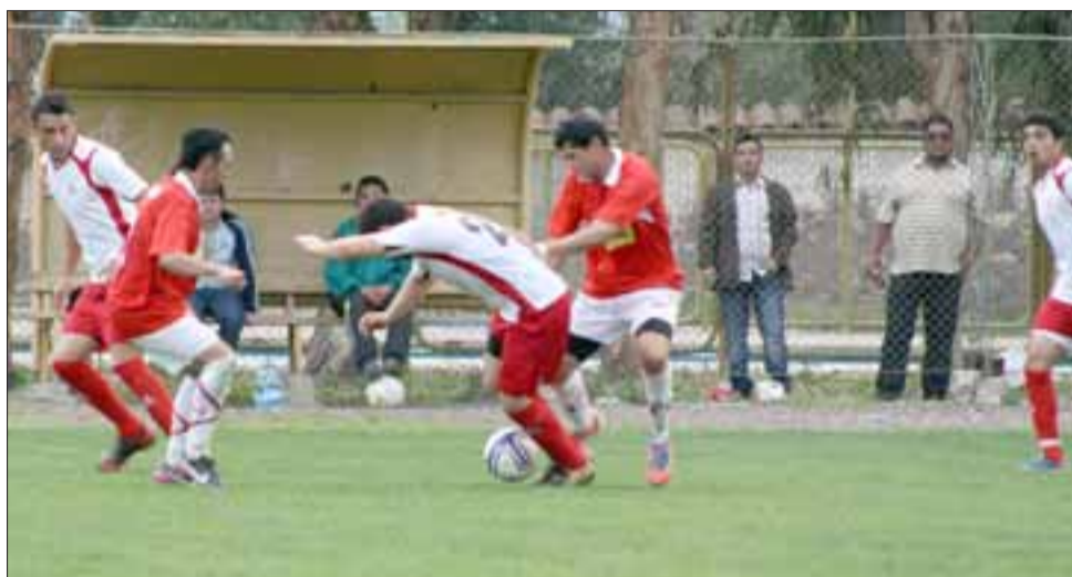
Los equipos aconcagüinos quedaron formando parte de la zona B de la Copa de Campeones.

Alcides Vargas 0 – Unión Sargento Aldea 2; Católica 4 – San Roque 3; Continental 2 – Santa Rosa 3; Ulises Vera 2 – Villa Minera Andina 1; Juventud Santa María 3 – Colo Colo Farías 3; Sporting 8 – San José 2; Independiente Lo Calvo 3 – Almendral Alto 0; Fundación Chagres 5 – Victoria Morandé 0; Santa Rosa 5 – Alianza Patagual 1; Santa Isabel 0 – Social Puñtaendo 2; Las Palmas 3 – Alfredo Riesco 2.