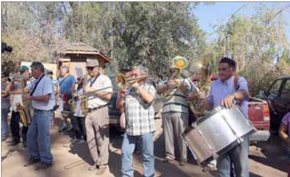
La Banda Carmelitana homenajeó y brindó honores a la madre del Carmelo en varias estaciones.