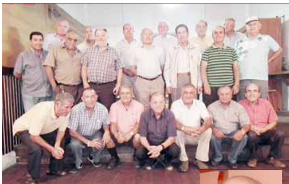
SIEMPRE UNIDOS.- Actualmente la Sociedad de Artesanos La Unión está conformada por unos 120 socios.