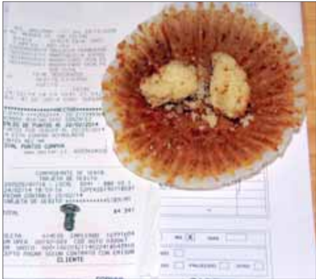
EL TORNILLO.- Este es el tornillo, el pastel y factura del producto que una cliente de Supermercado Santa Isabel compró en esa conocida empresa.

el momento, espero que cumplan y espero también que no hayan más daños internos en la dentadura de mi hija».