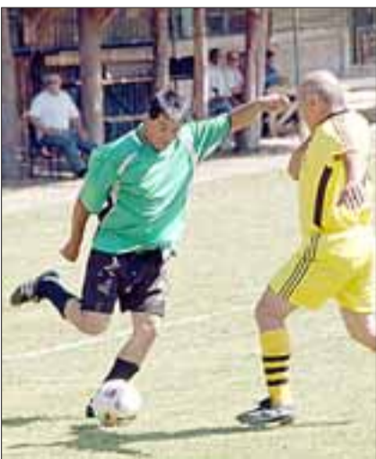
La séptima fecha del torneo de veteranos de la Liga Vecinal fue propicia para los equipos de punta ya que todos hicieron pesar esa condición.

En tanto esta noche a partir de las 20:00 horas, también en Parrasía, comenzará a jugarse la octava. La reunión tiene en carpeta dos duelos a cargo de Hernán Pérez – Carlos Barrera y Unión Esperanza – Aconcagua.