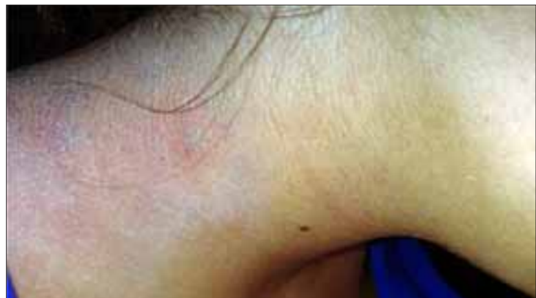
En esta imagen se puede apreciar más nítidamente la lesión en la piel que sufrió la menor.