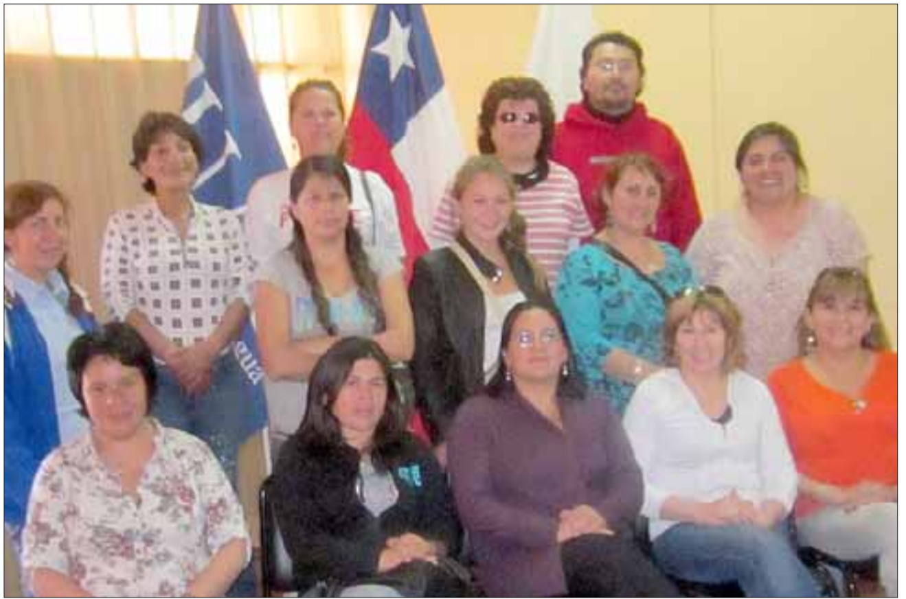
Graduados 2013.- Ellos son los graduados en el mismo curso pero del año 2013. El tiempo y cupo es limitado para esta nueva iniciativa del CEC.

«Este curso inicia el lunes 10 de marzo, cada estu-