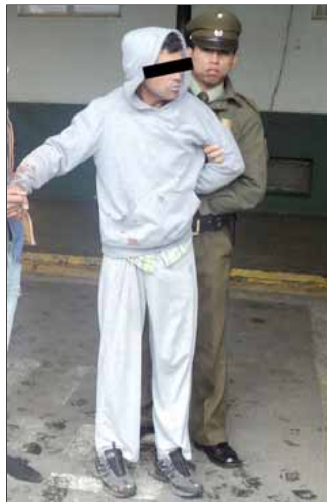
SUICIDA EN POTENCIA. - El imputado fue custodiado por Carabineros y trasladado hasta el Juzgado de Garantía de San Felipe donde fue requerido por la Fiscalía por daños al Municipio.