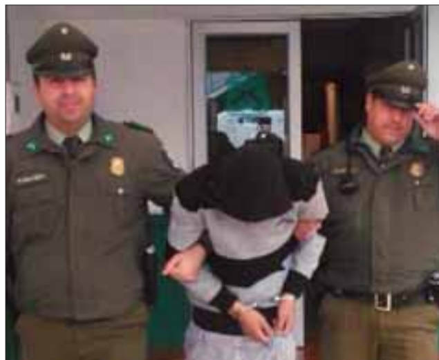
El sujeto apodado 'El Lelo' fue detenido cuando huía desde un local comercial sin portar especias por el cual fue dejado en libertad por orden de la Fiscalía.