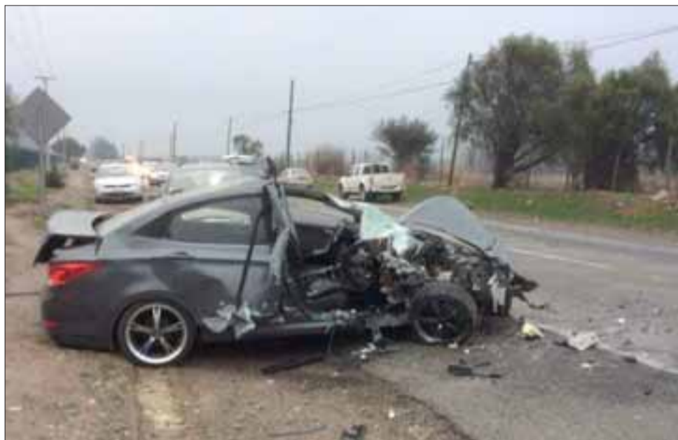
La Siat de Carabineros deberá establecer la responsabilidad de este vehículo que sería el responsable del accidente donde se presume que habría sido provocado por consumo de alcohol.

En tanto, las primeras diligencias de Carabineros indican que uno de los conductores que habría originado el accidente presentaba hálito alcohólico, lo que sería el causante de la pérdida del control del vehículo, presunciones que deberán ser confirmadas tras los peritajes de la Sección de Investigación de Accidentes de Tránsito Siat y del Servi-