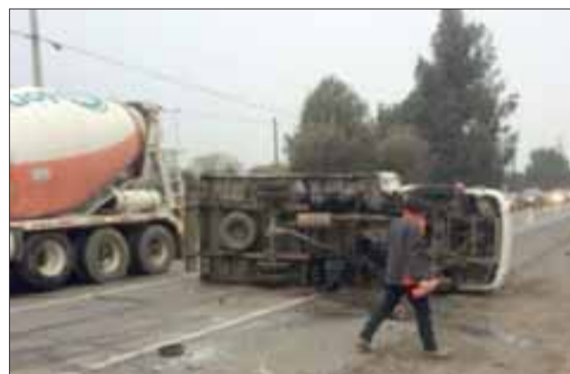
Este vehículo impactó por alcance al primero de los involucrados lo que produjo un volcamiento al borde de la Ruta 60 CH en la comuna de Panquehue.