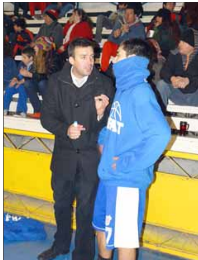
El técnico pratino destacó el gran esfuerzo que sus pupilos realizaron ante Colo Colo.