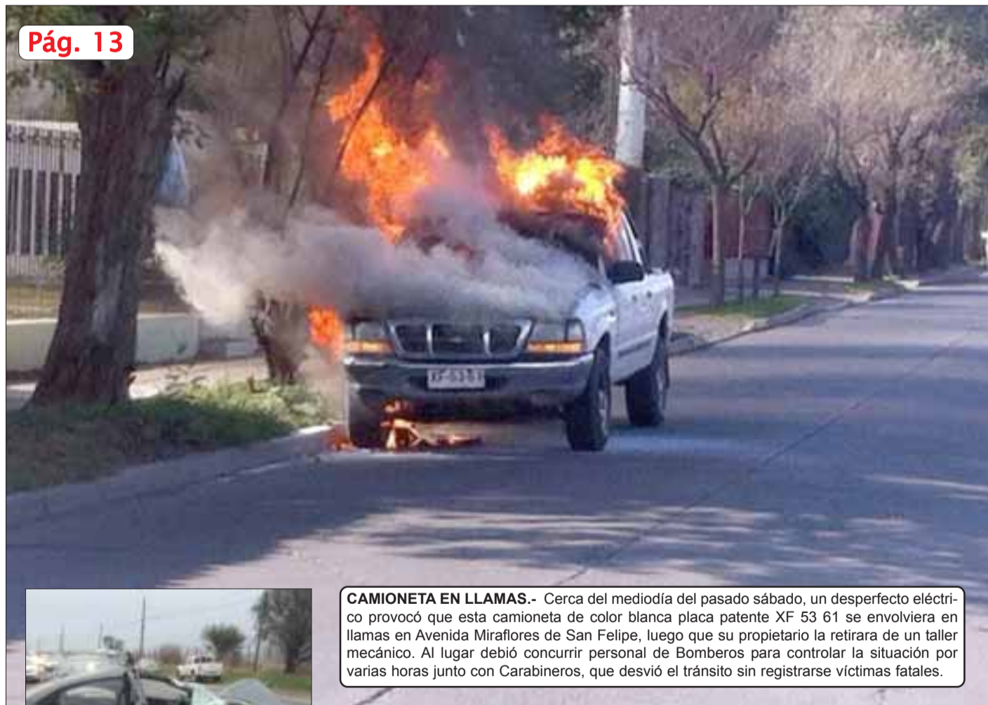
CAMIONETA EN LLAMAS.- Cerca del mediodía del pasado sábado, un desperfecto eléctrico provocó que esta camioneta de color blanca placa patente XF 53 61 se envolviera en llamas en Avenida Miraflores de San Felipe, luego que su propietario la retirara de un taller mecánico. Al lugar debió concurrir personal de Bomberos para controlar la situación por varias horas junto con Carabineros, que desvió el tránsito sin registrarse víctimas fatales.