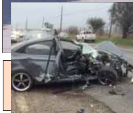
Conductor ebrio se habría quedado dormido un momento Pag. 13 Dejando 5 heridos, borracho al volante provocó violento accidente de tránsito