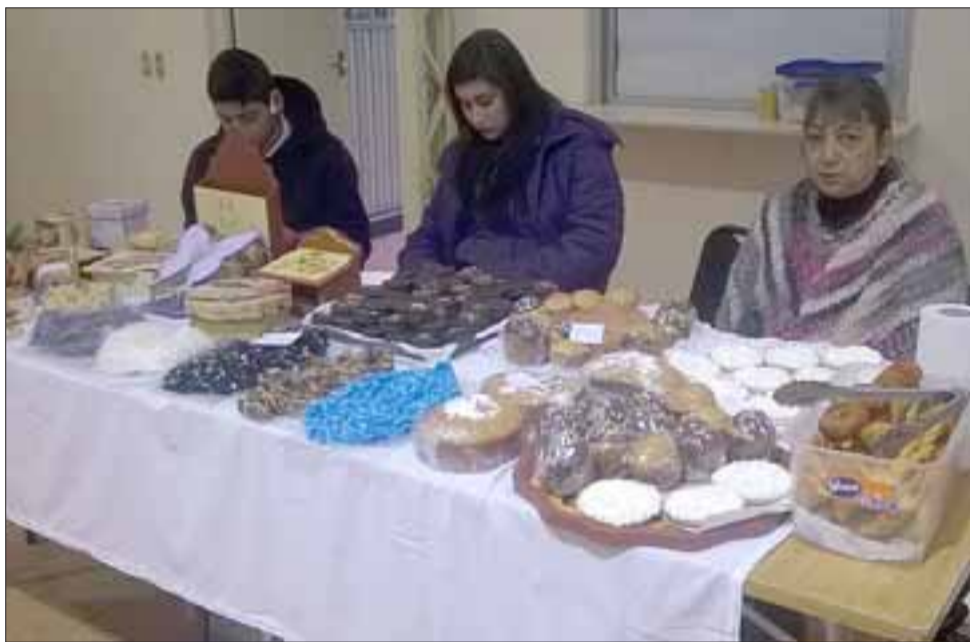
RICA RESPOSTERÍA. - En dependencias de salón de eventos de Sanfecoop, se desarrolló este viernes una nueva versión de la feria de Productores y Artesanos del Valle de Aconcagua.