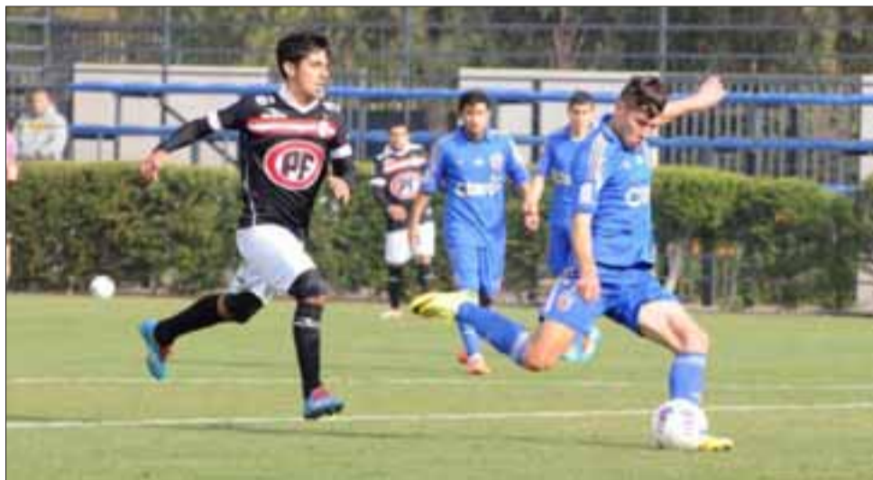
La mañana del sábado pasado el equipo albirrojo cayó por 5 a 0 en un amistoso contra la Universidad de Chile. (Foto: www.udechile.cl).

En tanto a través de su sitio oficial, Unión San Felipe comunicó que mañana martes a partir de las 10:30 horas en el Complejo Las