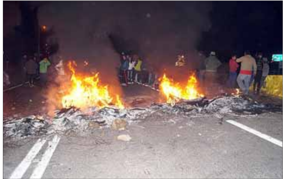
ARDIENTES. - Los vecinos del camino internacional insisten en levantar barricadas y bloquear la ruta como medio de protesta en contra de las autoridades por el anuncio de la construcción del Embalse Puntilla del Viento.

Agregó que existe un descontento general a nivel de los vecinos de todo el camino internacional, "y lo que nosotros pedimos es que las autoridades vengán al sector involucrado para aclararnos y decirnos en terreno lo que ellos pretenden hacer, ya que la gente no quiere que se haga el embalse en Puntilla del Viento, porque nadie quiere irse de ese lugar donde están bien y en ninguna otra parte van