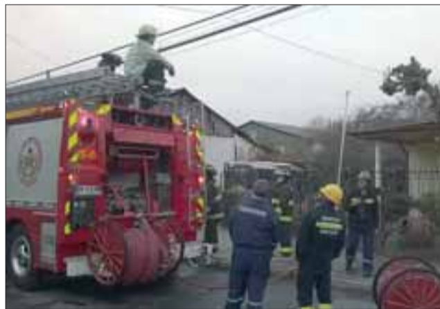
En Avenida Dardignac Número 32, justo al frente del patio de Carabineros, la emergencia afectó sólo a una casa, la que resultó con un daño importante en el entretecho.

ron en algún momento determinado las casa colindantes, ya que se extendió una nube tóxica visible de distintos lugares de la ciudad y que estaba también acompañada de fuego, pero que se logró controlar rápidamente con los vehículos