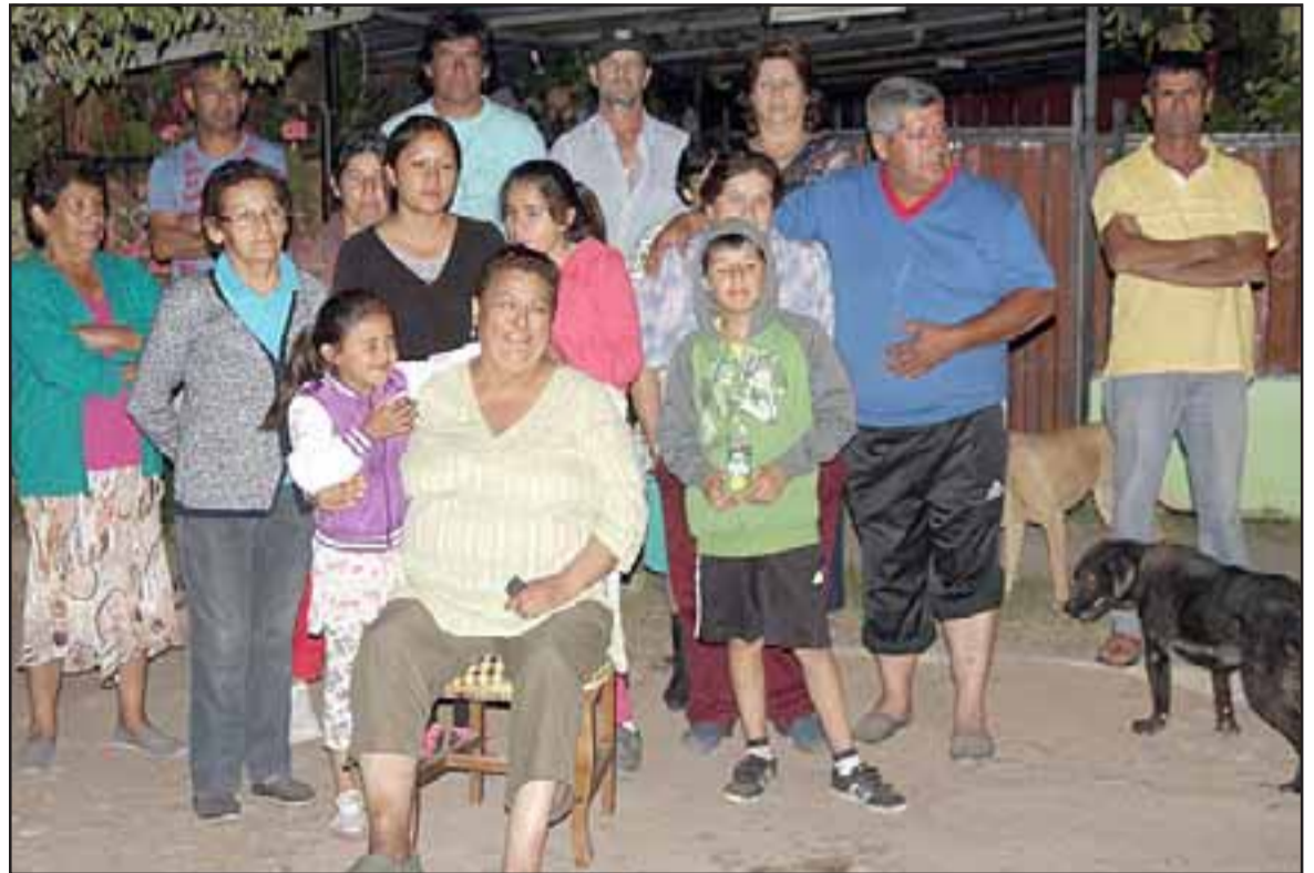
Una dramática situación están viviendo varios vecinos de Población Esperanza de Granallas, quienes desde hace bastante tiempo han tenido problemas de presión de agua en sus viviendas.

situación, fueron tajantes en señalar que si esta situación continúa y si no existe una solución por parte de Esvál, realizarán movilizaciones y tomas de camino como una manera de presión.