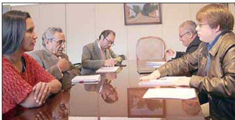
El Frente de Protección del Patrimonio hizo un emplazamiento a la Municipalidad de Putaendo, para que cumpla con los compromisos adquiridos y anunciados sobre Corrales del Chalaco.

«Públicamente se han hecho anuncios que nunca se concretaron, tiempo atrás el alcalde anunció a través de la prensa que se habían adquirido los recursos para la contratación