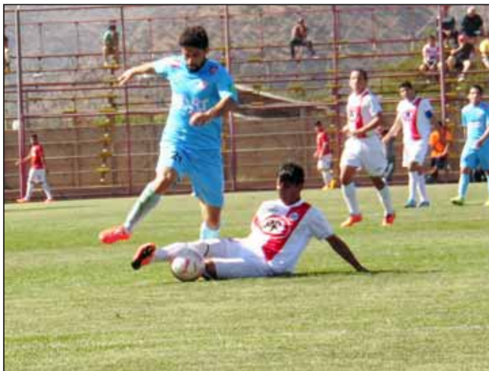
La noche del próximo sábado Unión San Felipe recibirá en el Municipal a San Luis, hasta ahora su gran rival en la Primera B.

Los boletos sólo se venderán el día del partido en las boleterías del estadio municipal.