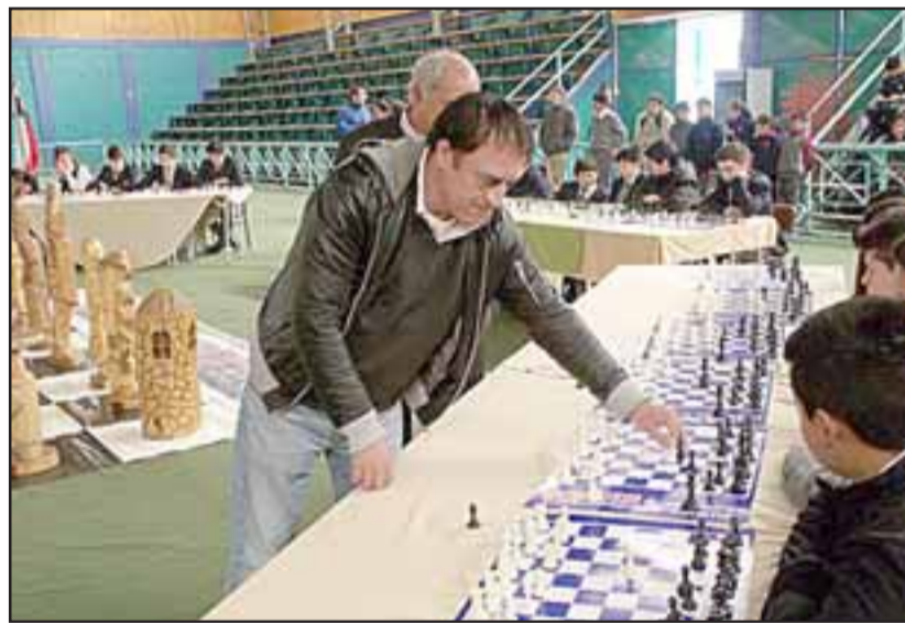
El equipo del Liceo Roberto Humeres de la comuna de San Felipe es el mejor en la disciplina de ajedrez de la Quinta Región, en el campeonato inter-escolar de ajedrez.

esfuerzo de nuestros alumnos, pero también de nuestros profesores, quienes con dedicación y mucho profesionalismo, creen en este proyecto educativo, esperando que en el corto plazo, nuestra realidad sea mucho mejor», destacó la directora.