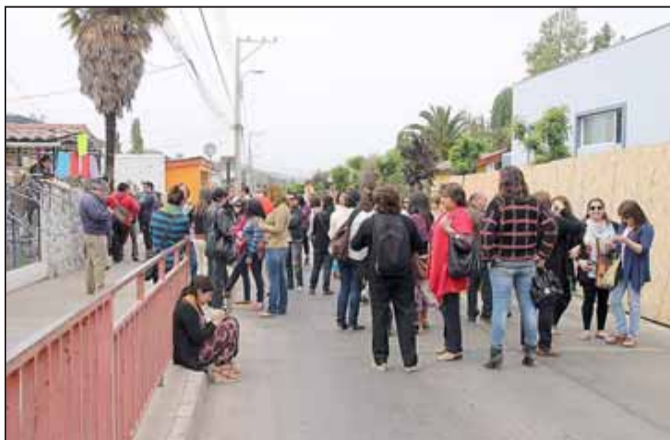
Los profesores de Putaendo que se encuentran en paro, bloquearon la carretera Putaendo-San Felipe en las cercanías de la Escuela María Leiva de Las Coimas.