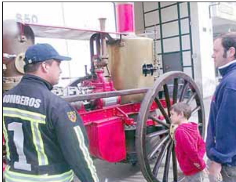
La invitación entonces es a conocer las historias de sacrificio y compromiso con la ciudad, así como de la vocación de servicio que caracteriza a los Bomberos de San Felipe.

Desde ya, el encargado del área de patrimonio manifestó que «queremos agradecer a la Superintendencia de Bomberos, a los capitanes de las compañías, y a todos los miembros hombres y mujeres de