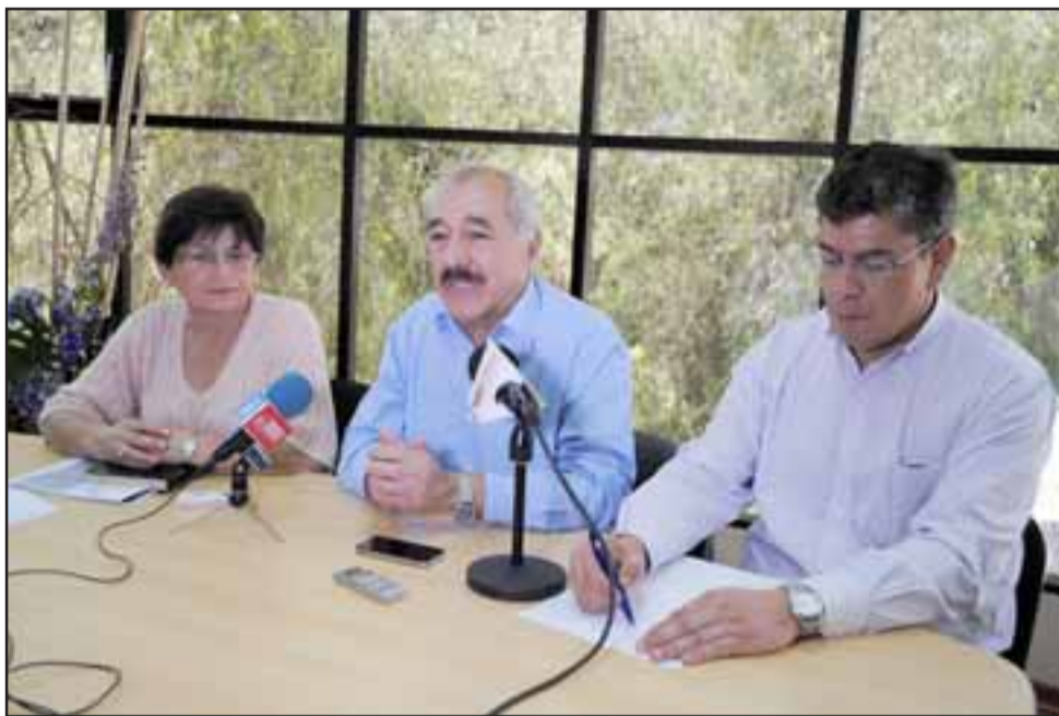
El jueves recién pasado el Alcalde Patricio Freire entregó el último cheque correspondiente al pago del Bono SAE, cumpliendo de esta manera con el compromiso adquirido desde el inicio de su gestión con los docentes.

El pago total por concepto de Bono SAE alcanzó la cifra de $310 millones, mientras y por concepto de indemnizaciones la suma alcanzó los $231 millones, lo que significa que en estos dos años de gestión, se ha cancelado un monto superior a los $541 millones a los docentes.