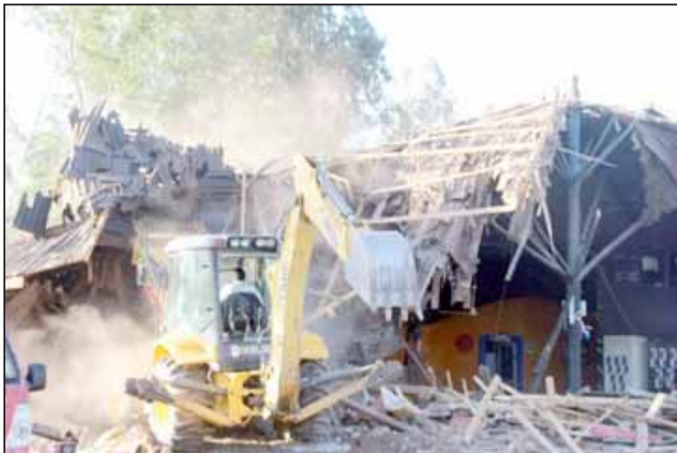
La emblemática y popular Discoteque Chozas, ubicada en Callejón Los Lobos, comenzó a ser demolida para dar paso a un moderno edificio que albergará un centro de eventos y discoteque.

tura, pues ésta ya cumplió su vida útil y en cierta forma podía presentar un peligro para quienes asistieran al local e indicó que harán todos los esfuerzos necesarios para construir la nueva Discoteque Chozas y un centro