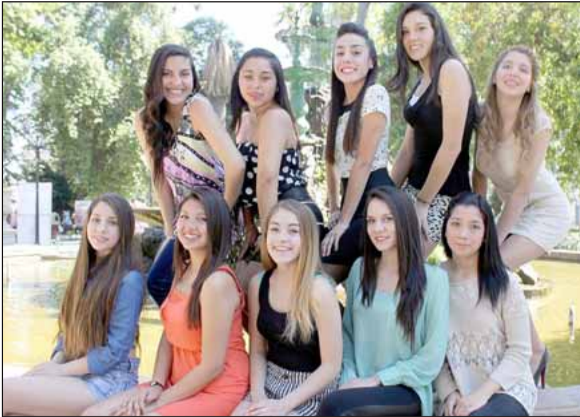
ADMÍRELAS.- Ellas son las adolescentes más bellas del valle que se atrevieron a participar en el certamen de belleza y proyección social más importantes de Aconcagua.

des entre otras comunas del Valle Aconcagua. Todas ellas solteras y sin hijos. La coronación de las Miss Teenager y Miss Aconcagua se realizará a finales de enero de 2015 y aún otras jóvenes pueden participar. Las interesadas pueden enviar sus datos al correo: certamen.missaconcagua@hotmail.com Roberto González Short