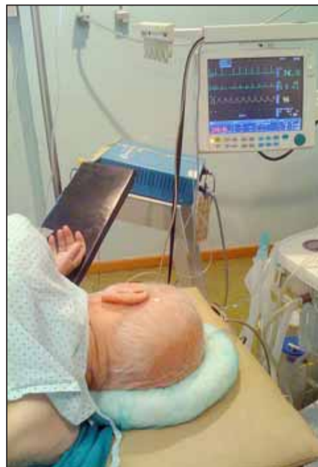
Las víctimas han sido asistidas en el Hospital San Camilo de San Felipe para eliminar la droga que han ingerido de manos de antisociales para cometer sus delitos. (Foto Referencial)

Personal médico de Urgencias del Hospital San Camilo han debido realizar diversos exámenes para determinar el nivel de sedación que han sufrido los adultos mayores que han sido víctimas de la delincuencia.