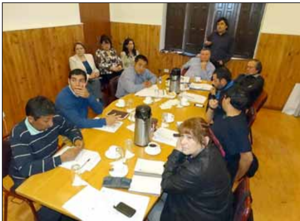
El concejo municipal manifestó que en el caso del Padem, se estableció una carta de navegación para seguir potenciando la salud a nivel local y en la salud primaria, se busca mejorar la calidad de la atención.