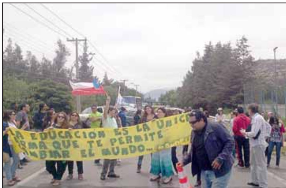
Más de 30 estudiantes del Liceo Manuel Marín Fritis se tomaron las dependencias cuestionando el paro de los profesores.