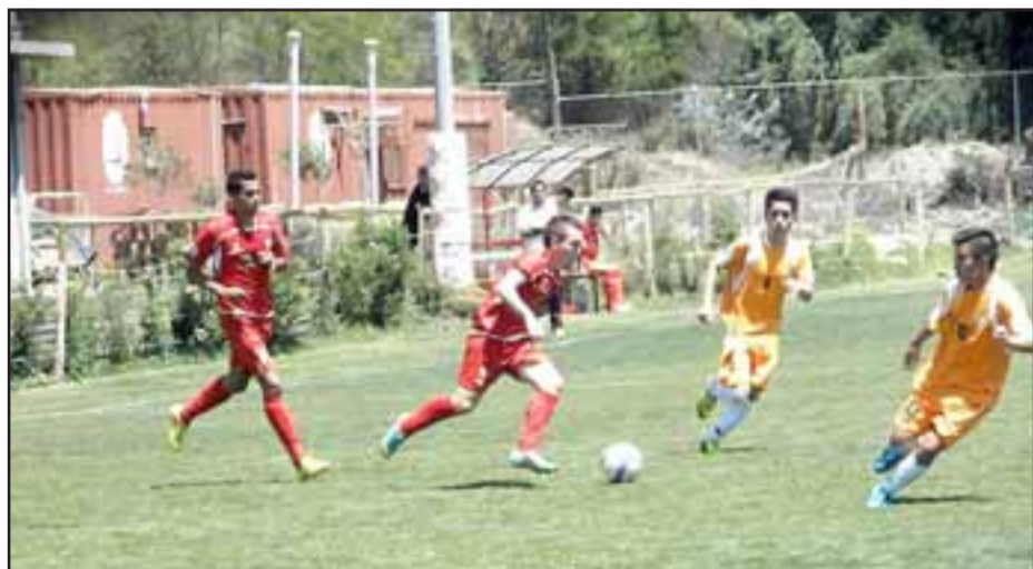
Muy sólidos estuvieron los juveniles del Uní durante el fin de semana pasado en el torneo de cadetes que organiza la Anfp.