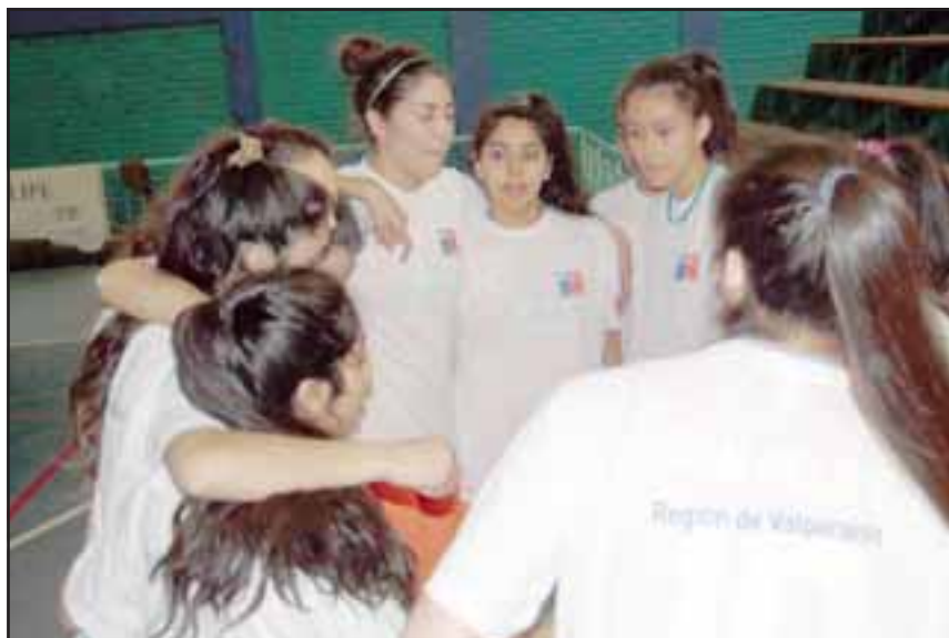
San Felipe tendrá un rol protagónico en los Juegos Binacionales.