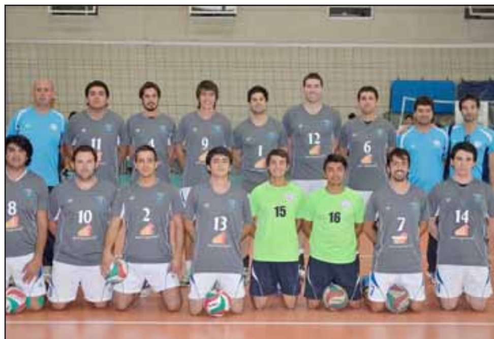
El sexteto será el exclusivo representante de San Felipe, en la primera división del vóley chileno.