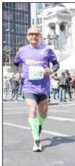
El runners sanfelipeño está inscrito en los 21 kilómetros de la TPS.

El evento deportivo más masivo de la Quinta Región tendrá lugar en Valparaíso, donde el domingo en la mañana se realizará una nueva versión de la Corrida TPS, evento que espera reunir a más de 7.000 competidores. Una de las características que tiene este evento atlético, es que el circuito pasa por el interior del puerto, por lo que los runners deben correr bajos las grúas y por el costado de los contenedores.