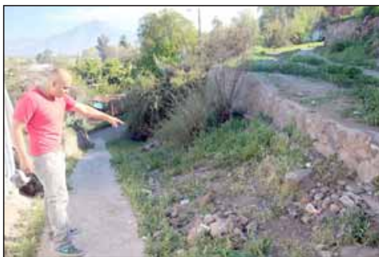
Los vecinos de Calle Nueva Chacabuco están solicitando la pavimentación de un pequeño tramo que une ese sector con Calle Portales, con la finalidad de permitir el acceso a vehículos de emergencia.

las condiciones del camino no pueden acceder a ese sector.