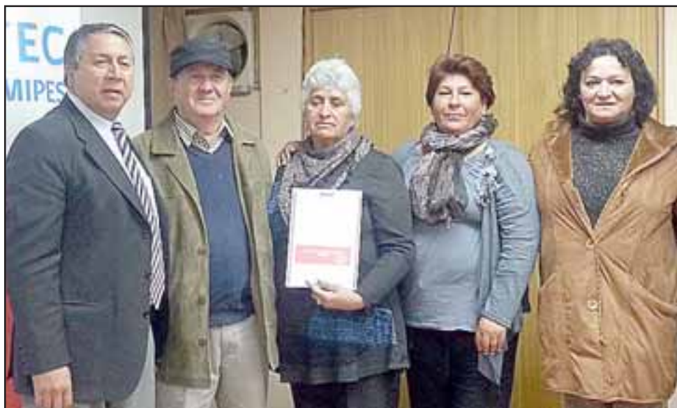
Unos 104 comerciantes llayllaynos fueron beneficiados por el Servicio de Cooperación Técnica (Sercotec), a través del fondo concursable del Programa de Modernización de Ferias Libres.

AVISO: Por extravío quedan nulos cheques N° 6431299, 7331947, Cuenta Corriente N° 22300021941 del Banco Estado, sucursal San Felipe. 23/3