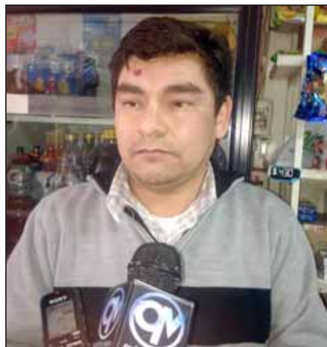
El dueño de Minimarket Luchito, ubicado en Calle Tocornal esquina Regidor Rodolfo Espinoza en Población La Santita de San Felipe, ahora fue víctima de la delincuencia tras un asalto a plena luz del día.

"La respuesta fue lenta de Carabineros, porque un vecino los llamó cuando yo estaba sangrando, demoraron como 20 minutos más