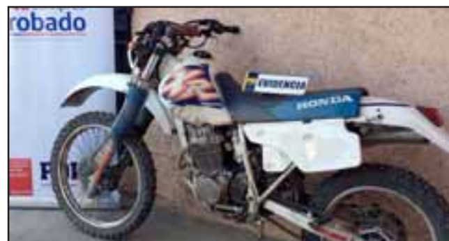
La motocicleta fue recuperada al interior de Villa 250 Años luego de haber sido robada desde una parcela en la comuna de Panquehue el pasado 10 de septiembre.

“Se logró divisar a un individuo en dicha motocicleta tras un patrullaje por el sector, al querer practicarle un control de identidad este sujeto se da a la fuga, al revisar la motocicleta esta mantenía una orden de encargo por Robo del cual había sido sustraída. Por lo anterior se dio cuenta al Fiscal de Turno, se incautó la especie y se tomó contacto con el