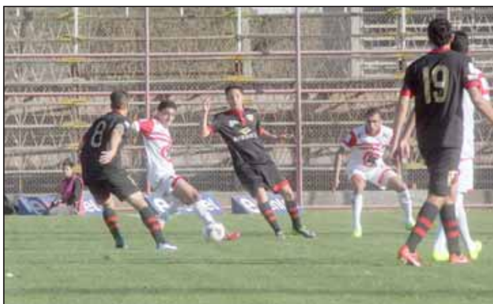
El Uní no presentaría mayores modificaciones en el pleito de pasado mañana frente a Lota Schwager.

Lugar Ptos. San Luis 14 Santiago Morning 13