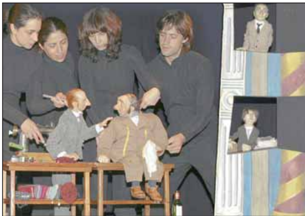
Este próximo sábado 4 de octubre llegará al Teatro Municipal de San Felipe de forma absolutamente gratuita, esta presentación se realizará a las 17:00 y 20:00 horas y se ejecutará en el marco la Gira Teatro a Mil 2014.

'El Capote' es apta para mayores de ocho años, está a cargo de la destacada Compañía Teatro y su doble y es un montaje con animación de objetos que recibió alabanzas de la crítica especializada en todos los escenarios en los que se ha presentado. Las entradas se encuentran disponibles a partir de hoy 26 de septiembre en el Teatro Municipal de San Felipe y podrán ser retiradas desde las 8:30 hasta las 13:00 horas y en la tarde, entre las 15:00 y 18:00 horas.