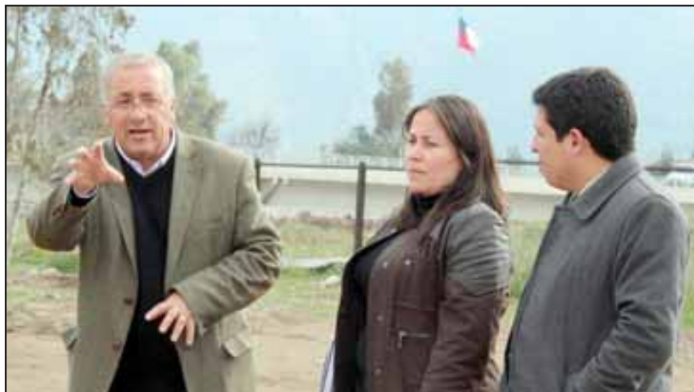
El parque municipal de Putaendo se ha transformado poco a poco en un hermoso y grato lugar de encuentro, actividades masivas y esparcimiento.