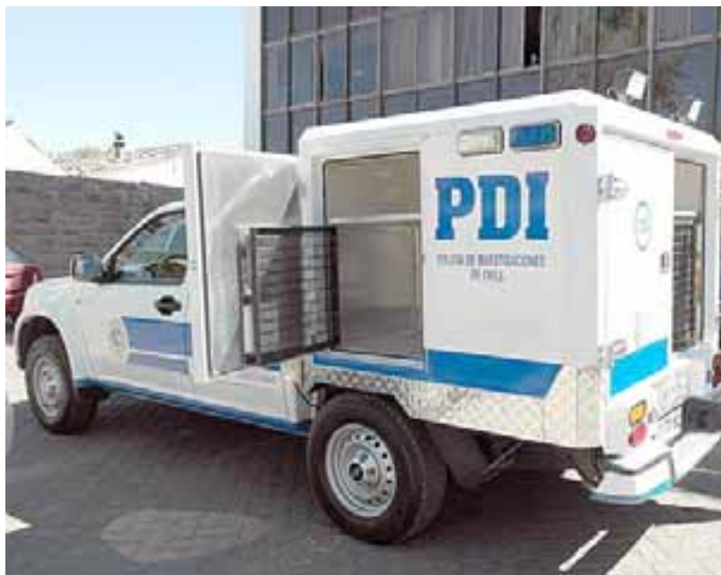
Este es el modelo de camioneta policial para uso forense agendado para el uso de la PDI con recursos del Core.

compra por parte del Municipio de San Esteban de un bus para el transporte de estudiantes. Finalmente, el Core aprobó $146 millones para la compra de una camioneta, especialmente equipada de la PDI de Los Andes.