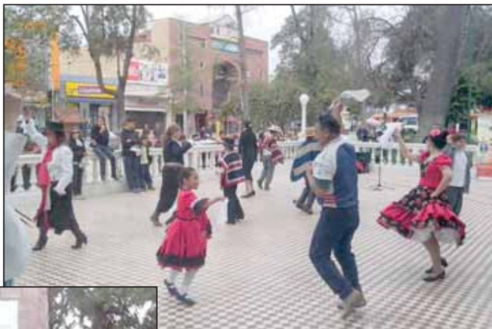
El recorrido se inició en el convento de Curimón, plaza de los cañones y Cerro San Francisco.