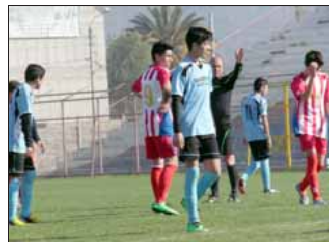
Los torneos buscan a los mejores de la Quinta Región en las series U-15 y Súper Séniors.

La programación es la siguiente: Súper Séniors Sábado 27 de octubre 18:00 horas, Santa Ma-