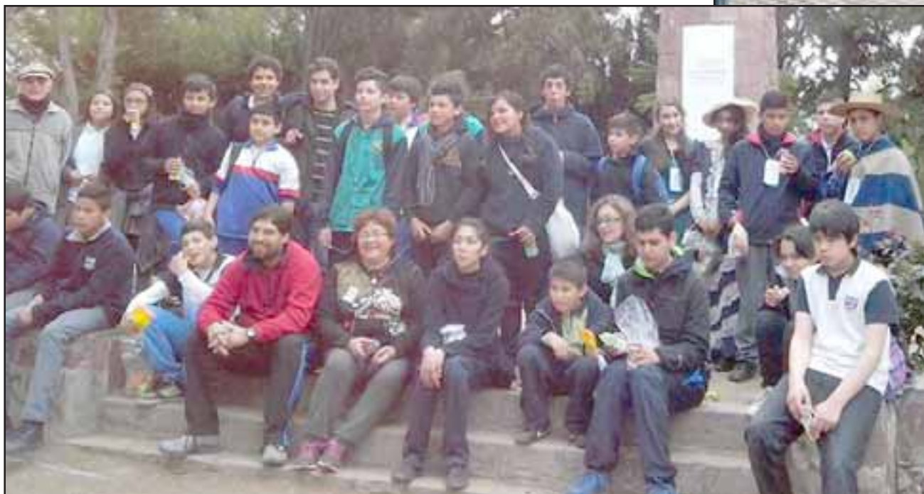
El circuito finalizó en Hacienda de Quilpué, donde los visitantes pudieron conocer más sobre lo que en algún momento fue una de las construcciones más elegantes y características del valle.

Hacienda de Quilpué, donde los visitantes pudieron conocer más sobre lo que en algún momento fue una de las construcciones más elegantes y características del valle, cuya construcción comenzó en el año 1886, para ser presentada el año 1916, como una réplica a menor escala del Palacio Versalles. Reunidos en la Plaza de Armas, específicamente en la remozada terraza, los participantes recibieron diplomas y disfrutaron de un pie de de cueca, además de degustar de platos de la época.