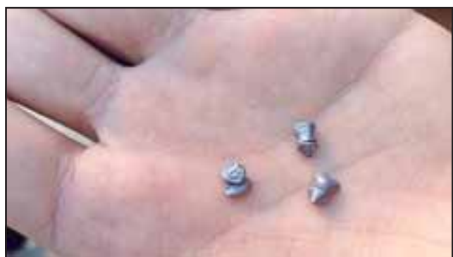
Estos son perdigones similares a los que se usaron en este violento ataque contra la mujer y su padre.

Delincuencia sigue azotando impunemente: