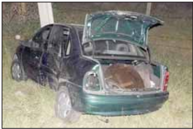
Fue impactado por otro móvil que lo lanzó hacia una zanja para terminar chocando contra un poste.

LOS ANDES.- Con lesiones de consideración resultó el conductor de un automóvil que fue colisionado por un taxi colectivo fuera de recorrido cuando intentó hacer un viraje en U en Autopista Los Libertadores.