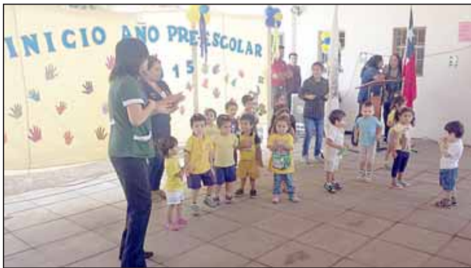
En el Jardín Infantil Conejitos Saltarines de Curimón, también se realizó la ceremonia de inauguración de este nuevo año escolar.