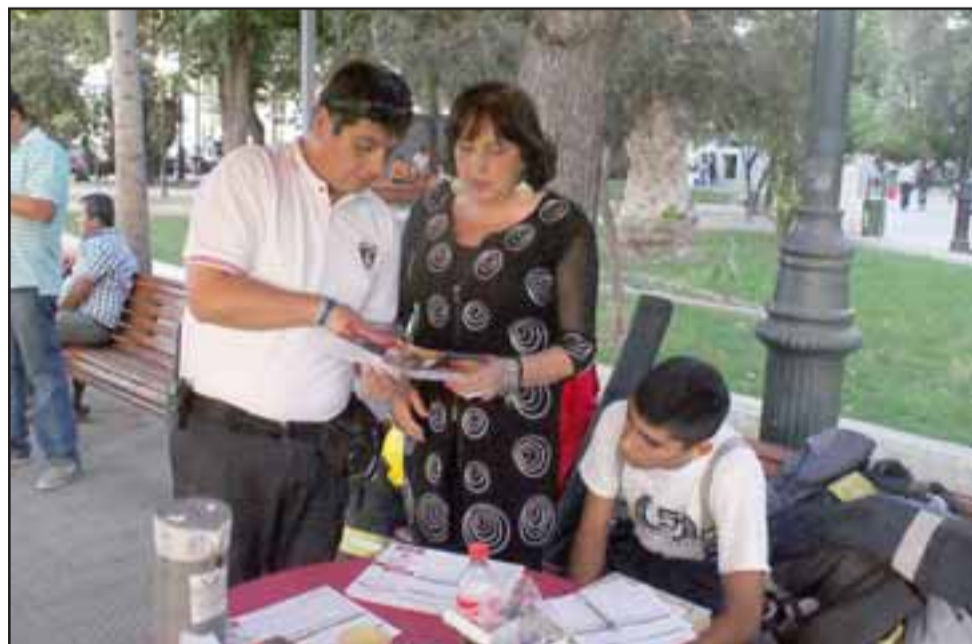
En la plaza de armas de la comuna, Bomberos se reunieron para incentivar a la comunidad a inscribirse como nuevos socios.

La campaña dura dos meses y pretende captar cerca de 4000 socios. Vamos a estar en diferentes puntos de la ciudad, tal