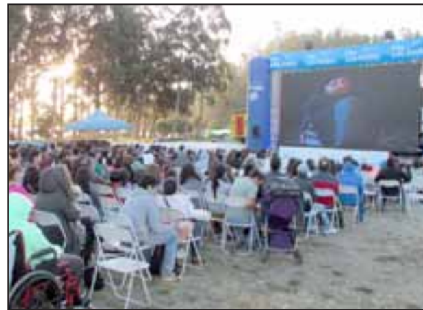
Ya son muchas las personas que han podido disfrutar del programa «Cine Móvil» de Caja Los Andes.

general. En esta oportunidad visitará Catemu, en donde las personas tendrán acceso gratuito a una película de primer nivel, fomentando la cultura y las actividades familiares y al aire libre. La invitación es para que la familia y, principalmente, los más pequeños de la casa, asistan a esta función.