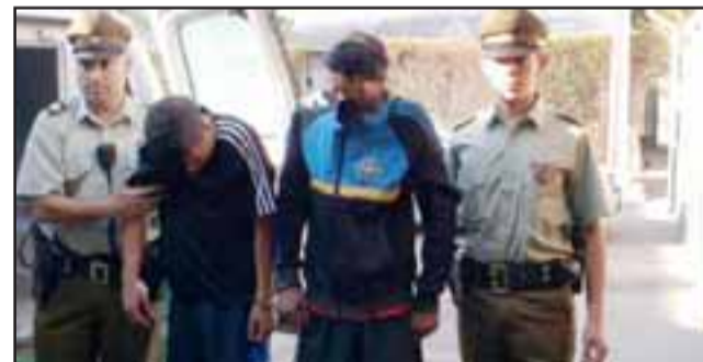
Los imputados, entre ellos un menor de edad, quedaron a disposición de la Fiscalía para la investigación del caso.