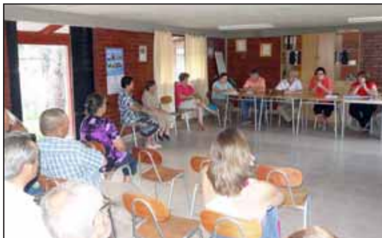
El Alcalde como la Directora de Obras, se reunieron con los vecinos de rinconadinos para informar sobre los nuevos proyectos que hermosarán la comuna.

públicos de la comuna logrando destacar los lugares patrimoniales e históricos, transformando el centro en un sector con una identidad definida, además de contar con un paseo peatonal y ciclo vía que permita el esparcimiento de los vecinos y sus familias.