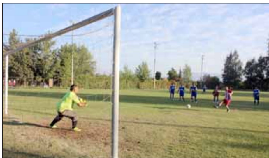
Jornada clave en el Amor a la Camiseta será la que se jugará pasado mañana en distintas canchas del valle de Aconcagua

20:00 horas, Resto del Mundo – Villa Los Amigos 21:15 horas, Carlos Barrera – Aconcagua