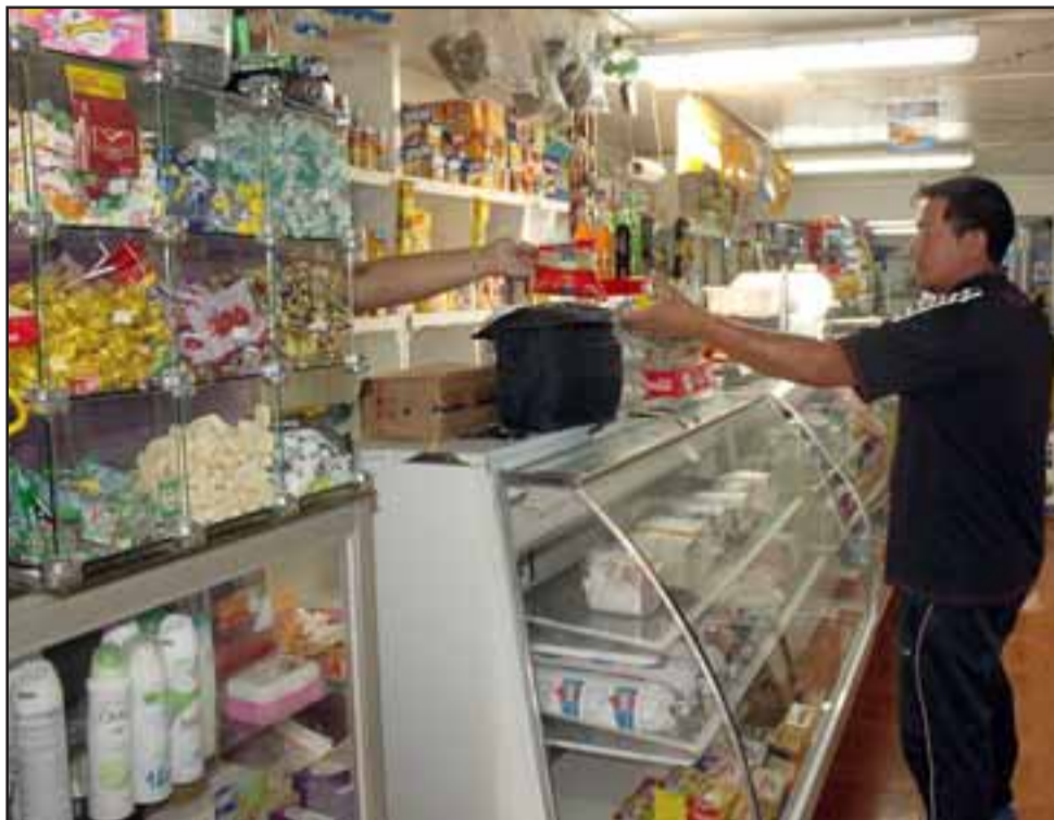
HAY QUE SEGUIR.- A pesar de lo ocurrido, los vecinos siguen dando preferencia a este pequeño local ubicado en El Escorial de Panquehue.

A través de un perfil falso de Facebook: