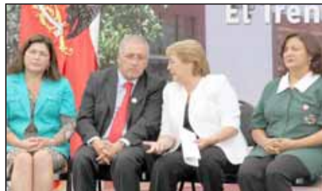
El edil se mostró conforme con el compromiso que hizo la Presidenta para enfrentar la sequía que afecta a todo el Valle de Aconcagua

Para el alcalde Reyes, la Presidenta Bachelet, ciertamente, tiene la capacidad de gestión para garantizar que no se retrasen las obras del embalse. “Me indicó personalmente que hablará con su Ministro de Obras Públi-