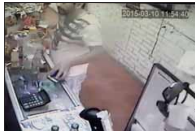
PATUDO Y MEDIO.- Este es el instante exacto del robo, el delincuente fingía ser un cliente, pero desde el principio sus intenciones eran otras.

Roberto González Short rgonzalez@eltrabajo.cl