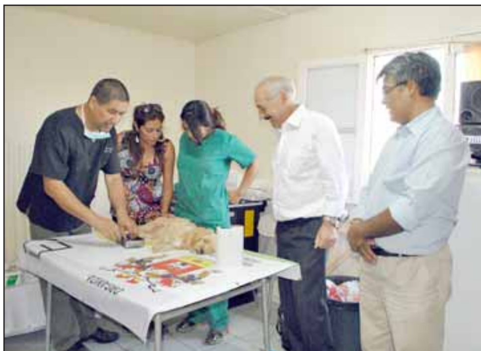
El Alcalde Patricio Freire llegó hasta el sector La Quebrada, donde numerosos vecinos llevaron sus mascotas para ser esterilizadas y desparasitadas.

“Estamos contentos por el inicio de manera concreta de esta iniciativa, especialmente conociendo la realidad que existe en relación a los perros en la comuna. El objetivo es reali-