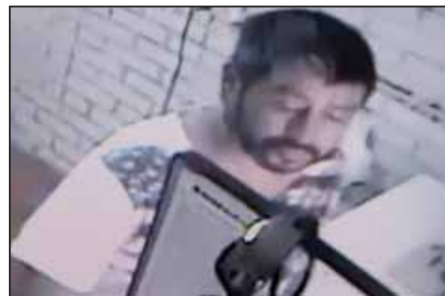
LA CARA DEL CRIMEN.- Memorizar esta cara podría ayudarnos a evitar ser víctimas de este descarado ladrón.