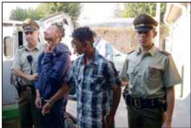
Los adolescentes fueron capturados por Carabineros en horas de la madrugada de ayer jueves en flagrancia cometiendo un delito de robo que fue frustrado.

Cuatro adolescentes, entre ellos un menor de edad, fueron detenidos por Carabineros en los momentos que pretendían ingresar a robar hasta el local de repuestos de vehículos y taller mecánico ‘El Chihuahua’ ubicado en avenida Maipú esquina Merced de San Felipe, quienes tras ser descubiertos intentaron eludir el control policial.