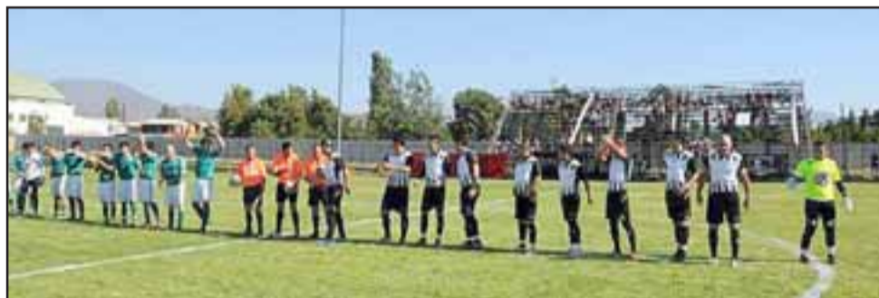
Colo Colo Farías y Santa Clara de San Esteban, cerrarán una de las lveves más atractivas de la segunda fase de la Copa de Campeones.

Nacional (Quillota) – Deportivo Gálvez (Rinconada); O'Higgins (La Calera) – El Roble (Llay Llay); Santa Rosa (Catemu) – Santa Rosa (Santa María); Quintero Unido – Peñarol Reinoso (Catemu).