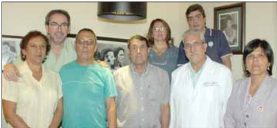
RESPALDO.- Varios directivos de Fenats Aconcagua junto al Secretario Fenats, en señal de apoyo incondicional a sus denuncias.