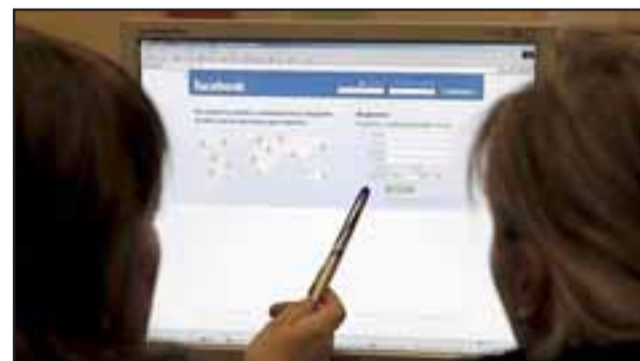
A través de esta red social, desconocidos ofrecieron los enseres de una casa en Putaendo, lo que provocó que diversos interesados se acercaran a la familia.

Pasados algunos minutos no tardaron en aparecer más personas desde sectores rurales que también llegaban en camionetas ante la generosa oferta publicitada a través de la