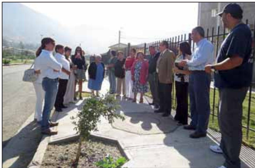
Como vemos, estas tres inauguraciones corresponden a reposición y mejoramiento de veredas y luminaria para beneficio de todos los llayllayinos.