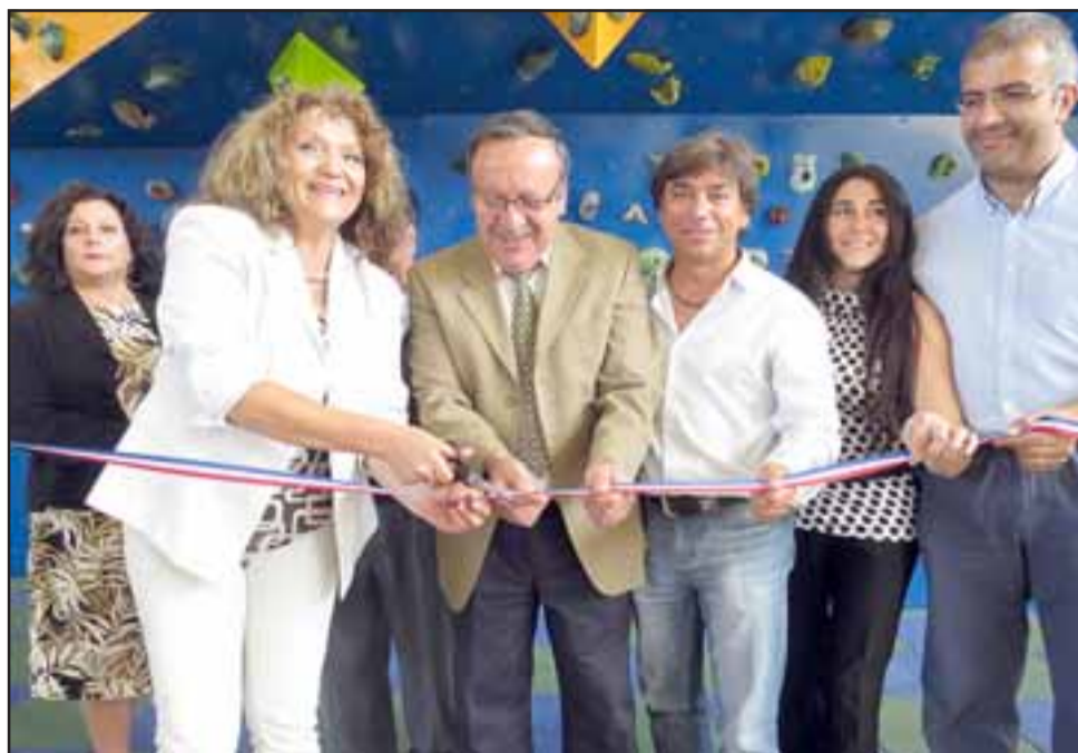
Estas mejoras culminaron con una ceremonia y posterior corte de cinta en el Gimnasio Municipal de la localidad.