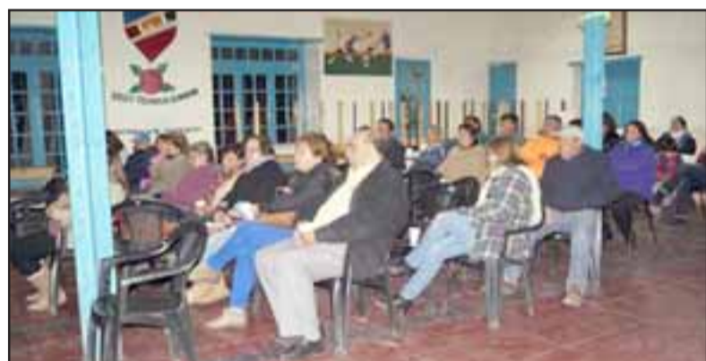
Cabildos ciudadanos será una de las opciones que barajan las autoridades de la comuna para vincular a los vecinos en lo que significará la construcción del embalse Pocuro Alto.

va y con participación de todos los actores la implicancia que tendrá la eventual construcción del embalse Pocuro Alto. Así quedó establecido en