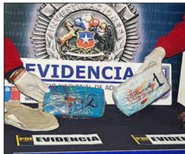
El joven fue detenido en un procedimiento de control corporal que permitió decomisar más de 2 kilos de marihuana prensada que el imputado llevaba adosado a su cuerpo.

No obstante, el joven registra permanentes salidas e ingresos a territorio nacional por el paso Cristo Redentor desde el mes de octubre de 2014, por lo que no se descarta que en otras ocasiones haya internado droga, manteniendo contactos con proveedores en la ciu-