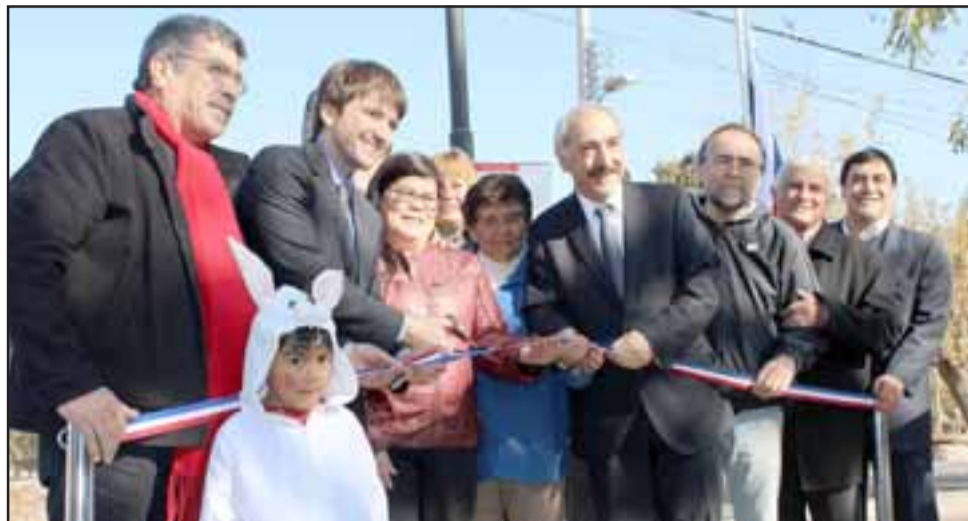
Autoridades y vecinos realizan el tradicional corte de cinta que da por inaugurado el mejoramiento del Camino Los Molles.