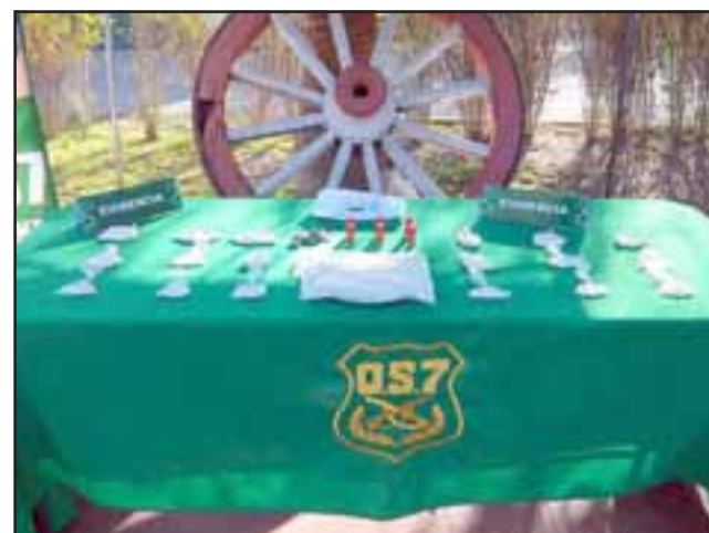
Personal de OS7 de Carabineros retiró de circulación más de 5.000 dosis de pasta base de cocaína y marihuana que serían comercializadas desde una vivienda ubicada en la Villa Los Viñedos de la comuna de Santa María.

Ante esta decisión, la Fiscalía apeló verbalmente ante