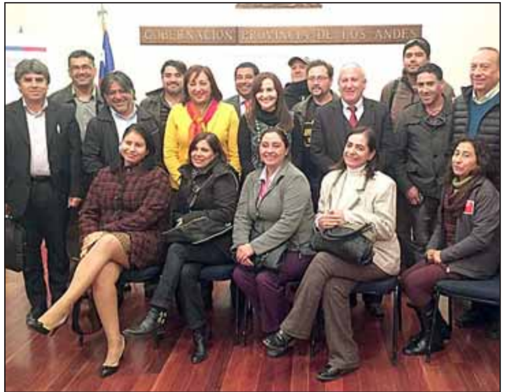
En reunión con la gobernación andina y junto a representantes de sindicatos de trabajadores de la zona, se reunió la Seremi del Trabajo para explicar los aspectos de la nueva normativa laboral que trae la reforma.

«Se compromete a que sea parte de los temas de la