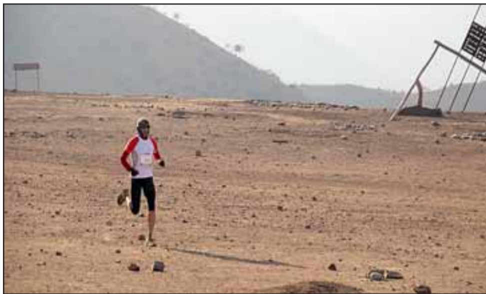
Ni el frío y lo extenuante de la prueba evitó que gran cantidad de corredores participaran de este acontecimiento deportivo.

El evento organizado por Latitud Sur Expedition y contó con la participación de corredores extranjeros,