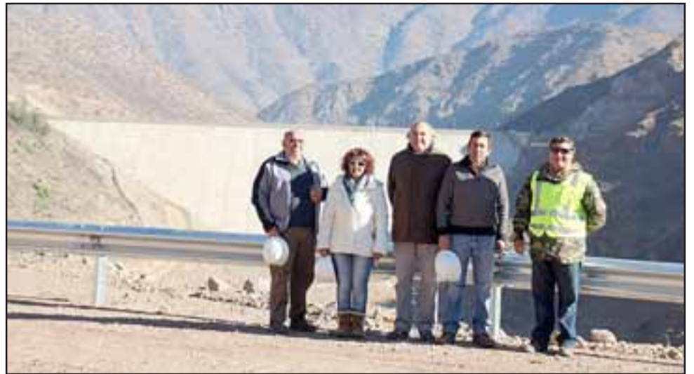
Una comitiva conformada por el directorio de la Junta de Vigilancia del Río Putaendo, visitó el Embalse Chacrillas, el que será inaugurado a mediados de julio por la Presidenta Michelle Bachelet.