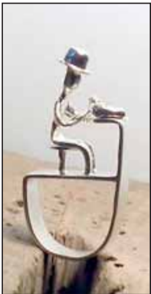
ANILLO DE ZAPATERO.- El oficio de zapatero en este anillo, está reflejado en esta pequeña figura del anillo.