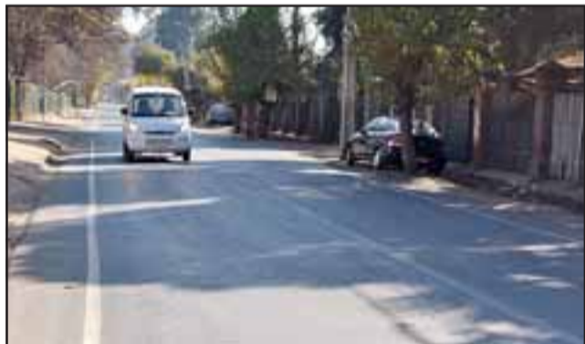
En muy buenas condiciones quedó esta arteria de acceso a San Felipe.