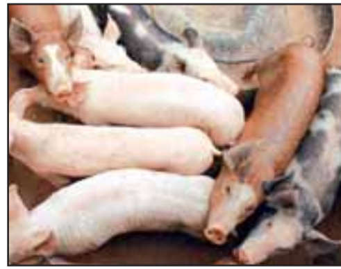
VENTA DE CERDOS.- Inició su empresa con un cerdito prestado, gracias a ese inicio, ella pudo dar un futuro a sus hijos y trabajo a su familia.