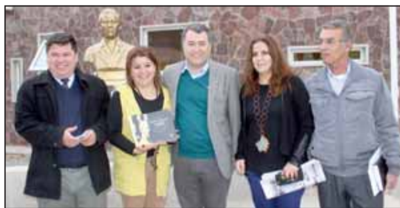
La Directora Regional de Cultura junto a autoridades de la provincia, en una visita destinada a conocer los nuevos proyectos que existen en torno a la cultura.

por el diseño y comodidad que entrega a la comunidad lectora y luego visitaron la radio comunitaria que se encuentra al costado del re-