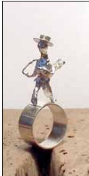
ANILLO DE HUASO.- Este en cambio, es un anillo con la figura de huaso, muy solicitado por algunos huasos de la zona.