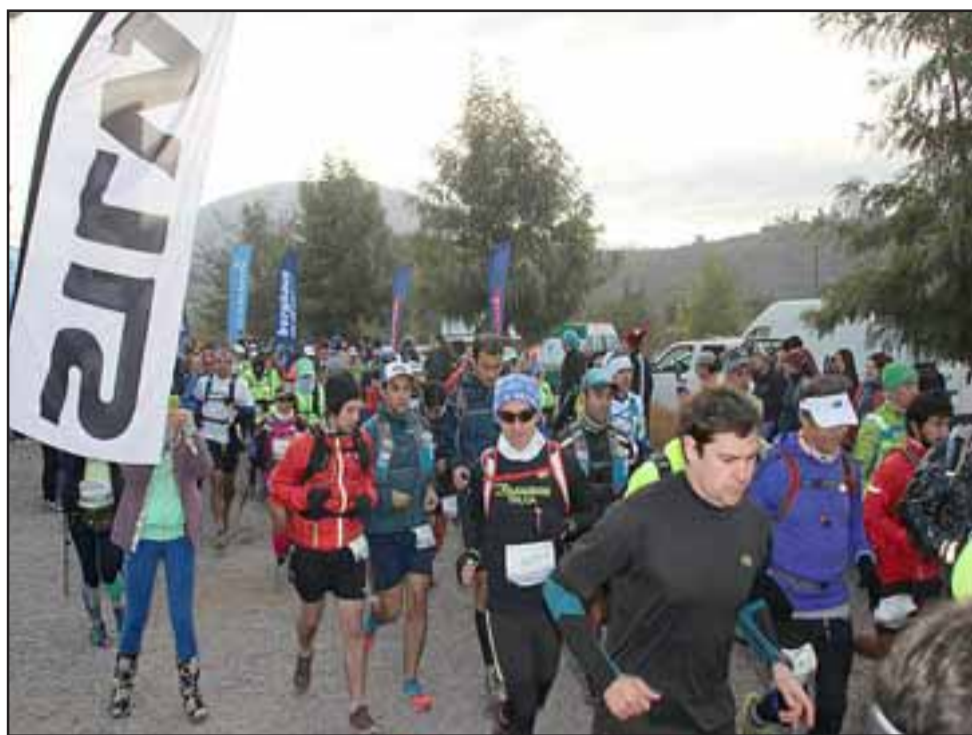
El Trail Running 2015, organizado por Latitud Sur Expedition, en esta versión contó con una masiva concurrencia de participantes, resultando todo un éxito.

locales y de diferentes partes del país, convirtiéndose en todo un éxito y en el gran evento deportivo del año en la comuna de Putaendo, que nuevamente acogió el Trail