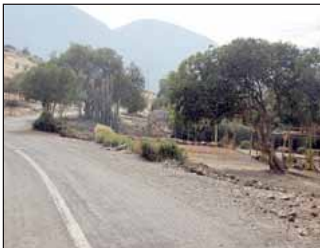
El falso brujo se atendería a sus víctimas en su domicilio ubicado en el sector de La Peña.