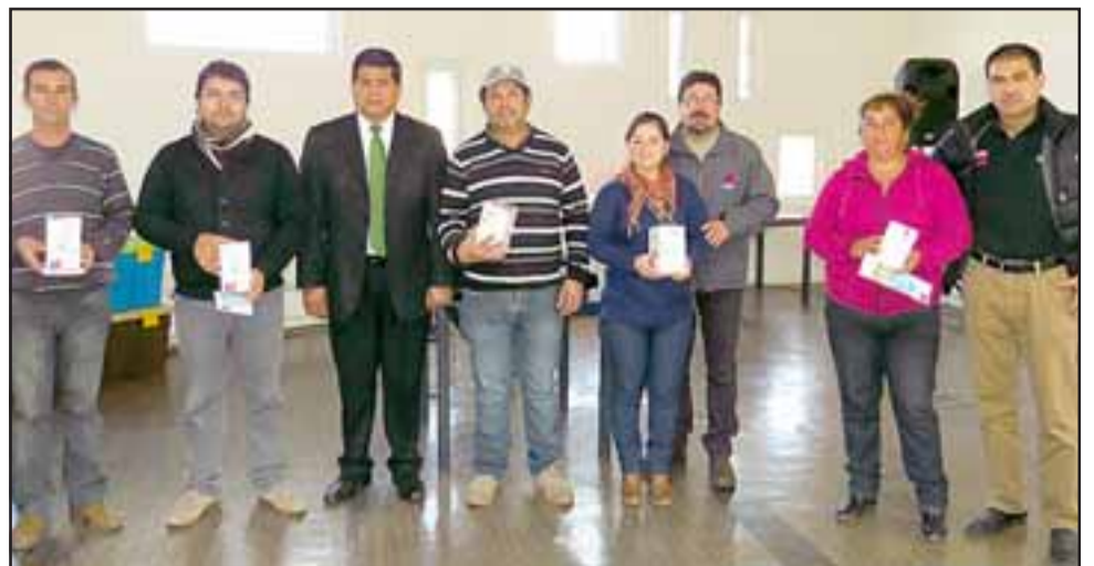
Fueron 158 vecinos los beneficiados con este kit de ampolletas de eficacia energética en la comuna de Santa María.