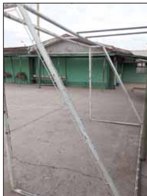
Empotrar los arcos fue una de las mejoras que se realizaron en la Escuela John Kennedy, arreglos financiados con actividades propias y también con apoyo de la Daem y el municipio.

La directora resaltó que la Daem ha satisfecho las necesidades de la Escuela