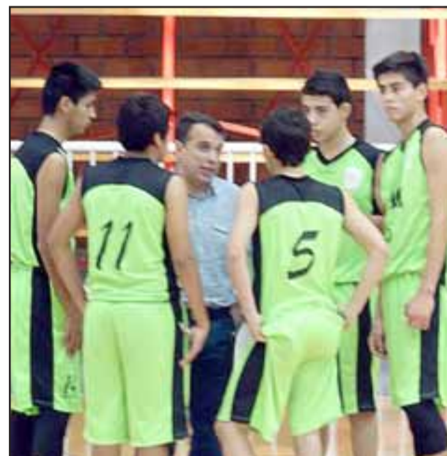
Buenas actuaciones cumplieron el Prat y San Felipe Basket en la pasada fecha de la Libcentro.