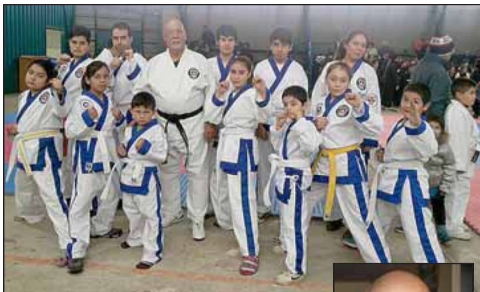
IMPARABLES. - Ellos son los karatecas más activos de nuestra provincia, y quienes el domingo hicieron morder el polvo a más de algún adversario en La Liga.

«Las categorías que estaremos disputando en este campeonato son: Kumite al punto; Kumite Light Contact; Formas chinas; Katas japonesas y co-