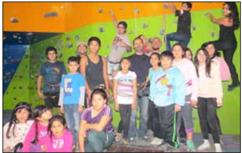
Cerca de 20 niños disfrutaron de clases de escalada en el Gimnasio Municipal de Llay Llay.

Además, de las clases de Escalada; la Oficina del Deporte tiene dos actividades deportivas adicionales: Clases de Aerobox y de Voleibol.