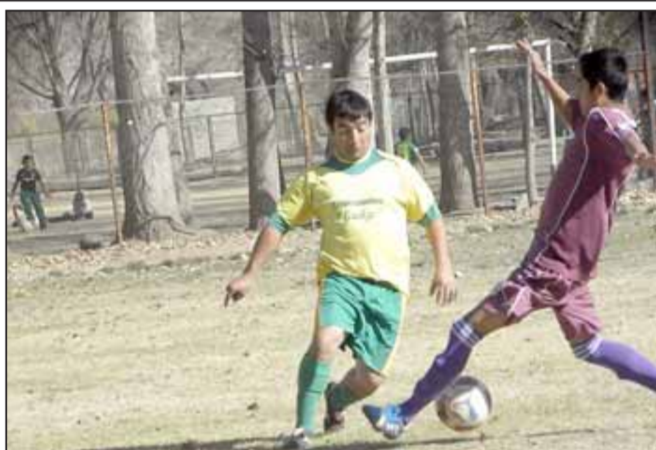
El actual torneo de la Asociación de Fútbol Amateur de San Felipe ha sido normal en su desarrollo además de contar con partidos intensos y al mismo tiempo, muy emotivos.