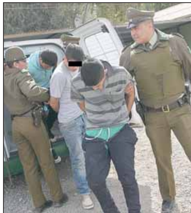
La banda delictual estaba compuesta por un adulto de 23 años, dos menores de 16 y un niño de sólo 12 años.