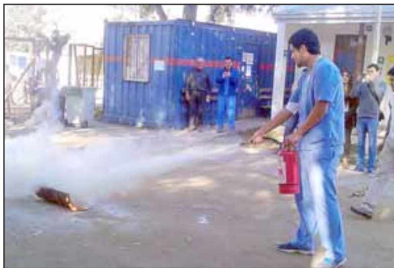
Los funcionarios del Cefsam de Panquehue fueron capacitados en manejo de emergencias, como lo fue el uso de extintores.

Para nosotros la realización de este tipo de actividades son importantes y satisfactorias, pues los funcionarios se mostraron muy contentos de poder recibir una charla de seguridad y el tema más importante para ellos, fue saber utilizar el extintor".