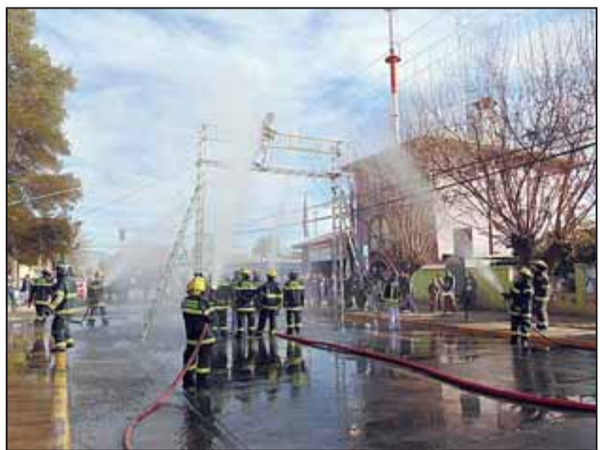
En la celebración también hubo demostraciones con los equipos de Bomberos.

“Como presidente del Consejo Regional de Bomberos agradezco a todos los hombres y mujeres que for-