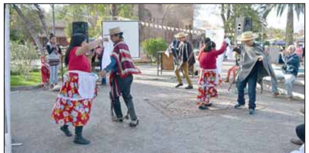
Durante la mañana del sábado, diversas autoridades participaron el primer Festival de la Amistad y la Inclusión Social, llevado a cabo por los usuarios del Hospital Psiquiátrico Dr. Philippe Pinel pertenecientes al Centro Diurno de Rehabilitación.

En la ocasión además se realizó una pequeña feria, talleres para los niños y exposiciones de los trabajos