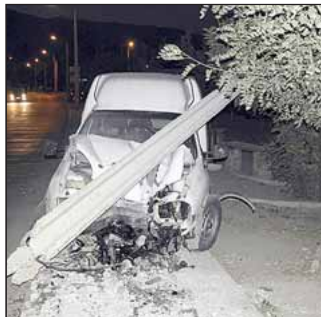
Vecinos del sector afirmaron que los ocupantes habrían salido por sus propios medios desde el automóvil, dándose a la fuga.

No obstante, con posterioridad en la Tenencia de Carabineros de Calle Larga se recibió una denuncia por el supuesto robo del furgón, situación que deberá ser verificada.