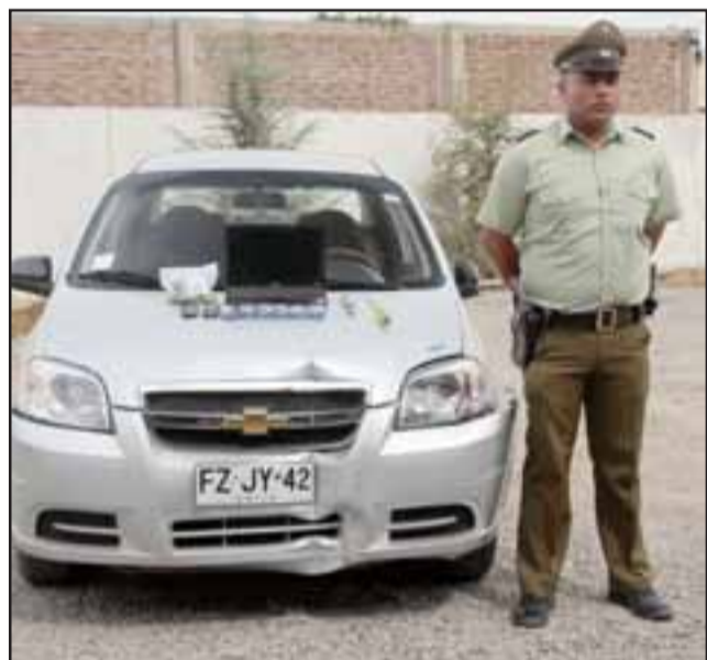
La pandilla utilizó este vehículo para cometer los delitos. En la fotografía Carabineros exhibe el destornillador y el cuchillo que los antisociales utilizaron para amenazar de muerte a las víctimas. Las especies lograron ser recuperadas y devueltas a sus propietarios.