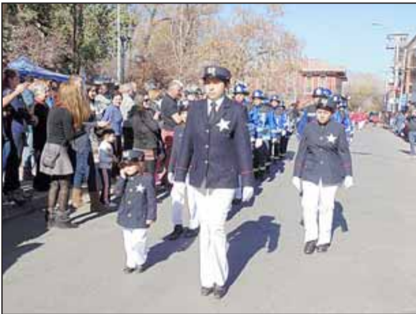
En la conmemoración se realizó un desfile con las seis compañías más las unidades del Cuerpo de Bomberos de Rinconada.

man parte de la institución, por su esfuerzo y preocupación que tienen por crecer, por estar atentos y por deberse a su comunidad. Lo hago extensivo a las familias que están detrás de cada uno, porque sin ellos no somos nada ya que nos respaldan, y nos dan el aliento para continuar en las filas”, agregó.