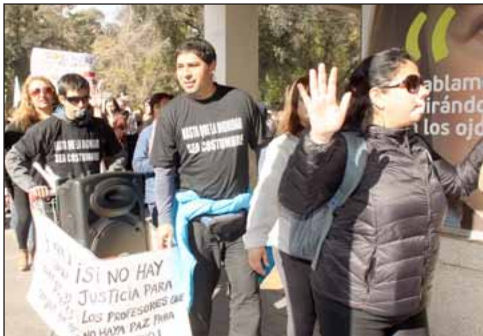
NO HAY TREGUA.- Las protestas en todas las calles de Chile recrudecieron, tal como quedó patentado en San Felipe ayer miércoles en la tarde.

Roberto González Short rgonzalez@eltrabajo.cl