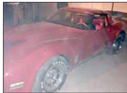
Un conductor de 65 años fue detenido luego de perder el control de su automóvil.

Posteriormente fue dejado en libertad quedando con la medida cautelar de retención de la licencia de conducir por seis meses, no obstante que se fijó un plazo de investigación de 120 días.