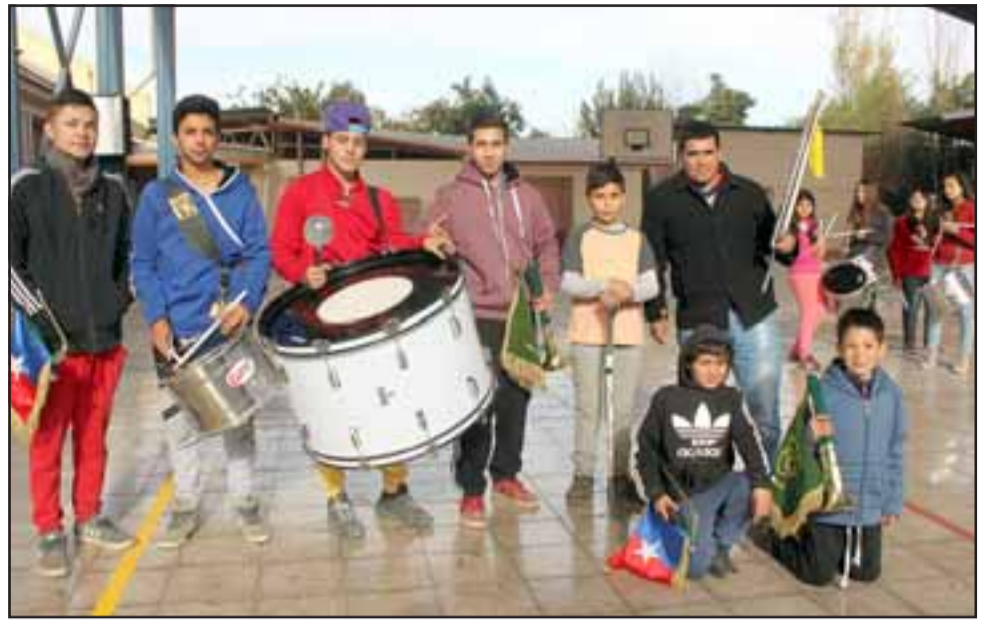
LOS CAMPEONES. - Ellos son los jóvenes estudiantes del Darío Salas, quienes este mes defenderán su título frente a 15 bandas más.