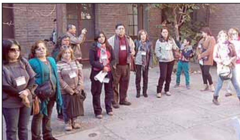
Cerca de cuarenta personas fueron certificadas como informadores gracias al primer curso para Informadores Turísticos de Los Andes.

Arellano instó a los participantes a seguir capacitando con una activa presencia en terreno, para que la ciudadanía se motive y se forme una verdadera conciencia turística y una verdadera alianza con el sector público y el empresariado.