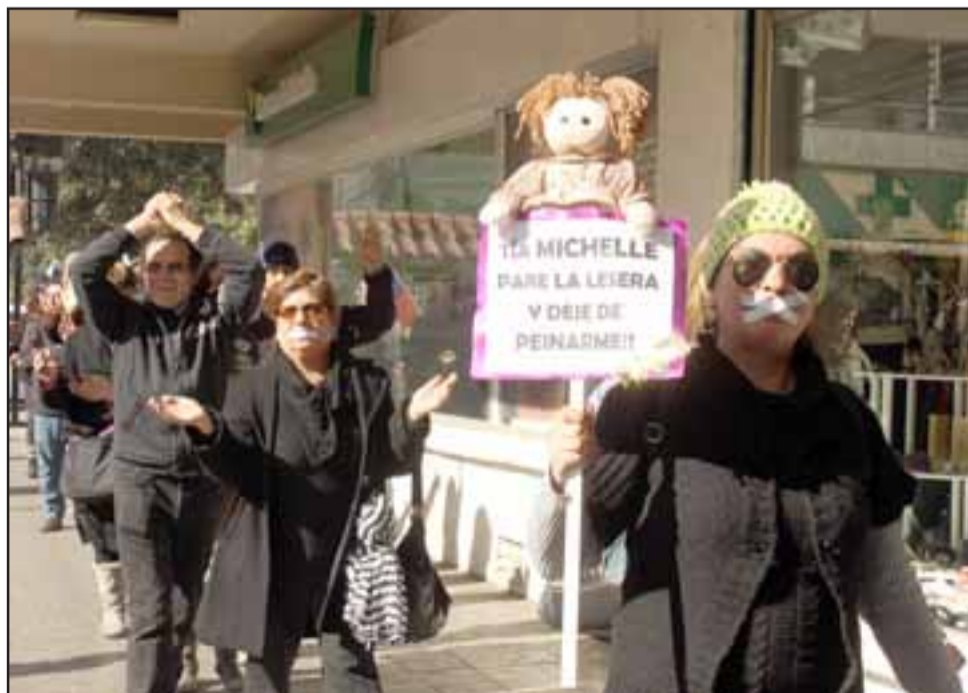
PIDEN DIÁLOGO.- Los profesores abogan a la comprensión y hacen un llamado a esta nueva ministra, para que restablezcan el diálogo.