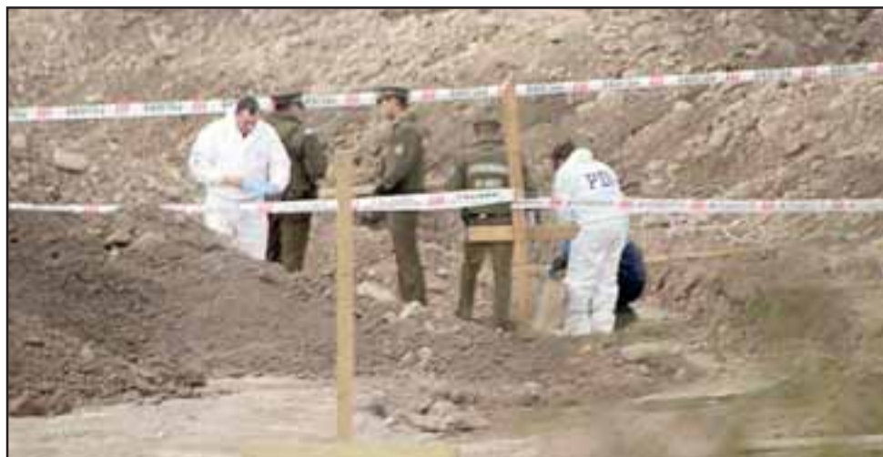
En el sitio del suceso se habrían encontrado algunos molares y pequeños fragmentos de huesos .

El Comisario Gutiérrez confirmó que en base a los antecedentes recopilados en