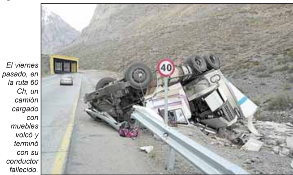
El viernes pasado, en la ruta 60 Ch, un camión cargado con muebles volcó y terminó con su conductor fallecido.

Además, el tribunal estableció un plazo de investigación de cuatro meses, período en el cual el Ministerio Público deberá acreditar las pruebas suficientes sobre la participación de los imputados en este ilícito.