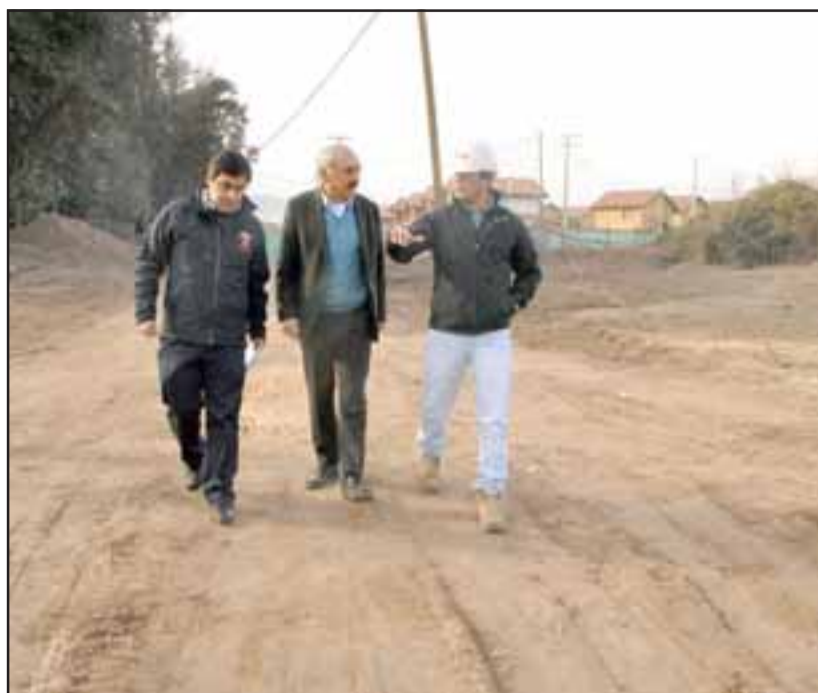
El martes pasado, el alcalde Patricio Freire realizó una visita a las obras de pavimentación de la calle El Convento en el sector de La Troya, con la calle Costanera en la población Juan Martínez de Rozas.

El proyecto contempla una inversión superior a los 215 millones de pesos, cuyos recursos provienen del Fondo Nacional de Desarrollo Regional, FNDR y su ejecución permitirá entregar continuidad de flujo a los vecinos, mejorando así la gestión de tránsito, destacando como una iniciativa que se ha desarrollado de manera íntegra durante la gestión del alcalde Frei-