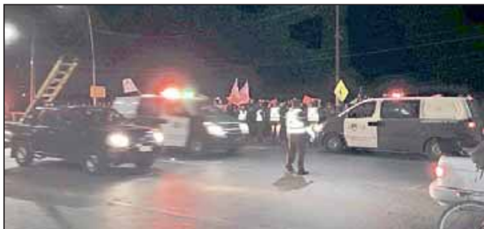
A primeras horas de ayer miércoles un grupo de cincuenta profesores se manifestaron en medio del Puente El Rey, provocando cortes de tránsito por algunos minutos, debiendo intervenir Carabineros que detuvo a cuatro docentes por desórdenes públicos.