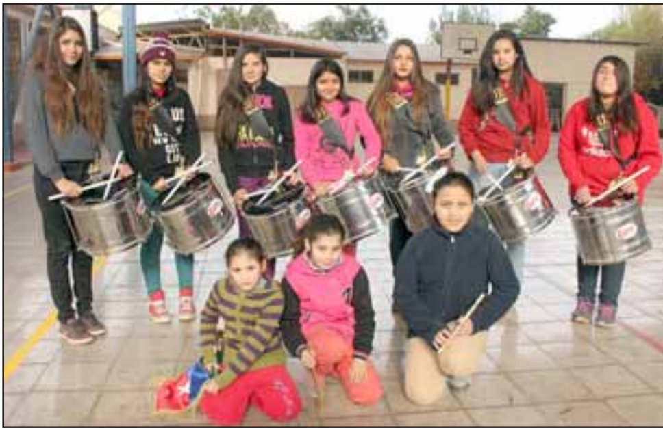
CHICAS IMPARABLES. - Ellas también son parte de la mejor banda escolar de la V Región años 2014.