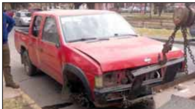
La camioneta fue recuperada por Carabineros gracias a un llamado anónimo al 133 que alertaba el desmantelamiento.