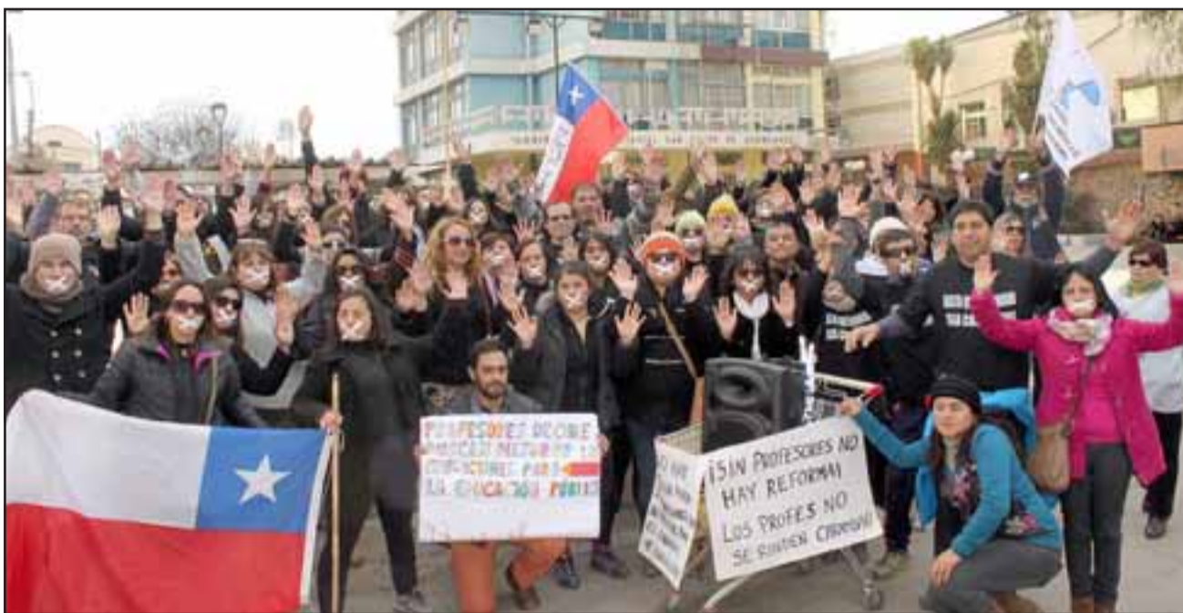
SIGUEN PROTESTAS.- Más de 60 profesores de nuestra provincia renovaron sus protestas en las calles de San Felipe, esta vez, sin proferir palabra.