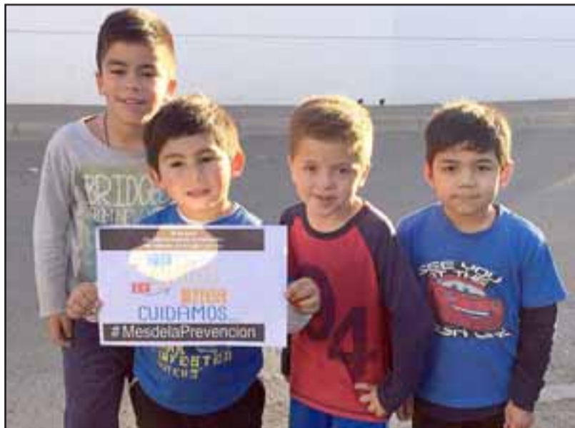
Senda Previene de Panquehue, en colaboración con el Cesfam, realizó una feria donde entregó información sobre las drogas y material preventivo.

El Día Internacional de la Prevención del Consumo y Tráfico de Drogas, es una fecha establecida en 1987 por la Asamblea General de las Naciones Unidas, con el fin de fortalecer las actividades necesarias para alcanzar el objetivo de una sociedad internacional libre del consumo de drogas.