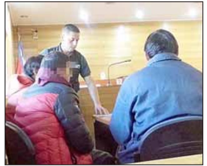
Fueron detenidos tres trabajadores, uno de ellos funcionario de la Dirección de Vialidad, por el delito de hurto luego de que habrían sustraído especies desde un camión cargado con muebles que había volcado.

Por ello, el funcionario de vialidad renunció a su derecho a guardar silencio y declaró en audiencia que él junto a los otros dos tra-