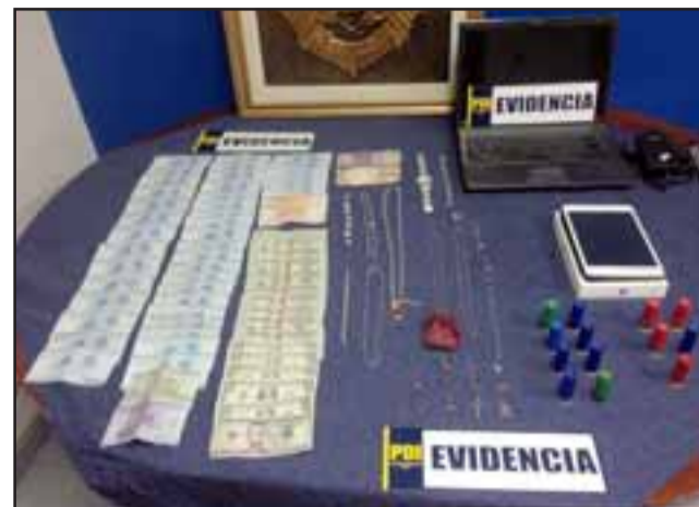
Una gran cantidad de joyas y dinero en efectivo en moneda nacional y extranjera, entre otras especies, fueron recuperadas por los efectivos del Gebro de la PDI, logrando resolver dos robos cometidos hace unas semanas en la comuna de San Felipe.

El Jefe de la Gebro destacó estos procedimientos que en definitiva resuelven a corto plazo los robos pro-