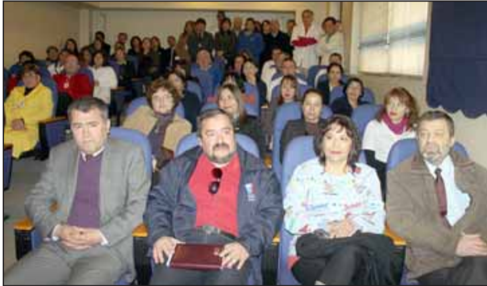
Varias autoridades provinciales y de Salud, acudieron al acto protocolario de Cambio de Mando.

la institución de lograr una completa remodelación de sus instalaciones dentro del corto plazo.