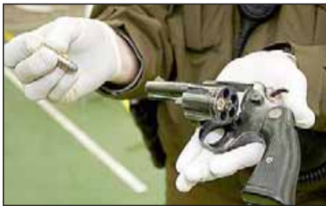
Carabineros formalizó a sujeto que mantenía en su domicilio un revólver calibre 38 con su respectiva munición.

LOS ANDES.- Como parte de las acciones para frenar episodios delictuales y de tráfico de drogas, la Brigada Antinarcóticos detuvo en el sector del Barrio La Concepción (Ex Pucará) a un sujeto de 24 años que mantenía en su domicilio un revólver calibre 38 con su respectiva munición.