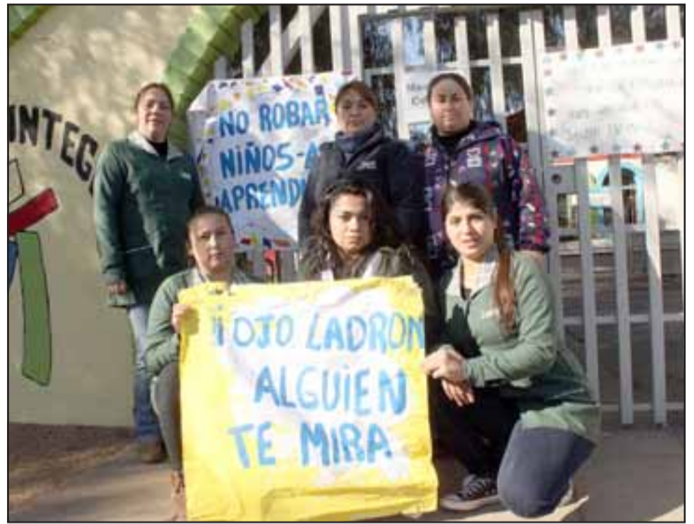
NO MÁS ROBOS.- Varias parvularias y apoderadas del Jardín Infantil Hormiguitas de Aconcagua, mostraron a Diario El Trabajo su indignación por los frecuentes robos en su jardín.

Este centro infantil sólo en el mes de julio de 2013, fue visitado siete veces por los amigos de lo ajeno, en lo que va de 2015 ya han sido varias los robos cometidos. Roberto González Short rgonzalez@eltrabajo.cl