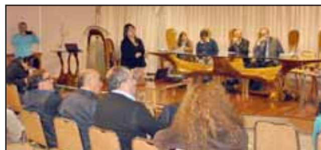
En una reunión se dieron a conocer los detalles del proceso de implementación del Plan de Gestión de Tránsito, que desarrolla el municipio con respaldo de Sectra y la Seremi de Transportes.

munal manifestó que para la comunidad el desarrollo de este mega proyecto reviste enorme importancia, tomando en cuenta factores como el aumento del parque vehicular en la comuna, el carácter que tiene esta ciudad de servicios y cabecera de provincia, pero sobre todo, por la necesidad de avanzar hacia una mejor calidad de vida de los sanfelipeños y sanfelipeñas.