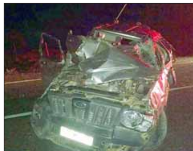
El conductor resultó sólo con contusiones craneanas leves luego de volcar su camioneta producto de unas piedras que había en la calzada.

Afortunadamente, el conductor identificado