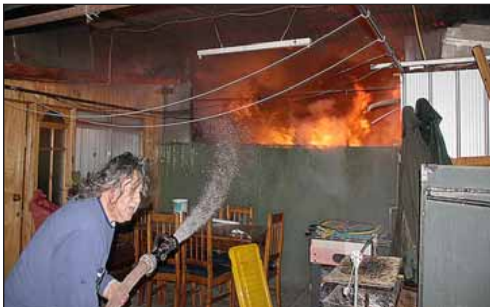
El rápido actuar de vecinos que incluso tomaban las mangueras para detener el avance del fuego, ayudó a que el siniestro no se propagara hacia las otras viviendas.