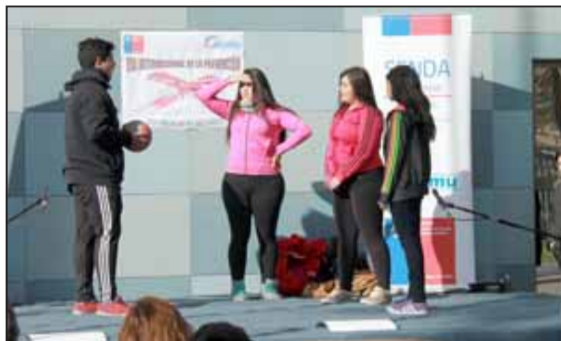
Estudiantes del Colegio California presentaron una obra de teatro que buscaba evidenciar los daños que provoca el consumo de drogas.

Luego el Colegio California presentó una obra de