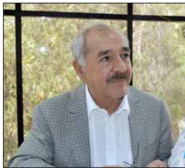
Alcalde Patricio Freire.

Ese proceso tiene el acompañamiento municipal a través del Departamento de Organizaciones Comunitarias, que está de manera permanente, guiando y resguardando que todo se realice ajustado a la normativa.