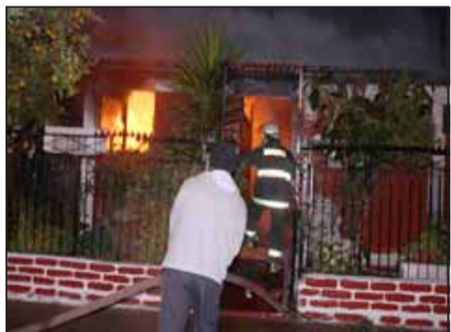
Rápidamente las llamas se propagaron a una vivienda contigua por el entretecho, mientras por atrás de la propiedad un tercer domicilio estaba siendo alcanzado por el incendio.