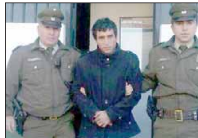
En el mes de mayo de 2014 Carabineros de la Tenencia de Catemu logró capturar al 'Púa', luego de asaltar a un menor a quien apuñaló en una de sus piernas, quedando desde esa fecha en prisión preventiva.

Carabineros entrega recomendaciones para evitar estos delitos: