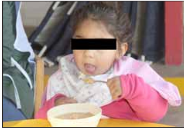
COMER Y CRECER.- Esta pequeñita disfrutaba la mañana de ayer martes, de su colación tranquilamente, sin sospechar siquiera cuantas veces han robado en su jardín.

La idea de estas funcionarias al colocar pancartas en el portón principal del jardín y en los alrededores de la propiedad, es propiamente advertir a los vecinos de la ola de robos en ese lugar, para que también ellos conozcan el problema y den aviso a Carabineros ante cualquier desconocido en el sector o dentro del jardín en