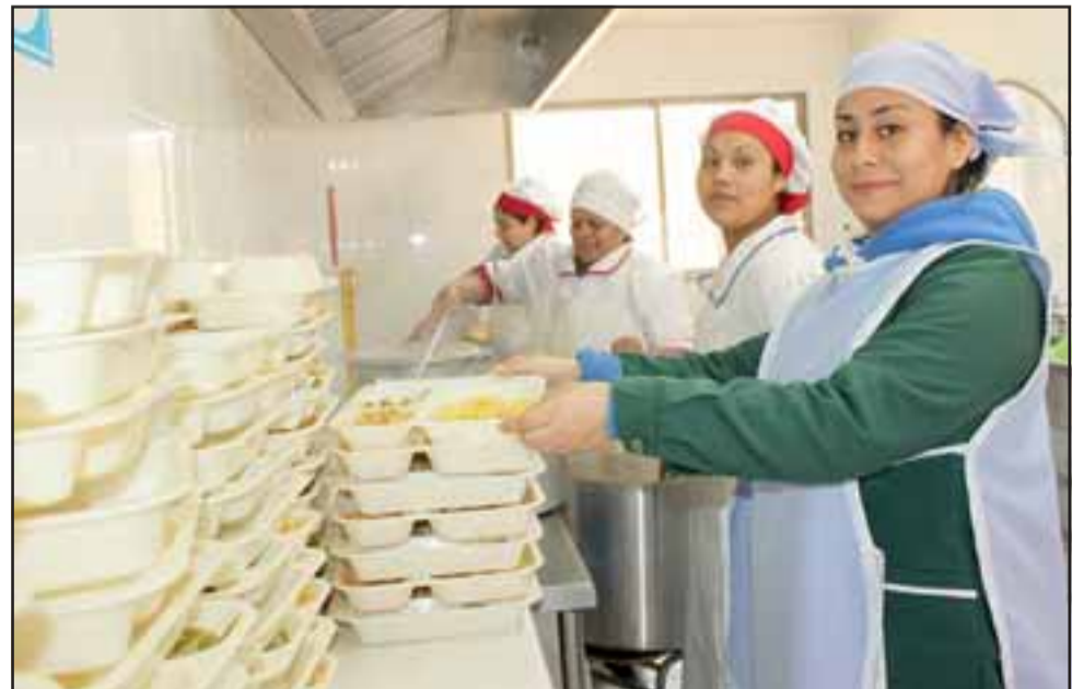
HAY PARA TODOS.- Nuevamente las funcionarias de Hormiguitas de Aconcagua volvieron a preparar los alimentos para sus 220 'hormiguitas'.