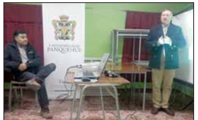
Vecinos de San Roque participaron de manera activa del proceso de audiencias públicas sobre la actualización al Plano Regulador Comunal de Panquehue.

“Yo quedé bien conforme porque los vecinos participaron y se aclararon muchas dudas que tenía la gente en el sentido como íbamos a quedar, las zonas urbanas y rurales y como se nos explicó, cualquier duda que tengamos debemos hacerla llegar al alcalde”.