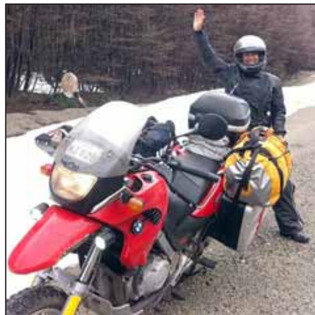
DOCTORA MOTOQUERA.- Así luce esta bella doctora cuando no está atendiendo a sus pacientes, locura sobre ruedas y aventura pura en esta motocicleta.