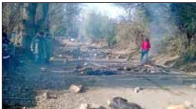
La ruta a minera Amalia en la comuna de Catemu fue bloqueada por los trabajadores.

A partir de la madrugada de ayer martes, un total de 159 trabajadores mineros sindicalizados bloquearon las rutas que conducen hacia la mina Amalia en la comuna de Catemu, iniciando una huelga indefinida con el cese de funciones, exigiendo a la empresa el pago del bono de término de conflicto que persigue una suma de $1.600.000 para cada uno.