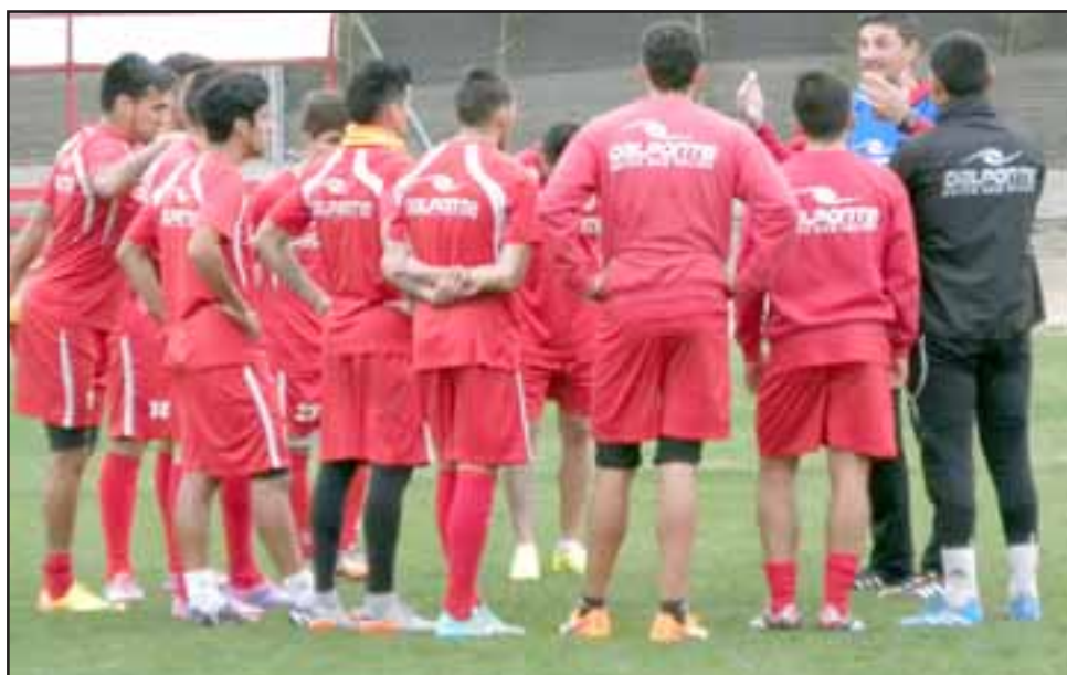
Ayer en la tarde, la escuadra sanfelipeña realizó su última práctica de cara al duelo de esta tarde en la capital ante el líder del grupo 5.