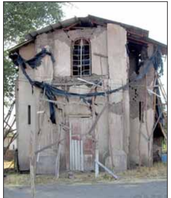
Para la restauración de la Capilla Lo Vicuña, el Gobierno Regional aprobó una inversión de 900 millones de pesos.