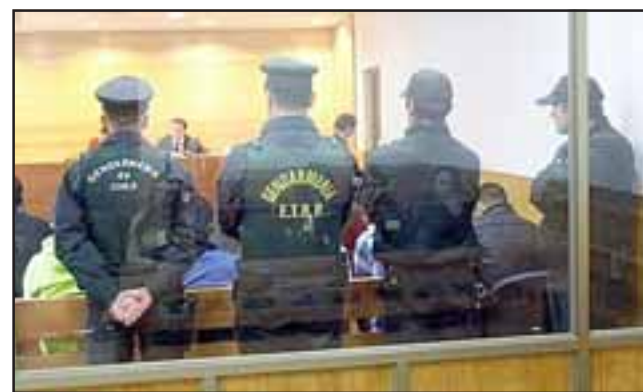
La fiscalía pide presidio perpetuo calificado para los adultos, es decir, 40 años de cárcel y 10 años de libertad asistida para el menor.

Arredondo dijo que fue el menor quien habría propuesto asaltar la caja vecina y en ese momento partieron al lugar, estacionado