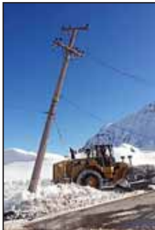
Un incidente con un poste de alumbrado evitó que el camino fuera abierto ayer.

Cabe recordar que hay cerca de 1.500 camiones a ambos lados de la frontera a la espera de poder cruzar la cordillera.