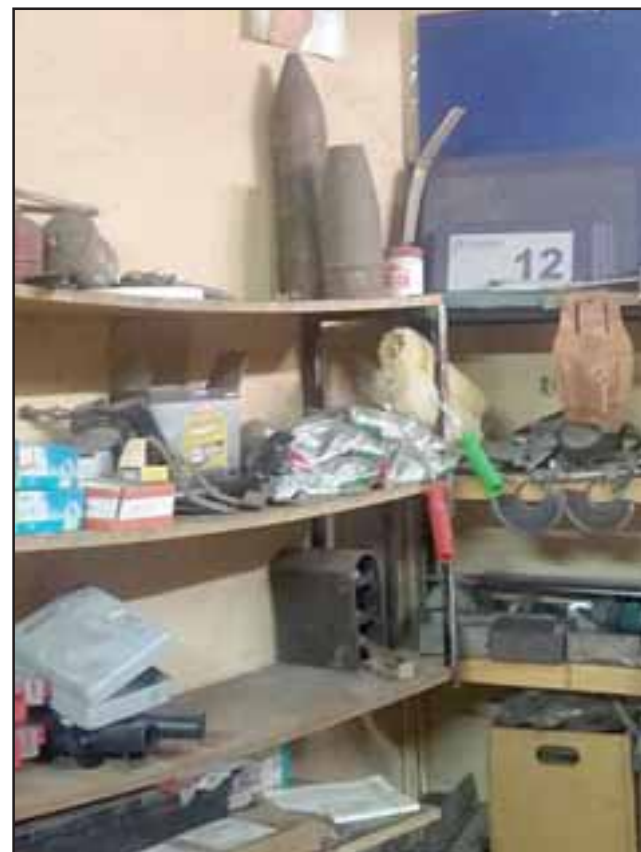
El material bélico se encontraba en una vivienda en la población Pedro Aguirre Cerda en San Felipe.

Capturados por Carabineros de Llay Llay: