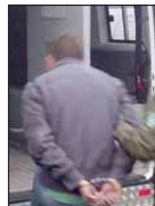
Los imputados fueron capturados por Carabineros de la Subcomisaría de Llay Llay, siendo trasladados hasta el Tribunal de San Felipe para ser formalizados por la Fiscalía que investigará el caso.