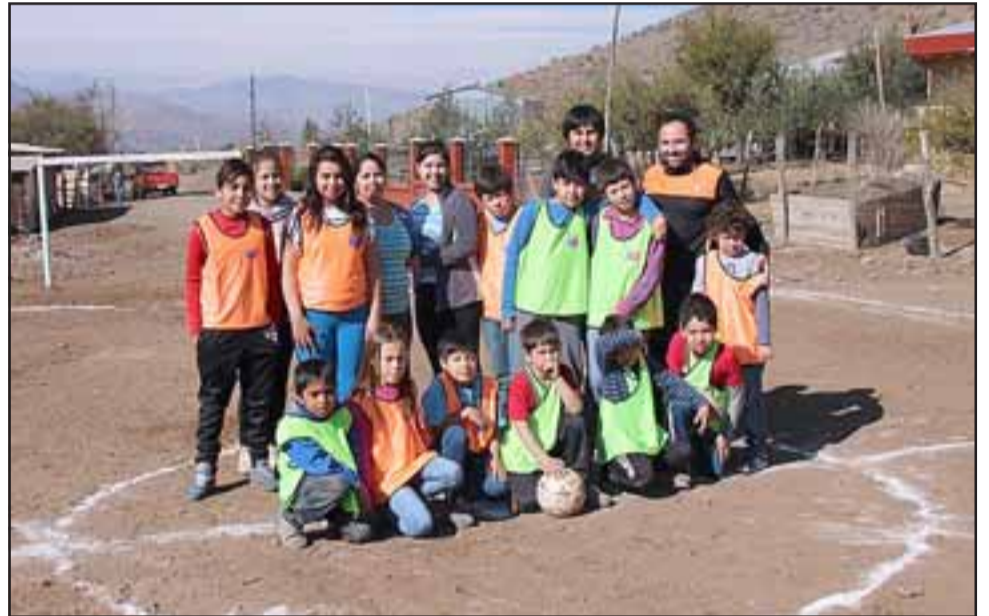
Los más contentos desde luego son los niños y niñas del sector que ya cuentan con una cancha aunque sea de tierra y que ya bautizaron como Juan Pinto Durán.