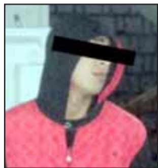
El menor S.A.D.D. (17) cuenta con amplio prontuario.

Efectuando un forado en la techumbre, un adolescente de 17 años de edad irrumpió hasta el interior del Supermercado Santa Isabel ubicado en la intersección de calles Merced con Toro Mazote de San Felipe, con la finalidad de sustraer especies almacenadas en el sector de bodegas.