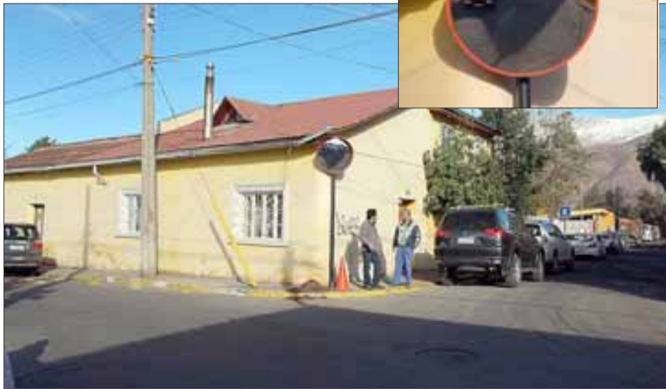
El municipio comenzó a instalar una serie de espejos en el centro de la ciudad para que, tanto automovilistas como peatones, puedan mejorar su seguridad vial.

PUTAENDO.- La Municipalidad de Putaendo ha comenzado la instalación de espejos que permitirán mejorar la seguridad a los conductores de vehículos motorizados que se desplazan por el centro de la comuna.