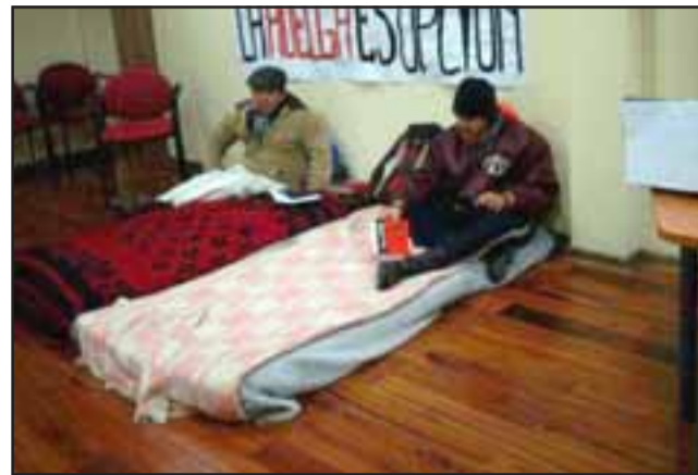
Un alumno de la Upla junto a un profesor en Los Andes comenzaron una huelga de hambre para presionar el retiro total del Proyecto de Carrera Profesional Docente.

"Además, queremos dejar en claro que existirán