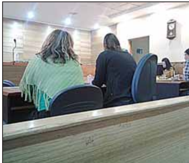
La mujer fue formalizada por maltrato de obra a Carabineros quedando con una medida cautelar de firma mensual en fiscalía.

Al día siguiente pasó a control de detención en el Tribunal de Garantía de Los Andes donde fue formalizada por maltrato de obra a Carabineros y quedó sujeta a la medida cautelar de firma mensual en fiscalía.