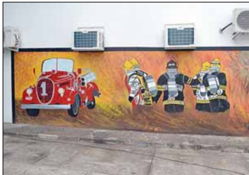
Usuarios del Centro Diurno de Rehabilitación pintaron un mural en el frontis del Cuerpo de Bomberos de Putaendo, que retrata la esforzada labor que realizan los voluntarios.