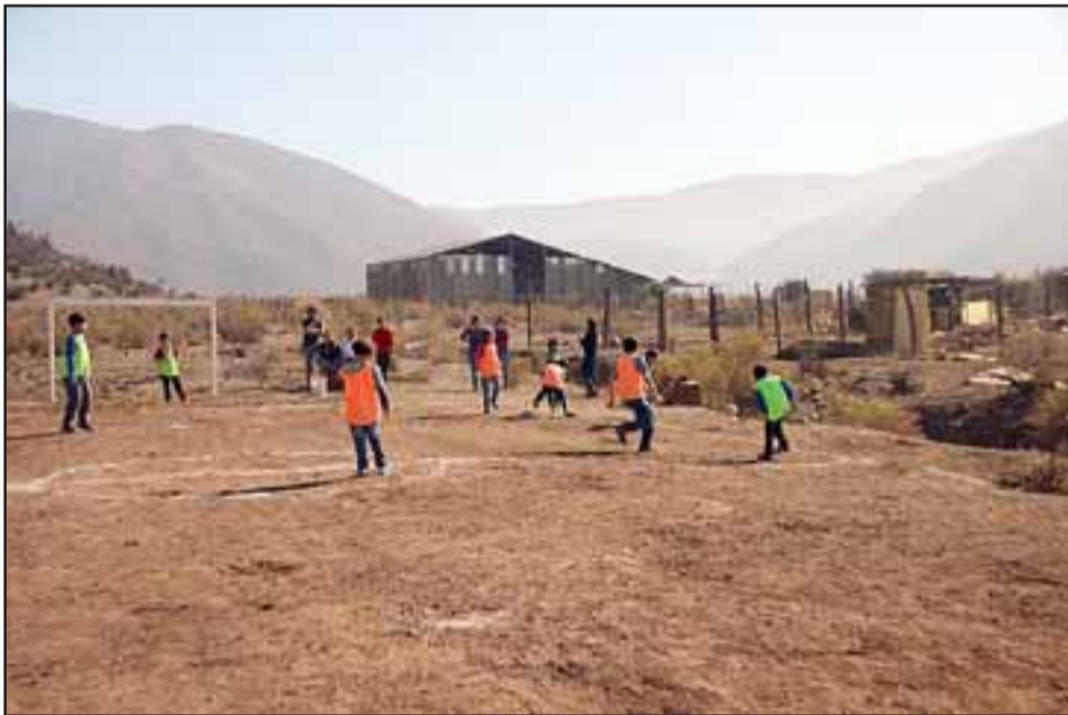
Sin mayor apoyo, vecinas de Guzmanes crearon en la ladera de un cerro una cancha de Baby-fútbol para los niños del sector.