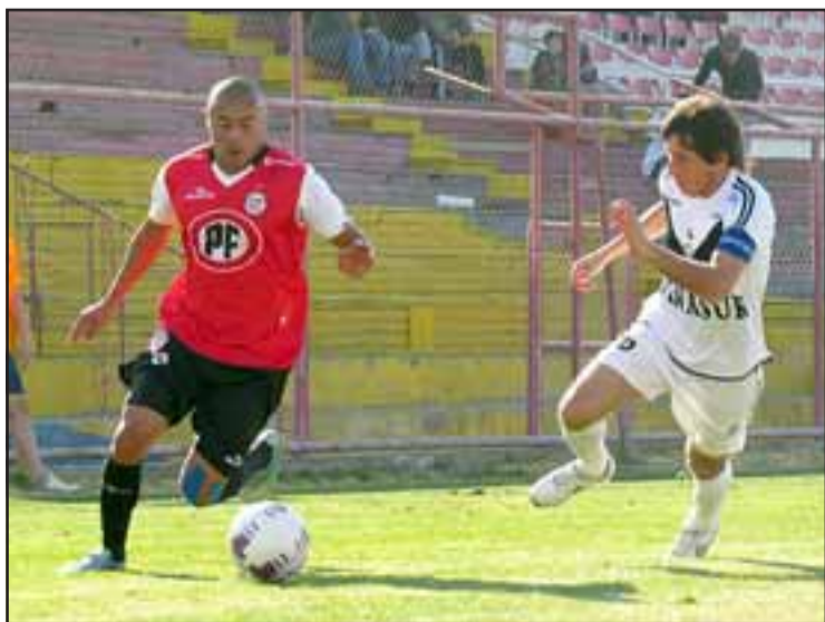
En el Estadio Municipal, un opaco Unión San Felipe cayó sin apelación frente a Santiago Morning.