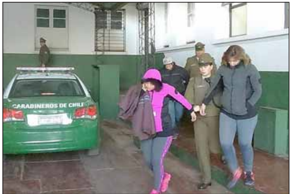
Las imputadas fueron detenidas y puestas a disposición del tribunal y solo una de ellas quedó en prisión preventiva.