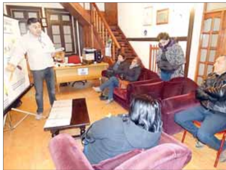
Junto al Consejo de la Sociedad Civil finalizó el proceso de audiencia pública que estuvo realizando el municipio, el que buscaba informar las propuestas de actualización del Plan Regulador Comunal.