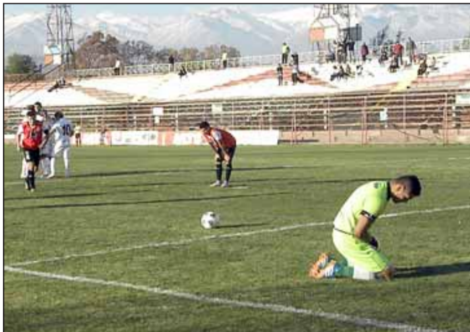
Los forasteros anotaron su tercer gol, mientras los sanfelipeños se lamentan. La imagen refleja el actual momento del Uní en la Copa Chile.

Luis Fernández (SM) Humberto Bustamante (USF)