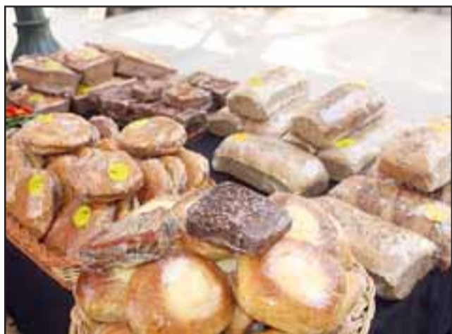
SUS DELICIAS.- Estas son algunas de las delicias que esta pareja de cateminos producen para deleitar a sus clientes y así ganarse honradamente la vida.