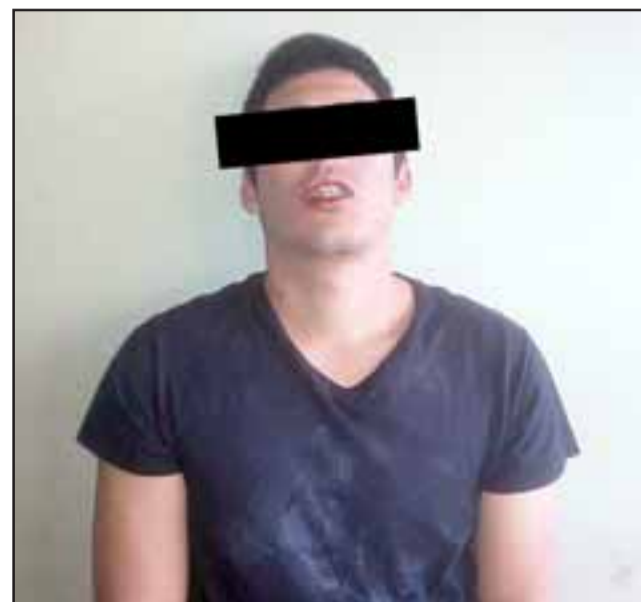
El detenido fue capturado en estado de ebriedad al interior de un pub que minutos antes había sido inaugurado, las cámaras de seguridad indicarían que junto a otros dos sujetos más ingresaron a robar licores en horas de la madrugada del pasado viernes.

"Personal de Carabineros se constituye en el lugar y efectúan una revisión de las dependencias junto con