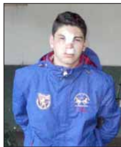
El veinteañero antisocial resultó con fracturas y lesiones graves luego de huir de la acción de Carabineros que lo arrestó tras cometer un robo de especies en Panquehue la tarde noche del jueves.

"Nos proporcionaron las características del vehículo, una información veraz y oportuna en el sentido que había un vehículo estacionado que estaba siendo utilizado para transportar las especies. En esos términos se dispone un control vehicular con las características del automóvil y se inicia una persecución desde la comuna de Panquehue hacia Los Andes, logrando la detención y recuperación total de las especies", expre-