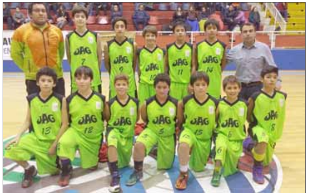
AQUÍ ESTÁ LA U13.- Ellos son los más jóvenes del club, en esta categoría participan chicos desde los once a los trece años.

No se descarta que sea San Felipe y propiamente el