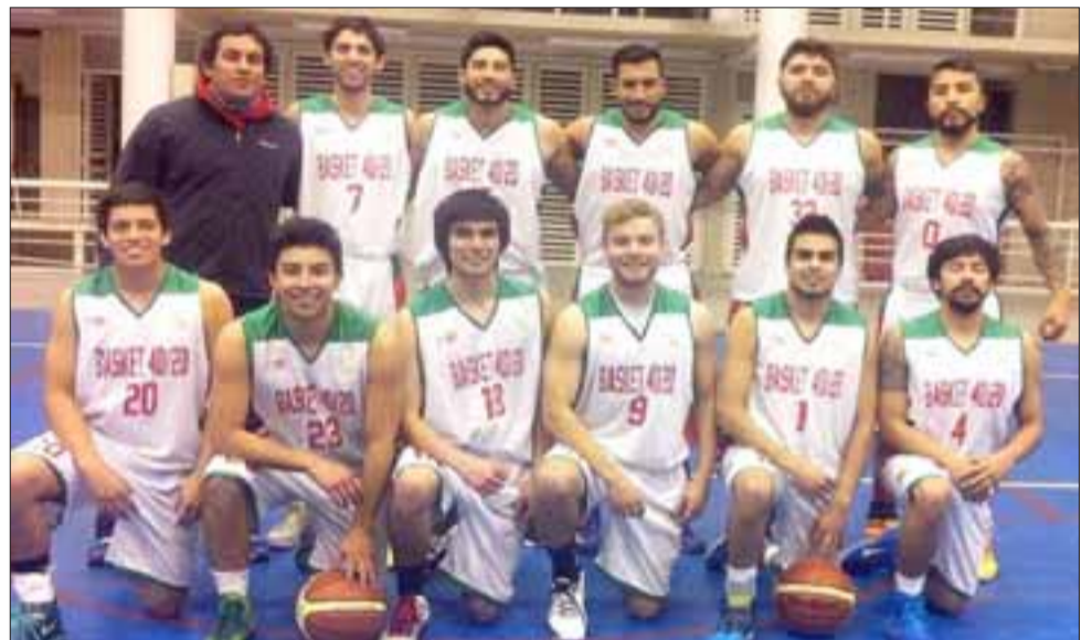
IMPARNABLES.- Los más experimentados se enfrentaron a jugadores profesionales sin ellos serlo, pero sus ganas de triunfar y coraje deportivo, ya los tiene clasificados.

gimnasio del Liceo Mixto, en donde eventualmente se juegan los Play Off, información que aún solo son especulaciones en corrillos deportivos.