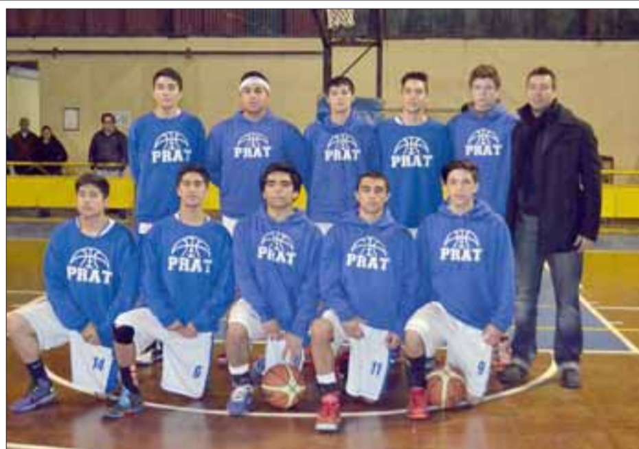
Los Pratinos serán forasteros en la última jornada de la primera parte de la Libcentro B.