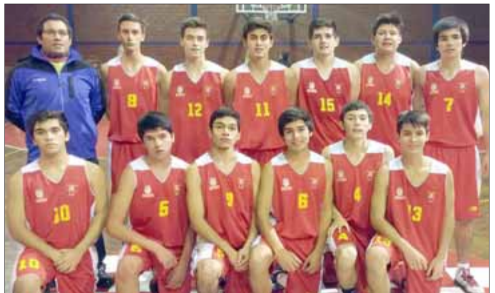
ESTÁN EN SUS 17.- Estos jóvenes en cambio, vienen con todo y son una locomotora dentro del torneo de la Libcentro B.