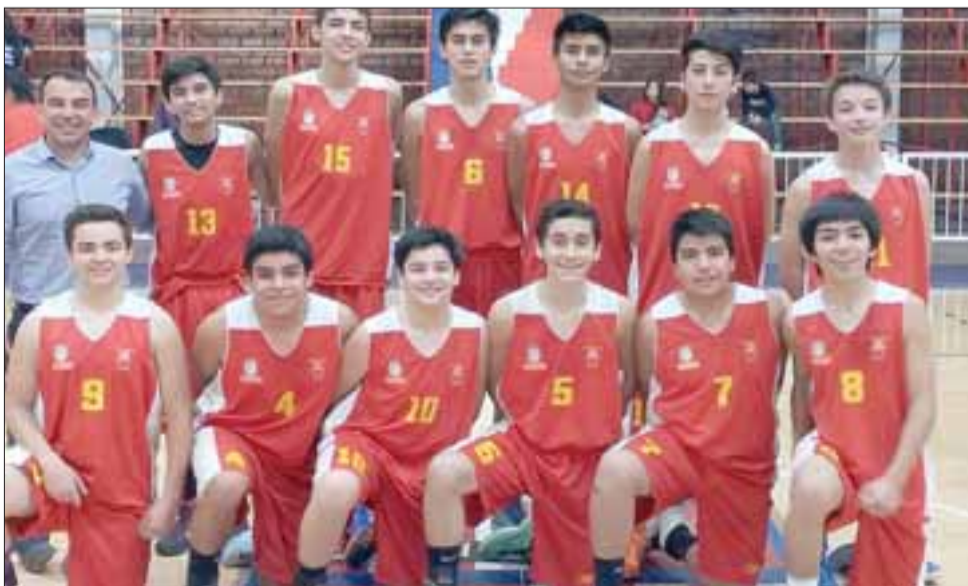
QUINCEAÑEROS.- Los chicos U15 no se dejaron intimidar en este torneo y ya están clasificados a los Play Off de esta jornada.

Roberto González Short rgonzalez@eltrabajo.cl