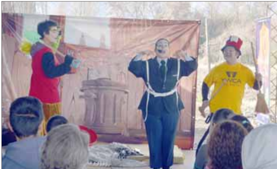
A CARCAJADAS.- Compañía Teatro El Baúl de Valparaíso hizo reír a grandes y a chicos durante esta semana de Vive la Cultura 2015.