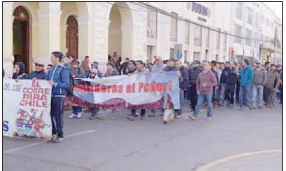
Los trabajadores marcharon por el centro de Los Andes en el marco del tercer día de movilizaciones de subcontractistas de Codelco.

Agregó que el trabajador se encontraba circulando por la ruta cuando fue apresado por Carabi-