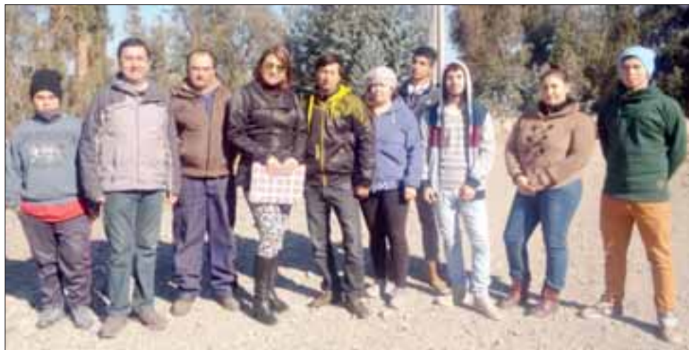
Autoridades anunciaron que en agosto se iniciarán las obras de pavimentación del camino de acceso a Santa Isabel en la comuna de Catemu.

Por su parte, la Jefa Provincial de Vialidad informó a los vecinos que este proyecto es la continuidad del ensanchamiento ya realizado en dicho camino. Esta nueva obra consiste en la aplicación de 1,8 ki-