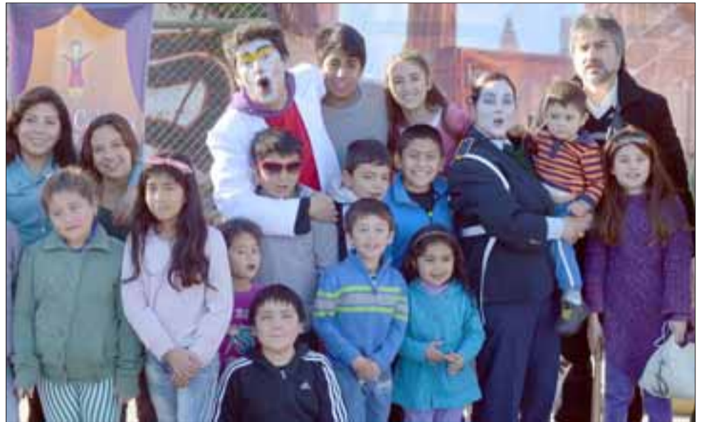
VIVA EL TEATRO.- En villa Los Héroes por ejemplo, decenas de pequeñitos posaron para nuestras cámaras después de la divertida función de teatro.