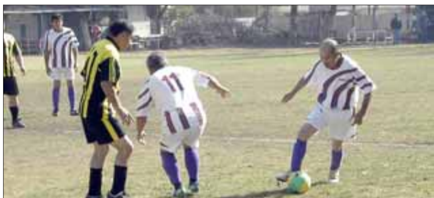
En la Liga Vecinal chocarán el domingo el líder y sub líder del torneo.

ya 'Petineli' Programación Lidesafa, Sábado 25 de julio Torneo Joven: Cancha El Tambo: América - Casanet; Prensa - Manchester; Tahai - Transportes Hereme Cancha Parrasía: BCD - Ga-