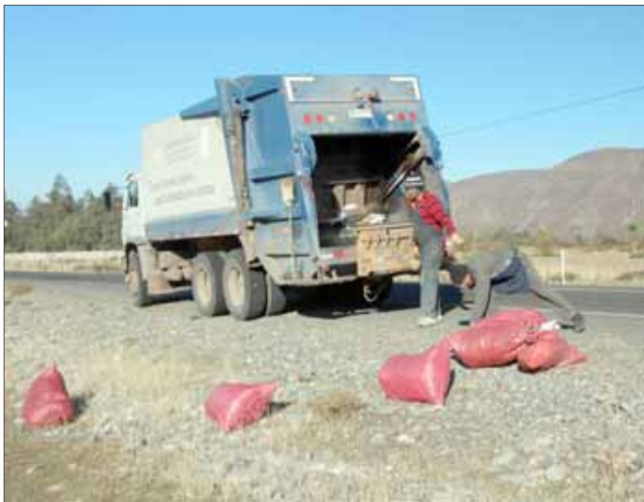
Funcionarios municipales que trabajan en el camión recolector limpiaron el sector, asegurando que lo hacen para que no siga transformando en un basural.