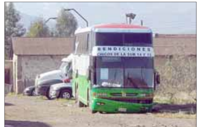
Este fue el bus en el cual intentaron ingresar 600 kilos de marihuana prensada durante el año pasado.

ves se llevó a cabo el juicio oral en contra de los ciudadanos paraguayos detenidos el año pasado, siendo todos declarados culpables de tráfico de drogas.