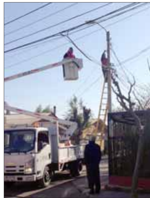
Cuatrocientas luminarias led, de última tecnología se instalarán en villa El Señorial.

Los recursos provienen del Gobierno Regional y corresponden a la segunda etapa de un proyecto que comenzó a ejecutarse el año recién pasado, y que significó el cambio de luminarias en un amplio sector de la comuna.