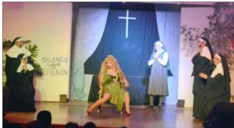
MANO DE MONJA.- Finalmente y para cerrar la semana cultural, esta compañía teatral cerró sus presentaciones con la obra 'Mano de Monja', desarrollada en el teatro municipal.