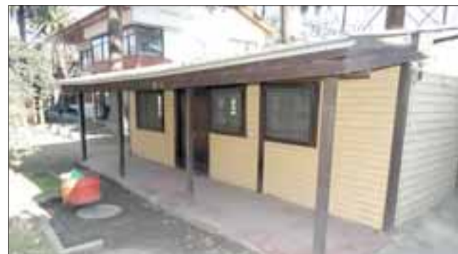
La nueva sede será un edificio de dos pisos que se construirá donde se encuentra una sede de madera, a un costado del edificio de dirección de obras y de la Dideco.