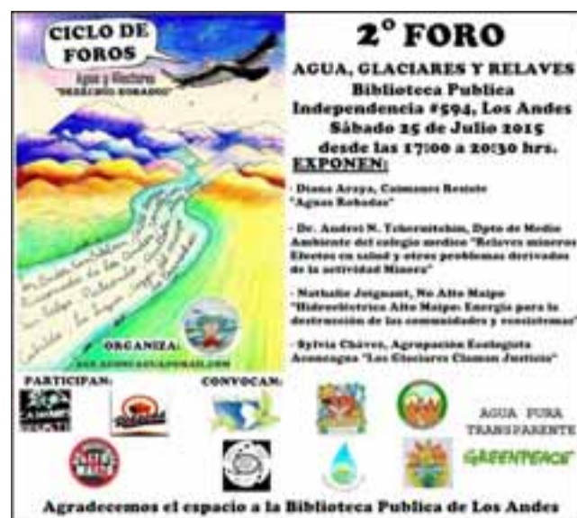
El segundo Foro del ciclo: Agua y Glaciares: “Derechos Robados” se realizará este sábado 25 de julio a las 17:00 horas en la Biblioteca de Los Andes.

“El territorio chileno está al borde del colapso hídrico, diversas comunidades están alarmadas por el desabastecimiento del agua dulce. Científicos que aún ponen la ciencia al servicio de la vida, están buscando de forma urgente como detener el retroceso de los glaciares y la protección del agua para la vida. Organizaciones articuladas en torno a la defensa del agua participan de este Ciclo, a modo de transmitir a nuestra comunidad las experiencias vividas y definir juntos, elementos que nos guíen hacia las soluciones que necesitamos como país, porque de norte a sur y de mar a cordillera nuestras