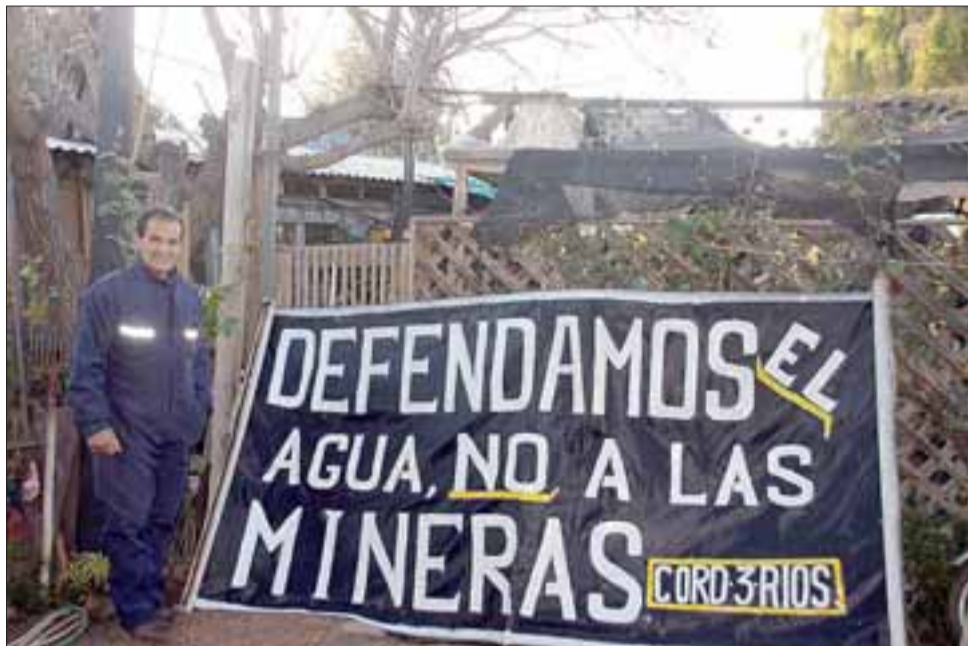
Coordinadora Pro-Defensa de Derechos y Recursos Naturales de Putaendo 'Tres Ríos'.

5) Como organización levantamos la bandera en