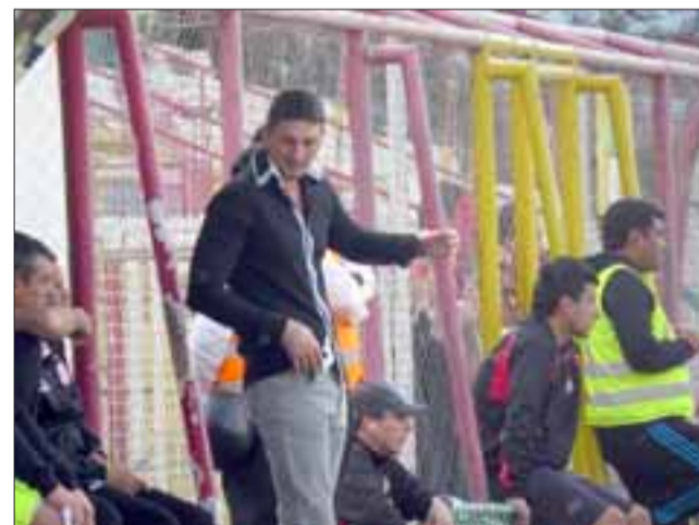
En entrenador de los sanfelipeños mostró su tristeza por el resultado de su equipo.