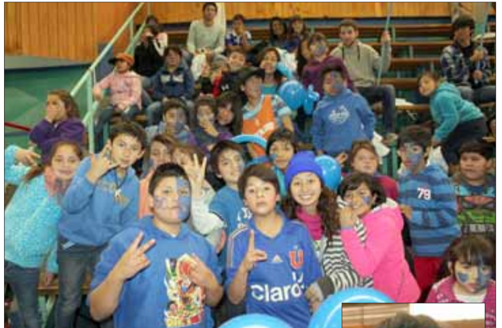
A LO GRANDE.- Los niños pasaron una semana de vacaciones muy activos y jugando en sus poblaciones.

venes voluntarios, quienes fueron capacitados a fin de dar atención a los niños que se unirían a esta semana de trabajo infantil. De martes a jueves realizamos juegos, refrigerios y dinámicas, y el viernes hicimos la clausura en el gimnasio del Liceo Roberto Humeres, con grandes actividades por grupos», agregó