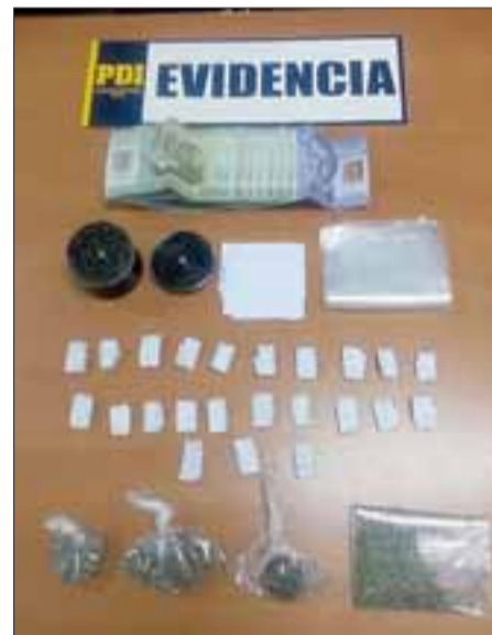
La estudiante de Técnico en Enfermería (23) fue detenida encontrando en su poder 23 papellitos de marihuana.

A petición del Ministerio Público, el tribunal no fijó medidas cautelares en su contra a la espera de la realización de un procedimiento abreviado, fijándose un plazo de investigación de cuatro meses.