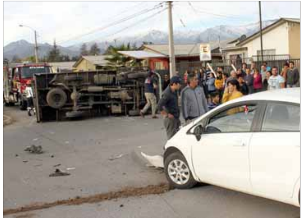
APARATOSO.- Una aparatosa colisión entre dos vehículos ocurrió la tarde de este sábado en villa El Carmen de San Felipe, propiamente entre avenidas Nicolás Maruri y Ciudad de Mendoza.

Roberto González Short rgonzalez@eltrabajo.cl