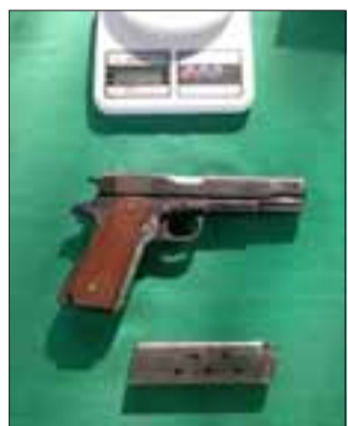
Además en la vivienda allanada se incautó una pistola calibre 45 con sus respectivas municiones.

Con la incautación de 21 gramos de pasta base de cocaína, 47 gramos de marihuana elaborada, una pistola calibre 45 y sus respectivas municiones culminaron las diligencias encabezadas por los efectivos policiales de OS7 de Carabineros, luego de realizar un allanamiento en