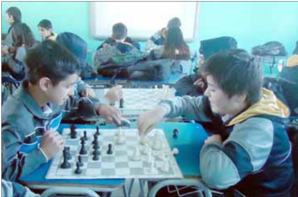
TODOS LISTOS. - La simultánea se realizará en San Felipe, el 7 de agosto en la terraza de la Plaza de Armas de nuestra ciudad.

ño que gusta del deporte-ciencia, quién aceptó gusto de participar en esta actividad. También este prestigioso colegio presentará su nueva adquisición de un ajedrez gigante, que significa un aporte didáctico para el trabajo de aprendizaje ajedrecístico de los alumnos de este establecimiento educacional», dijo