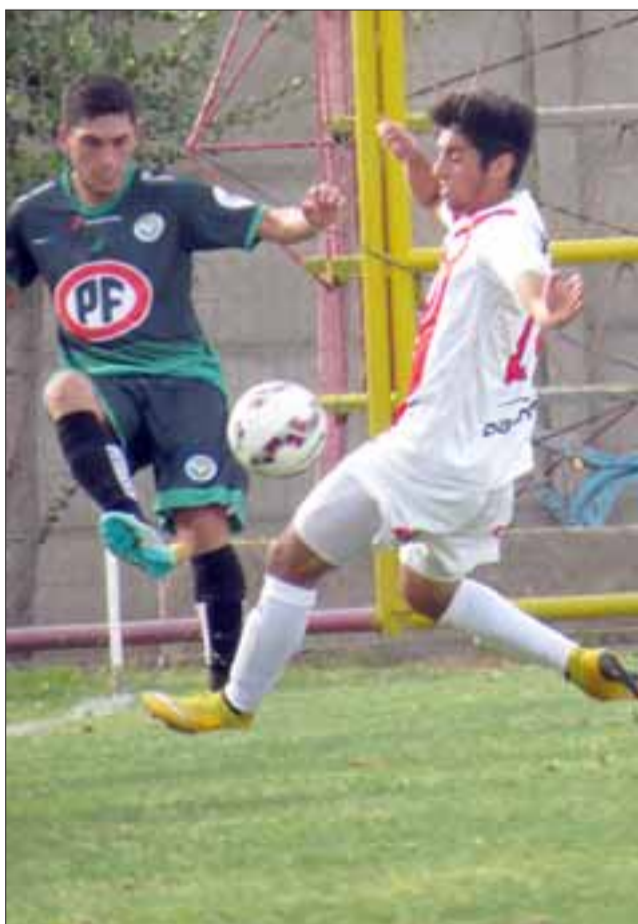
Errores puntuales en la defensa y la poca eficiencia en el arco rival explican el empate del Uní Uní con Deportes Puerto Montt.