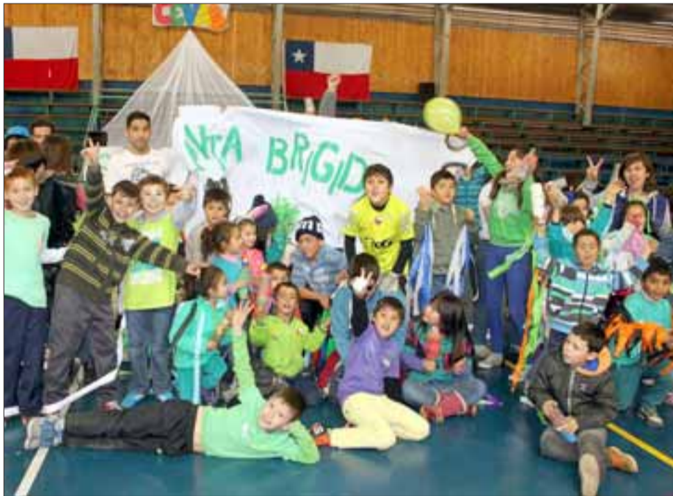
DIGNAS VACACIONES.- Este viernes se realizó la clausura en el gimnasio del Liceo Roberto Humeres, con grandes actividades por grupo y muchos juegos para los niños.

Según lo explicado por la religiosa, «el lunes se convocaron a unos 80 jó-