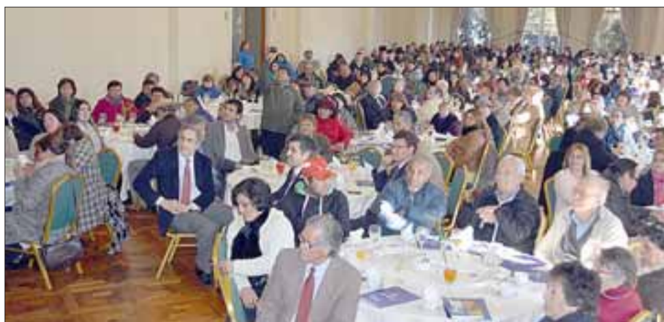
Con gran convocatoria, Esvál lanzó la segunda versión del Fondo Concursable 'Contigo en cada gota'.

El ejecutivo agregó que "esta iniciativa es una muestra de cómo queremos relacionarnos con nuestros vecinos: generando valor compartido, estando atentos a sus necesidades y apoyando su propio esfuerzo, capacidad de gestión y organización. En la primera versión tuvimos un gran éxito de convocatoria, con más de 500 proyectos recibidos, y este año nuestro foco está centrado en el cui-