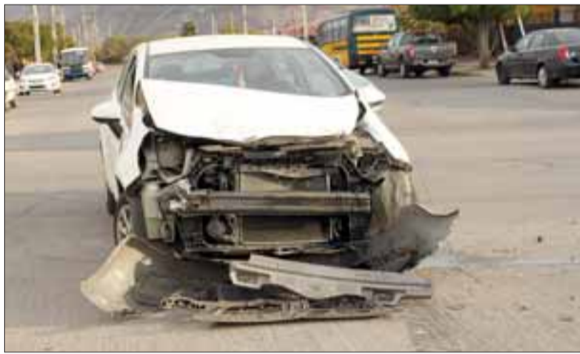
DESTROZADO.- El Kia Rio4 patentes FPYD79 venía con derecho de vía, lo que originó una larga frenada y también una colisión lateral

Una aparatosa colisión entre dos vehículos ocurrió la tarde de este sábado en villa El Carmen de San Felipe, propiamente entre avenidas Nicolás Maruri y Ciudad de Mendoza. Según el relato de testigos, pero que no necesariamente reflejen lo que realmente ocurrió, el