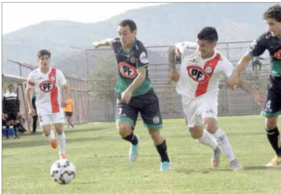
Los sanfelipeños fueron claros dominadores del pleito y por lo mismo al final hubo mucha decepción porque solo debieron conformarse con un empate.