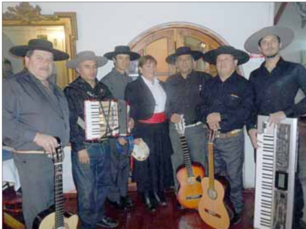
CUECA DE LUJO.- Este jueves 30, la agrupación musical ‘Los Cuequeros de Putaendo’ se presentará en el Teatro Municipal de San Felipe.

Finalmente, dicen estar felices por esta presentación