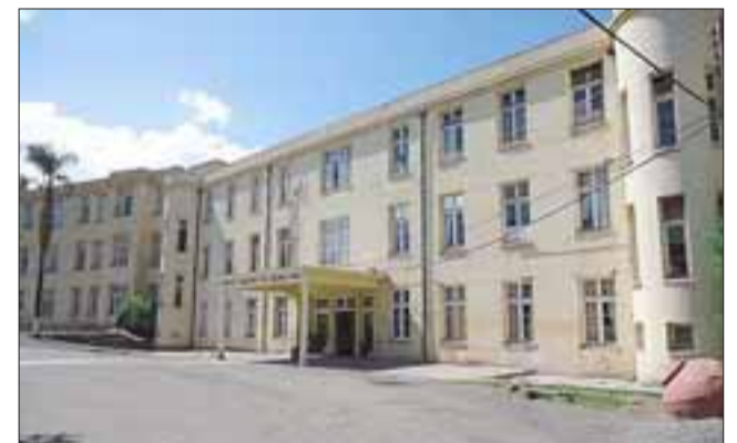
La institución ya inició un sumario administrativo para esclarecer los hechos que condujeron a la muerte a este usuario.

cilio en la población Alonso de Ercilla de Los Andes y en varias oportunidades había