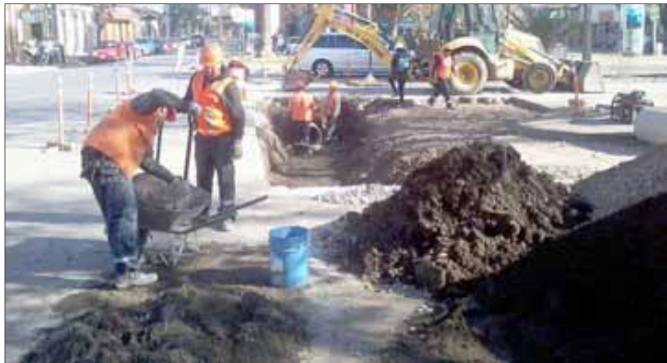
Los trabajos en Av. O'Higgins en la intersección con calle Riquelme, consideran una inversión de 13 millones de pesos que busca evitar el escurrimiento de aguas por la superficie del sector.

Los trabajos deberán estar entregados en un plazo de quince días, y la empresa responsable de las obras es Asfalto Ltda. y es la misma que actualmente realiza