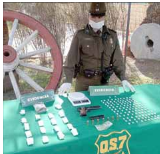
Personal de OS7 de Carabineros de San Felipe decomisó pasta base de cocaína y marihuana elaborada desde un domicilio de la villa Juan Pablo II de esta comuna la tarde de este jueves.

No obstante Carabineros remitió los antecedentes del caso a la Fiscalía, detallando las pruebas incautadas respecto a este procedimiento de microtráfico y porte ilegal de arma de fuego: con 21 gramos de pasta base de cocaína, 47 gramos