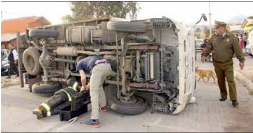
VUELCO.- Según algunos testigos, el camión liviano patentes GGWP29 no habría respetado el disco Pare, pero también el auto blanco venía muy veloz. Serán las autoridades quienes establezcan responsabilidades y sanciones.