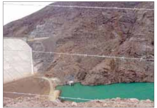
A partir de septiembre el embalse almacenará alrededor de un millón y medio de metros cúbicos, sin considerar lo que baja por el río.

La autoridad precisó que en el encuentro se detallaron cada uno de los pasos siguientes, precisando en septiembre de 2016 se iniciarán los protocolos de llenado del segundo y tercer tercio para embalsar todo el volumen de 27 millones de metros