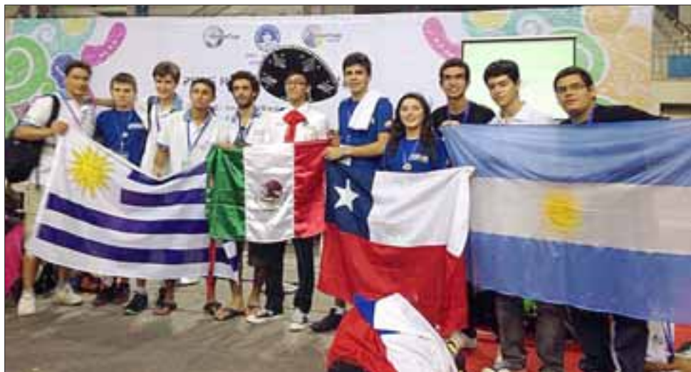
CHILE EN EL MUNDO.- Chile quedó en tercer lugar a nivel de Latinoamérica, ganando Uruguay y segundo Uruguay. A nivel mundial fue Japón el país que ganó el certamen.