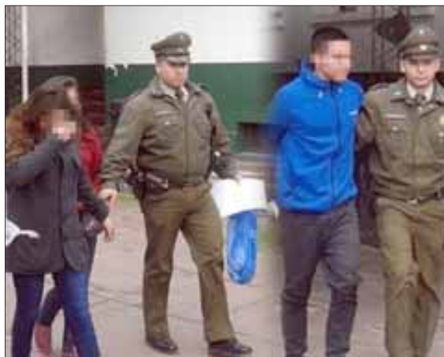
Los detenidos fueron identificados como un Yerko C.L.(23), junto a dos menores de edad de 17 y 15 años y fueron formalizados por robo con violencia e intimidación.

El trío pasó a control de detención en el Tribunal de Garantía de Los Andes donde fueron formalizados por robo con violencia e intimidación.