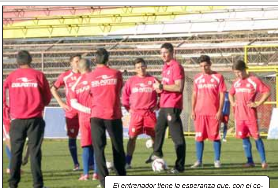
El entrenador tiene la esperanza que, con el correr de los partidos el plantel albirrojo alcanzará su consolidación.