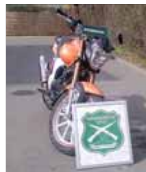
La moto fue recuperada por efectivos de la SIP de Carabineros desde una vivienda en la población San Felipe la tarde de este martes.