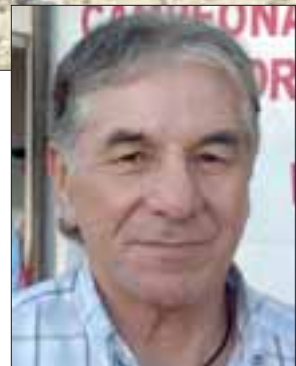
Colaborador de El Trabajo Deportivo.

Complejo César: Magisterio - BCD (joven); Derby - 3º de Línea; Estrella Verde - Magisterio; Casanet - Grupo de Futbolistas; Transportes Hereme - América (joven). Libre: Echeverría.