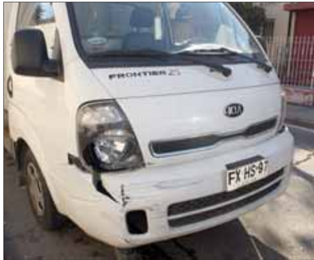
SIN DAÑOS.- Sin embargo, el camión repartidor de helados, pocos fueron los daños que sufrió, tal como lo muestra esta gráfica.