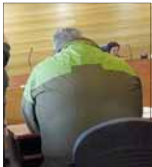
El excarabinero fue formalizado por el delito de estafa, quedando en libertad con medidas cautelares como arraigo y firma mensual en Arica.

La investigación del Ministerio Público de Los Andes se inició el año 2012 tras una serie de denuncias presentadas por personas residentes en nuestra ciudad que-