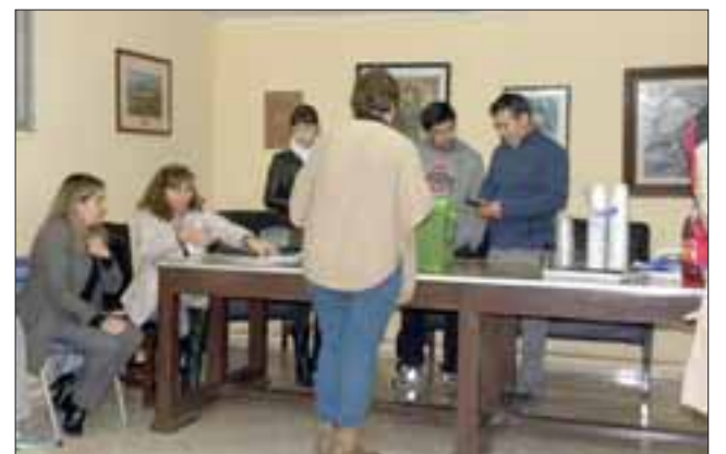
La elección de la nueva mesa de la Asociación de Básquetbol Amateur de San Felipe se realizó el miércoles pasado en el Fortín Prat.