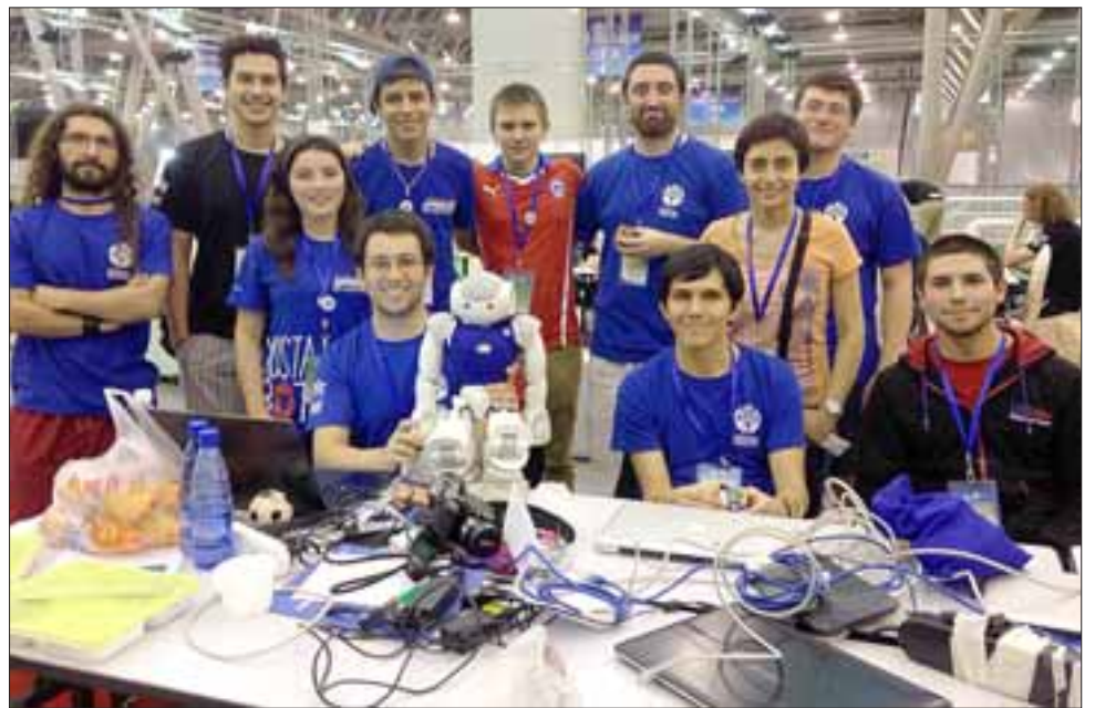
LA OTRA SELE.- Esta es nuestra Selección Nacional de Robótica, ellos dejaron muy en alto el nombre de nuestro país y en el caso de San Felipe, prestigio para nuestra ciudad.