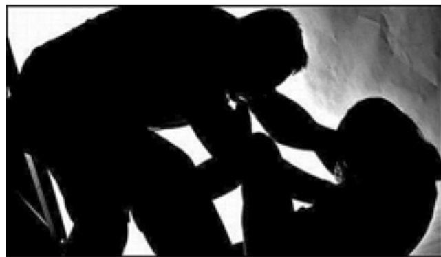
La falta de evidencias y las dudas razonables en el relato de la víctima complican la investigación del caso de violación denunciado. (Foto referencial).

Cabe señalar que la noticia comenzó a circular por las redes sociales por medio de cercanos a la familia minutos más tarde de ocurridos los hechos, advirtiendo con detalles la agresión sexual en una vivienda de ese sector, causando una psicosis colectiva sobre la presencia de un posible