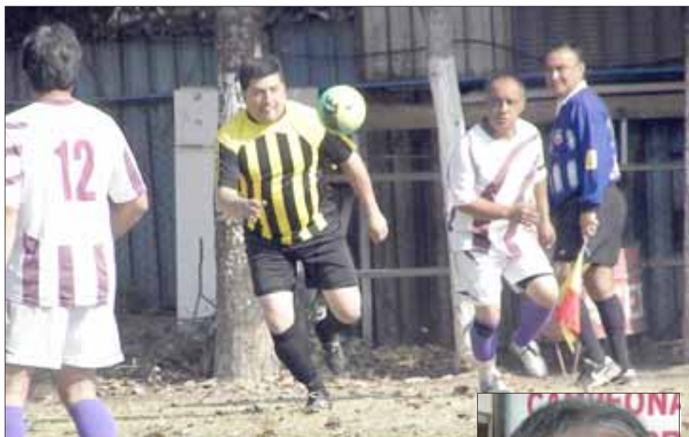
La cancha Parrasía ha sido escenario de uno de los torneos más atractivos de los últimos años en la Liga Vecinal.