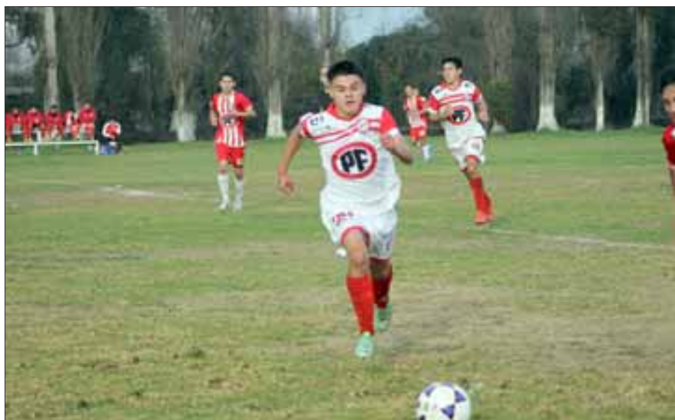
Por la segunda fecha del torneo, los juveniles de los clubes aconcagüinos enfrentarán a Cobresal y Santiago Wanderers.