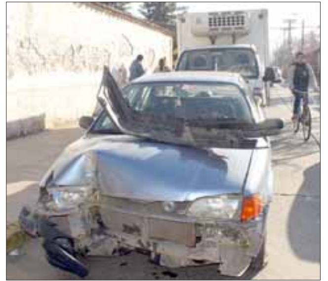
UPS.- Así quedó el Toyota de color azul luego de colisionar al camión repartidor de helados.

Carabineros hizo acto de presencia, reguló el tránsito y minutos después todo volvió a la normalidad.