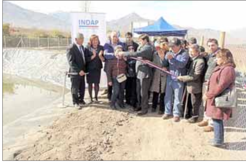
Diversas autoridades participaron de la ceremonia que iniciaba la puesta en marcha de estas dos obras ubicadas en la comuna de San Esteban y Calle Larga.

una sequía, todos esperamos que todavía vengan lluvias, pero hay que asumir el dato de que hay menos recursos hídricos que en décadas pasadas, llueve menos, hay menos nieve, y la única manera de enfrentar eso, de una manera estructural, es invertir más en obras de todo tamaño. Y en este caso, estas obras van directamente en beneficio de pequeños agricultores, que es una de las prioridades de trabajo del ministerio y del gobierno”, apuntó.