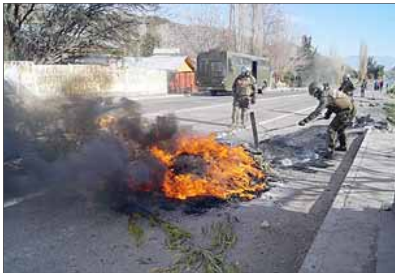
Cerca de 300 trabajadores contratistas por más de 9 horas mantuvieron bloqueada la ruta Internacional a la altura del kilómetro 8 en el sector El Sauce.

El oficial confirmó que hubo siete detenidos por desórdenes graves, "pero lamentablemente fueron puestos en libertad por artículo 26 conforme dispuso el fiscal de turno, pese a que nosotros como Carabineros verificamos que en su actuar lanzaron objetos con-