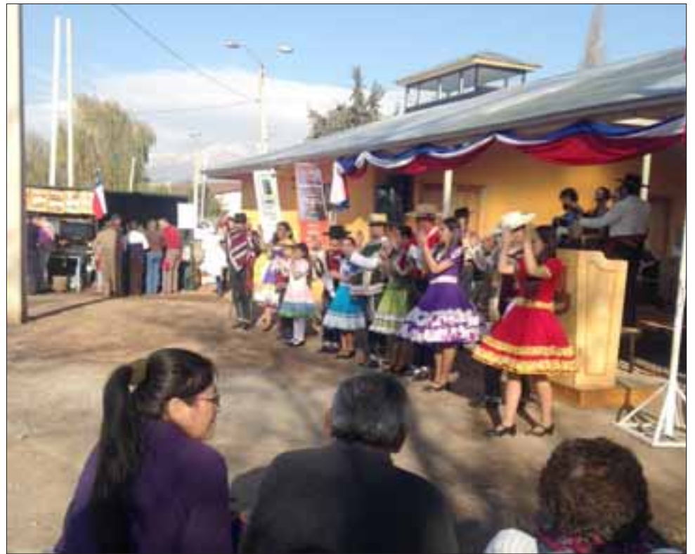
En la Población San Francisco, se realizó la Feria Cultural a la que asistió gran cantidad de expositores y visitantes.