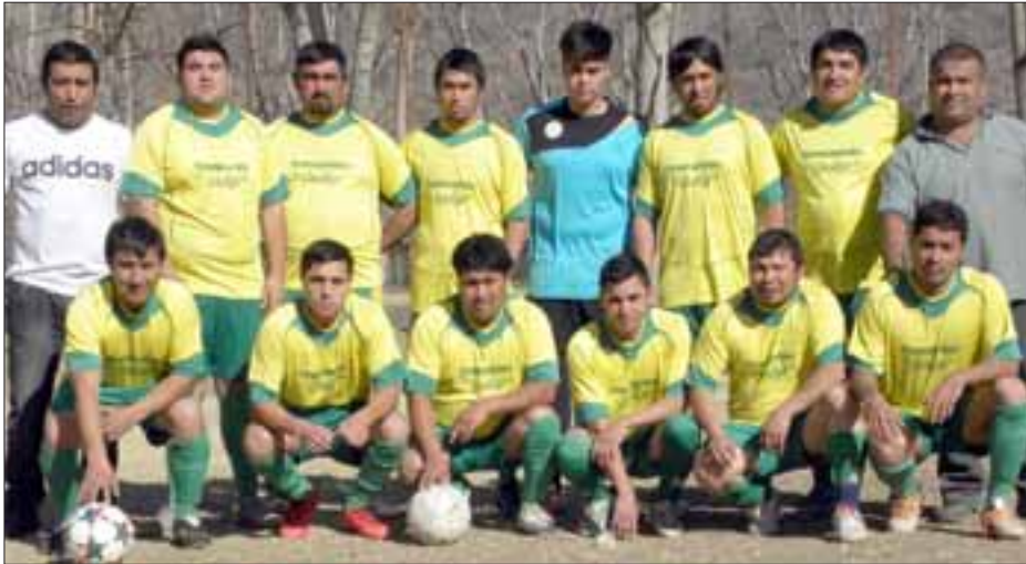
La tercera del club Manuel Rodríguez es candidato al título de su serie en el torneo de la Asociación de Fútbol Amateur de San Felipe.

Mario Inostroza – Libertad; Unión Sargento Aldea – Alberto Pentzke; Juventud La Troya – Ulises Vera; Prat – Unión Delicias; Manuel Rodríguez – Independiente.