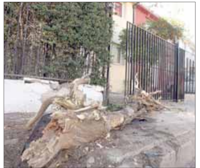
PODA INMEDIATA.- Este árbol fue arrancado por el automóvil de la dama. Atrás, el portón de la vivienda afectada.