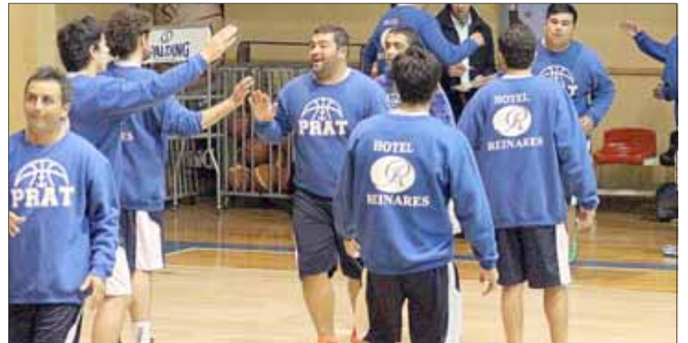
El Prat partirá como forastero su incursión en los Play Offs de la Libcentro B.