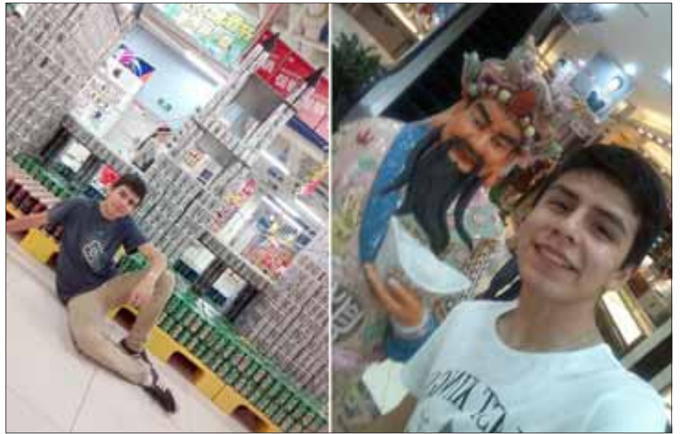
JOVEN AVENTURERO.- Tanto a lugares modernos como en sitios religiosos, este aventurero sanfelipeño nos trae evidencias de la travesía.

- Se dice que en China comen perros y gatos, ¿cómo te fue con la comida en ese país?