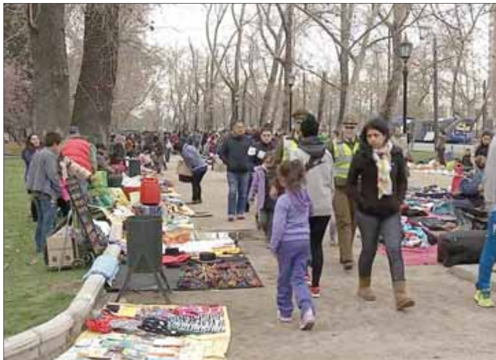
FERIA DE LAS PULGAS. - Los interesados en comprar un espacio para vender sus cosas, pueden llamar al Cel: 68114909. (Referencial)