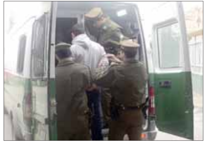
El adolescente fue conducido por Carabineros hasta el Tribunal para ser formalizado por la Fiscalía.

PDI incautó pasta base y marihuana en dos departamentos: