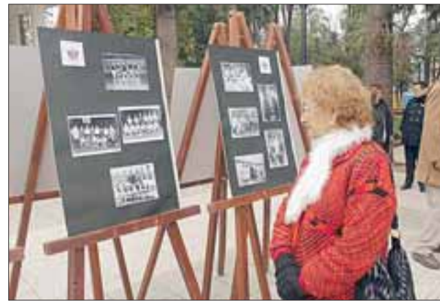
Durante el domingo, adultos mayores del Centro Integral realizaron en la Plaza de Armas una muestra fotográfica que contenía cerca de 150 fotografías.

La muestra fue visitada al mediodía de este domin-