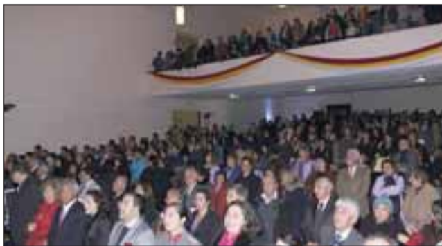
Un 'Teatro Roberto Barraza' repleto fue el marco de público que acompañó a los vecinos destacados.

La ceremonia culminó pasadas las 21 horas, luego que cada uno de los vecinos destacados subiera al escenario y fueran saludados por el concejo municipal, quienes les entregaron el reconocimiento.