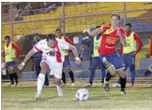
Con una derrota de 2 a 1, el Uní puso fin a su participación en la actual versión de la Copa Chile.