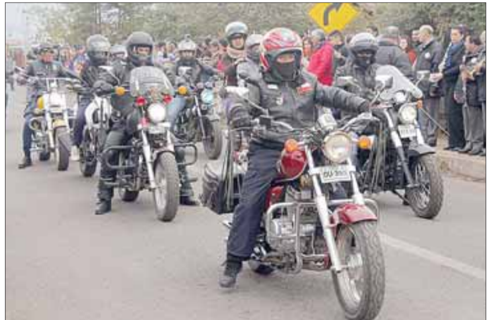
Los Motoqueros también se sumaron al aniversario de San Felipe en 21 de Mayo.