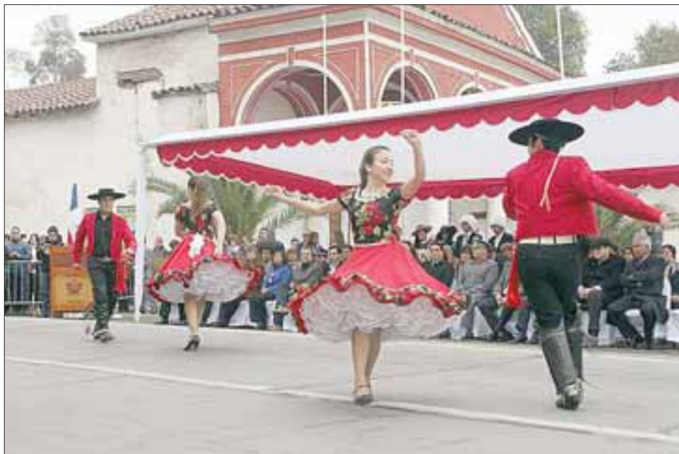
Sin importar el frío, un grupo de jóvenes se lucieron bailando un pie de cueca frente a las autoridades y a toda la comunidad asistente.

El alcalde de todos modos recalcó que existe una serie de desafíos pendientes, formulando un llamado a los vecinos a trabajar de manera conjunta, para continuar en esta línea de desarrollo que ha caracterizado su gestión en el sector de Curimón.