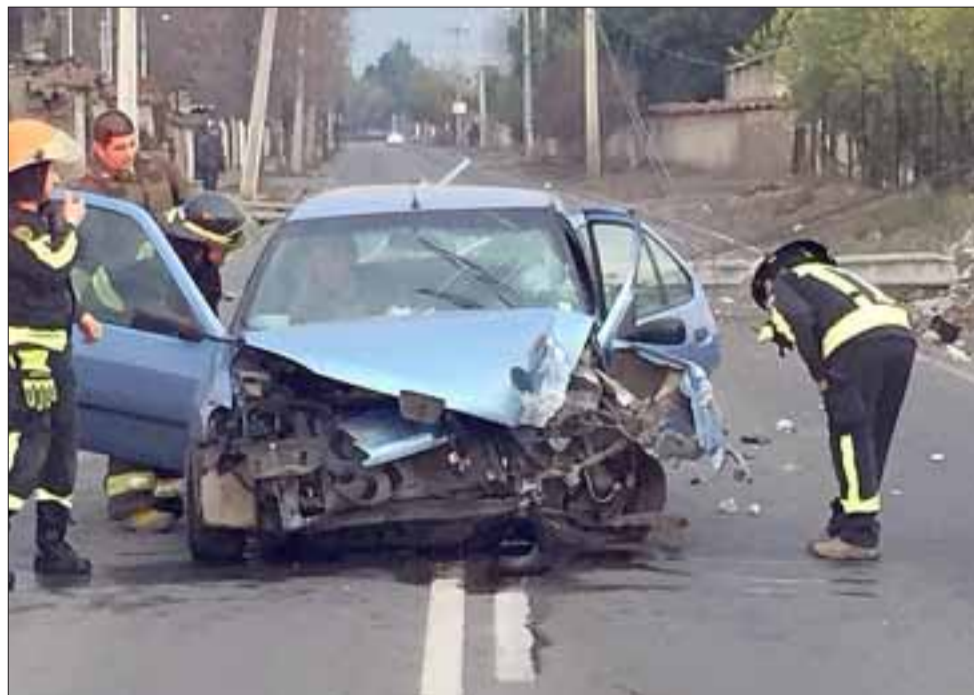
El accidente dejó como saldo una persona lesionada de consideración en avenida Tocornal en San Felipe, cuyo conductor se habría dado a la fuga.