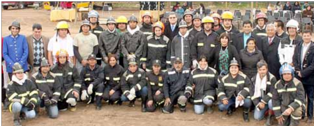
HÉROES.- Ellos son los voluntarios de Bomba Tocornal, valientes bomberos que lo dan todo para atender al sector.

«Estamos ya procesando un proyecto por parte del Municipio, en el cual solicitamos un aproximado de $200 millones al Gobierno Regional para la creación de un cuartel de Bomberos para este sector, será