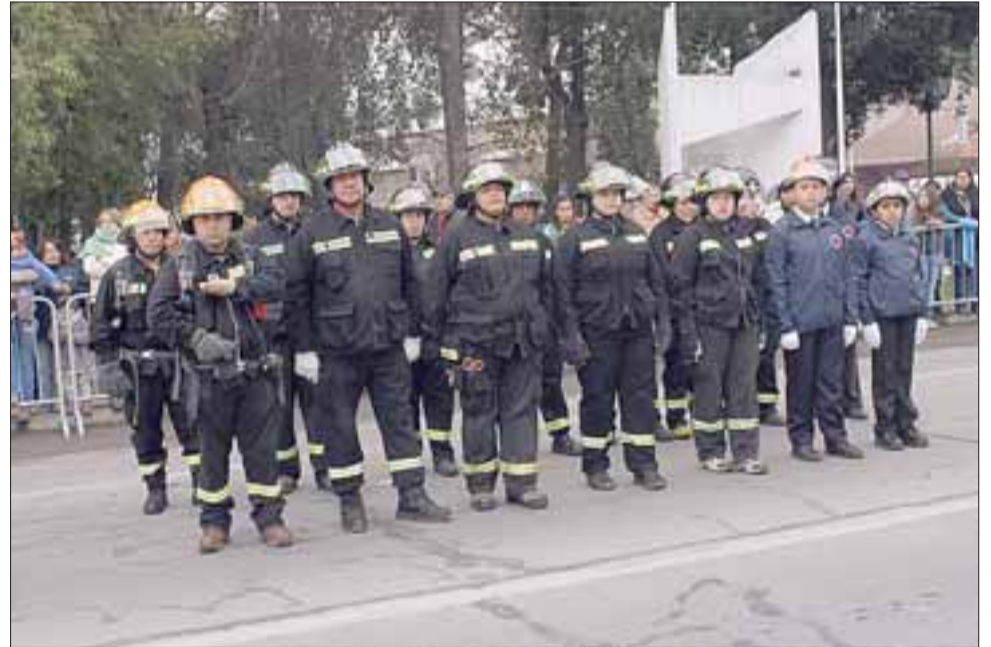
Bomberos de Curimón no podían quedar ausentes de los homenajes de aniversario.

ya conseguimos la aprobación de mil 200 millones de pesos para un anhelo de mucho tiempo, como es el alcantarillado San Rafael - Curimón”.