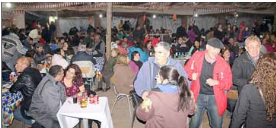
Un centenar de personas participó del beneficio organizado por la Junta de Vecinos de la pobl. Ejército Libertador, para ir en ayuda de las familias que resultaron damnificadas por un incendio en ese sector.