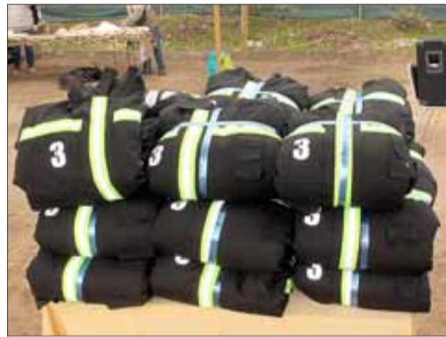
DE LUJO.- Uniformes nuevos que recibieron los voluntarios de Bomba Tocornal en este su primer aniversario.