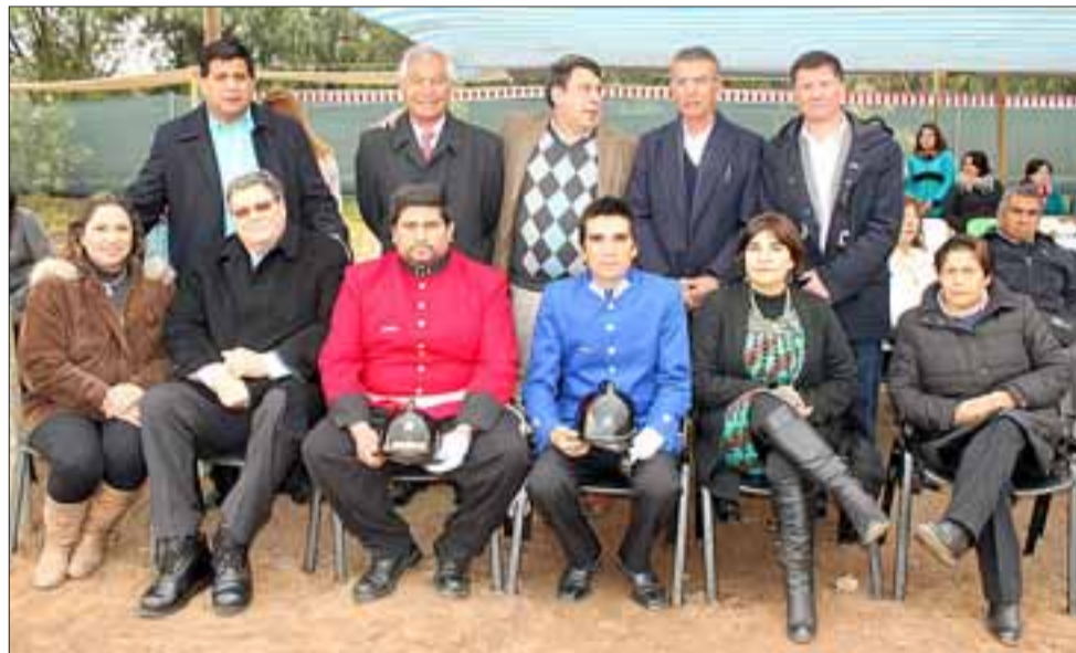
LOS GESTORES.- Las autoridades de la comuna y regionales, están muy pendientes de que este proyecto esté ojala, terminado a fin de año.

Roberto González Short rgonzalez@eltrabajo.cl