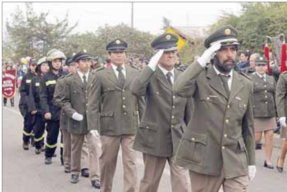
La Séptima Compañía del Cuerpo de Bomberos de 21 de Mayo participó de la celebración de un nuevo aniversario.

Algarrobal, Bellavista y El Asiento, marcó la celebración del aniversario de San Felipe. Se trata de localidades que, al igual que Curimón, forman parte importante de la historia de Aconcagua, ya que según precisó en su mensaje el jefe comunal, esta zona corresponde a uno de los primeros asentamientos picunches del valle, donde surgió la figura del Cacique Michimalongo.