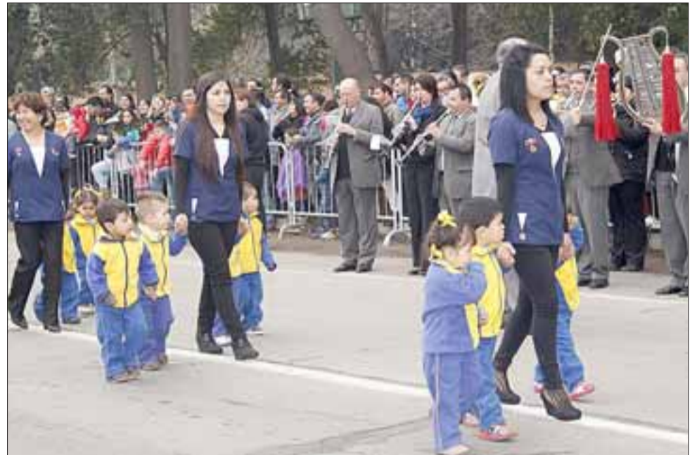
Los más pequeños junto a sus educadoras también participaron de los desfiles conmemorativos.

“Curimón y todos los sectores aledaños tienen enorme relevancia para nosotros y por eso hemos hecho muchos esfuerzos para que aquí se ejecuten proyectos