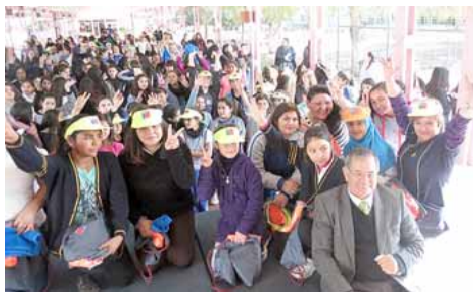
Alumnas del Liceo Corina Urbina participaron de diversas actividades realizadas por el Team IND en una jornada de baile, zumba y premios para las más participativas.