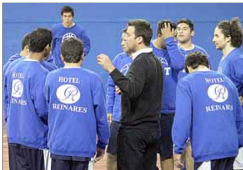
Los de la calle Santo Domingo partieron con el pie izquierdo su participación en la postemporada de la Libcentro B.