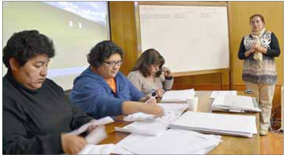
Con un total de 404 votos, más del 50% de respaldo, el proyecto elegido fue el de dotar a los establecimientos de ayudas técnicas para entregar en comodato a usuarios de establecimientos en caso de requerimiento temporal.

Luego de realizarse la votación y el conteo de los más de 800 sufragios registrados en urna y electrónicos, con un total de 404 votos, más del 50% de respaldo, el proyecto elegido para ser implementado en toda la red de atención de salud fue el de dotar a los estable-