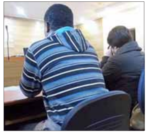
El conductor fue detenido por Carabineros cuando intentaba estacionar el vehículo frente a su casa.

por los delitos de manejo en estado de ebriedad causando lesiones graves y leves, además del delito establecido en la ley de tránsito en relación al incumplimiento de la obligación de detener la marcha del vehículo, prestar la ayuda posible y dar cuenta a la autoridad de