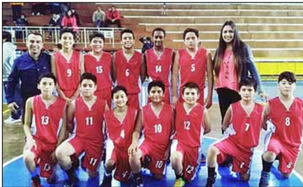
A nivel formativo san Felipe Baské ganó todos los encuentros al Prat.

Durante el fin de semana pasado, también les correspondió jugar a los equipos adultos de los tres clubes aconcagüinos que intervienen en la Libcentro y claramente la atención se centró en el duelo que protagonizaron el Prat con San Felipe Baské, el que quedó en manos de los del marino