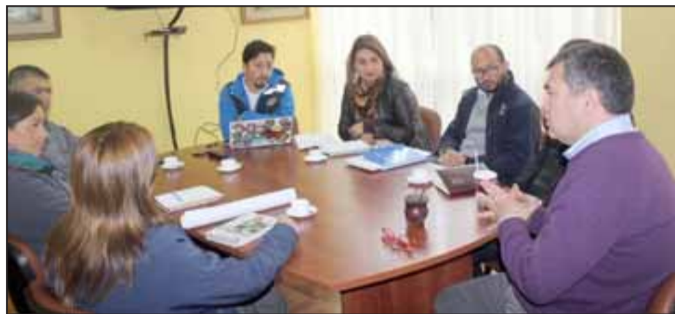
En la reunión de la Dirección de Protección Civil de la Gobernación de San Felipe, autoridades se comprometen a estar en ‘estado de alerta’ y de esta manera, reaccionar de la forma más eficiente a cualquier emergencia de la Provincia.

En tanto, Martínez destacó que los municipios han desarrollado trabajos de limpiezas y despejes de esteros, cauces y sitios, por lo que recomendó a la comunidad iniciar labores en sus hogares a fin de evitar situaciones de riesgo. “Lo ideal es que la gente no salga de su casa a menos que sea necesario y se prepare para ac-