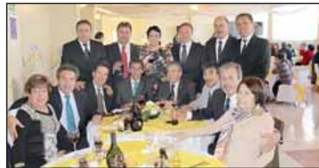
Cientos de exalumnos del Liceo de Hombres se reúnen cada año para el aniversario del establecimiento, para recordar a aquellos compañeros que formaron parte importante de sus vidas.

La adhesión al almuerzo tiene un costo de 10 mil pesos por persona, el que considera diversos gastos como personal de servicio, entrega de distinciones, entre otros gastos. Consultas y reservas se pueden realizar al fono 34 2 510033 o al correo liceorobertohumeres@gmail.com.