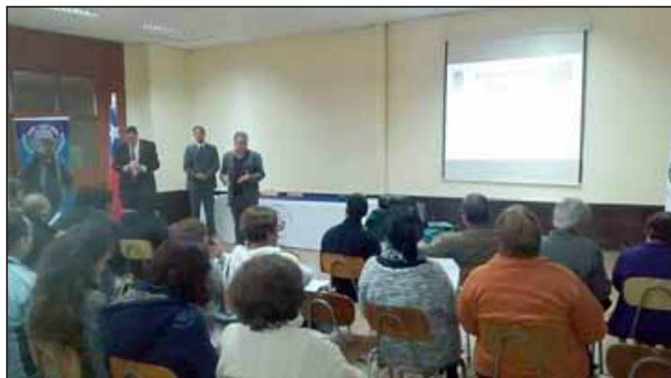
En esta edición, se espera un aumento de las postulaciones, debido al alto interés demostrado por la comunidad, tanto en la jornada de capacitación dictada por funcionarios del Gobierno Regional, como en las consultas realizadas ante el equipo técnico de la Gobernación Provincial de San Felipe.

El propósito de estos recursos concursables, es financiar iniciativas que ten-