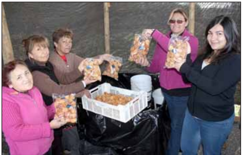
DAMAS DE TRABAJO. - En este artesanal taller ellas pelan y procesan el fruto. Una tarea de mucha paciencia.