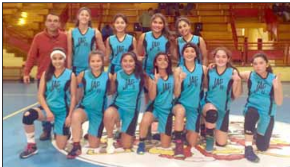
Los seleccionados U14 y U17 del colegio José Agustín Gómez se titularon campeones en la fase local de los Juegos Deportivos Escolares.

El próximo desafío de las campeonas, será la etapa provincial que deberían superar y posteriormente la regional donde buscarán los pasajes a los respectivos escolares nacionales.