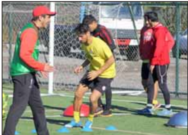
El lunes comenzó la Pretemporada de Unión San Felipe

A esos dos nombres, se agregarían con toda seguridad un defensa central y otro elemento de características ofensivas, ambas incrustaciones de nacionalidad Argentina y cuyos nombres se conocerían en un futuro próximo.