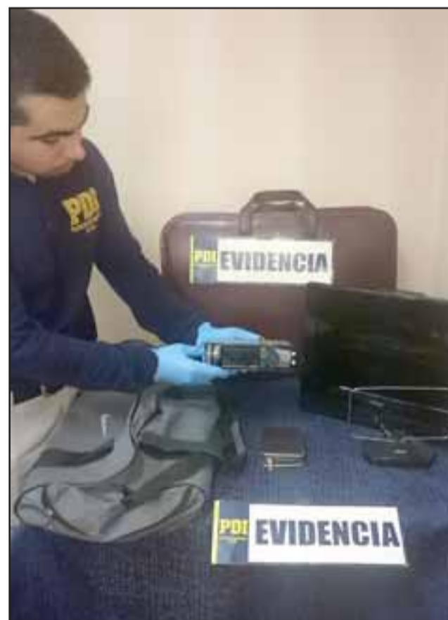
Diligencias de la Bicrim de la PDI de San Felipe, resolvieron el caso con la captura del antisocial y la recuperación de las especies robadas al interior de la empresa de transportes en calle Tacna Sur de esta comuna.