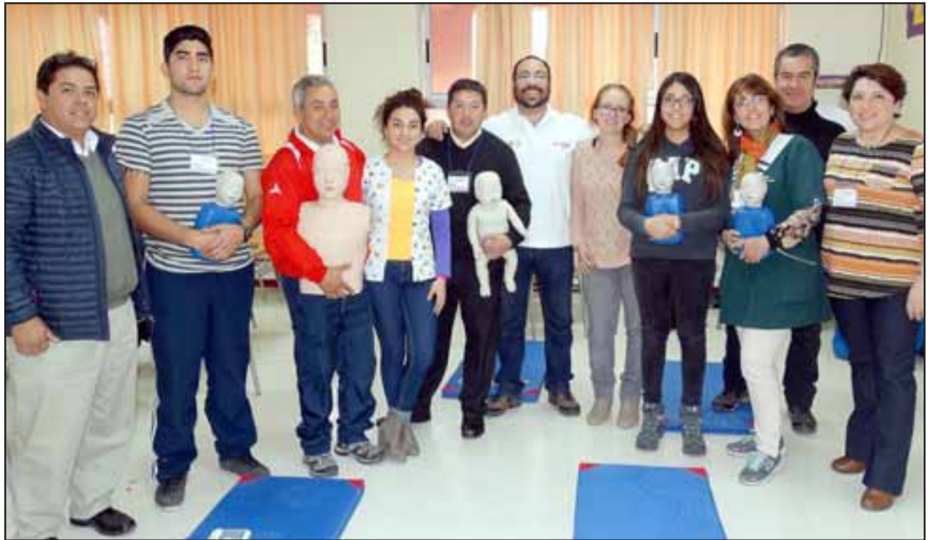
DOCENTES AL DÍA.- Profesores y miembros del centro de padres recibieron este importante curso, para salvar vidas.

- Porque para todos, es conocido que ya han ocurrido varias desgracias en centros educativos, en las que niños han sufrido paros cardiorrespiratorios e inclusive han muerto estudiantes cuando hacían ejercicio,