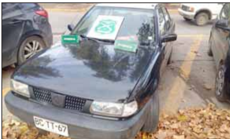
Este vehículo marca Nissan pretendían robar la dupla de antisociales desde un taller mecánico, tras haber recobrado libertad desde tribunales acusados del mismo delito.

logró escapar en dirección desconocida. No obstante tras la llegada de Carabineros que adoptó el procedimiento de rigor, esposó al antisocial que se encontraba reducido en el suelo, mientras el segundo involucrado podría ser capturado en las próximas horas.