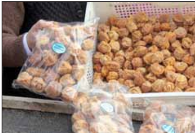
UNA DELICIA. - Esta Es la calidad de huesillo que estas artesanas están produciendo y poniendo a la venta.