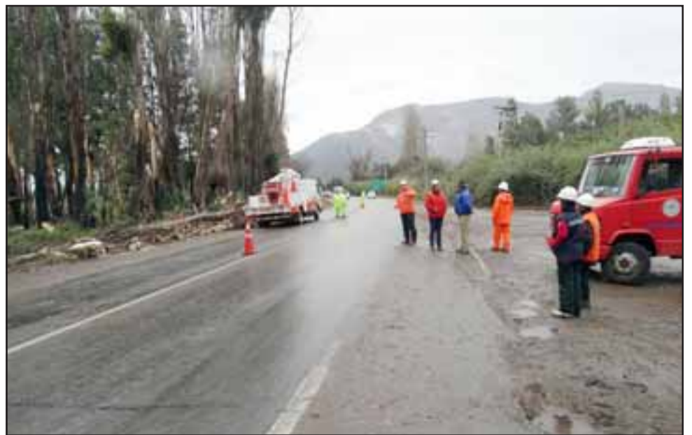
Los trabajos que comprenden la tala de 177 árboles en Lo Campo, se extenderán por 7 días hábiles, con una interrupción del tránsito desde las 09:00 hasta las 17:00 horas.

se forma, pues todos sabemos que esta ruta está saturada de vehículos y resulta que vamos a tener dos cortes en el tramo de Panquehue, por lo que veo es una planificación no muy adecuada, más aún cuando ya estamos encima del invierno. Creo que esta tala debería haberse ejecutado en el mes de marzo o antes de los trabajos que se están realizando en el sector de Palomar, que también han generado una serie de complicaciones. Todo esto va a ser una molestia generalizada, pues está a la vista que se ha