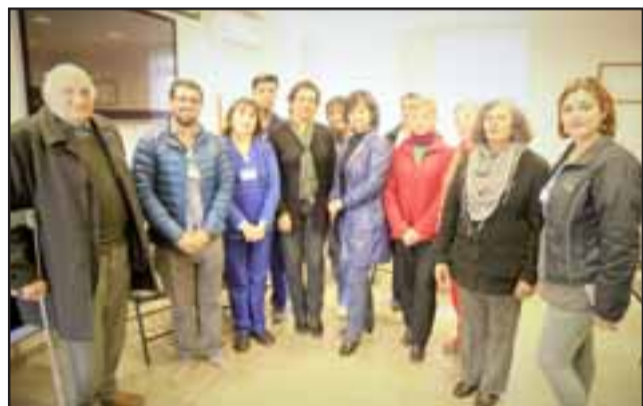
Comunidad organizada del Cesfam San Felipe, presentó lo que será su encuentro local del proceso constituyente.