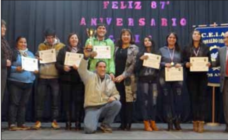
Equipo ganador en baby fútbol.

por sus mismos compañeros, y la premiación del equipo ganador de la competencia de baby fútbol desarrollada entre las sedes.