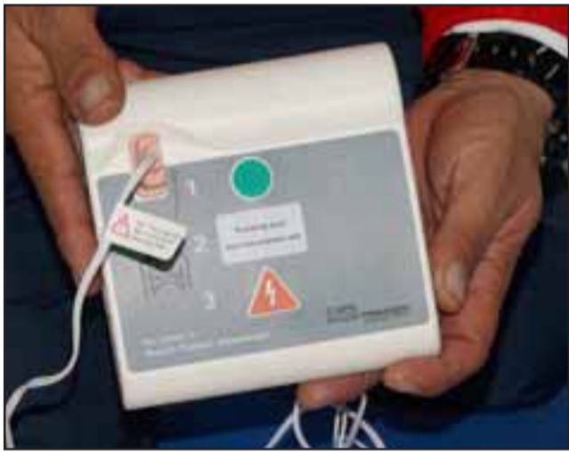
DOCTOR DIGITAL.-Este artefacto habla en español; descarga golpes pediátricos de electricidad que pueden reanimar el corazón de un niño en paro.