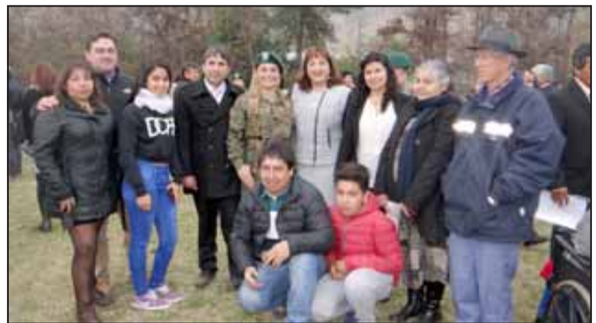
Con la presencia de familiares y amigos, se realizó la actividad militar.

Por esas cosas del destino, su funeral se efectuó el día 5 de junio, justo cuando el Liceo festejaba sus 158 años de existencia.