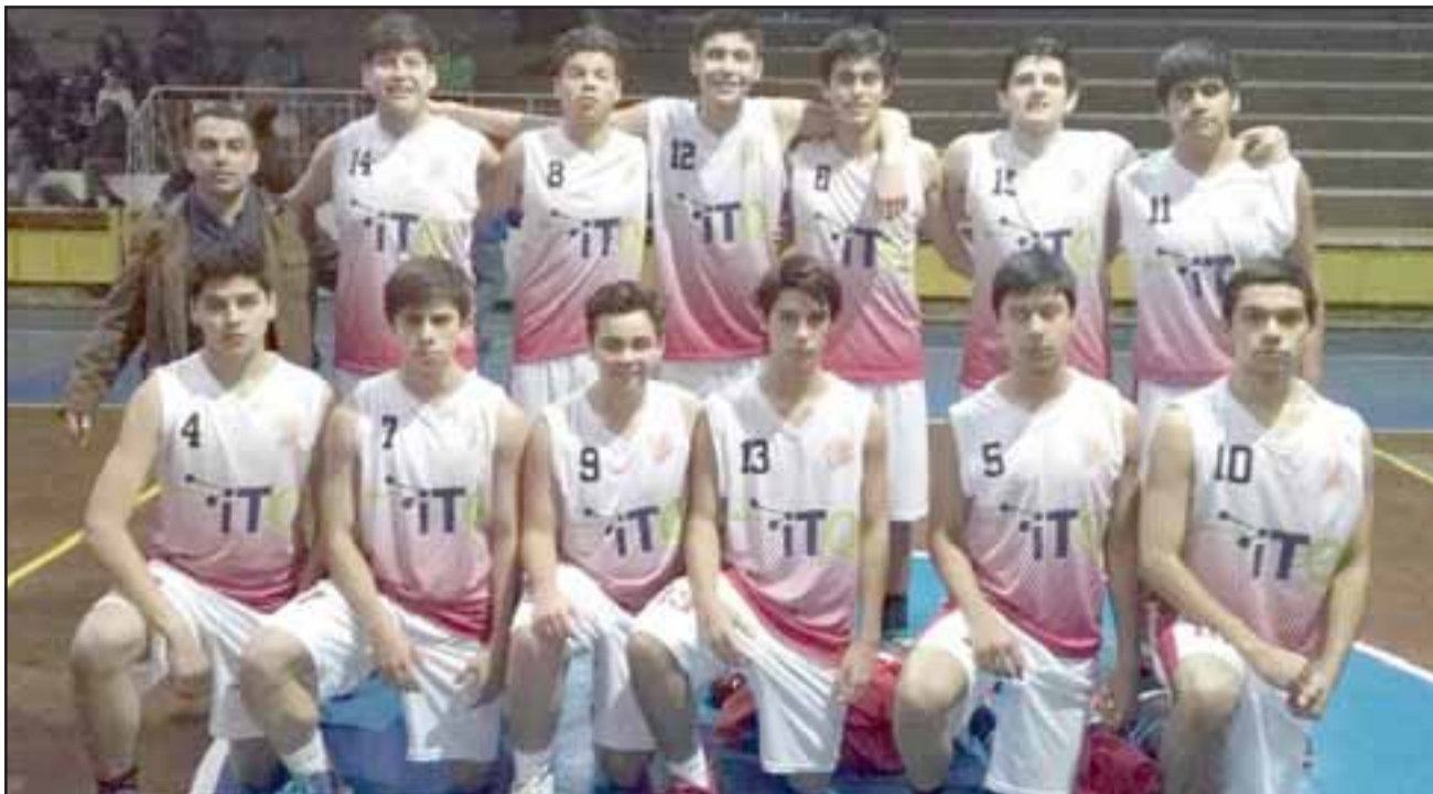
San Felipe Basket será local en el gimnasio del Mixto de San Felipe.

San Felipe Basket – Árabe de Valparaíso; Colegio Nacional – Arturo Prat; Boston College – Sergio Ceppi; Municipal Quilicura – Stadio Italiano; Universi-