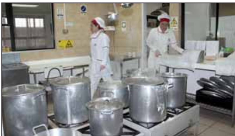
TODO EN ORDEN.- Diario El Trabajo fue invitado a realizar una inspección por toda la cocina y bodega de alimentos.

El Liceo Manuel Marín Fritis es un establecimiento educacional urbano, que nació de la unión de la Escuela N°30 de hombres y la Escuela N°31 de mujeres; el cual en 1971 pasó a llamarse 'Escuela Consolidada de Experimentación e Investigaciones Pedagógicas