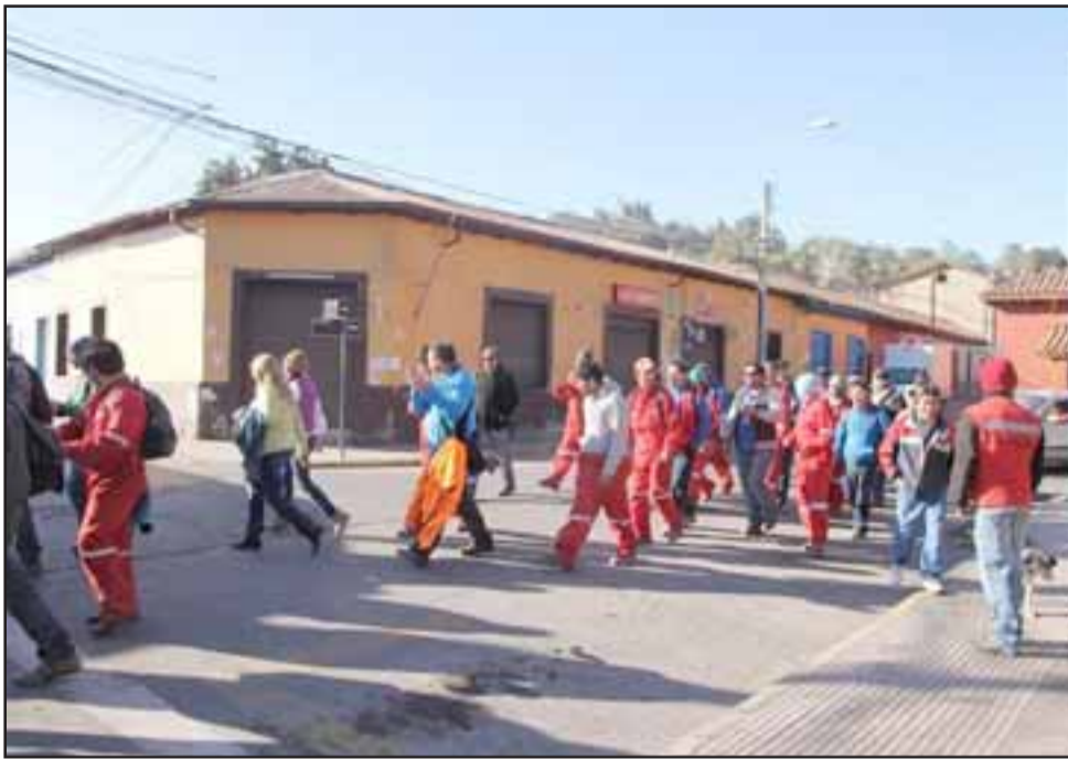
Trabajadores marchan exigiendo pagos por concepto de imposiciones, remuneraciones e indemnizaciones.