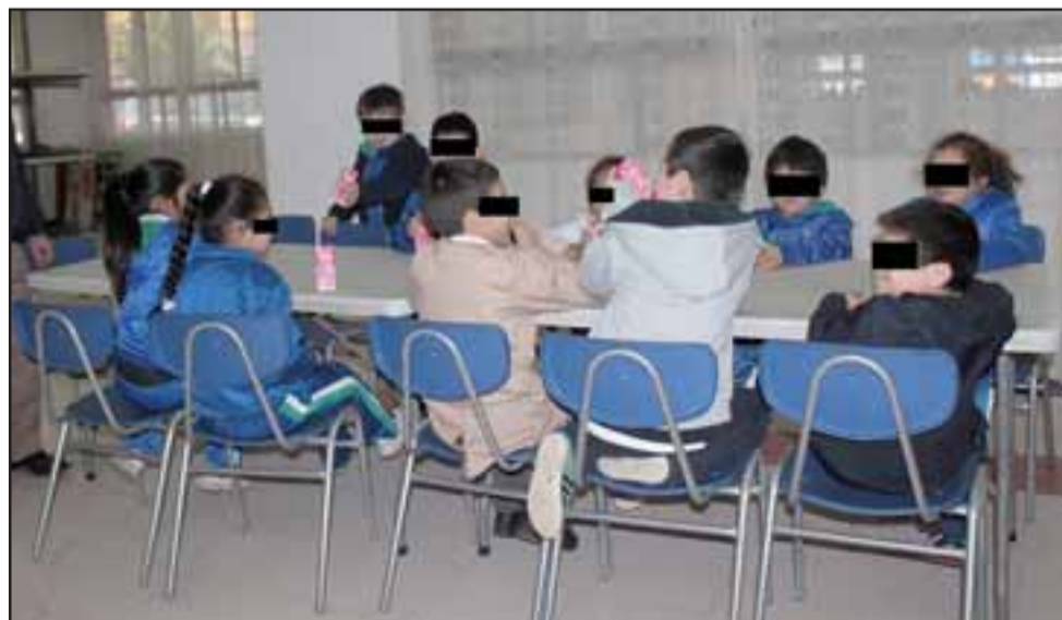
¿PROBLEMA CONTROLADO?- Hasta los niños ya habían reanudado el uso del comedor, aunque estuvo cerrado por dos días.