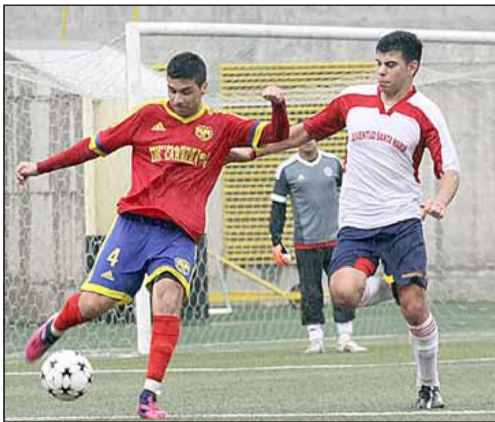
En la final de la Copa de Campeones el conjunto santamariano fue derrotado 4 a 0.

manticismo y son muchos los clubes que invierten fuertes sumas de dinero para reforzar sus series de honor para poder llegar a la Copa de Campeones y es evidente que después del campeonado cumplido, muchos de los jugadores de Juventud quedaron en vitrina y ya son apetecidos por otros elencos. "Varios han recibido llamados, pero confío en que seguirán con nosotros, primero porque saben que a donde llegamos no fue por casualidad y además que somos una familia y entre todos seguiremos trabajando para alcanzar y traer Santa María y el Valle de Aconcagua la Copa de Campeones; el fútbol da revanchas y nosotros queremos la nuestra", finalizó.