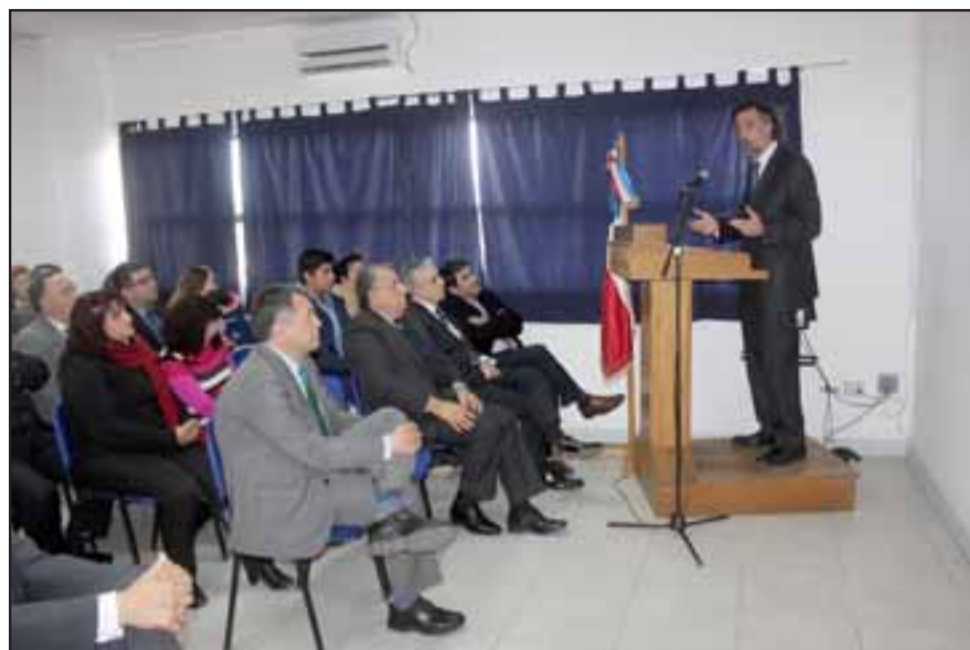
Visitó los cursos y conoció las historias de los alumnos participantes, a través de una especial ceremonia organizada por la institución capacitadora.

Los participantes provienen de las distintas comunas del Valle del Aconcagua: San Felipe, Los An-