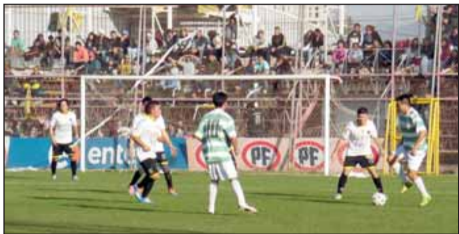
A partir de las diez y media de la mañana se dará el vamos al torneo de la Asociación de Fútbol de San Felipe.