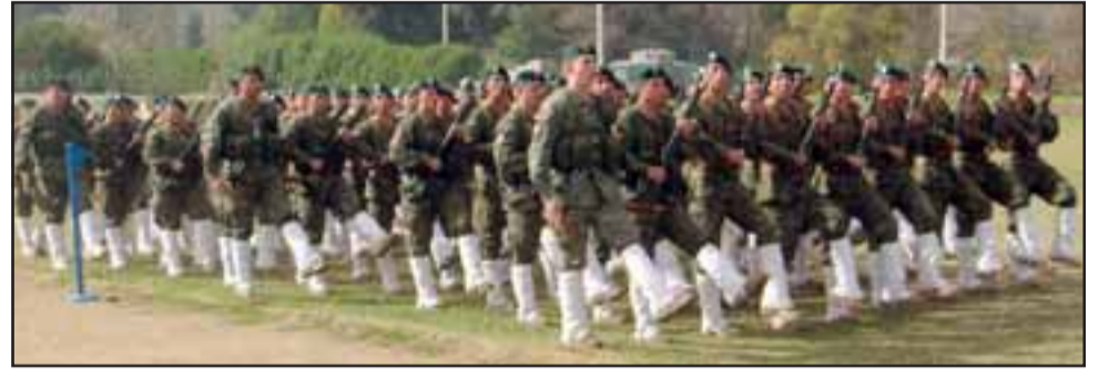
¡DE FRENTE... MAR! Marchando al compás, 303 Soldados Conscriptos recibieron sus armas de combate.

La ceremonia finalizó con el tradicional desfile de las cuadrillas del destacamento frente a las autoridades y público asistente.