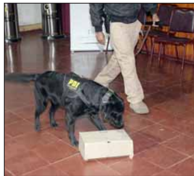
UNIDAD CANINA DE LOS ANDES.- Demostración de detección de drogas, por un particular funcionario de la PDI.

Ahora nosotros en este primer semestre nos hemos abocado netamente en el ámbito educacional y posteriormente vamos a dirigir nuestro trabajo en el ámbito comunitario. En lo que se refiere a la educación, estamos trabajando en dos establecimientos focalizados, donde se hace entrega de una serie de herramientas y se evalúa un plan de acción y un protocolo de actuación frente a situaciones de consumo, además vamos a comenzar a trabajar en el liceo de la comuna, un plan denominado monitores