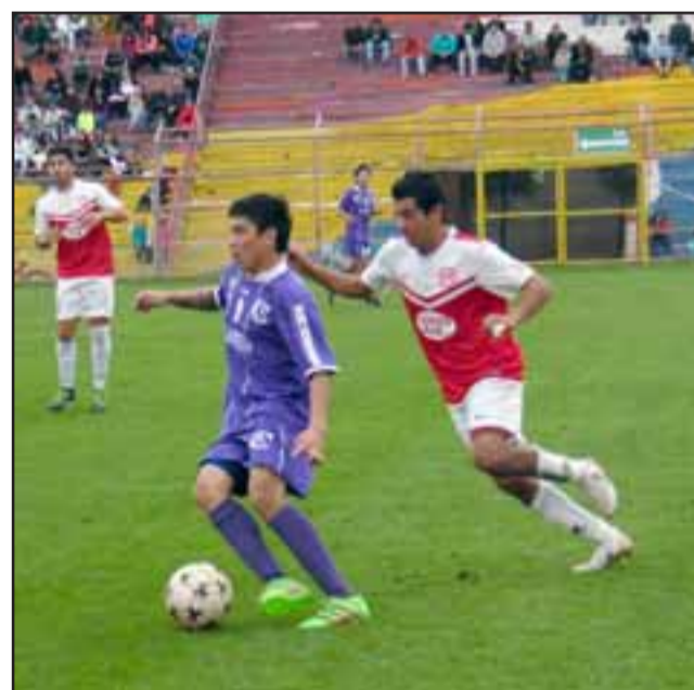
Entre hoy y mañana se realizarán las cenas de clausura del Amor a la Camiseta y Afava