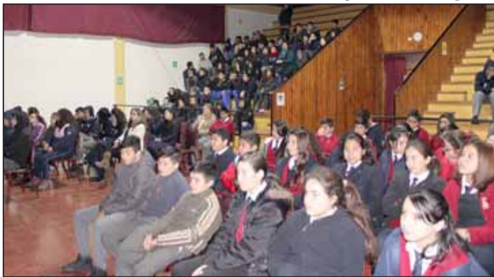
La actividad que se realizó en la sala cultural de la comuna, permitió conocer detalles sobre la actual legislación que penaliza el consumo de drogas y el alcohol en menores de edad.

preventivos, pues la idea principal es hacer entrega de orientaciones y herramientas de prevención, con el fin que los chiquillos ayuden a sus propios compañeros, pues no sacamos nada con que los adultos hagamos entrega de orientaciones si no nos van a seguir”.