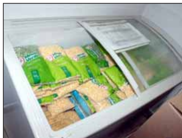
ALIMENTOS SEGUROS.- La bodega de alimentos y los refrigeradores aparentan estar adecuadamente limpios.

Roberto González Short rgonzalez@eltrabajo.cl