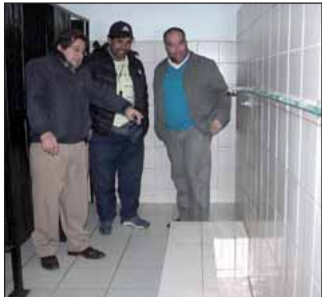
BAÑOS ASEADOS.- Las cámaras de nuestro medio tuvieron acceso a los baños de la escuela, en ese momento todo estaba impecablemente limpio.