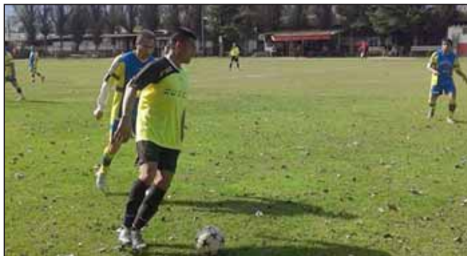
Al igual que la semana pasada la lluvia puede ser un rival invencible para la Liga Vecinal.