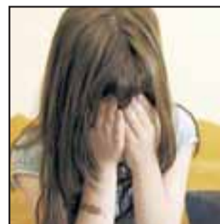
La menor reveló el abuso sexual a su madre, luego de seis años ocurrido el hecho la justicia lo condenó a una pena de cinco años con el beneficio de libertad vigilada. (Foto Referencial).

Fiscalía acusaba robo con violencia en Villa Departamental