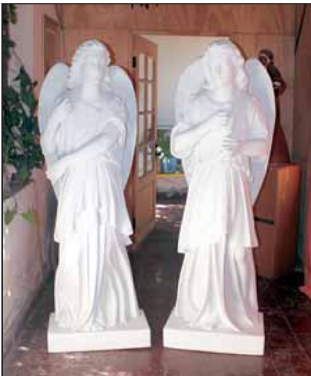
REGRESAN A CASA. - Este domingo, un día antes de su día oficial, será celebrada una Misa en honor a San Antonio de Padua en la Parroquia Almendral a las 12:00 horas.

Roberto González Short rgonzalez@eltrabajo.cl