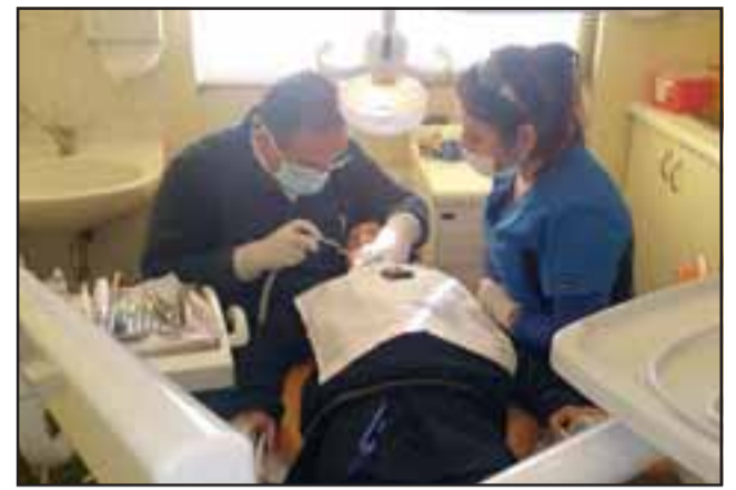
'SEMBRANDO SONRISAS'.- Beneficiará a alumnos de establecimientos municipales, en tratamientos dentales gratuitos.

El objetivo del programa, es cubrir el 100% de los jardines Junji, Fundación