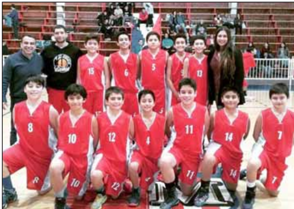
El equipo U13 de San Felipe Basket se impuso a su similar del Árabe de Valparaíso.