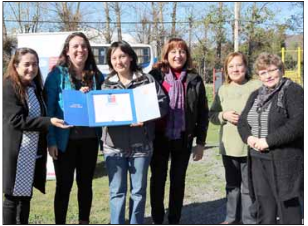
FELICES.- Vecinas de la Villa Campos de Pocuro, orgullosas recibiendo su certificado.-