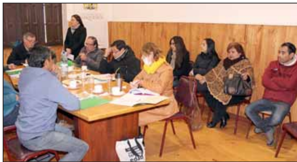
Representantes de las 82 familias que componen este comité, indicaron que llevan esperando 14 años para lograr concretar su proyecto y levantar de estas maneras sus viviendas.

Ahora el llamado que hace el Minvu para dar a conocer los proyectos seleccionados es en el mes de