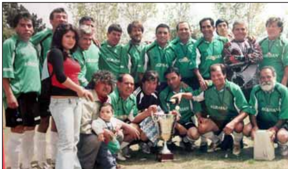
LA U45. - Aquí tenemos a los menores de 45 años, quienes jugaban con todo el peso de su experiencia.