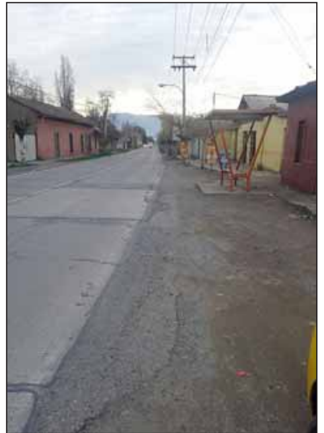
¡CALMA VECINOS!.- La obra ya se encuentra licitada y adjudicada, por lo que la empresa que ejecutará los trabajos debería partir esta semana con la faena.

más que el proyecto se anunció incluso en la cuenta pública del alcalde: «Ha pasado más de un mes y, que yo sepa, no hay nadie trabajando en el alcantarillado San Rafael-Curimón».