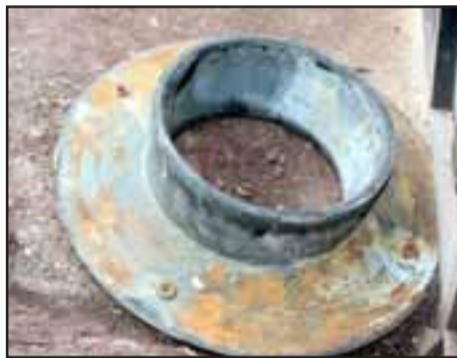
MOLE DE METAL. - Esta es la llanta de metal que actualmente está en el patio de una vecina.