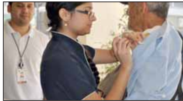
El nuevo llamado a la población tiene como objetivo integrar mayoritariamente a embarazadas desde las 13 semanas de gestación; los niños de entre 6 meses y 6 años y los adultos mayores.

“Hay muchas personas que creen que la vacuna no sirve, porque afirman que de igual manera se enfermaron el año pasado aun cuando se la pusieron. Pero claro, se pudieran resfriar, pero no contrajeron influenza, y la influenza es una enfermedad que mata. El año pasado, murieron 44 chi-