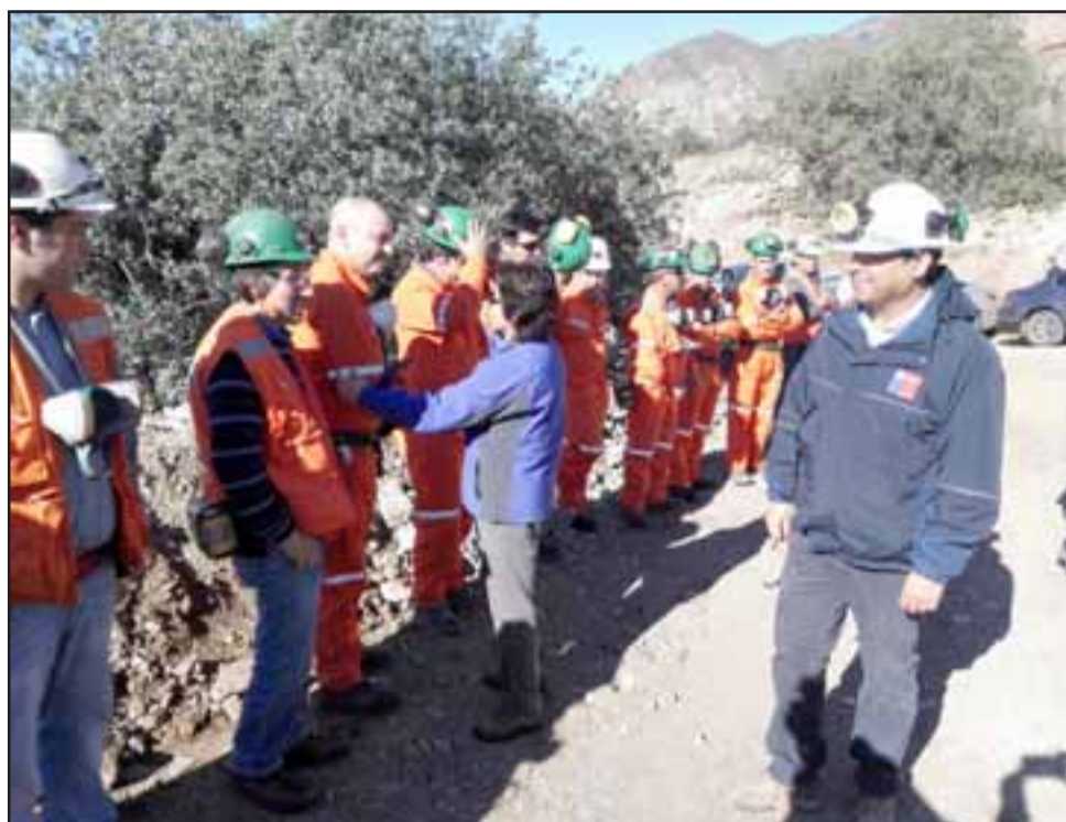
En la Faena Minera La Patricia, 90 trabajadores comenzaron con el proceso de Certificación de Competencias Laborales, convenio firmado entre el Ministerio de Minería y ChileValora

En la oportunidad, la ministra de Minería, Aurora Williams, valoró que "a través de un conjunto de acciones destinadas a reconocer formalmente las competencias laborales de los trabajadores, es que se incorpora por primera vez a la pequeña minería en un proceso de evaluación y certificación", afirmó, agregando que "nos encontramos entonces con un documento reconocido por la industria, lo cual otorga importantes ventajas. La certificación incrementa la empleabilidad, luego, facilita la movilidad y favorece la valoración del traba-