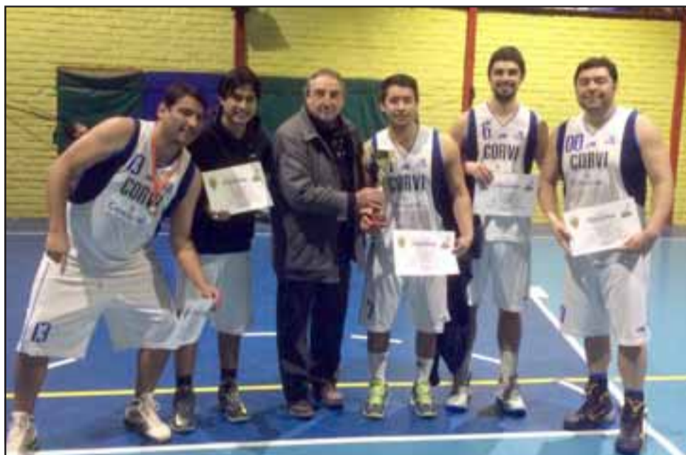
El quinteto quillotano de Corvi fue el mejor en la serie masculina en el tercer encuentro Don Vite.