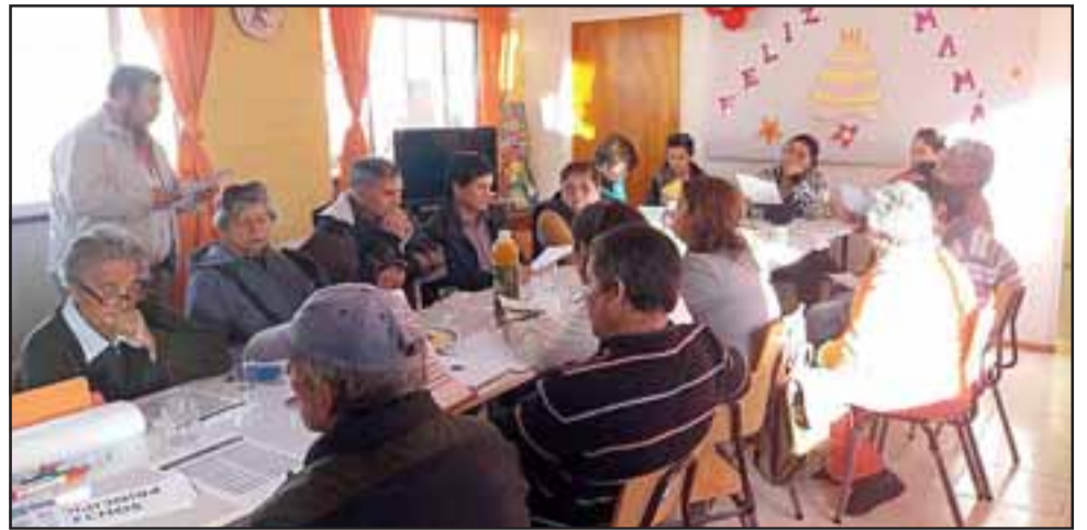
Aproximadamente 20 personas fueron parte del encuentro local.