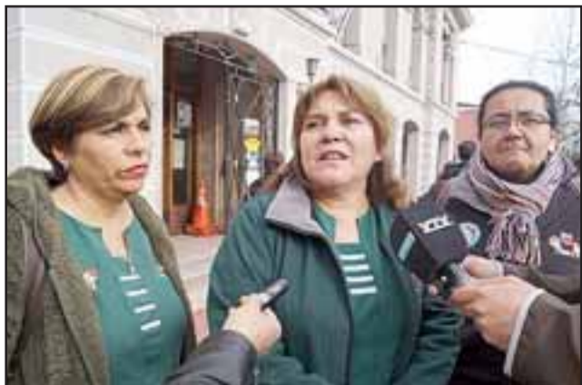
Las funcionarias de jardines VTF Junji de Los Andes se oponen a la ley de homologación que impulsa el gobierno.