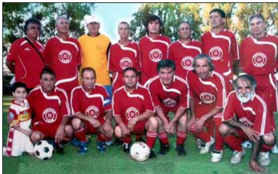
LA U55. - Y ellos son los robles del fútbol, también ganaron sus trofeos y campeonatos.

Roberto González Short rgonzalez@eltrabajo.cl