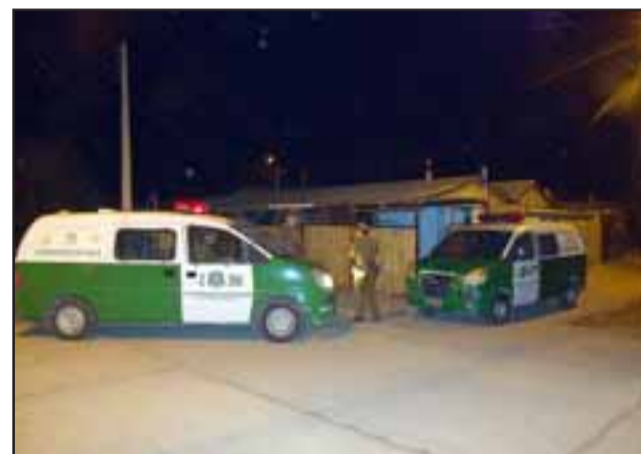
SANTA BRIGIDA: El procedimiento efectuado por Carabineros se originó en el pasaje 6 de la población Santa Brígida de San Felipe.