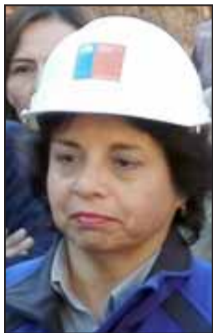
Ministra de Minería Aurora Williams.

La pequeña faena 'Minera La Patricia', en Catemu, fue testigo el pasado viernes, del lanzamiento del Programa de Certificación de Competencias Laborales, para la pequeña y mediana minería, el cual, pretende incrementar la empleabilidad, facilitar la movilidad y