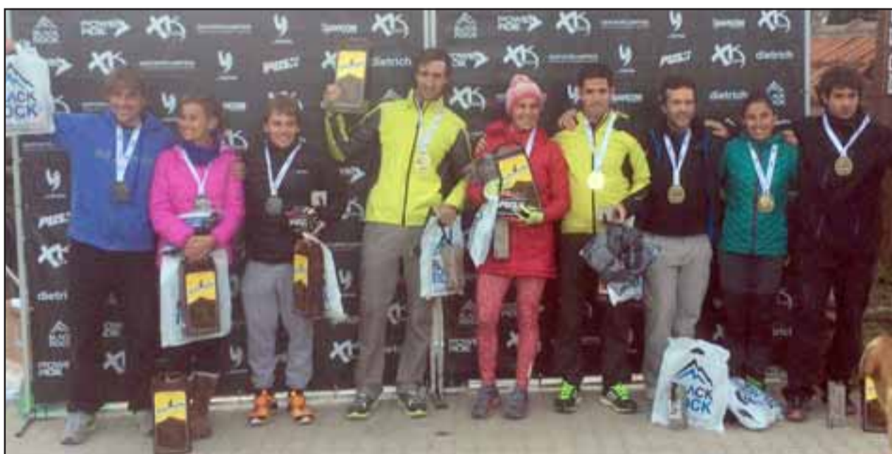
La atleta aconcaquiña subió al tercer lugar del podio en el XK Race de Córdova.