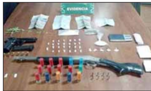
Especies incautadas en el allanamiento ejecutado por el OS7 de Carabineros Aconcagua en el domicilio de los actuales condenados en la comuna de Llay Llay.

Carabineros continuó con el procedimiento, incautando en el patio de la vivienda ocho plantas recién germinadas de cannabis sativa en proceso de cultivo y un total de $572.000 en efectivo atribuibles a la comercializa-