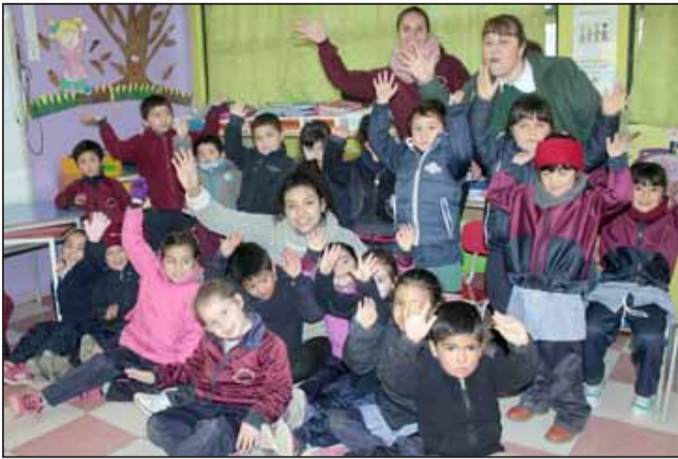
PEQUES ALEGRES.- Así de felices están estos pequeñitos de prebásica, pues este sábado les será entregado el nuevo patio pavimentado.