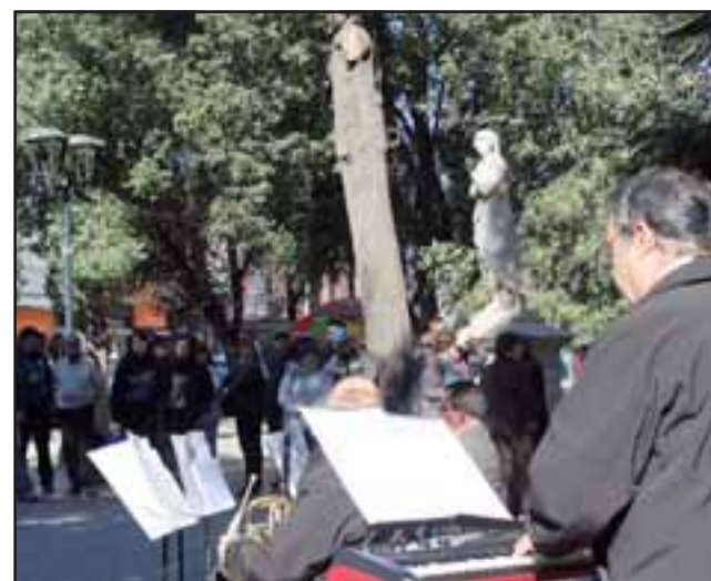
Orfeón Municipal en la esquina de Prat con Coimas animó la celebración del arribo de la época más fría del año.

El profesional, también se refirió a la buena mantención que han tenido las esculturas de la plaza, luego del proceso de restauración, al cual fueron sometidas hace un par de años,