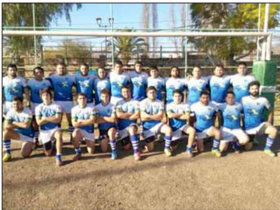
Los Halcones contra Old Navy