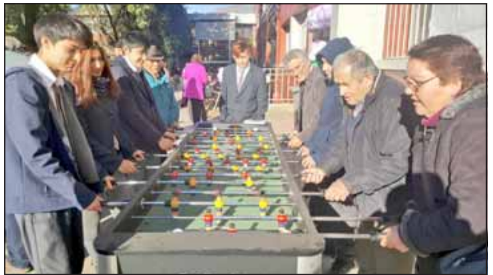
Una jornada cargada de risas y alegría, en la cual los alumnos y adultos mayores disfrutaron de un desayuno y actividades recreativas.

En tanto, el alcalde de San Felipe, Patricio Freire, puntualizó que "es muy importante conmemorar el buen trato hacia los adultos mayores, ellos son los que nos dan la sabiduría, la