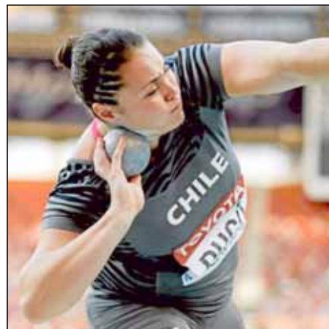
La balista sanfelipeña obtuvo el 38% de las preferencias en el proceso eleccionario para elegir a la portadora del estandarte nacional en Río de Janeiro.

El nombre de la ganadora, se dio a conocer ayer y fue la presidenta Michelle Bachelet la encargada de anunciar el nombre de la maratonista que en Río, disputará por quinta vez unas olimpiadas, además de tener una dilatada y desta-