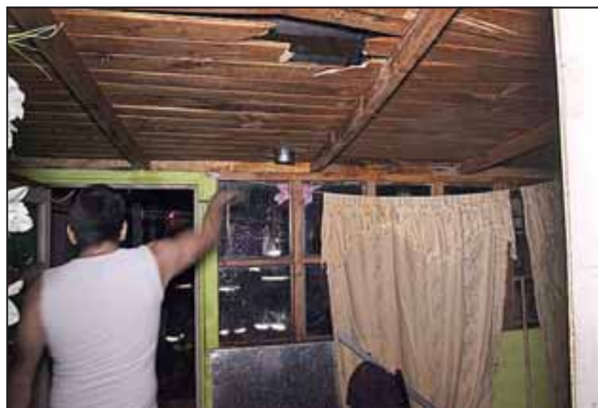
El fuego se habría originado debido al recalentamiento del ducto de ventilación de una salamandra.