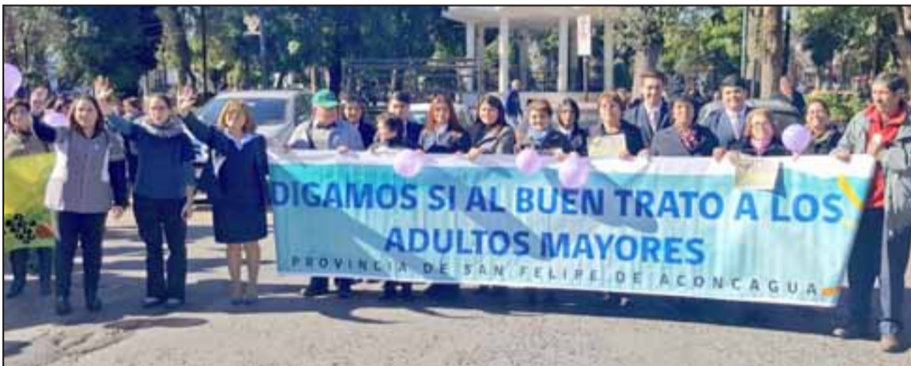
En la oportunidad, los alumnos disfrutaron de un desayuno, actividades recreativas y se sumaron a la marcha por el #BuenTratoalAdultoMayor.