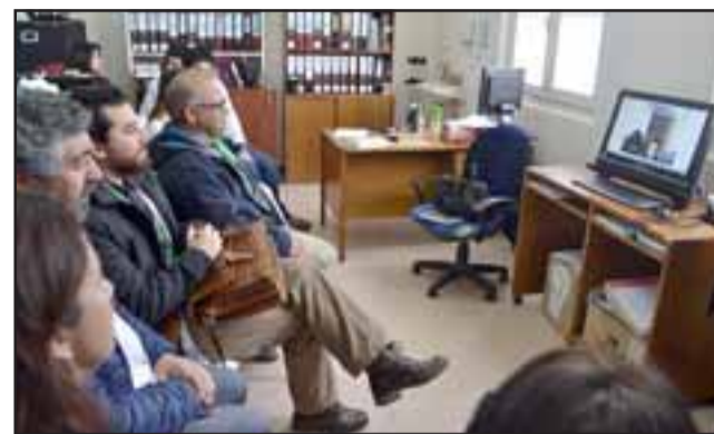
SISTEMA DE TELEMEDICINA.- Con esta plataforma, se busca la optimización de recursos del Servicio de Urgencia, además de establecer un manejo de distancias (sectores interiores de Putaendo) para que usuarios que no requieren hospitalización eviten realizar extensos viajes hasta Putaendo.

La Telemedicina, es una modalidad de atención que consiste en el uso de tecnologías de información y comunicación para acercar las especialidades médicas a los usuarios del sistema de salud a lugares en que no se dispone de los profesionales necesarios para la atención, en este caso, de psiquiatría. Esto forma parte de la estrategia impulsada por el Ministerio de Salud y que ha sido fuertemente apoyada por el Gobierno y la Ministra del ramo, Dra. Carmen Castillo.