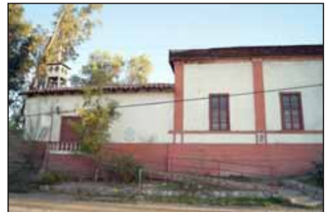
El robo ocurrió en horas de la noche, cuando desconocidos que se encontraba en una gruta empotrada en la pared de adobe del centenario templo católico.