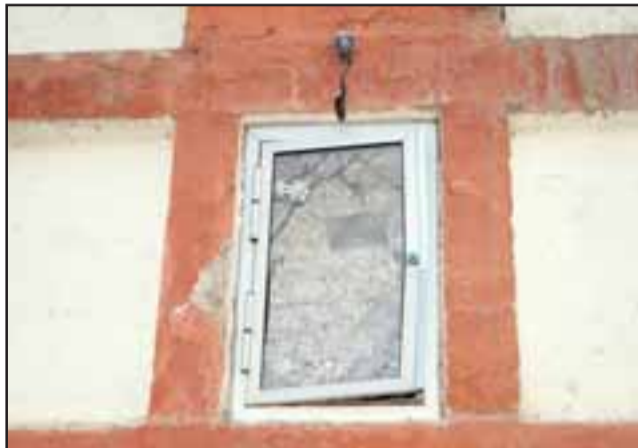
Antisociales rompieron el vidrio para apoderarse de la estatua traída desde Argentina.

sonas no la compren si la ofrecen o si ya lo han hecho puedan contactarse con la comunidad de la capilla de Coquimbito.