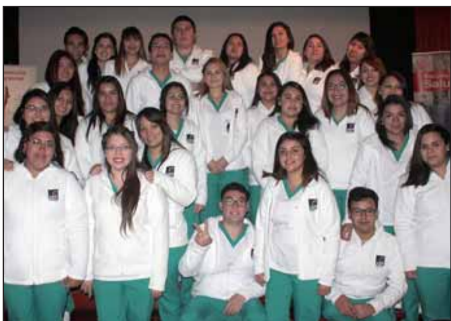
LA GRAN PROMESA.- Este grupo de estudiantes de odontología y enfermería muy pronto estarán llenando de vida y esperanza los salones de muchos hospitales de Chile y del mundo.