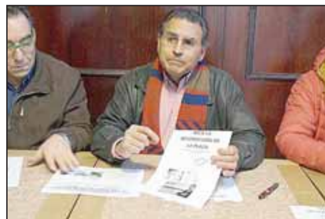
La idea de esta movilización, es llamar la atención de la ciudadanía sobre la eventual construcción de estos estacionamientos que prácticamente destruirían la plaza en términos de como hoy la conocemos al transformarla en una plaza dura con menos árboles y más cemento.

pueden crear otras opciones para crear estacionamientos en superficie, ya sea en las alamedas o bien en terrenos que son de privados y que también reportarían nuevos negocios.