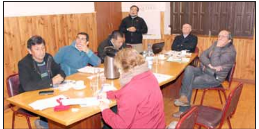
La presentación estuvo orientada, en dar a conocer los alcances de la nueva ley, que establece una serie de normativas sobre la venta de alimentos y la prohibición de estos en establecimientos educacionales.

"En lo concreto, todos aquellos alimentos altos en calorías, azúcares, sodio y grasas saturadas, deberán tener una advertencia en la cara principal de su envase donde se informe sobre el