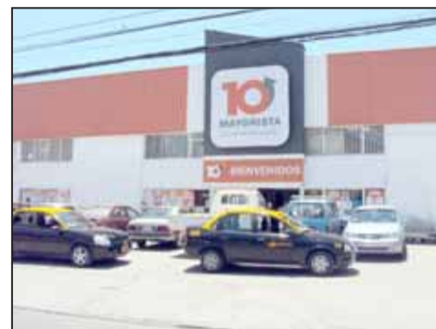
La dupla delictiva robó las especies desde un camión del Supermercado Mayorista 10 ubicado en calle Santo Domingo 111 en San Felipe, siendo reducidos por los guardias de seguridad.

Al lugar concurrió personal de Carabineros para adoptar el procedimiento de rigor bajo los cargos de hurto de especies valuadas en $60.000. Los imputados