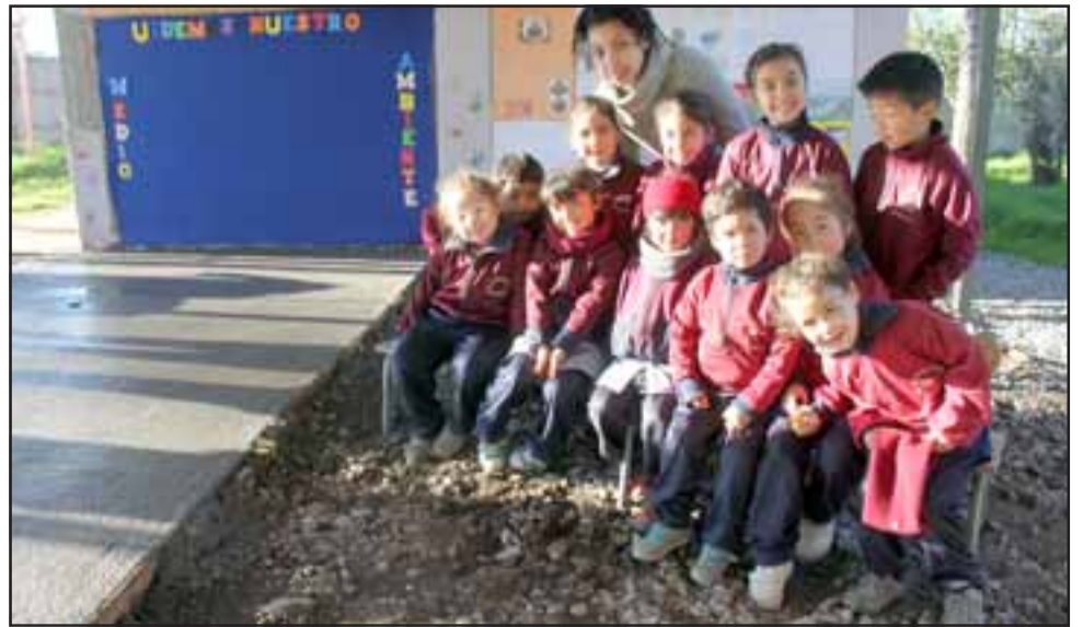
CLARA DIFERENCIA.- Tal como lo muestra esta foto, en una parte vemos la pavimentación y en la otra la parte que aún no es reparada.