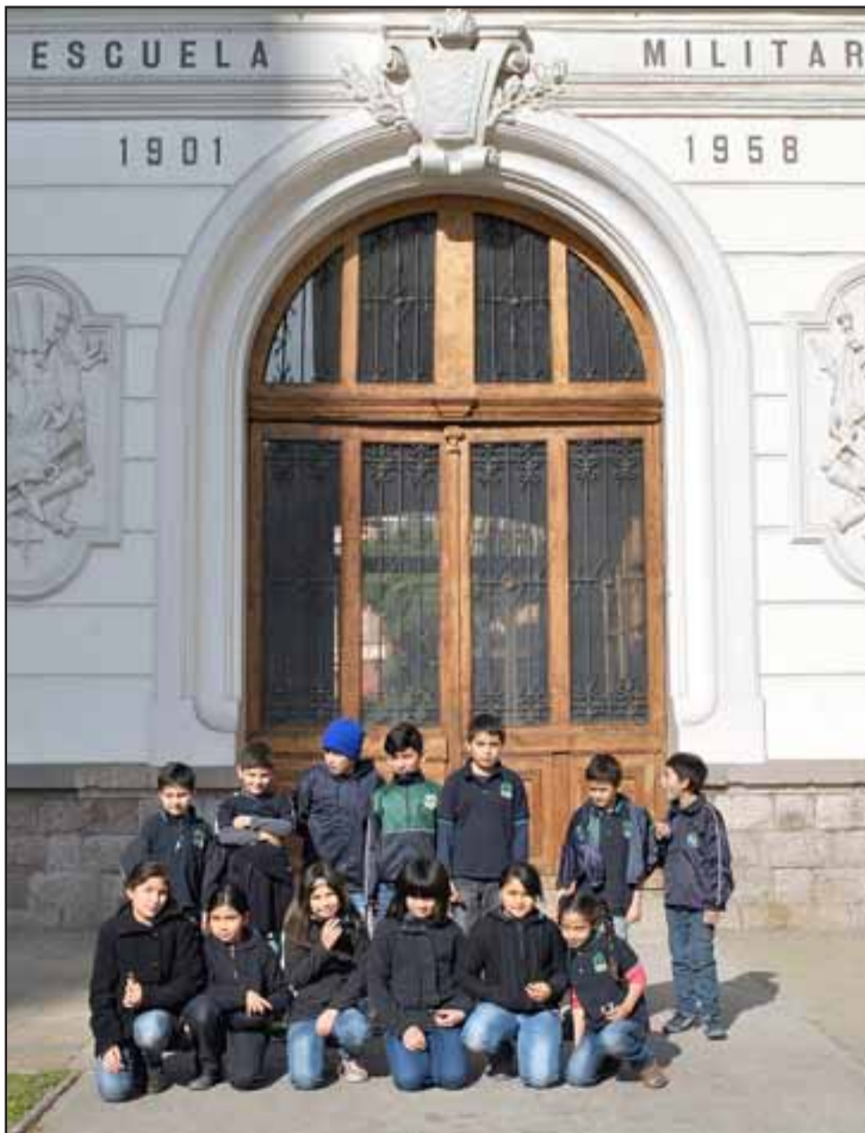
ESCUELA MILITAR.- En la Escuela Militar también estos estudiantes lo pasaron muy bien.