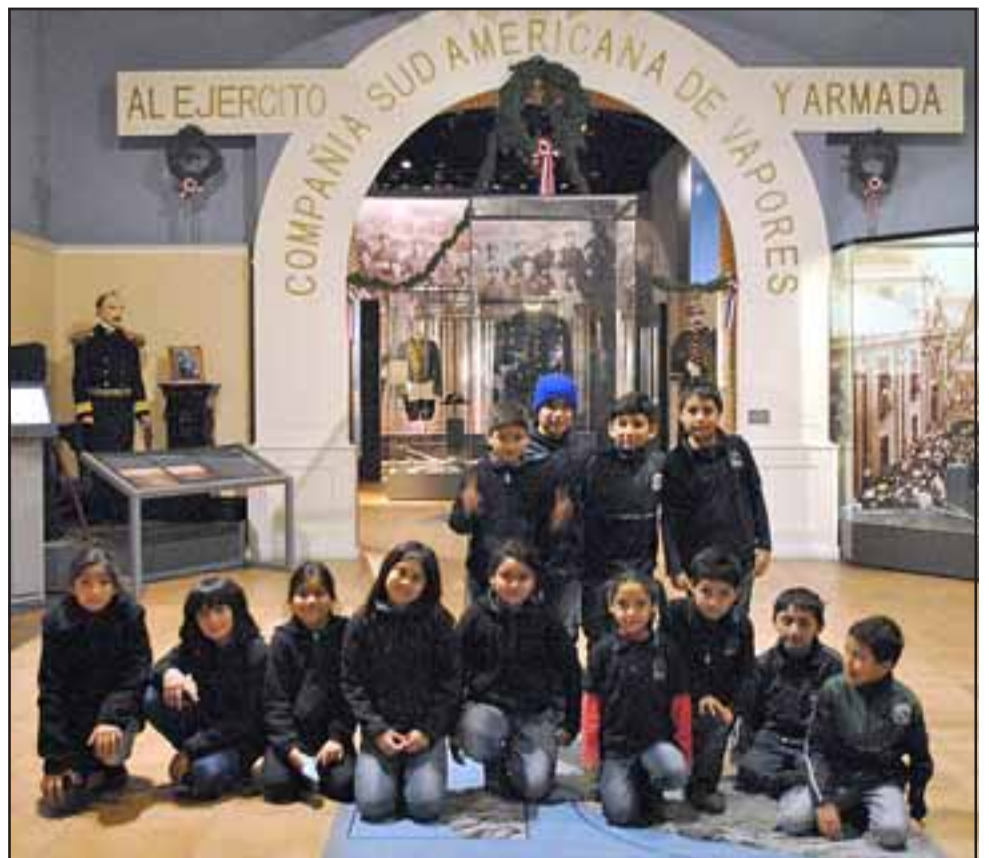
BACÁN.- Aquí tenemos a estos campeones estudiantiles disfrutando de esta gira de estudios en la CIA. Sudamericana de Vapores, en Santiago.