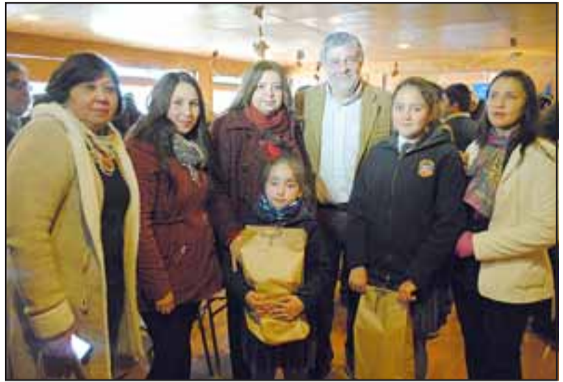
Con masiva asistencia se realizó la premiación del concurso literario organizado por el Departamento de Educación de Catemu, Biblioredes, junto a las escuelas municipales.

Al concluir, los asistentes recorrieron la biblioteca municipal apreciando las obras de cada uno de los participantes que se exhiben por estos días en el recinto, de las cuales se hará llegar una copia a cada familia, como recuerdo de este concurso.