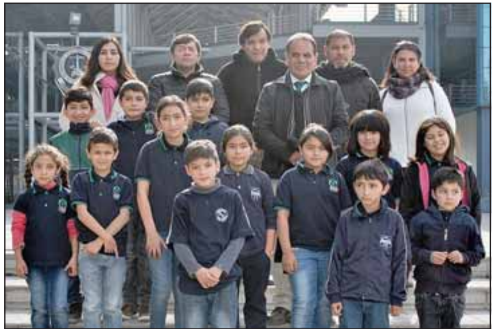
FUTUROS AGENTES.- Ellos están acá en el cuartel general de la PDI, en Santiago.

Roberto González Short rgonzalez@eltrabajo.cl