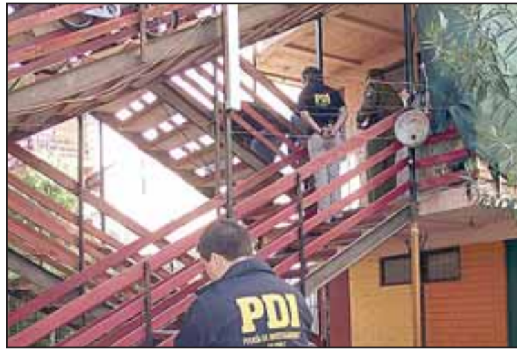
Personal de la PDI investiga las circunstancias en que se registró el hecho, el cual no está del todo claro si se trató de una mal manipulación del arma o de otra causa. (Foto archivo).

El acompañante de la mujer salió del departamento y familiares que se encontraban en el living ingresaron a la habitación, hallando a la víctima tendi-