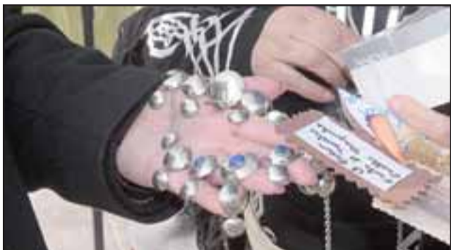
JOYERÍA MAPUCHE. - Joyería mapuche también fue exhibida en la Escuela José de San Martín.