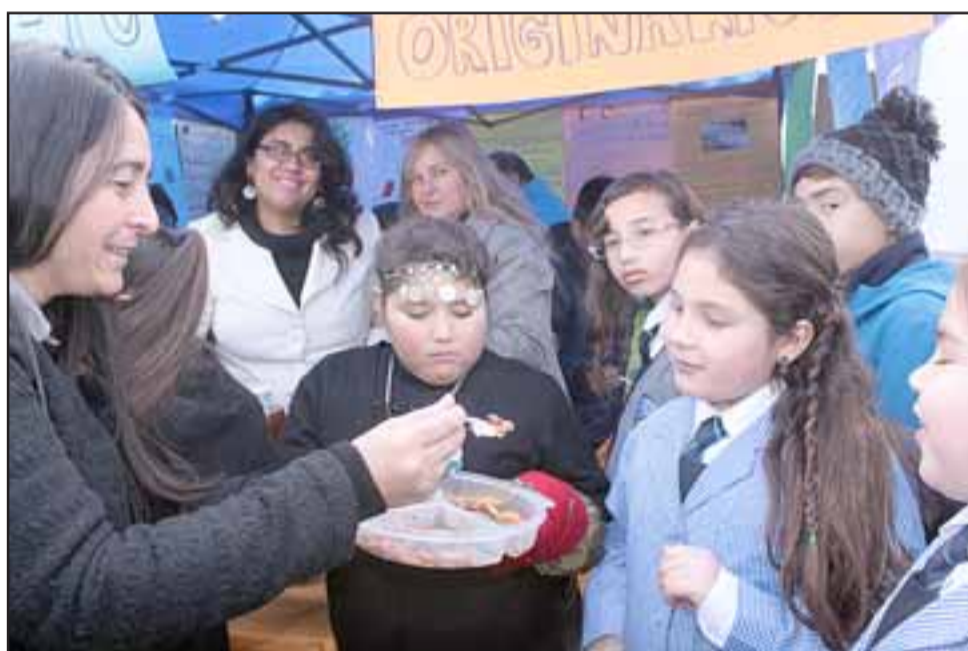
SIEMPRE ORIGINALES. - Aún hoy en día, cada remanente de los pueblos originarios se alimenta con estas dietas especiales.