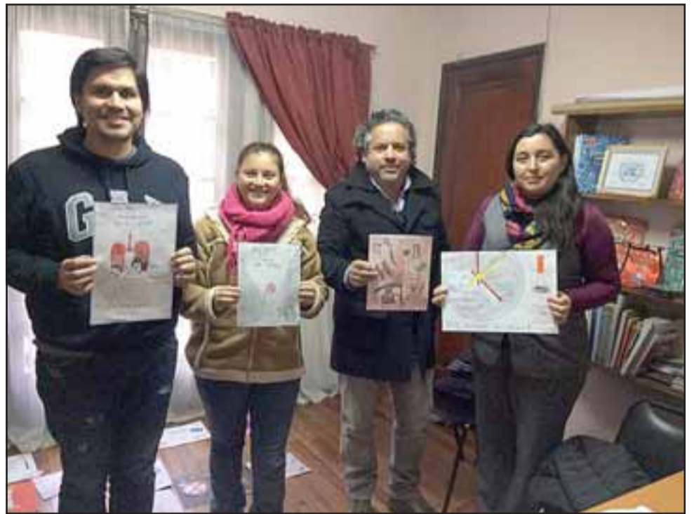
En el 'Mes de la Prevención, la oficina Senda Previene Llay Llay realizó el 1er Concurso de Afiches del día Mundial Sin Tabaco.

Los primeros lugares del concurso serán reconocidos