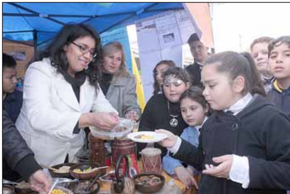
PARA TODOS. - Los profesores se las ingeniaron para que ojala todos sus alumnos recibieran una probadita de esos productos.