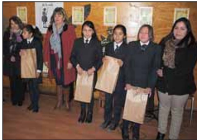
En la biblioteca municipal de Catemu, se llevó a cabo la premiación del concurso.