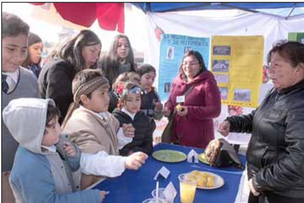
UN MANJAR. - Estudiantes de la José de San Martín disfrutaron de los platillos propios de los pueblos originarios de América.