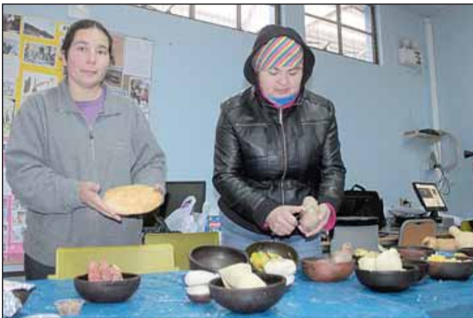
SIEMPRE ELLAS. - Las apoderadas de la Escuela Carmela Carvajal, estas amables señoras, estuvieron a cargo de los platillos típicos para degustar.