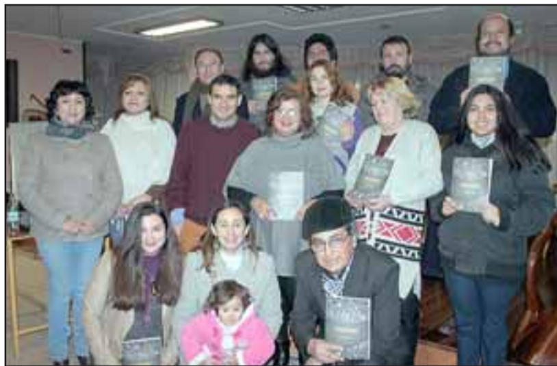
Escritores y amigos de la autora posan para las cámaras de Diario El Trabajo mostrando los libros que compraron.