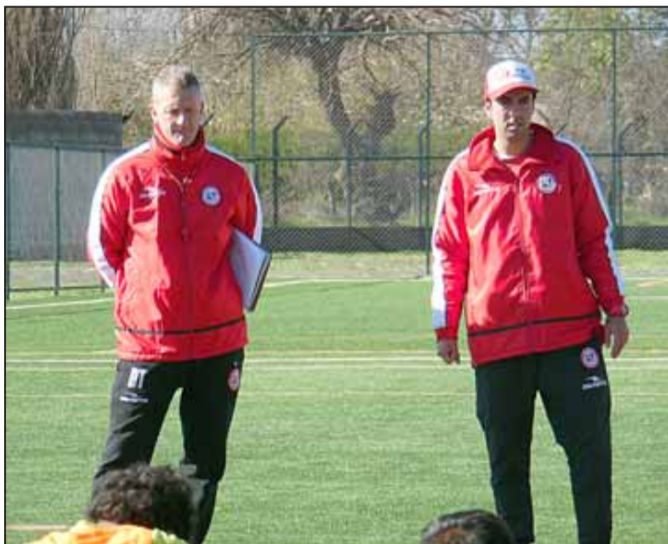
En su segundo duelo amistoso de pretemporada los dirigidos de Christian Lovrinovich igualaron a 2 con Unión Española.

El próximo fin de semana tendrá su tercer apronte, esta vez con Santiago Wanderers en Valparaíso, probablemente en el estadio Elías Figueroa de Valparaíso.