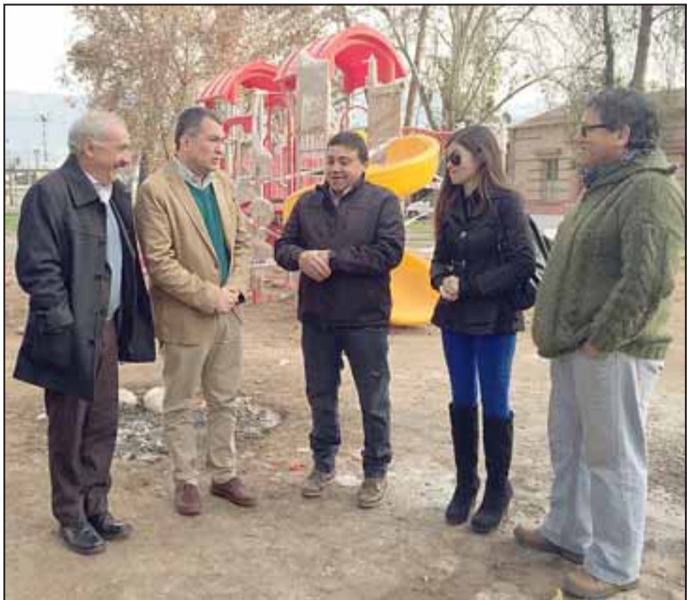
Con juegos infantiles, escaños antivandálicos y mejor iluminación contará la avenida Chacabuco, ya que en el lugar se está ejecutando uno de los proyectos propuestos por el Consejo comunal de Seguridad Pública, con recursos del ministerio del Interior.