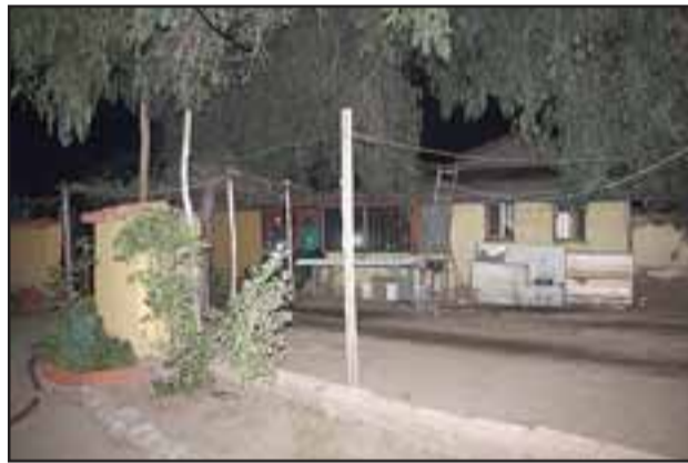
A eso de las 02:30 horas de la madrugada de este lunes, un amago de incendio se registró en un domicilio ubicado en calle El Carmen de Rinconada de Silva.

tomen los resguardos necesarios en el uso de sistemas de calefacción a leña, ya que este es el segundo hecho de similares características que ocurre en menos de dos semanas en la comuna.