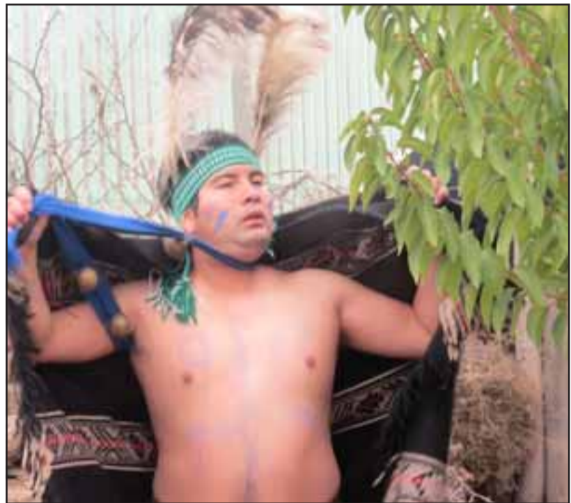
Hombres de la comunidad, bailan al son de trutruucas y cultrunes, acompañados por el canto ancestral de las mujeres, músicos y asistentes, rondando el Rewe.