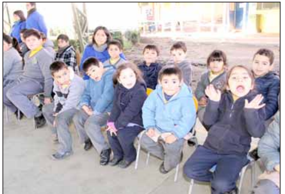
Con una sencilla, pero muy emotiva ceremonia, la Escuela Viña Errázuriz de la comuna de Panquehue celebró su aniversario N° 112.