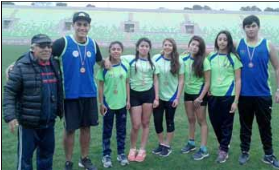
Los atletas pusieron a Llay Llay dentro de lo más selecto del atletismo escolar de la quinta región.