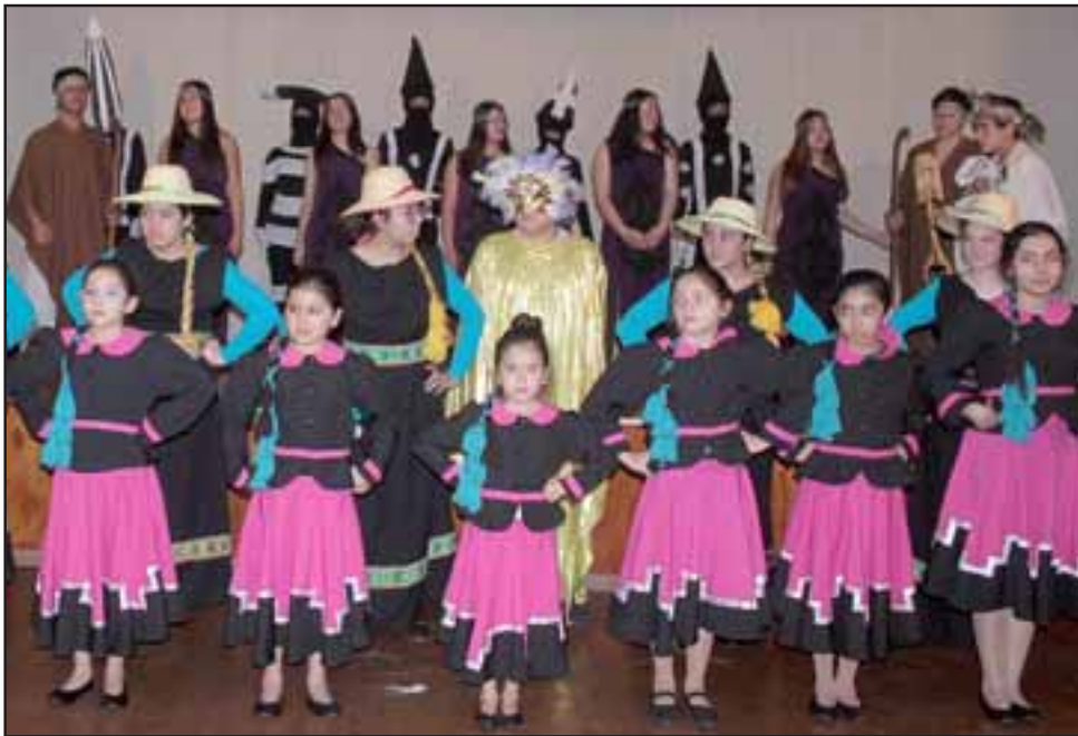
AÑO NUEVO MAPUCHE. - Los chicos, de todas las edades, expresaron con gracia y talento su alegría por la llegada del Año Nuevo Mapuche.