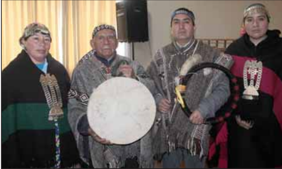
SIEMPRE VIGILANTES. - Ellos son mapuches chilenos que enriquecen el valor cultural de Aconcagua, pues son también vigilantes de la milenaria herencia de su propia sangre.