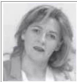
Por Patricia Boffa

Nuestro seleccionado nacional y su condición de bicampeón nos dice mucho más que un brindis y un pan crujiente por la