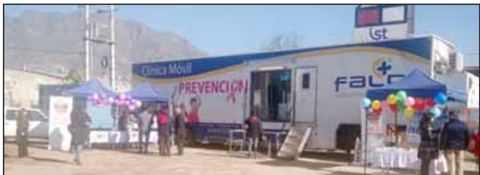
Clínica Móvil de la Fundación Arturo López Pérez, estará a disposición de las mujeres que no se hayan realizado una mamografía en los últimos 2 años.