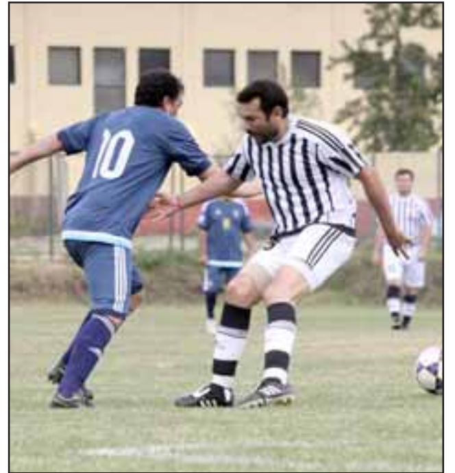
Los distintos combinados del valle Aconcagua ya saben quiénes serán sus oponentes en la primera fase de los regionales de Honor y Súper Senior.

Putaendo – San Esteban; Rural Llay Llay – Llay Llay; Rinconada – Santa María; Catemu – Los Andes; San Felipe – Calle Larga.