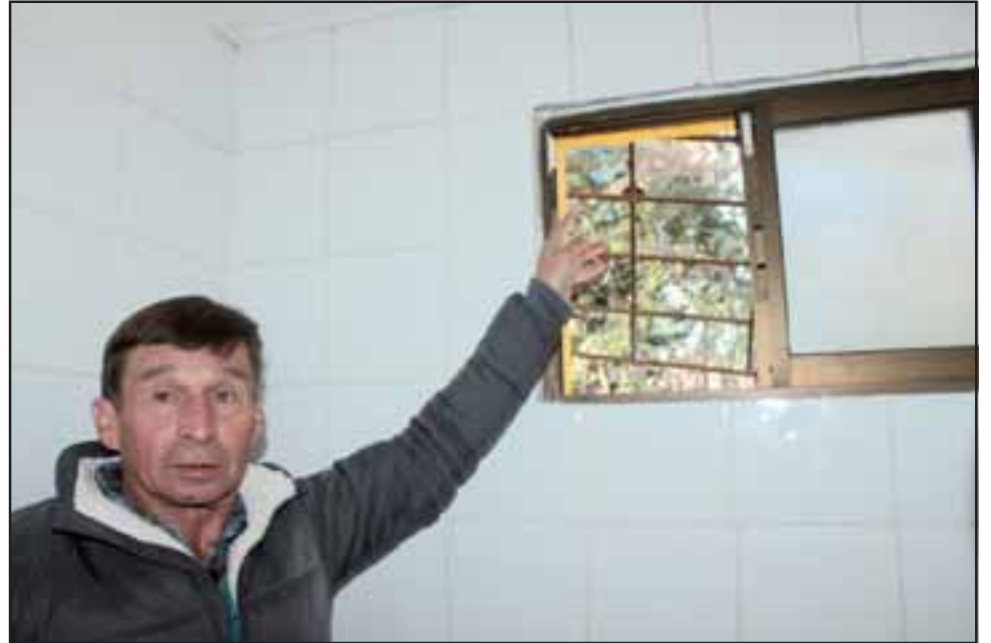
Los antisociales rompieron la protección de la ventana para acceder hasta las instalaciones y concretar el robo.

«Son 352 socios a los que nuestra cooperativa brinda agua en este sector, estoy muy triste porque nunca me había ocurrido algo como esto, se evitó que siguieran robando todo gracias a un vecino que observó las instalaciones ya de noche y sin iluminación, los delincuentes se llevaron cinco computadores nuevos, los que estaban siendo usados para un programa de Internet para los niños y jóvenes de