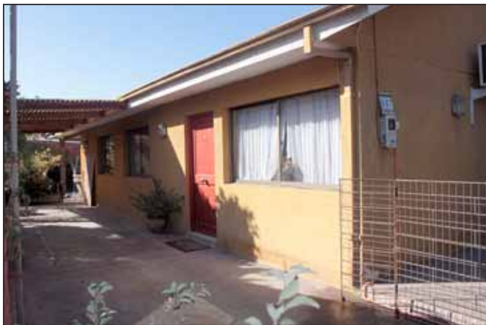
SIN CAPTURAS. - Esta es la vivienda en donde ocurrió este violento atraco, hasta el momento no hay detenidos por este asalto.