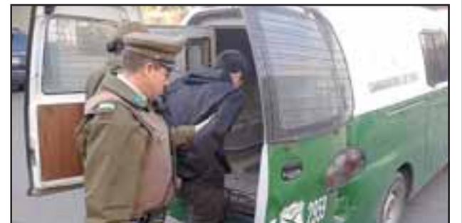
El imputado fue detenido y puesto a disposición de la Fiscalía para la investigación del caso. (Foto Archivo).

En la esquina de calles Combate de Las Coimas con Prat, el antisocial pretendía descerrajar el carro utilizado para la venta de vestuario pasada la medianoche de este domingo.