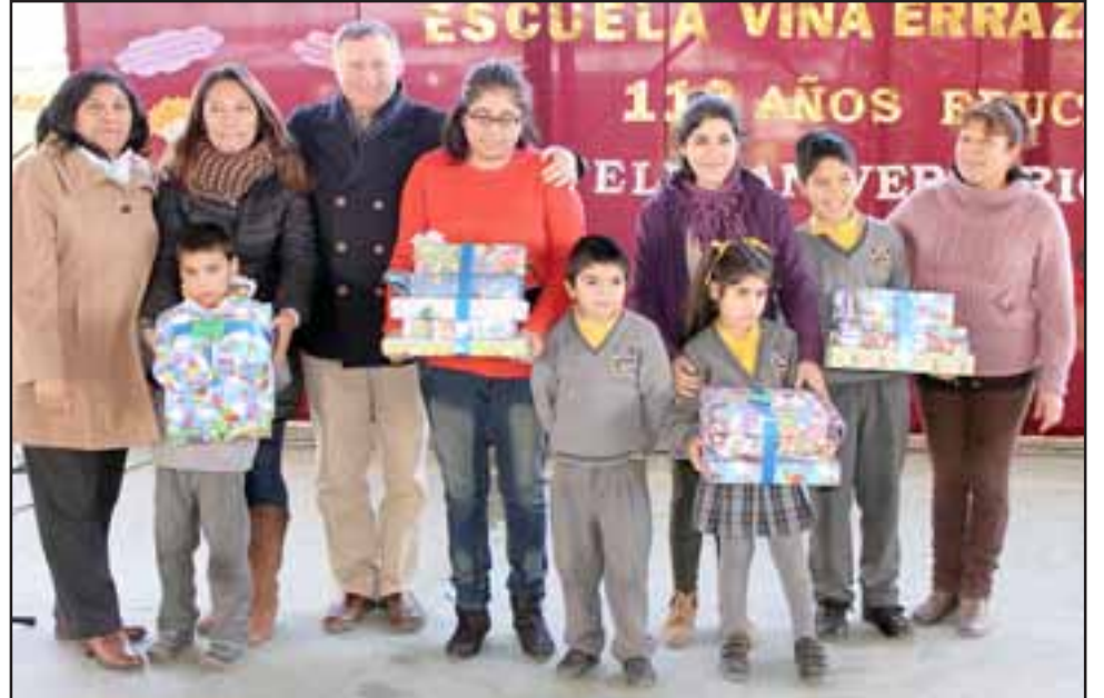
Sin importar el frío, los menores de distintos cursos, recibieron distintos reconocimientos por sus actividades recreativas en la semana aniversario, evento efectuado ante la presencia de las autoridades como padres y apoderados presentes.

La Escuela Viña Errázuriz se fundó un 03 de julio de 1904, cuando Maximiano Errázuriz Echaurren, al darse cuenta que este sector carecía de escuela, decidió crear un colegio, llamándose Escuela de Hombres N° 33 de Los Andes. El 07 de marzo de 1949 se le llamó Escuela Particular Mixta San Francisco de Asís, a car-