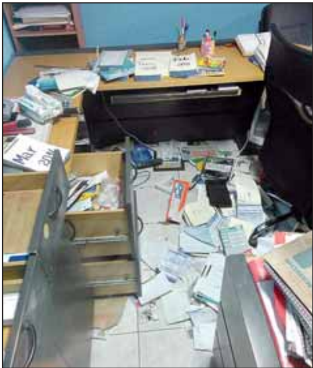
En completo desorden: Los Antisociales registraron los escritorios de las oficinas de la Cooperativa Agua Potable en el sector La Troya de San Felipe, en búsqueda de dinero.

nuestra comunidad, también se usaban para que los vecinos hiciéramos trámites y gestiones en línea, también se llevaron dos cámaras fotográficas pertenecientes a la cooperativa, y un computador con una mancha de pintura azul, la