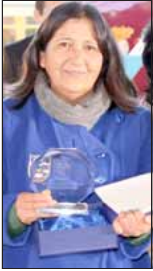
Premiación para la maestra, quien siempre aporta a sus alumnos sobre sus competencias profesionales de orden intelectual y afectivo.