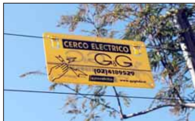
ALTO VOLTAJE. - El cerco de la vivienda ahora está electrificado en su totalidad, según explicó la víctima, dentro de la casa será igual.

- Yo lo que puedo decir tras esta amarga experiencia, es que ya no podemos los sanfelipeños seguir tolerando este nivel de delincuencia, porque Carabineros sólo cuidan los barrios de los millonarios y poderosos, pero las casas de la gente humilde ni pasan a vigilar de vez en cuando. Esta experiencia no se la deseo yo a nadie, porque no es justo que un hombre intachable, honesto y quien