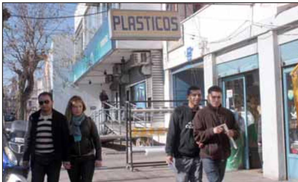
COMERCIANTES HORRORIZADOS. - La dueña de Miniplastic de San Felipe relata en Exclusiva a Diario El Trabajo los instantes de horror vividos por ella y sus esposo a manos de dos violentos delincuentes en su propia casa.

- No pude, ni quise verle la cara a esa mugre, no me ensucié mis ojos viendo al que no tenía capucha. Ya estoy haciendo los trámites para poder comprar mi arma de fuego, luego de terminar mi curso de disparo, espero no tener que usar esa arma, pero no estoy dis-