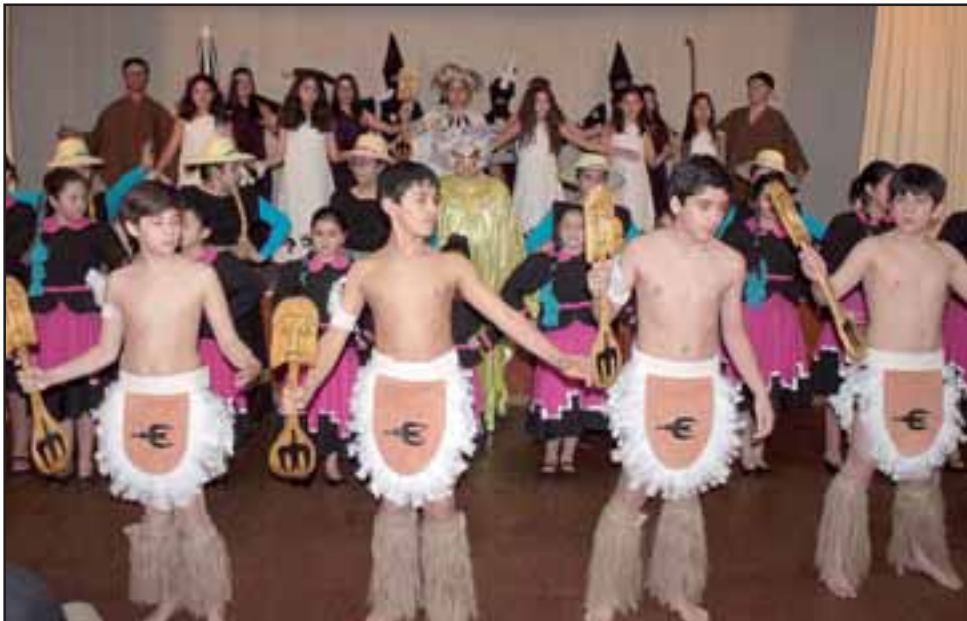
HISTORIA Y HERENCIA. - Varios grupos estudiantiles del IAC interpretaron las danzas más simbólicas de nuestros ancestros.