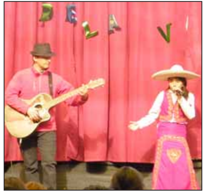
Con la canción No te creas tan importante , la estudiante de sexto año básico de la escuela El Corazón, se quedó con el primer puesto en el Primer Festival de la Voz del Liceo San Esteban.