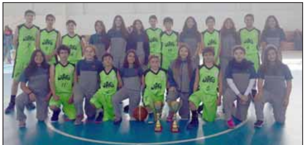
De manera muy sólida, los distintos seleccionados del José Agustín Gómez, se coronaron como los mejores en la fase provincial de los Juegos Deportivos Escolares.

tivos que no parecen lejanos, ya que Rodríguez confía en que sus equipos podrán dar la pelea para llegar a dichos eventos. "En los varones tenemos muchas posibilidades y en las mujeres también hay posibilidades" señaló el estratega del José Agustín Gómez.