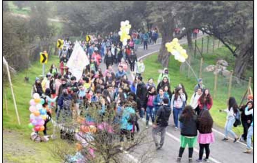
Esta peregrinación que contempló un recorrido de 18 kilómetros, fue la ocasión propicia para que los jóvenes reflexionaran en cómo Dios nos regala cada día su misericordia de manera gratuita.