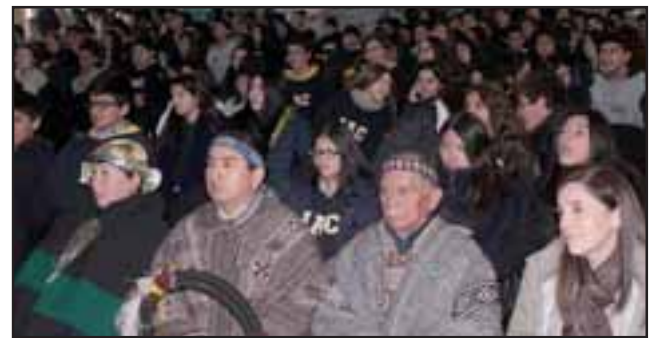
LLENO TOTAL. - Con un gran público y mucho entusiasmo, la comunidad educativa del IAC rindió tributo a los pueblos originarios de América.