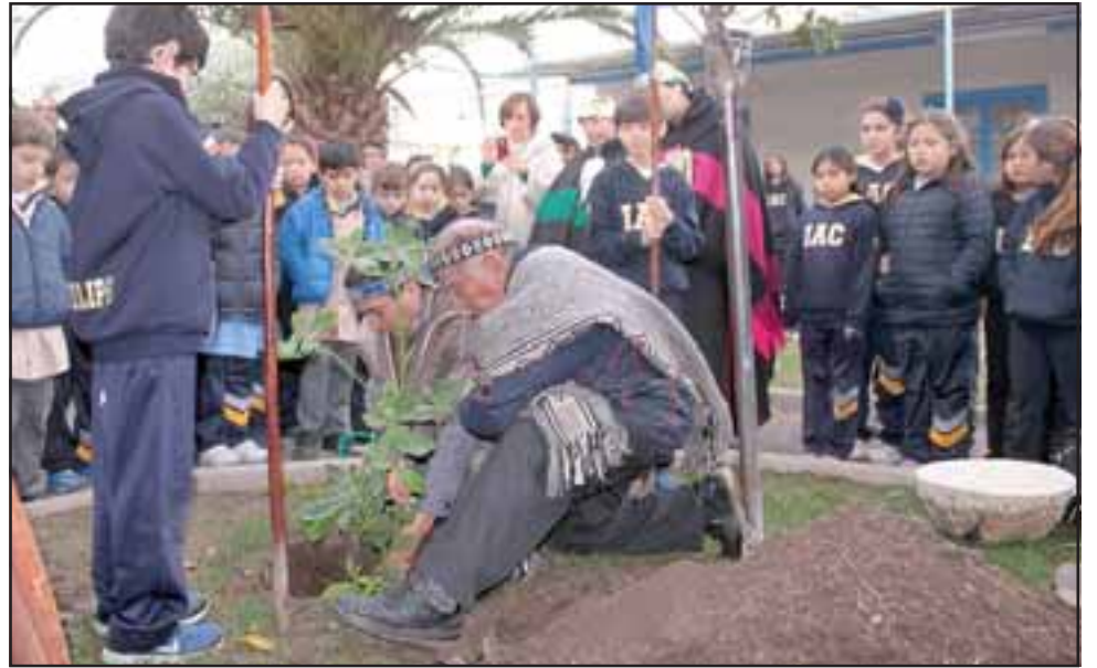
RESPETO A LA VIDA. - Árbol sagrado.- Con gran solemnidad estos representantes de nuestros pueblos originarios procedieron a plantar su árbol sagrado en el patio del IAC.

rio El Trabajo , tomaron también registro del ritual que involucra las rogativas mapuches y la plantación de su árbol sagrado (Canelo) en el patio del IAC, así, tras plantarlo y regarlo con agua, los niños este año se involucraron más con estas costumbres ancestrales para aprender de nuestros hermanos mayores.