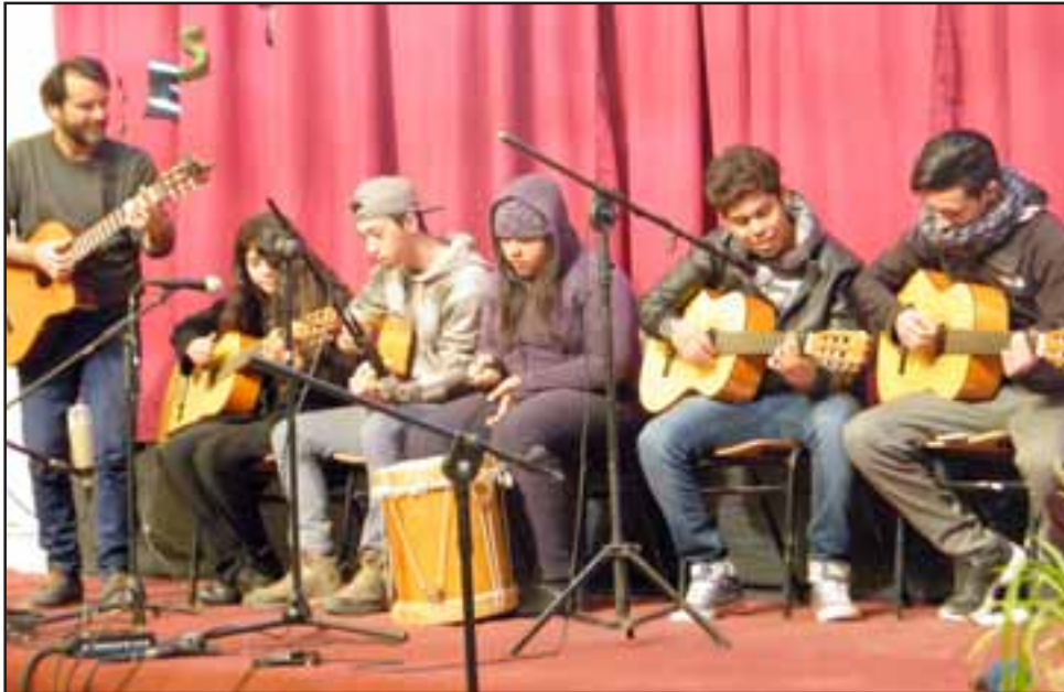
El taller de música del Liceo San Esteban, fue el encargado de cerrar la jornada festivalera con un tema de Violeta Parra.

La actividad se realizó en uno de los patios del liceo y contó con la asistencia de profesores y alumnos del establecimiento.