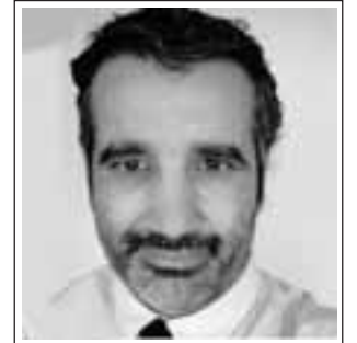
Por Mauricio Gallardo Castro

Siempre hemos sabido que los cambios son tan necesarios como las ideas y que si más propuestas transversalmente reconocidas se sitúen en el lugar y tiempo correc-