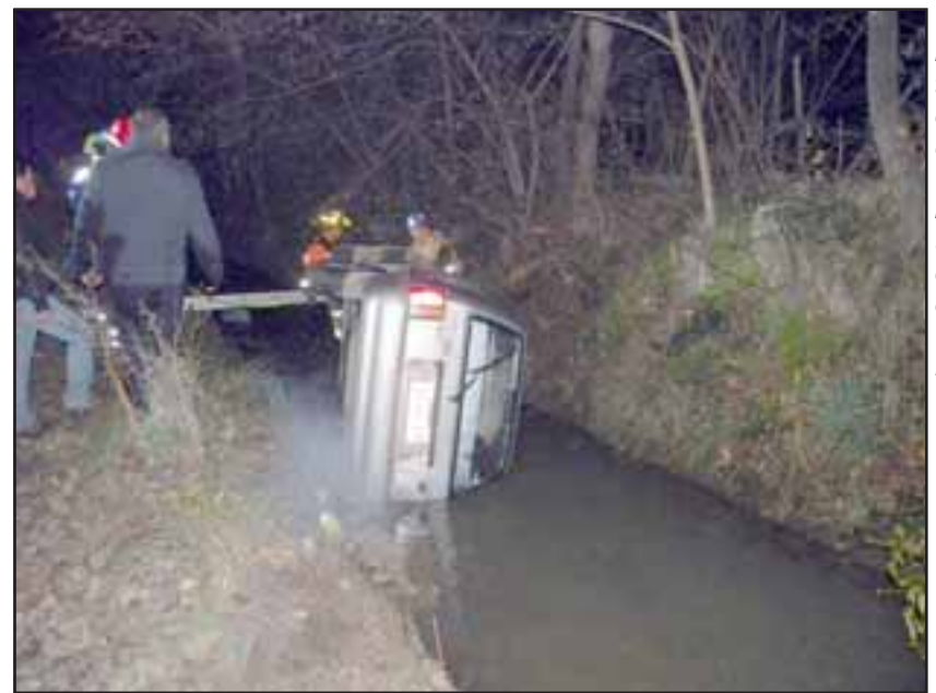
Un automóvil la tarde del domingo cayó y volcó en el interior de un canal de regadío en calle Víctor Korner.

niente por esa arteria y luego de enfrentar una curva perdió el control y se fue hacia su derecha cayendo y luego volcando de costado