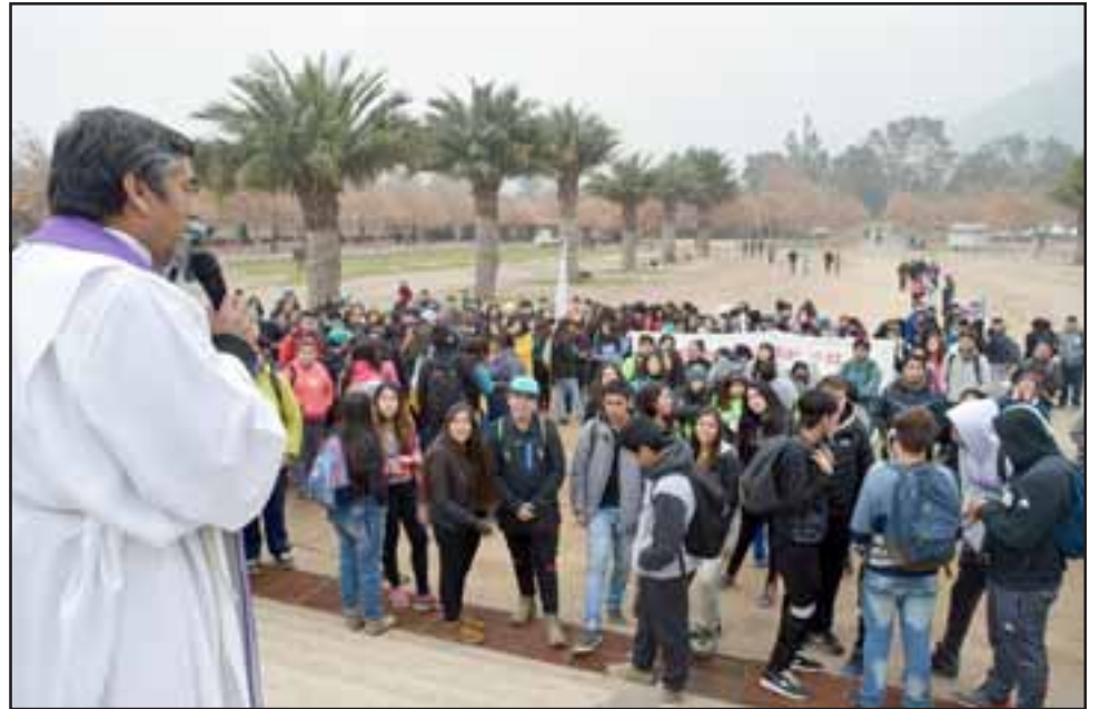
Los peregrinos fueron invitados a cruzar la puerta santa, signo de una verdadera conversión de nuestro corazón.

Más adelante monseñor Cristián Contreras Molina, continuo manifestado; “todos estamos llamados a ser misioneros de la misericor-