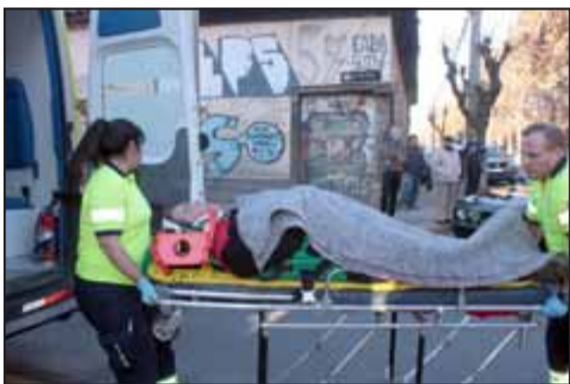
Con lesiones y cortes de consideración el chofer del taxi fue asistido por el Samu.