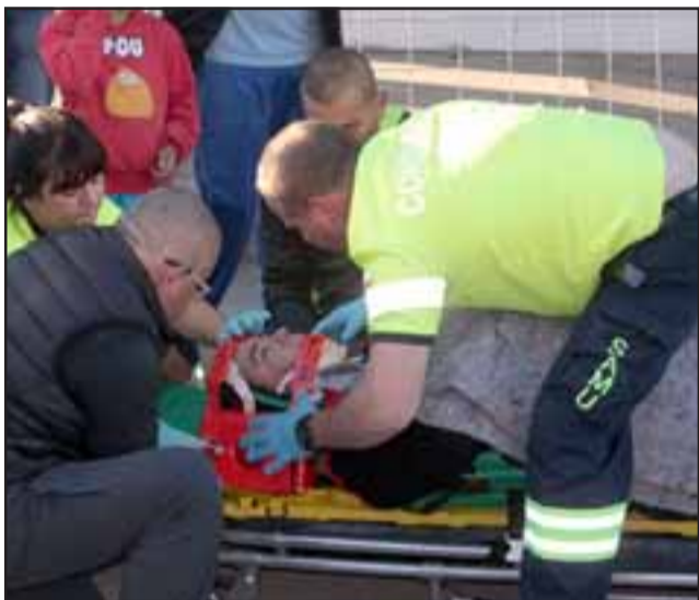
El pasajero del taxi resultó lesionado siendo asistido por los paramédicos del Samu.