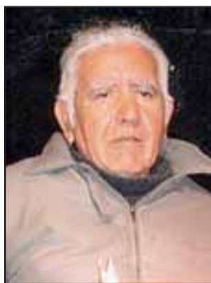
Varias veces el Municipio premió la labor formadora y deportiva de este querido sanfelipeño.

eso y muchos logros más, el Municipio le premió públicamente en varias ocasiones. Nosotros como familia estamos muy agradecidos con la vida, porque papá pudo también ser feliz haciendo que otras personas lograran realizar sus sueños personales en el depor-