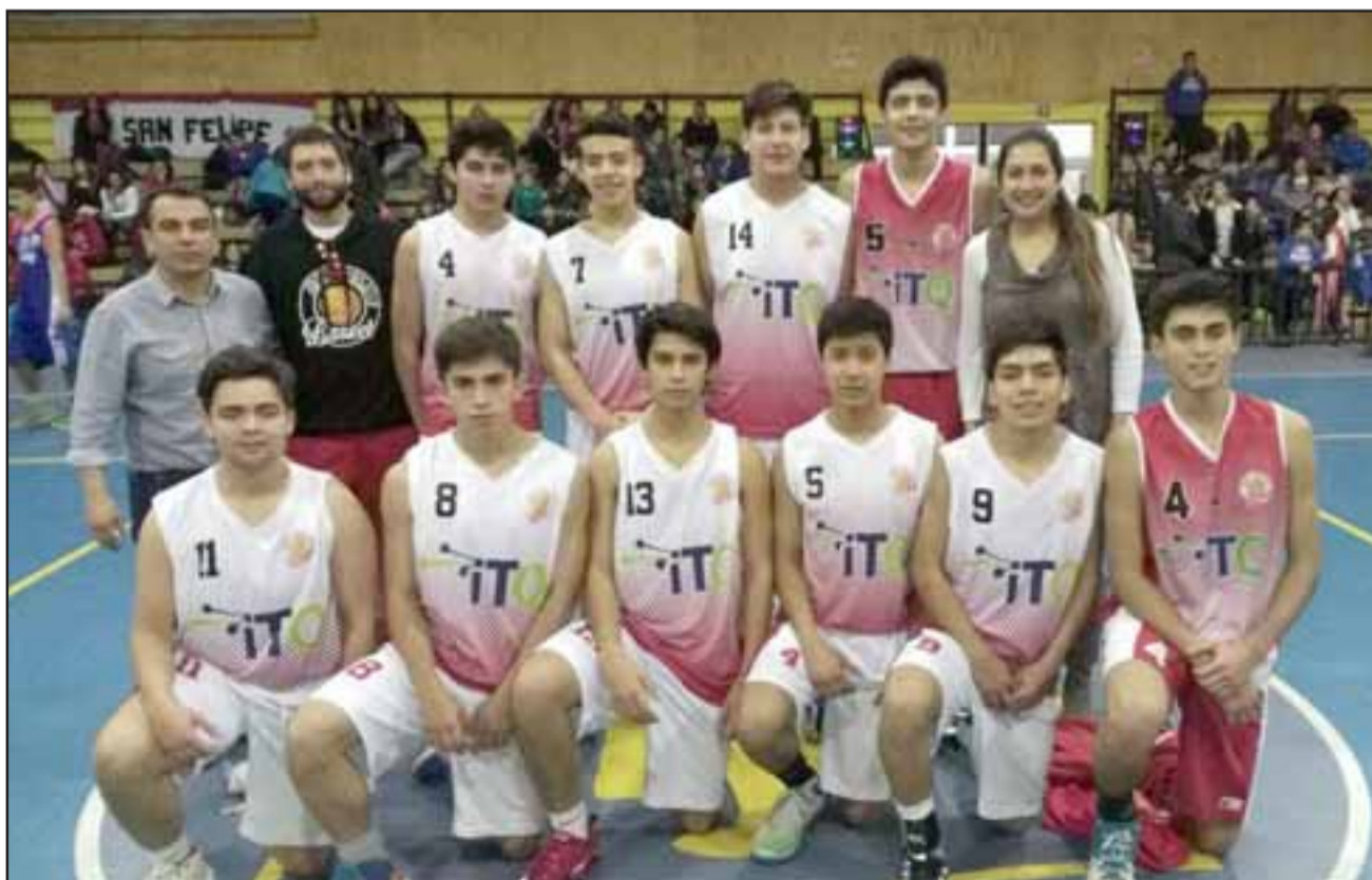
Los cuadros de San Felipe Basket tuvieron una campaña perfecta en la primera parte de la Libcentro.

En tanto Liceo Mixto consiguió clasificar en la categoría U17, con una campaña que arrojó cinco triunfos y tres derrotas.