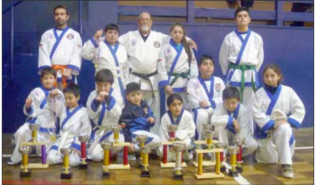
SIEMPRE CAMPEONES. - Ellos son parte de los karatecas sanfelipeños que regresaron del Puerto con 18 trofeos.

motores, pues el 7 de agosto estaremos disputando la I Champion Diario El Trabajo 2016 », informó Caballero Astudillo. Roberto González Short