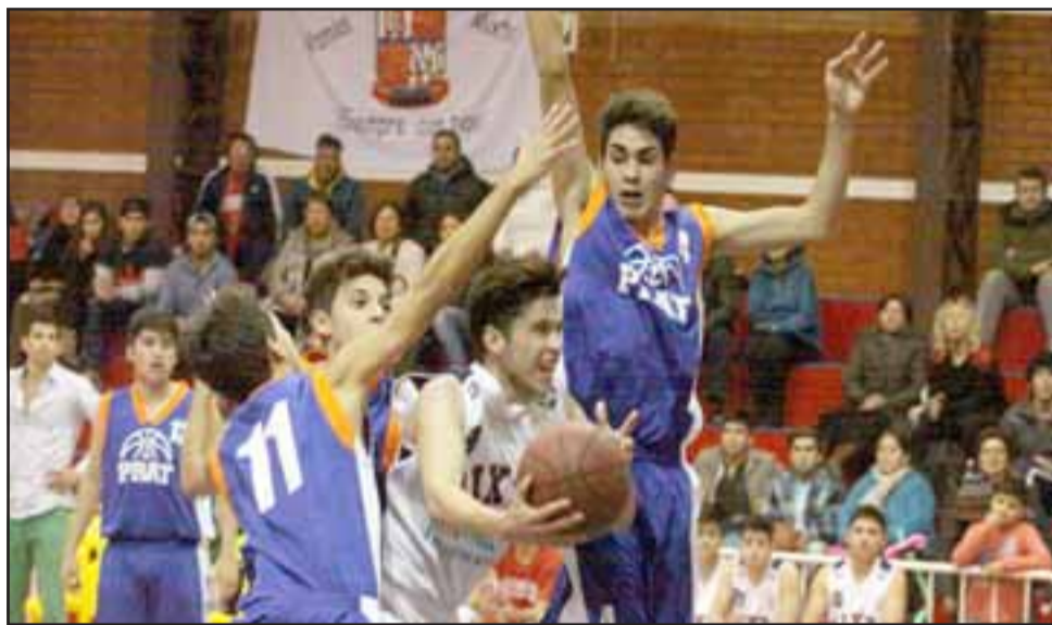
Los equipos aconcañinos ya saben a quienes enfrentarán en la postemporada de la Libcentro B.

Basquetbol Universidad de Chile – Liceo Mixto; Árabe de Rancagua – Stadio Italiano; Árabe de Valparaíso – Huachipato; Arturo Prat – Sergio Ceppi.