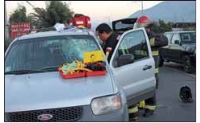
El accidente pudo tener graves consecuencias.