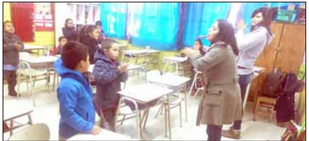
El objetivo es formar a los niños de manera integral, ya que la idea no es solo la obtención de conocimientos, sino que se sientan valorados como persona.