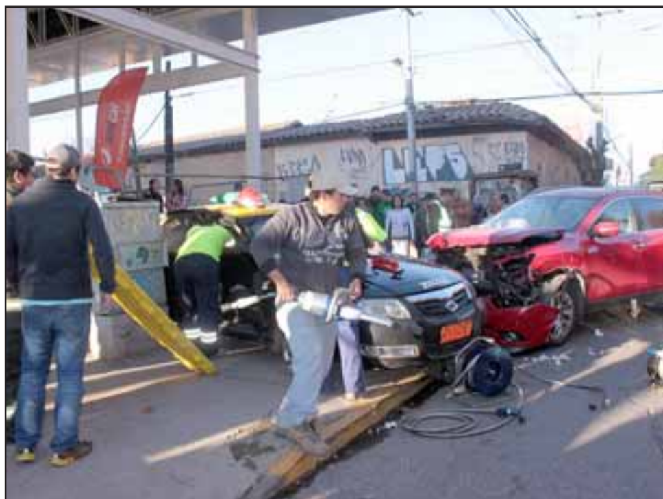
El accidente se produjo pasadas las 16:30 de ayer martes, en la esquina de avenida Chacabuco con Traslaviña.