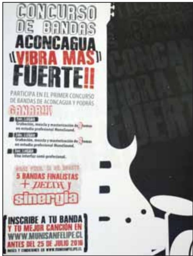
AFICHE PROMOCIONAL.- Los grupos interesados en participar, deben inscribirse antes del 25 de julio en la página www.munisanelipe.cl

Cabe destacar que el este I Concurso de Bandas Aconcagua, estará acompañado de un show de alta calidad, pues se presentarán la Banda Delta y el reconocido Grupo Sinergia, por lo que, se espera que la convocatoria sea multitudinaria, pensando en la muy buena respuesta que tuvo la comunidad en la Expo Tatoo 2016, realizada el pasado sábado 2 de julio.