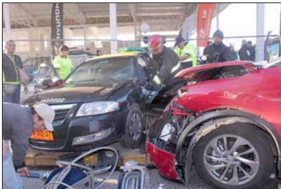
Bomberos debió extraer con herramientas especializadas las puertas del taxi para rescatar a los lesionados que estaban atrapados.