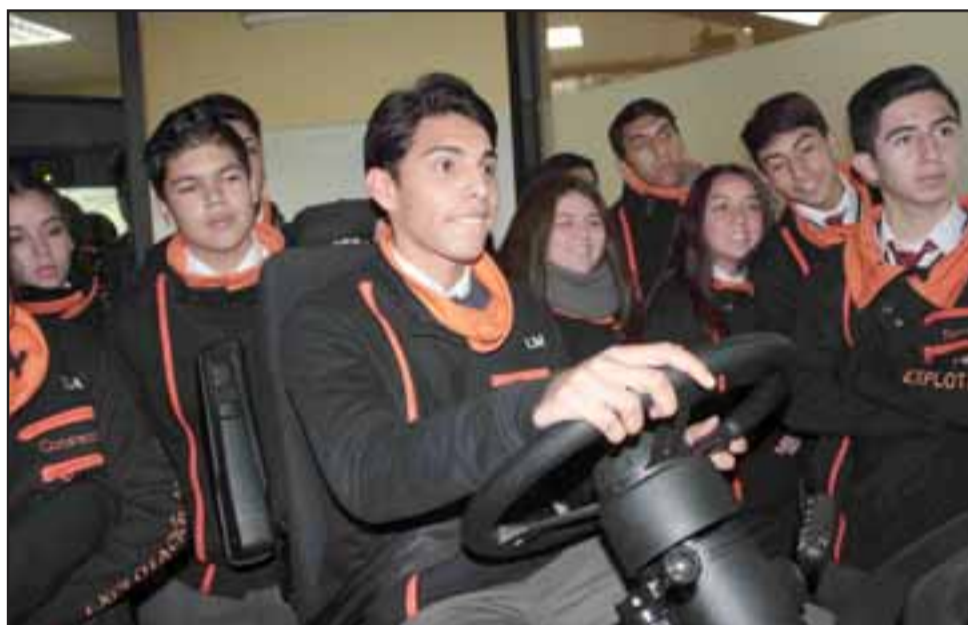
Los estudiantes tuvieron la oportunidad de probar el simulador de equipos mineros, recorrer el Centro Integrado de Operaciones y conversar de manera directa con los profesionales de División Andina.