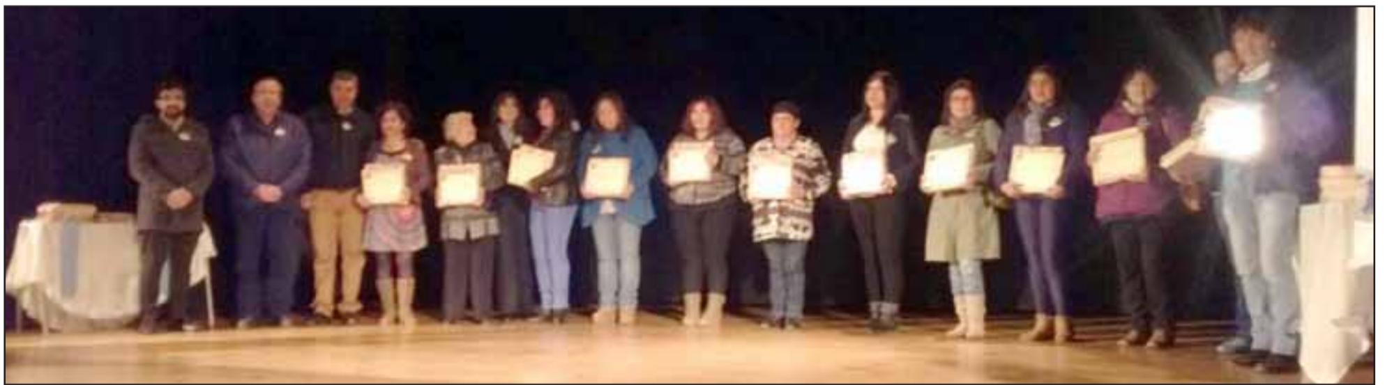
Con la ceremonia de certificación a las familias beneficiarias, se cerró la versión 2015 del programa Autoconsumo.

Ayuda en la economía y en alimentación saludable: