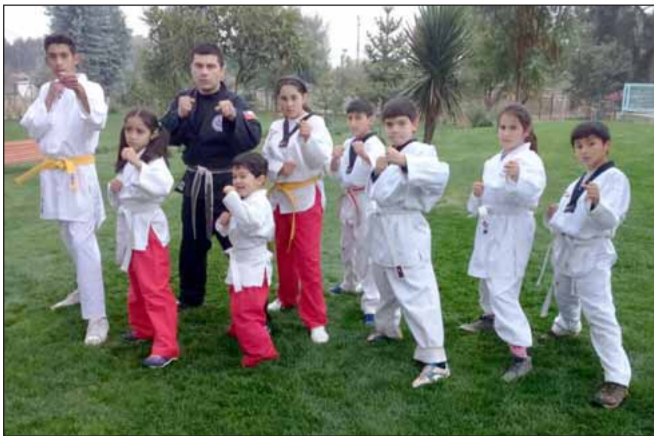
CHICOS DE PELIGRO.- Ellos son parte de los guerreros del karate en Catemu, uno de los mejores clubes de Artes Marciales de Aconcagua.