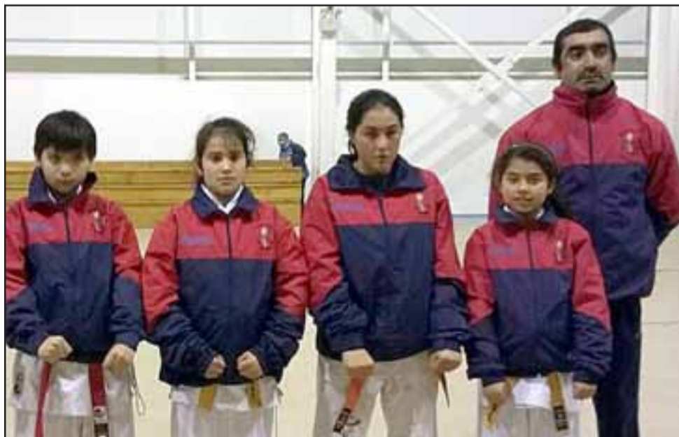
DINAMITA PURA.- Peques y grandes ya están calentando para ir el 7 de agosto a la ciudad de Punta del Este de Uruguay en representación de Chile.