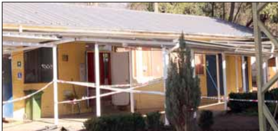
El proyecto vinculado al programa de fortalecimiento de la educación, el que ha considerado el recambio eléctrico, cambio de techumbres y de la loza de la multicancha.