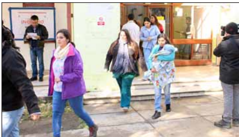
La actividad estuvo orientada a conocer el tiempo de respuesta de los servicios de emergencia, ante un siniestro de proporciones en el centro de salud familiar.

La simulación consideró la emisión de humo no tóxico al interior del Cesfam, con el fin de hacer de este ejercicio lo más real posible.