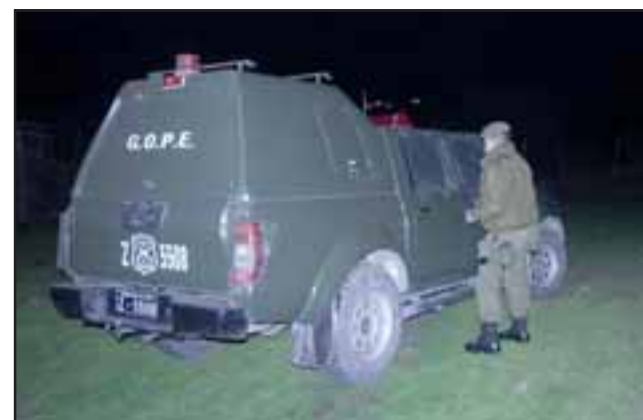
Personal del Gope acudió para verificar el tipo de artefacto y esclarecer cómo llegó a manos del menor.

llegaron a manos del menor, mientras que este sábado familiares dieron cuenta de otra caja de detonadores en una céntrica población de la comuna.