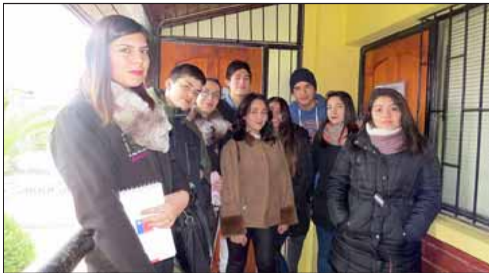
Integrantes del Consejo Consultivo de la OPD, se presentaron ante el Concejo Municipal, mediante una propuesta expuesta a las autoridades, que incluyó la realización de un concurso de graffiti, concurso de talentos, y un nutrido programa de actividades recreativas-culturales.

LLAY LLAY.- Niños y jóvenes integrantes del Consejo Consultivo de la OPD, se presentaron ante el Concejo Municipal, para buscar respaldo a las iniciativas de trabajo planificadas. La propuesta expuesta a las autoridades incluyó la realización de un concurso de graffiti, concurso de talentos, y un nutrido programa de actividades recreativas-culturales.