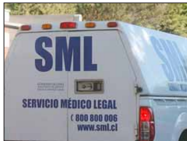
El cuerpo fue levantado por el Servicio Médico Legal para la correspondiente autopsia de rigor. (Foto Referencial).

Un antisocial resultó con herida grave en su pierna: