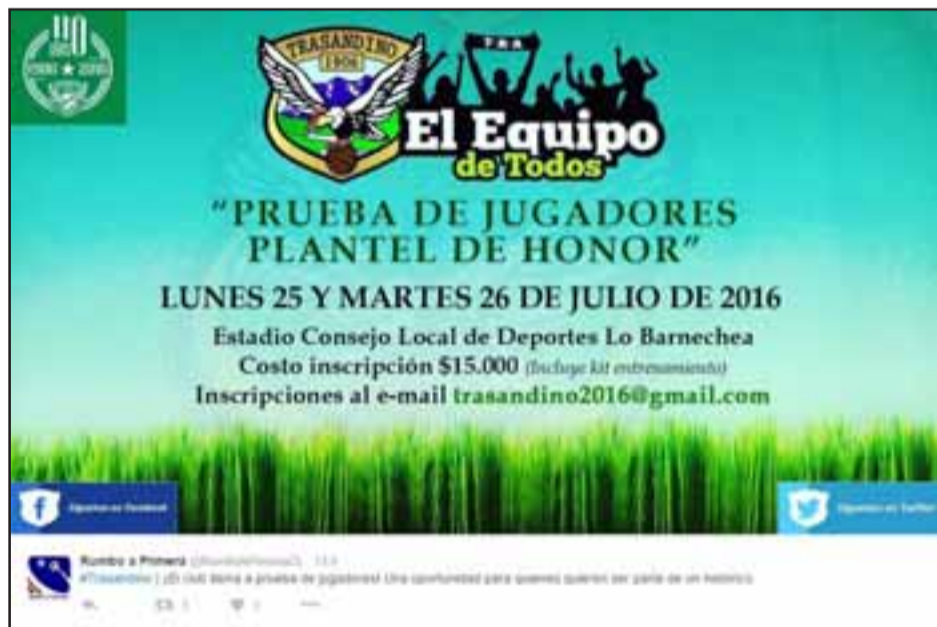
Con este afiche Trasandino estaría 'invitando' a la prueba de jugadores que tendría lugar en la comuna de Lo Barnechea.