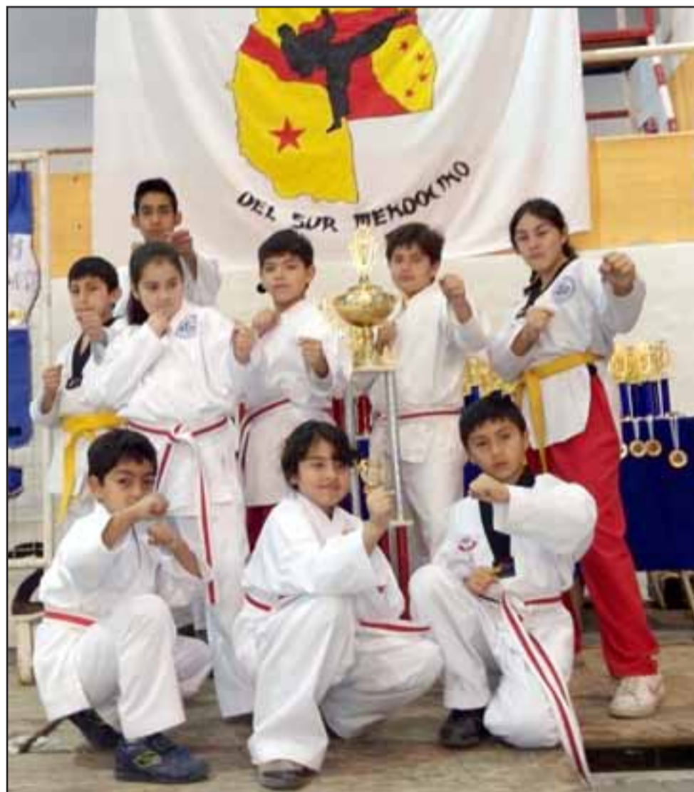
¿QUIÉN SE ATREVE?.- Estos pequeños deportistas ya están acostumbrados a ganar copas e importantes trofeos.