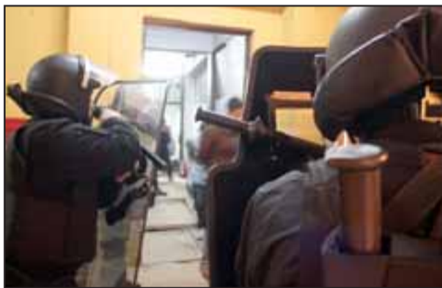
El hecho comenzó a las 22:40 horas y de forma inmediata personal de servicio y refuerzos llegaron hasta el dormitorio para intervenir la riña y lograr restablecer el orden interno.

Si bien Gendarmería ya identificó a los responsables del hecho, de igual forma inició una investigación interna, dando aviso al fiscal de turno.