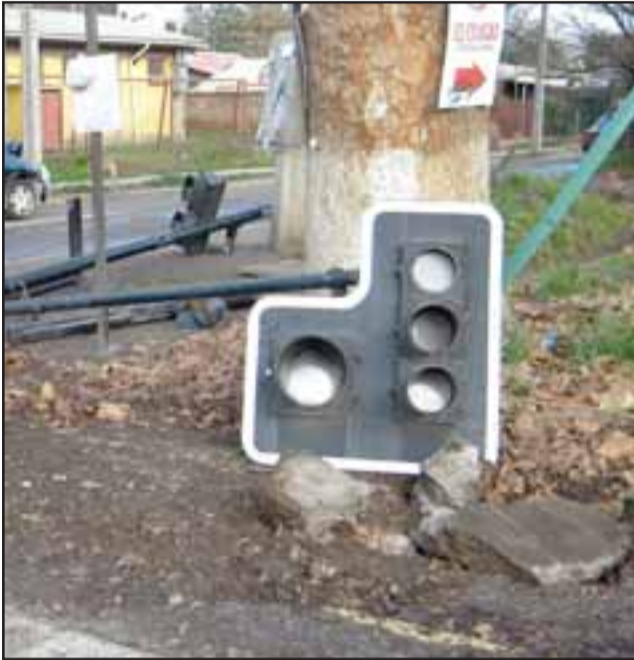
Enérgica colisión de automóvil derriba dos semáforos en San Esteban.