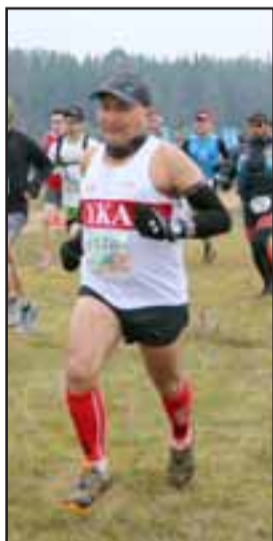
El corredor sanfelipeño fue segundo en el Trail realizado en el Lago Peñuelas.

Tal como lo había adelantado en la previa,