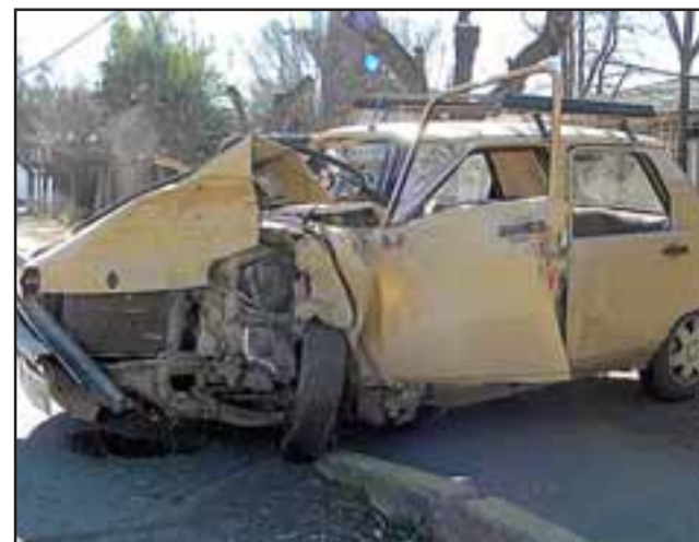
Automóvil Renault 5, patente GH 16-016 que se desplazaba de sur a norte por la Carretera San Martín.

En tanto, personal de la Tenencia de Carabineros de Rinconada adoptó el procedimiento a fin de establecer cuál de los dos autos traspasó el eje central de la calzada.