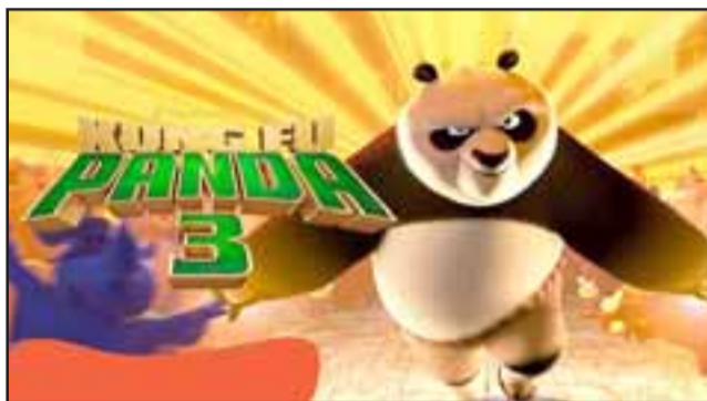
EL GUERRERO DRAGÓN. - Este personaje infantil del cine, Po, el oso panda que se convirtió en la primera película, en el Gran Guerrero Dragón de China.

CINE INFANTIL. - El grupo de profesionales de los sectores Azul, Amarillo y Verde de este Cesfam, se encargaron de que estos pequeñitos estuvieran como en un cine de verdad.