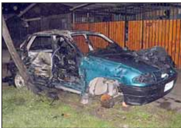
Desconocidos prendieron fuego a un automóvil Opel Astra, que se encontraba estacionado a las afueras de una vivienda.

Vehículo se encontraba chocado y cubierto con un nylon.