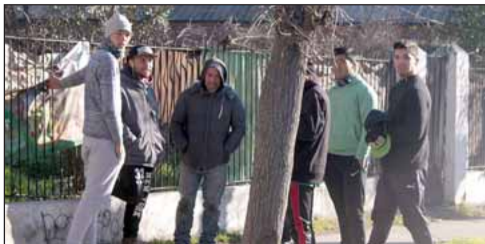
TREMENDO SUSTO. - Ellos son parte de los obreros agrícolas impactados en el furgón de trabajo.