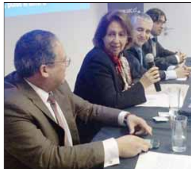
Con la presencia de la ministra de Corte Suprema, Rosa Egnem Saldías y una alta concurrencia autoridades universitarias, se presentó su Revista de Derecho de la Universidad de Aconcagua.