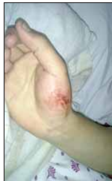
La víctima sufrió un corte en una de sus manos.

cuerpo de seguridad, que no habría efectuado tales golpizas, sosteniendo que las lesiones habrían sido provocadas dentro del contexto de la riña originada con otro asistente en el segundo piso de la discoteca".