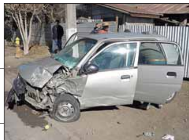
Suzuki Alto, matrícula CC SK 58, iba en sentido opuesto del otro vehículo impactado.