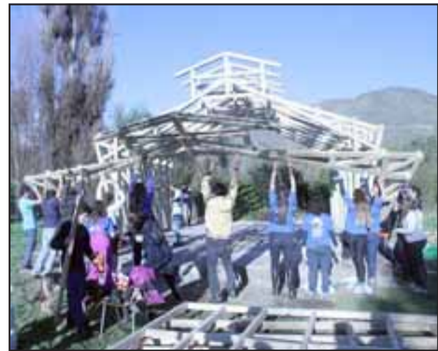
Una treintena de voluntarias y voluntarios de la Universidad Adolfo Ibáñez y de la Pastoral de la Universidad Católica de Santiago, se encuentran levantando el lugar de oración junto a la comunidad.