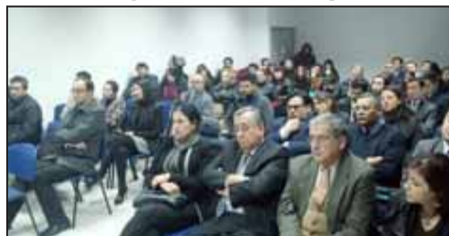
Alta concurrencia de autoridades y de alumnos de la casa de estudios, fueron participes del lanzamiento de la interesante edición.