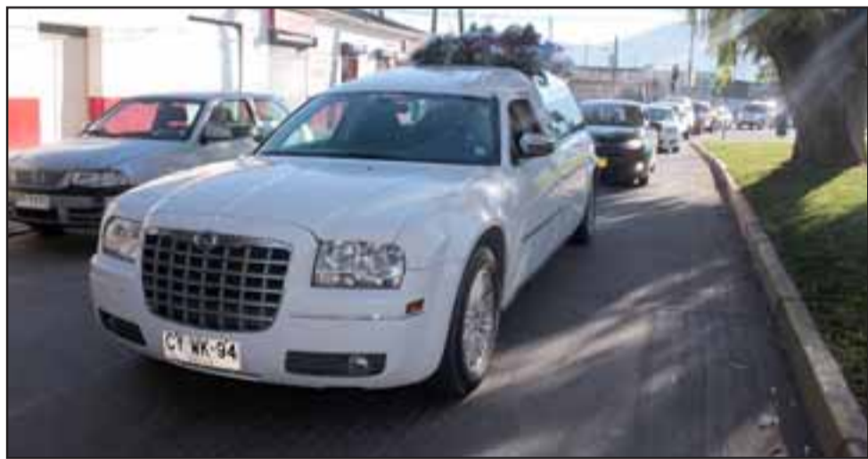
ADIÓS DIGNA DAMA.- Las cámaras de Diario El Trabajo dieron seguimiento a la gran caravana de autos rumbo a la última morada de esta querida artesana feriante de nuestra comuna.