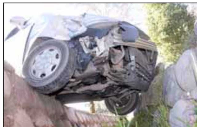
SIGUEN LOS ACCIDENTES. - Así quedó este vehículo luego que aparentemente su conductor no respetara el disco Pare, cuando viniendo por Toro Mazote, colisionara con un furgón que se trasladaba por Chacabuco lleno de obreros agrícolas rumbo a La Calera. (Roberto González Short)

Los equipos de emergencia acudieron al lugar para rescatar, sin heridas de gravedad, al conductor, el que fue remitido al Hospital San Camilo minutos después; su nombre no fue dado a conocer por los carabineros que atendieron el accidente.