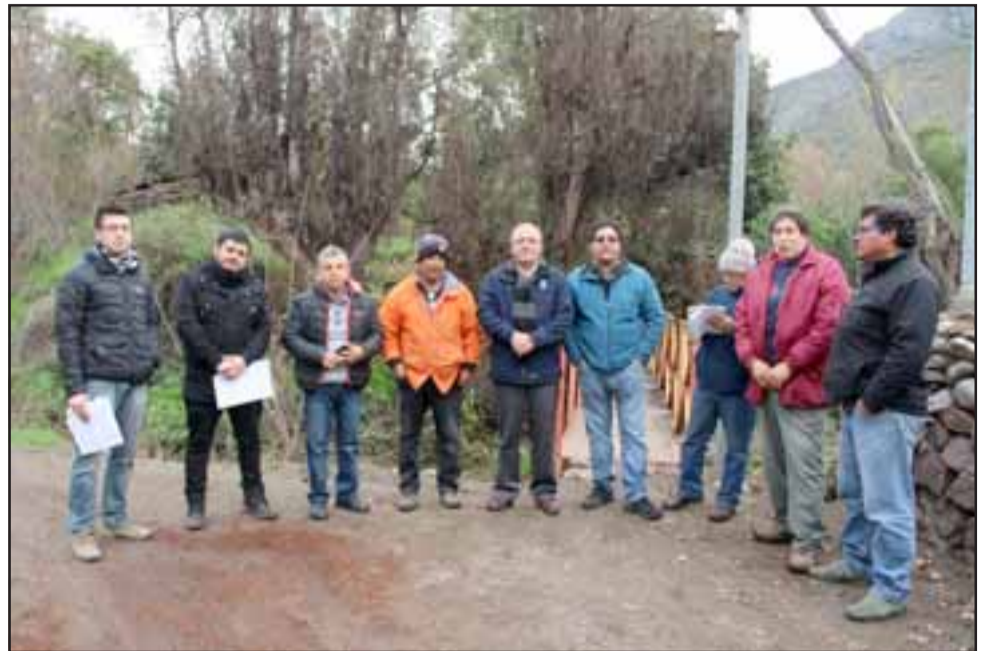
Vecinos de los cuatro sectores beneficiados, se mostraron optimistas con la instalación de estas luminarias que, indudablemente, mejorarán la calidad de vida y seguridad de los vecinos.

Proyecto municipal de más de 25 millones de pesos que iluminarán los sectores de El Saco, Calle Brasil, Parque Municipal y la subida a la Gruta de Nuestra Señora de Lourdes. Obra