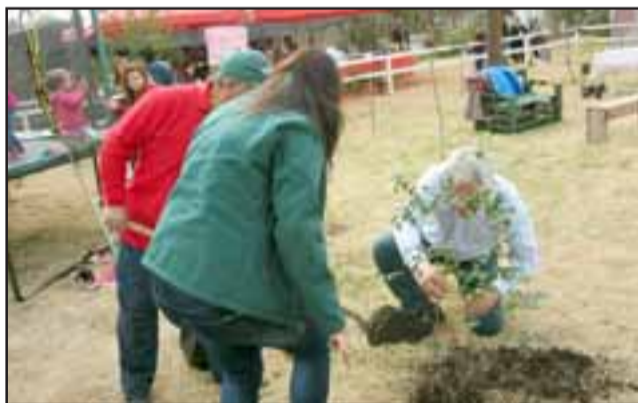
Conaf, suscribió un convenio de cooperación con el municipio de Rinconada de Los Andes, que permitirá fortalecer la educación ambiental en el espacio, situado en el sector de Los Rosales.

Institución forestal suscribió un convenio de cooperación con el municipio local que permitirá fortalecer la educación ambiental en el espacio, situado en el sector de Los Rosales. Iniciativa se enmarca en programa + Árboles para Chile.