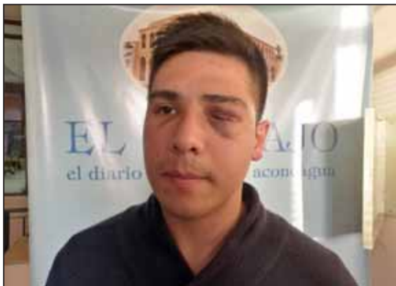
El denunciante al momento de conceder la entrevista a Diario El Trabajo, impedido de ver por uno de sus ojos.