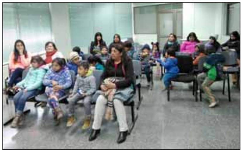
PADRES Y NIÑOS. - Peques y grandes lo pasaron muy bien disfrutando de Kung Fu Panda 3 en el Cesfam Segismundo Iturra.