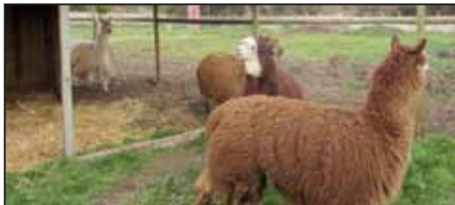
La Ecogranja, entre sus atracciones como pulmón verde, alberga a más de 30 variedades de animales, tales como cabras, ovejas, cuyis, conejos, cerdos y alpacas.