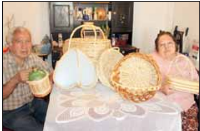
FIEL COMPAÑERA.- En esta foto del recuerdo, las cámaras de Diario El Trabajo retrataron a este matrimonio de artesanos.