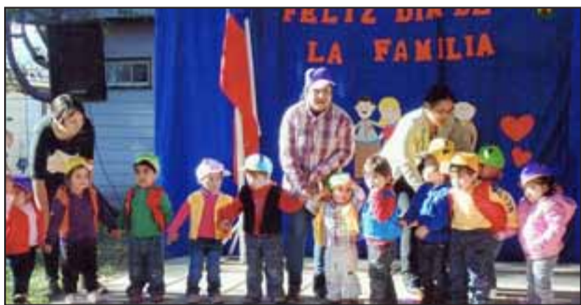
PEQUEÑOS A LA MODA.- Los más pequeñitos también desfilaron con sus coloridas ropas en el Día de la Familia 2016.

del Jardín Infantil Castillo de Alegría, ubicado en San Fernando. Se trata del Día de la Familia, una actividad en la que toda la comunidad educativa se involucró en una dinámica jornada de juegos y comidas saludables en ese establecimiento.