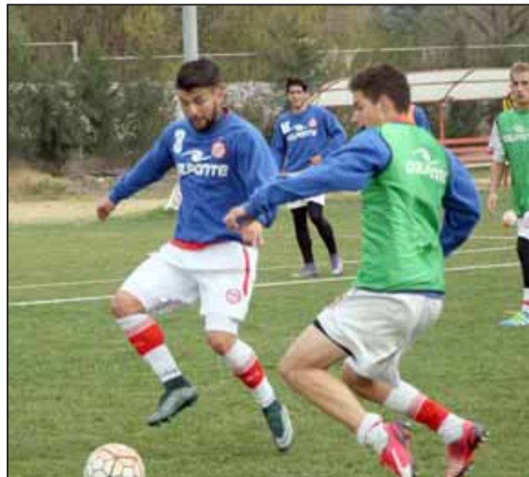
Unión San Felipe está obligado a ganar de manera holgada para avanzar en la Copa Chile.