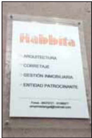
Desconocidos ingresaron durante la madrugada de este martes a la Oficina de Gestión Inmobiliaria 'Habbita' ubicada en la calle Freire N° 482.

LOS ANDES.- Evidenciando la ola de robos que afectan a locales del centro de la ciudad de Los Andes, desconocidos ingresaron durante la madrugada de este martes a la oficina de gestión inmobiliaria 'Habbita' ubicada en la calle Freire N° 482.