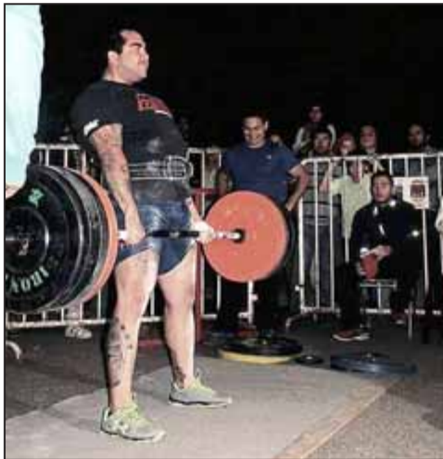
SE LA MERECE. - Su fuerza y juventud le ofrece casi una garantía de éxito, pues este joven sanfelipeño no descansará hasta alcanzar la gloria deportiva.