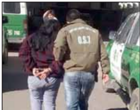
La imputada de 47 años de edad fue detenida por Carabineros acusada de microtráfico de drogas.