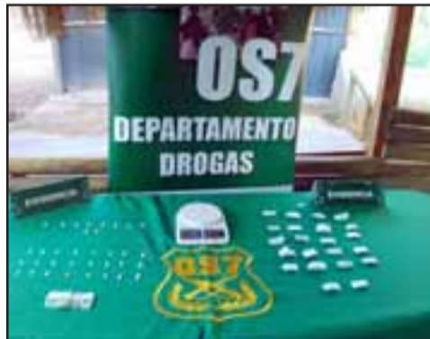
Personal de OS7 de Carabineros incautó la droga desde el domicilio ubicado en la población Ambrosio O'Higgins de Los Andes.