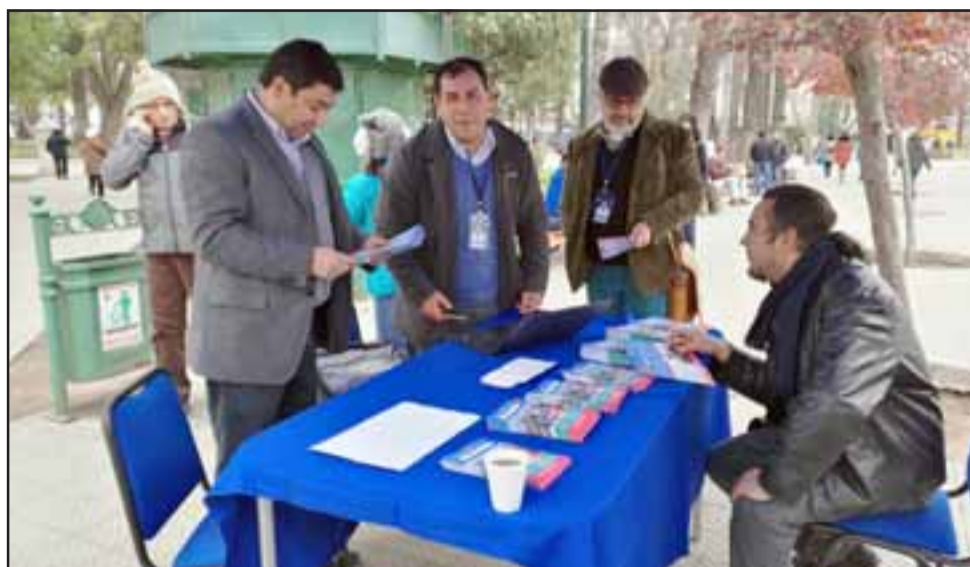
Este sábado 23 de julio se realizará en el Liceo Max Salas de Los Andes el Cabildo Provincial del Proceso Participativo Constituyente desde las 8:30 horas hasta las 15:00 horas.

base a las siete prioridades que la provincia ha determinado que son relevantes para que sean consideradas en la base de la constitución en un proceso histórico. La idea es que todos seamos protagonistas, pero en especial la ciudadanía en general y no solo los líderes de opinión, ya que todas las opiniones valen. No tememos a la participación