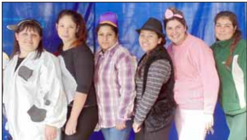
LOS PERSONAJES.- Otras en cambio, se disfrazaron como personajes de cuentos infantiles.

SANTA MARÍA.- Una colosal aventura llena de cariño y mucha fraternidad es la que vivieron educadoras de párvulos, niños y apoderados