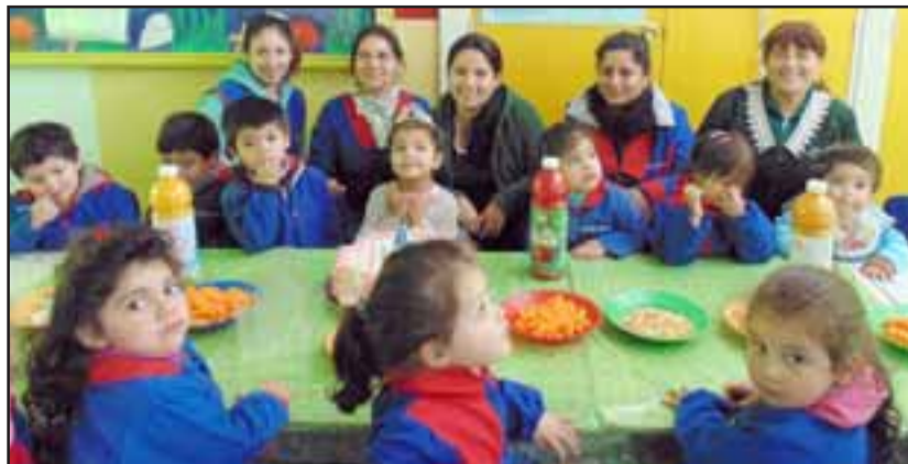
HUBO DE TODO.- Hasta una pequeña torta de cumpleaños hubo para una especial amigueta del castillo.

Este castillo de felicidad existe desde 2009 y se sostiene gracias al Municipio de Santa María Vía VTF. Durante esta actividad los adultos y párvulos realizaron un desfile de modas, el que generó gran alegría entre los presentes.