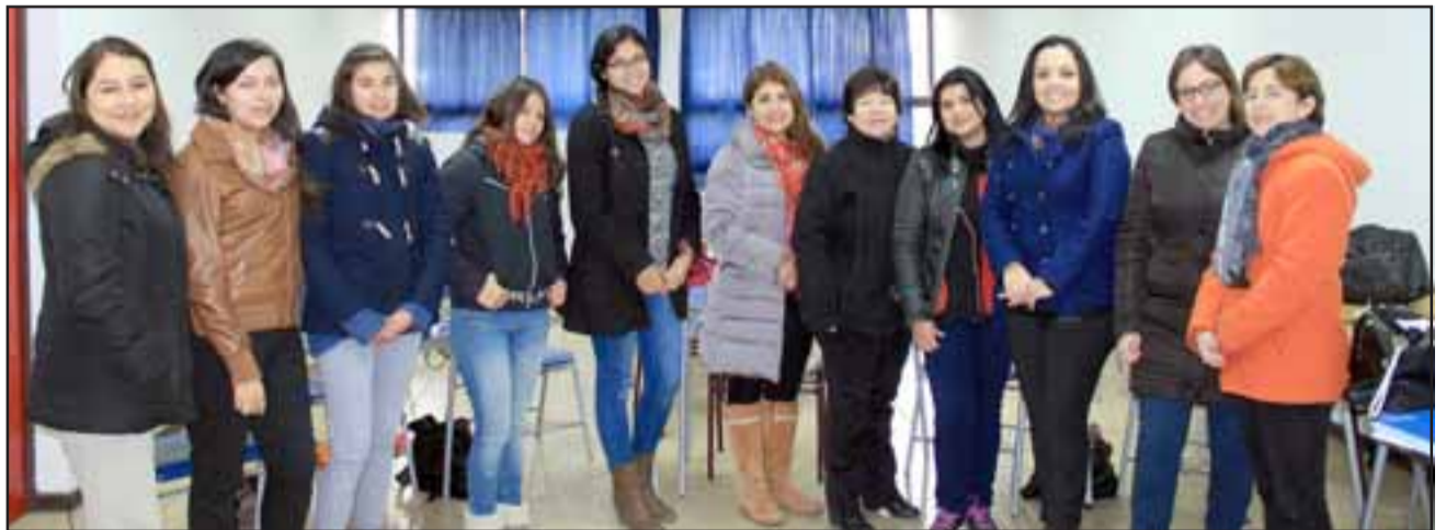
profesoras de lenguaje de cada uno de los establecimientos, entablaron diferentes actividades lúdicas para incentivar la comprensión lectora.

Una de las primeras medidas que se tomó al respecto fue la conformación de una Red Lectora. A través de tres reuniones, las profesoras de lenguaje de cada uno de los establecimientos públicos de Putaendo, entablaron diferentes actividades lúdicas para incentivar la comprensión lectora.