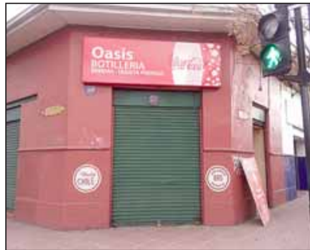
Millonario robo que afectó a la 'Botillería Oasis' ubicada en la esquina de avenida Chacabuco con Maipú.

El comerciante dijo que si alguien sabe que se están vendiendo estos cigarrillos en las poblaciones llame a la policía para poder recuperar algo de lo invertido, "ya que no tengo seguro contra robos".