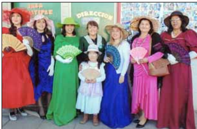
BELLAS MODELOS.- Estas apoderadas y funcionarias dedicaron su tiempo a modelar en el gran desfile de modas.