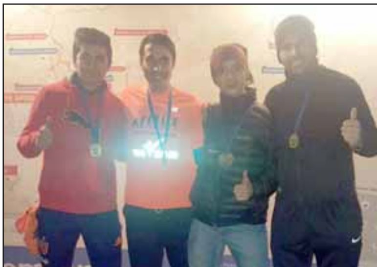
Tres integrantes de Evolution Runners lograron estar dentro de los mejores en el circuito de Trail capitalino.

ners tiene integrantes de jerarquía que sobresalen en pruebas de nivel, ante rivales de peso, algo que hace que estos resultados adquieran un valor adicional.