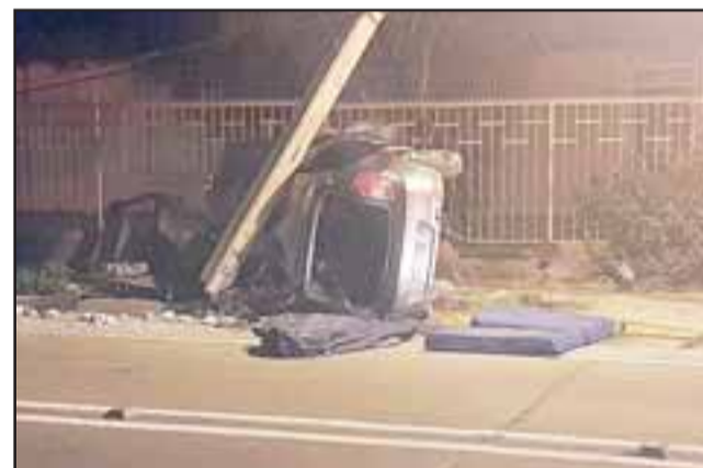
El accidente ocurrió a las 03:30 de la madrugada del pasado domingo en la avenida Encón de San Felipe. (Foto: Emergencia Quinta Cordillera).