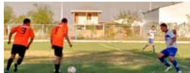
La primera parte del campeonato de fútbol aficionado local avanza hacia su final