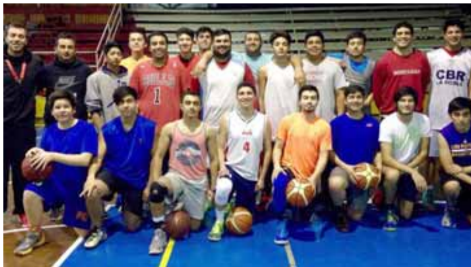
Los pratinos están obligados a ganar dos partidos si quieren llegar al cuadrangular final de la Libcentro B.

Domingo 31 de julio 19:00 horas, gimnasio Sergio Ceppi: CD Sergio Ceppi – Arturo Prat