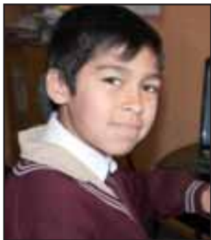
EL MEJOR. - Él es el mejor redactor de su escuela, según lo dictaminaron los organizadores del concurso de periodismo escolar, en Santiago.

Luego que la empresa Pro Activa Chile decidiera incluir a la Escuela Carolina Ocampo, de Bellavista, en el concurso de periodismo escolar que realizó en doce escuelas de Santiago, y esta de San Felipe, los escolares sanfelipeños empezaron a idear mil temas para redactar sobre ellos y así participar.