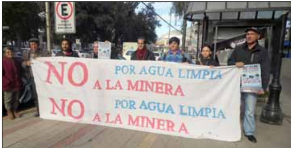
Defensores del medio ambiente marcharán en Santiago, buscando revocar el proyecto de Ley de Protección Glaciar.