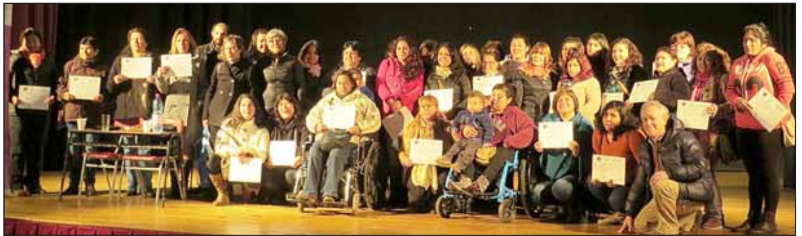
BELLAS Y SONRIENTES.- Mujeres del programa Jefa de Hogar, posan felices en esta foto grupal, luego de ser empoderadas con la capacitación sobre Los Derechos de la Mujer.

La jornada se desarrolló en dos módulos, el primero abordó: género, salud y derechos de reproduc-