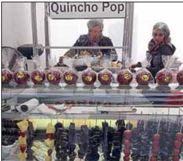
SIN PEGA. - Pop Eventos es una micro empresa que en agosto genera diez puestos de trabajo, según indicó su dueño.