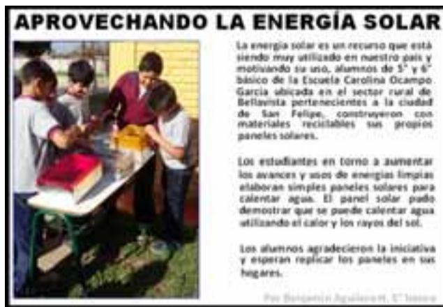
REPORTAJE GANADOR. - Este es el artículo que ganó el tercer lugar, de entre 800 más, escrito por un estudiante de la Escuela Carolina Ocampo.