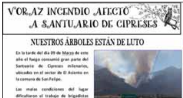
NOTICIA IMPORTANTE. - Así reportearon estos niños el desastre ecológico ocurrido hace pocos meses en ese sector.