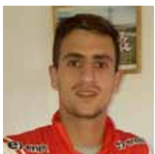
Unión San Felipe entrenó ayer en el municipal- será visitante en el comienzo de la competencia de la Primera B.

Este domingo en el estadio Municipal de Los Ángeles, ante Iberia, Unión San Felipe jugará su primer partido de la temporada 2016 – 2017 de la Primera B, serie que los albirrojos esperan abandonar a mediados del año próximo, en lo que será una tarea nada sencilla y en extremo compleja, debido a que habrá un solo ascenso a la máxima categoría del fútbol rentado chileno,