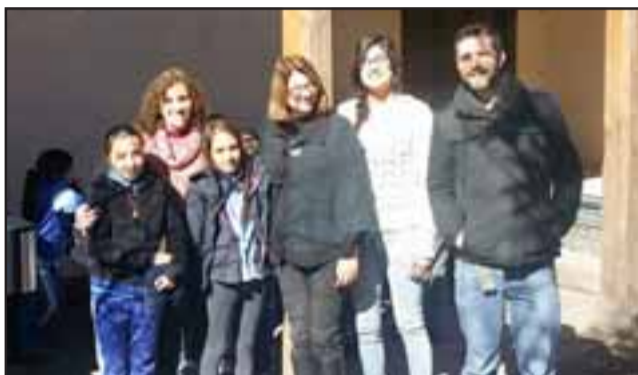
La escuela Buen Pastor realizará la ‘Feria Preventiva’. La jornada se desarrollará hoy viernes 29 de julio a partir de las 11:30 horas en el establecimiento.

Por tercer año consecutivo, la comunidad educativa de la escuela Buen Pastor realizará la ‘Feria Preventiva’, actividad que se enmarca en el trabajo asociativo que se realiza actualmente entre el establecimiento y el programa Senda-Previene.