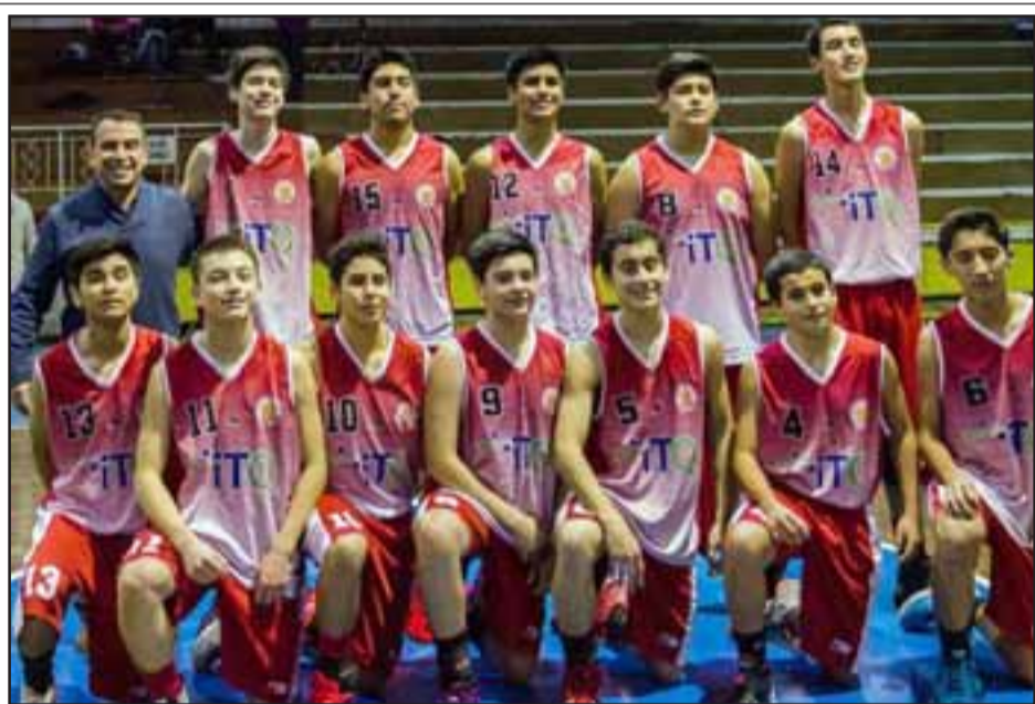
El cuadro de San Felipe Basket corre con favoritismo para adjudicarse el cuadrangular semifinal de la Libcentro B en la categoría U15.