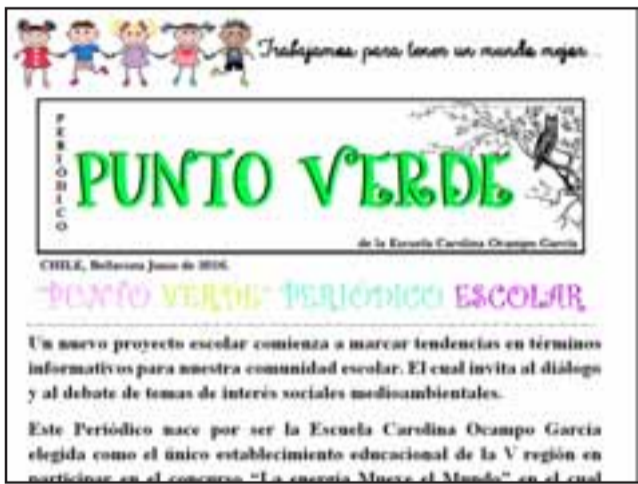
PERIODISMO ESCOLAR. - Esta es la portada del periódico escolar, creado por los niños de la Escuela Carolina Ocampo.