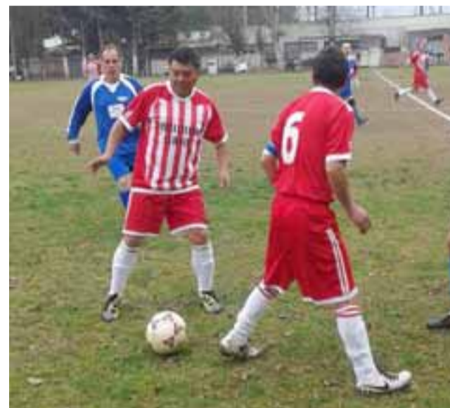
La fecha cuatro de la Liga Vecinal puede acarrear novedades en la parte alta de la tabla.

Resto del Mundo 0 Unión Esperanza 0 *Estadísticas: Víctor Araya 'Petineli' Programación Lidesafa sábado 30 de julio: Torneo Joven Cancha Prat: Galácticos – Manchester; Casanet – Fanatikos; Prensa – Tahai. Cancha El Tambo: Magisterio – Transportes Herremé; América – BCD. Torneo Sénior Complejo Cesar: Grupo Futbolistas – Magisterio; Derby 2000 – Los del Valle; Deportivo GL – Estrella Verde; Fénix – 20 de Octubre; Bancarios – 3º de Línea.