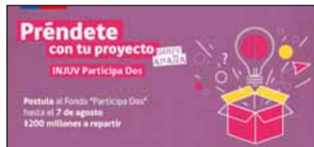
AFICHE PROMOCIONAL.- Fondo #ParticipaDos, del Instituto Nacional de la Juventud (Injuv).

No podrán postular al fondo Injuv #ParticipaDos: Centros de Formación Técnica, Institutos Profesionales, Universidades Públicas o Privadas, Establecimientos Educativos, Corporaciones Municipales y Municipalidades.