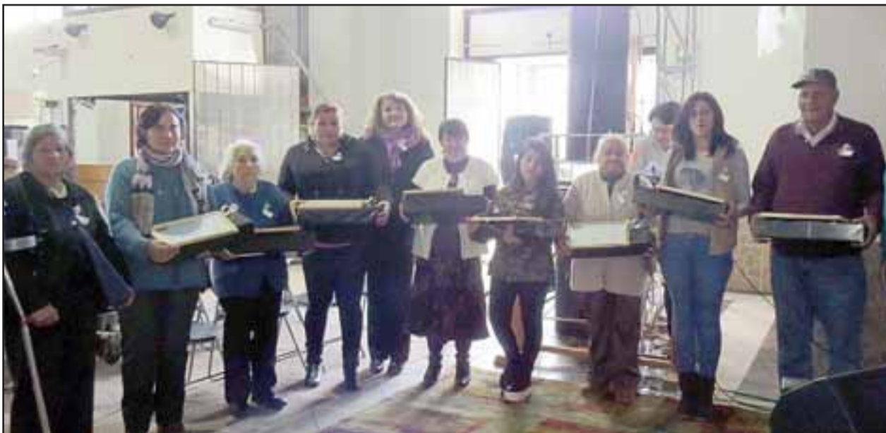
Con una masiva ceremonia, se selló el final del programa Habitabilidad 2015, para 10 familias, las cuales recibieron beneficios importantes en el mejoramiento de sus viviendas y en su calidad de vida.