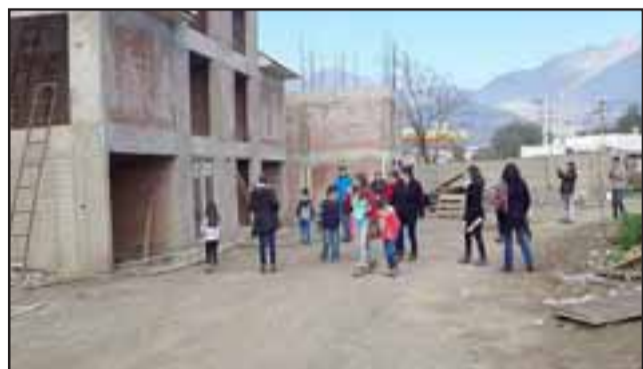
Un 45,83% es el avance que dejó la empresa constructora Santa Adriana. Afectados visitaron la obra abandonada.

Sin embargo, aquél sueño se ha visto drásticamente interrumpido y tendrá que seguir esperando, luego que la empresa constructora Santa Adriana argumentara 'insolvencia económica'