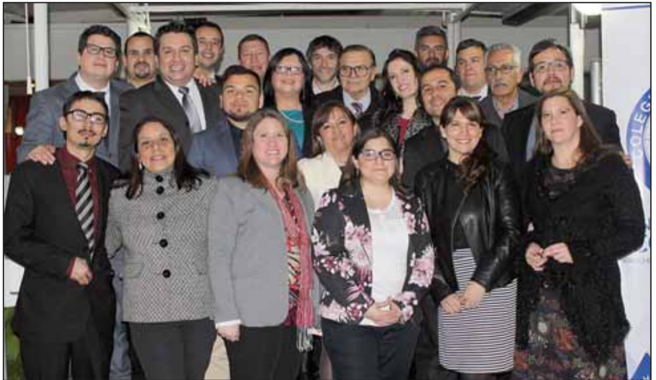
Consejo que reúne a los periodistas de las provincias de San Felipe y Los Andes.

En el Hotel San Felipe El Real y la con la presencia de numerosas autoridades, dirigentes de la Mesa Directiva Nacional del Colegio de Periodistas y de la Mesa Directiva del Regional Valparaíso, además directores de medios de comunicación, familiares y amigos de los profesionales que integran