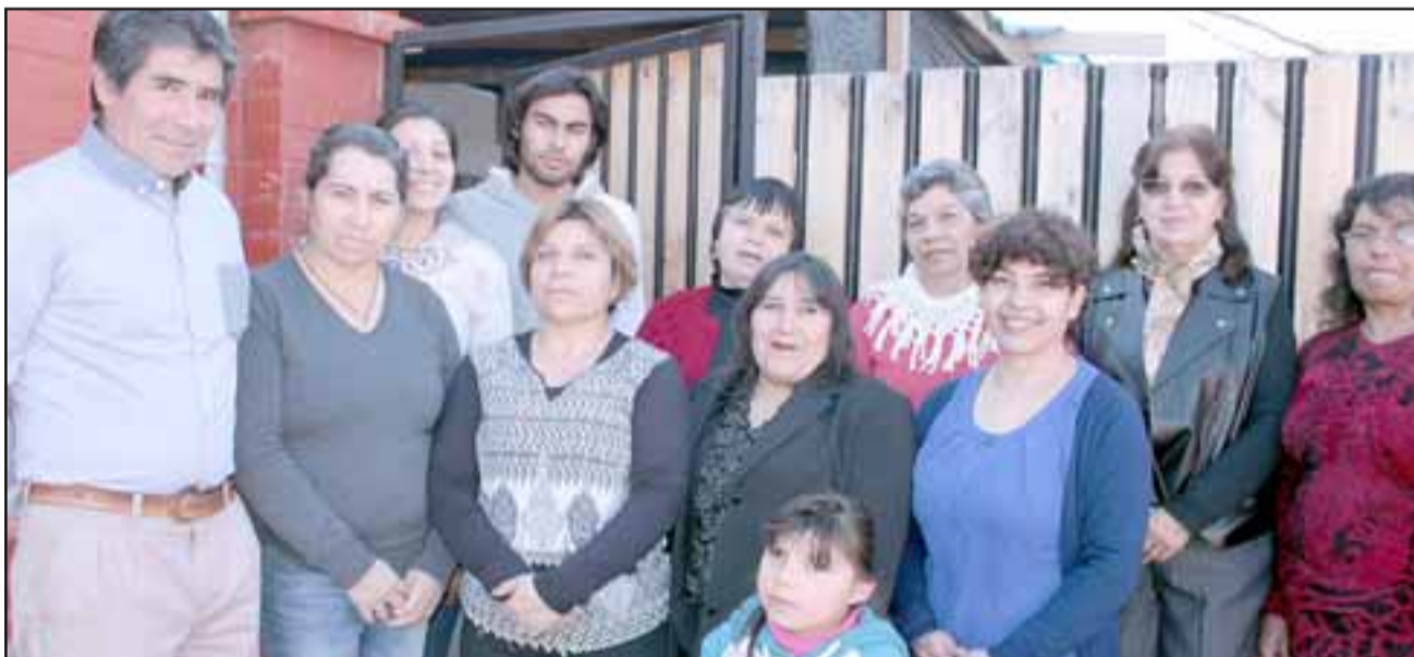
EL COMITÉ.- Ellos son vecinos de Villa La Primavera, miembros del Comité de Pavimentos Participativos, quienes ya están planificando otros proyectos para 2017.