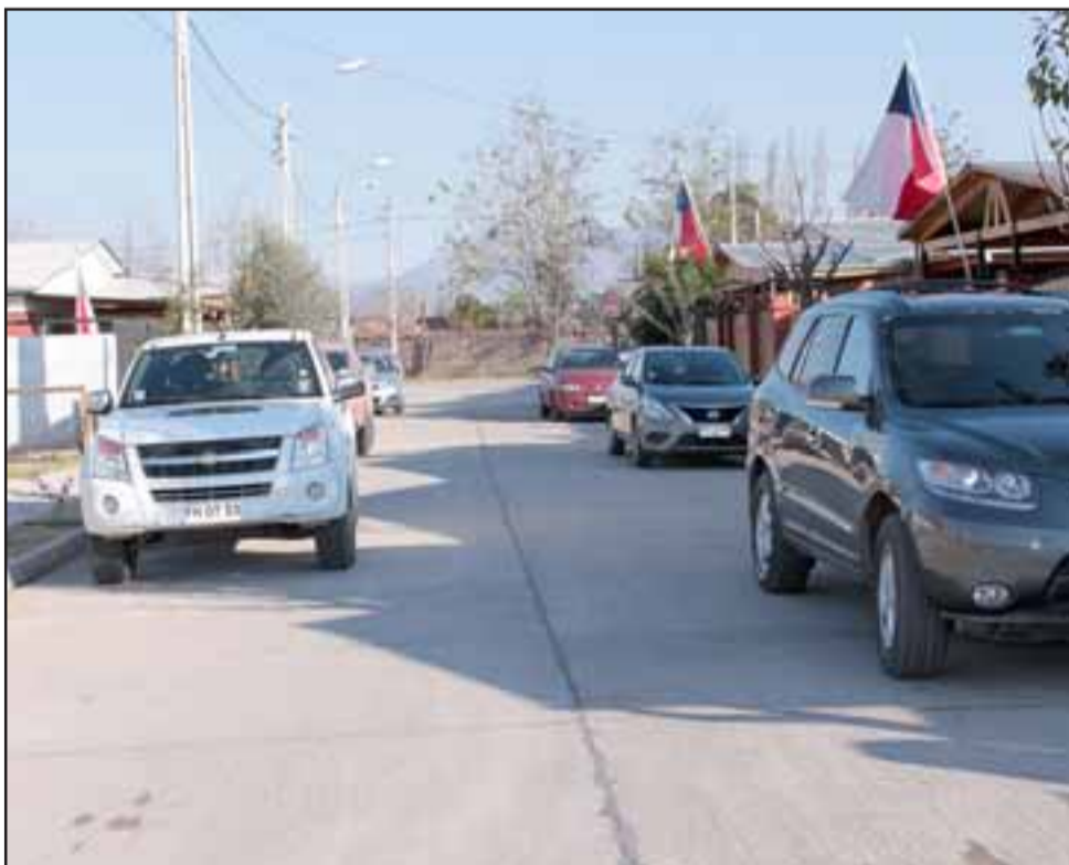
PAVIMENTOS NUEVOS.- Así lucen ahora los pasajes de Villa La Primavera, en Bucalemu.