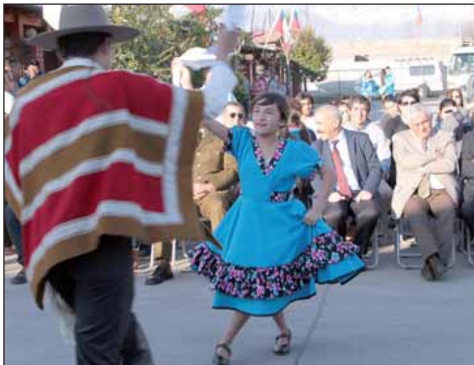
HUELE A 18.- Varios pies de cueca fueron bailados para los vecinos y autoridades invitadas.