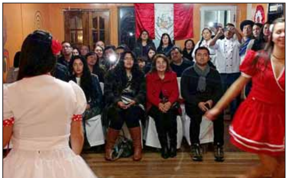
PERUANOS FELICES.- Palmas, aplausos, brindis y mucha alegría en esta fecha patria peruana, es lo que se vivió el 28 de julio en nuestra comuna.