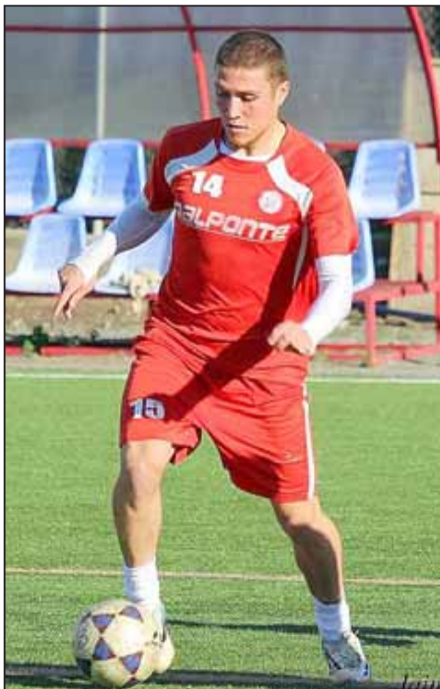
Los canteranos del Uní tienen como objetivo llegar a Play Offs.

Unión San Felipe, integrará el grupo centro norte donde aparte de viñamarinos y porteños asoman como rivales de temer, Unión La Calera y San Luis de Quillota, con los cuales debería pelear el paso hasta los Play Offs, sin olvidar a Trasandino con el cual animaran el Clásico del Aconcagua. "Se está trabajando para tener equipos intensos, juego construido y ataque directo, usando un sistema de un 4-3-2-1 que es el que más nos acomoda al tener los jugadores para hacerlo, el objetivo es llegar a la postemporada y mejorar lo hecho en el pasado", afirmó el estratega.