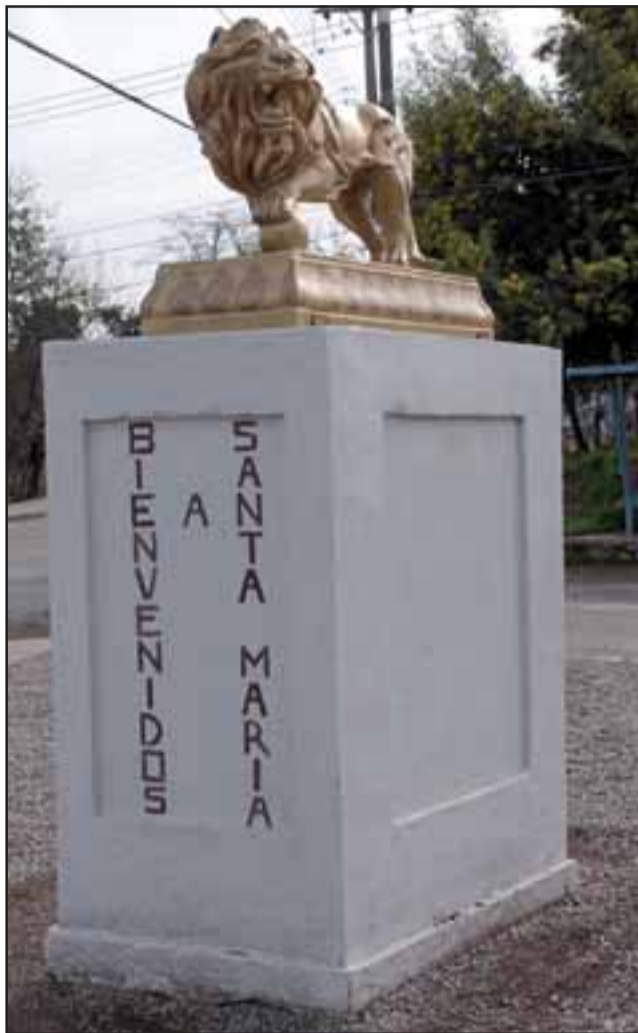
CÁLIDA ENTRADA.- Así da la bienvenida a la comuna de Santa María este imponente león.

Mucho es lo que se ha escrito acerca de los misteriosos leones de la Plaza de Armas, los que nunca aparecieron, o los que nunca existieron, pero lejos de ese mito urbano que circula en todo nuestro valle, hoy en Diario El Trabajo queremos hablar de un león muy comentado por estos días, hablamos de una imponente estatua de un león dorado que fue instalada en el sector El Tambo, donde se unen Santa María y El Almendral.