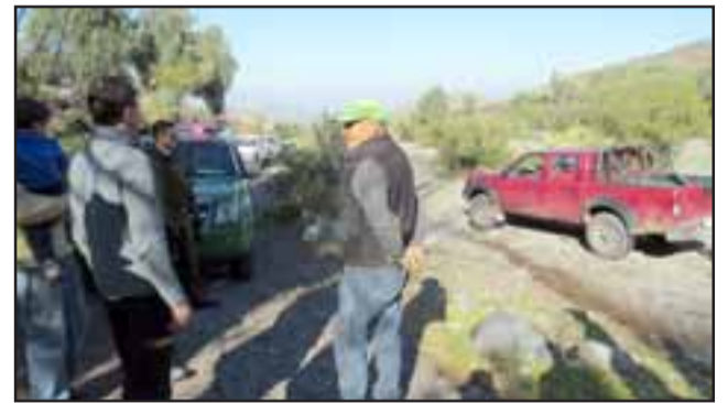
La llegada de Carabineros evitó que los mineros fueran atacados por la comunidad.

Mina Aguas Claras, está muy bien nombrada ya que se encuentra situada a metros de manantiales de aguas cristalinas que se acopian para agua potable y muy cerca de dos esteros que son el agua absoluta de regadío para el Valle de Jahuel, sin embargo, la minera pretende trabajar en el lugar sin considerar el fuerte rechazo popular y de los lugareños, quienes han dicho en todos los tonos que por nada del mundo permitirán que se ponga en riesgo su abastecimiento de agua. Además, la mina fue causante, debido al acopio indebido de material o desmonte en las laderas, de