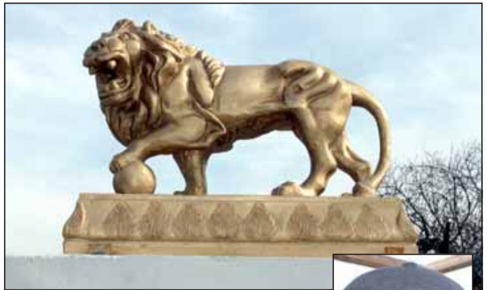
DORADO SÍMBOLO.- Esperando que no se lo roben, este es el nuevo símbolo visible cortesía del Club de Leones de Santa María.

«Ese es nuestro símbolo, el león, estamos en 210 países del mundo y contamos con 1,4 millones de socios. Acá en Santa María somos pocos, pero muy activos. Nuestra labor está centrada en el auxilio veraz apersonas que lo necesiten, previa solicitud y previamente valorado cada caso individual, repartimos periódicamente