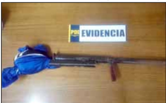
Dentro de las diligencias policiales se incautó esta escopeta hechiza.