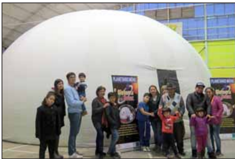
Instalado en el Gimnasio Municipal, el domo versátil, de grandes proporciones dio la bienvenida a quienes se aventuraron a realizar el viaje virtual, de más de 40 minutos.

“Muy bonito, me gusto mucho” fueron algunas de las expresiones de los asistentes. La iniciativa del Daem (Departamento de Administración de Educación Municipal) de Llay Llay, fue agradecida por los presentes, a los mismos que los dos días de exhibición: 26 y 27 de julio, les quedo con gusto a poco “ojalá que para la próxima se extien-