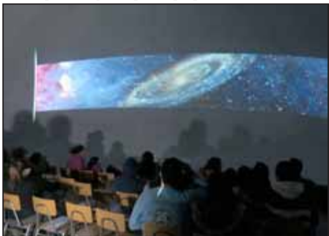
Los asistentes recorrieron visualmente la vía láctea, y conocieron la línea de tiempo de creación de planetas y constelaciones.

LLAYLLAY.- Fascinados quedaron los niños y adultos de la comunidad llayllaína con el planetario móvil, que entregó dos pre-