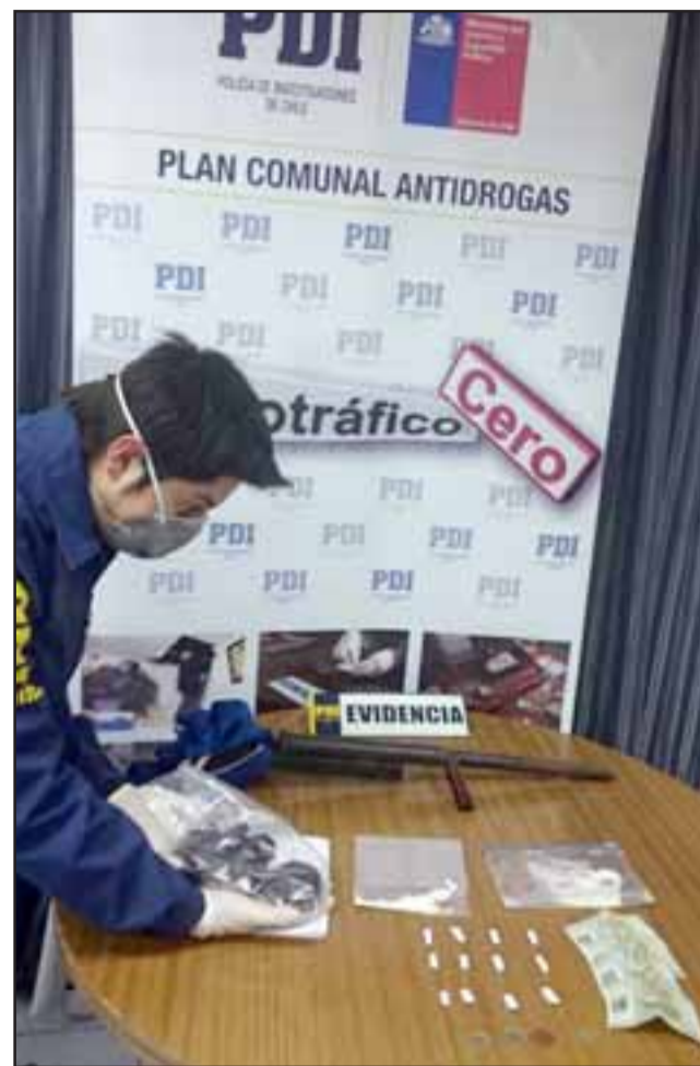
La Brigada de la PDI Microtráfico Cero, incautó pasta base y dinero en efectivo desde un departamento de la Villa El Sauce de Llay Llay.