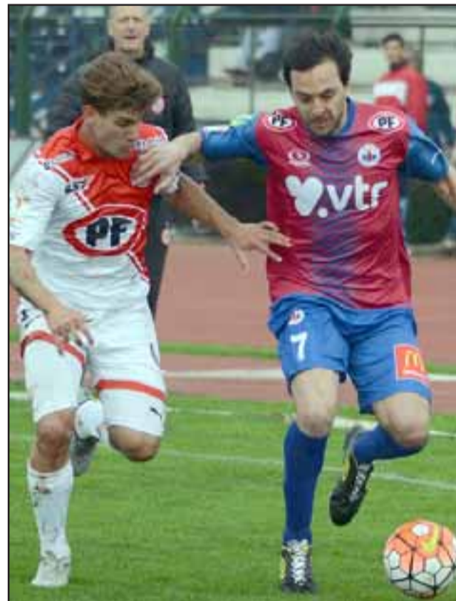
El equipo sanfelipeño igualó a 2 con Iberia.