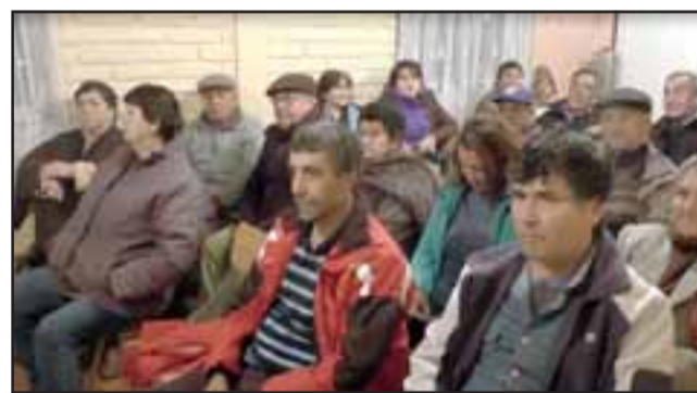
En una ceremonia realizada en la Junta de Vecinos de la Villa Sor Teresa, 15 familias callelarguinas recibieron sus subsidios para la instalación de colectores solares, que les entregará agua caliente para la vivienda.

“Es un gran beneficio que tiene que ver con el bolsillo de la gente que está viviendo muchas veces situaciones complicadas o con falta de trabajo, pero también tiene que ver con la ecología y la sustentabilidad ambiental, que es uno de los grandes desafíos que comenzamos con esta ges-