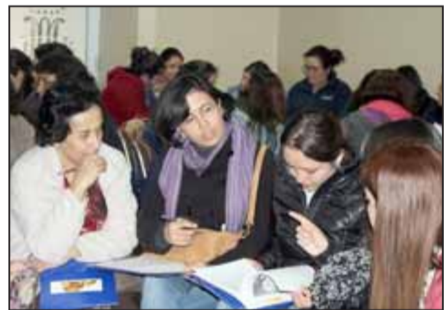
Se están realizando actividades con las madres que acaban de tener a sus bebés, desarrollando talleres para enseñarles las ventajas del amamantamiento y la forma correcta de amamantar.

Al respecto, la profesional indicó que los bebés que amamantan tienen muchas ventajas en relación a quienes no, ya que además de los nutrientes que la leche materna les proporciona, reciben una serie de beneficios para su desarrollo psicológico. A