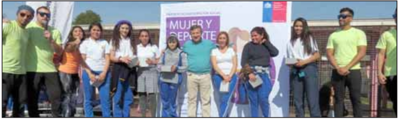
El Programa Mujer y Deporte premió orgullosamente a las estudiantes más entusiastas y comprometidas con el evento.

clusión deportiva de niños, jóvenes, adultos y adultos mayores, con talleres gratuitos en toda la región. El director regional del IND, Jorge Díaz participó de la actividad y destacó el entusiasmo de las estudiantes. “Nos vamos muy satisfechos de ver cómo estas niñas y jóvenes bailan y disfrutan animadamente de una jornada deportiva. Esta institución se destaca además por su logros deportivos en competencias nuestras como los Juegos Escolares y Binacionales, con sus seleccio-