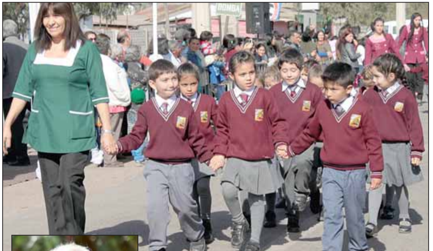
EN LOS 276 AÑOS DE SAN FELIPE.- Vecinos de Bellavista; estudiantes de El Asiento; profesores de El Algarrobal; alumnos de todas las poblaciones, así como autoridades de nuestra comuna y huasos de la zona, se volcaron con alegría en un espectacular desfile de honor ofrecido en el sector 21 de Mayo. Hoy miércoles el desfile principal se realizará desde las 11:00 horas en la plaza de Armas, a ese lugar, ya tradicional, llegarán las Fuerzas Vivas de nuestra comuna, para festejar estos 276 años de existencia como comuna y cabecera de provincia.

Hoy a las 11,00 es el acto principal en la Plaza de Armas: Pág. 9