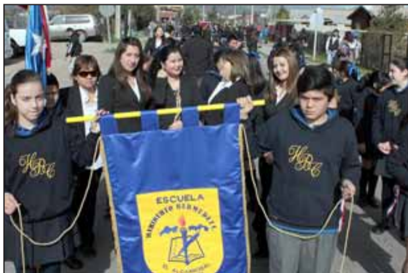
JOVEN GENERACIÓN.- Aquí tenemos a la actual generación estudiantil de la Escuela Heriberto Bermúdez, de El Algarrobal.