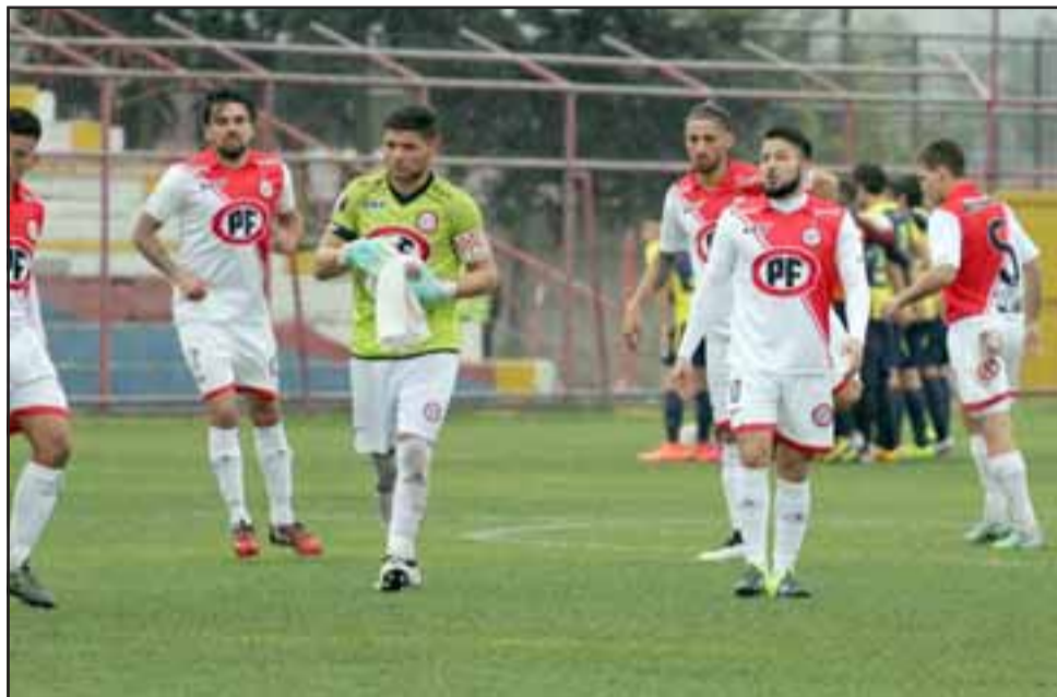
Hoy se pondrán a la venta 500 entradas a precios rebajados para el duelo del domingo próximo entre el Uní y Puerto Montt.

Es bueno tener presente que el día del partido-domingo 7- el valor de las entradas será de $ 5000 (cinco mil pesos) la galería y $ 10000 (diez mil pesos) la butaca, por lo que la promoción que se lanzará hoy es una buena oportunidad para que la familia unionista acuda al estadio y apoye al club que representa al Valle de Aconcagua en el torneo de la Primera B.