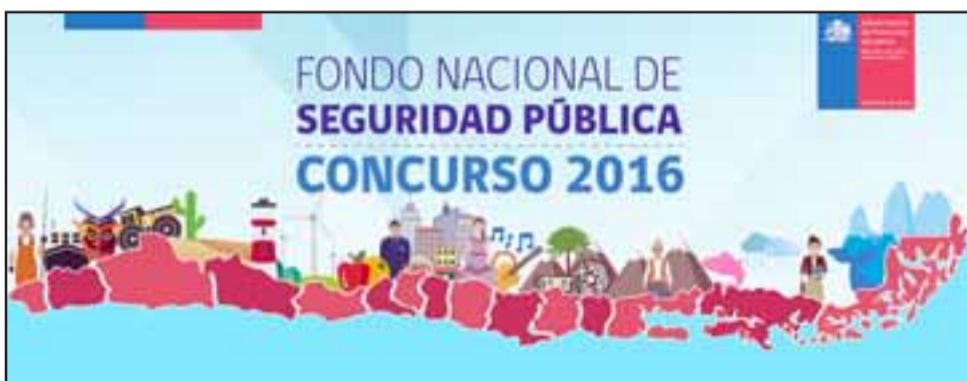
Afiche promocional del Fondo Nacional de Seguridad Pública, que este año entregará un total de $404.607.591 para la realización de diversas iniciativas de seguridad pública en la región.

Un total de catorce entidades de la región resultaron adjudicadas con el Fondo Nacional de Seguridad Pública de la Subsecretaría de Prevención del Delito, que este año entregará un total de $404.607.591 para la realización de diversas iniciativas de seguridad pública en la región. De éstas, dos son de la provincia de Los Andes, las cuales corresponden a la Agrupación de Amigos del Hospital San Juan de Dios de Los Andes y de la Municipalidad de San Esteban, por una suma total que supera los 55 millones de pesos.