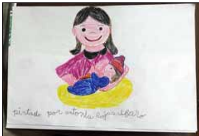
‘Lactar desde los Sentimientos’.- Concurso de pintura con niños en el marco de la Semana de la Lactancia Materna.

materna como un hecho natural en la vida de la persona, destacando que este es un hábito que debiera considerarse normal y que como sociedad debemos entregarle los espacios a las madres, para que puedan amamantar a sus hijos en todos los ámbitos de la vida cotidiana.