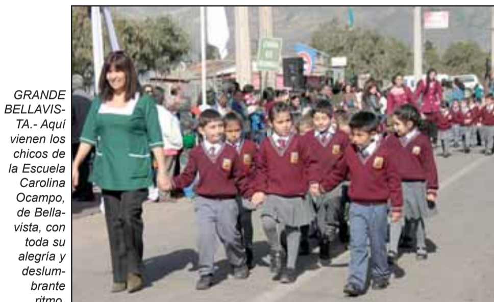
GRANDE BELLAVISTA.- Aquí vienen los chicos de la Escuela Carolina Ocampo, de Bellavista, con toda su alegría y deslumbrante ritmo.