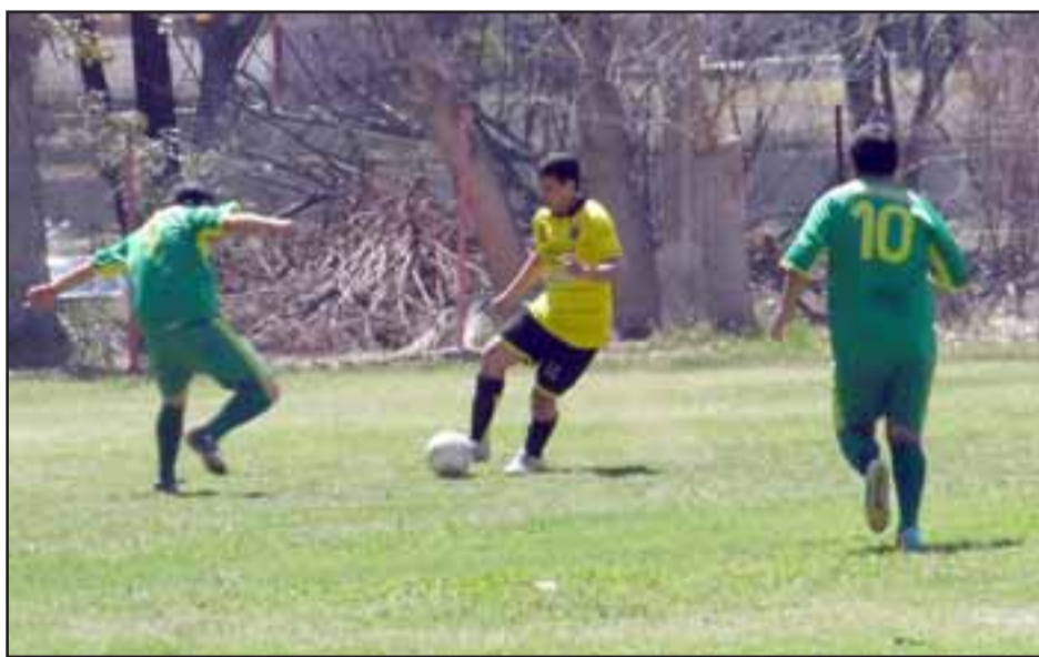
En la competencia de balompié aficionado de San Felipe se han jugado 8 jornadas.

El torneo que otorgará dos ascensos a la Libcentro Pro , comenzará a jugarse la noche del viernes y se prolongará hasta el domingo, teniendo como escenario exclusivo el Fortín Prat.