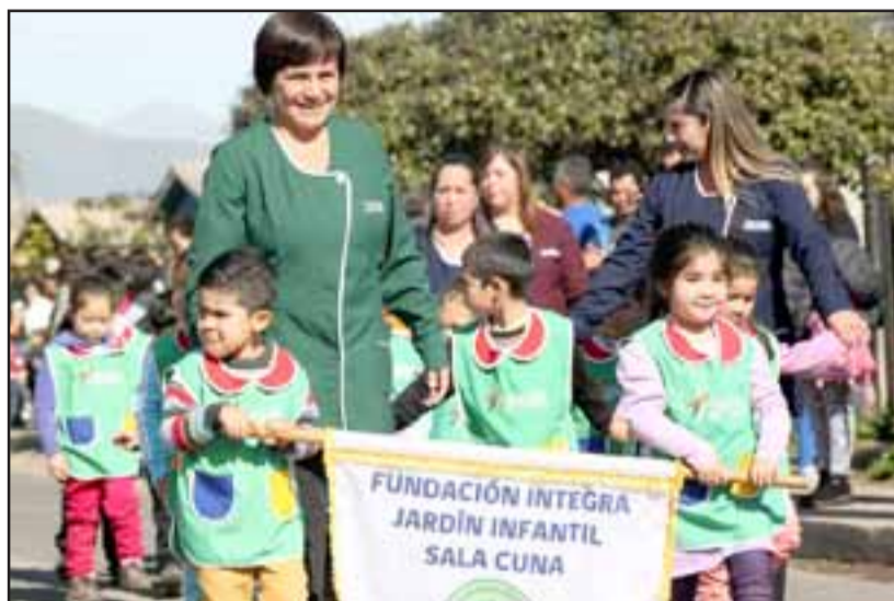
DUENDECITOS.- Aquí tenemos a los más pequeñitos del desfile, ellos son los Duendecitos de El Algarrobal, quienes se robaron el corazón de los presentes.