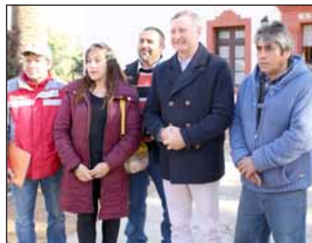
Vecinos estuvieron en la sesión junto al alcalde Pradenas, donde fueron informados de la factibilidad y costo del proyecto por parte del profesional asignado al estudio.

no es posible que estas familias, con niños y adultos mayores deban pasar una serie de complicaciones, al no poder tener agua potable como el resto de los vecinos de Panquehue. Vamos a recurrir a todas las vías e financiamiento, para que estas familias de Panquehue tengan agua potable lo antes posible”. Al término de la reunión las familias junto con agradecer las gestiones hechas por la autoridad municipal y reiteraron que estarán alertas, ante el desarrollo de cada una de las acciones.