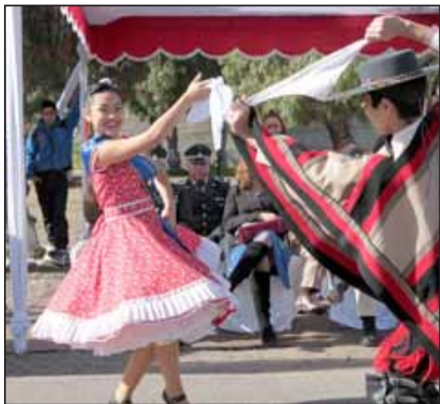
NUESTROS CAMPEONES.- La intensidad de nuestros campeones regionales de cueca también se hizo presente en este colosal desfile.