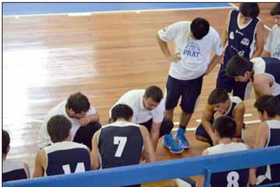
En el Fortín Prat se jugará el repechaje de la Libcentro B.

(*resultados expresados en la suma de los partidos de las cuatro series)