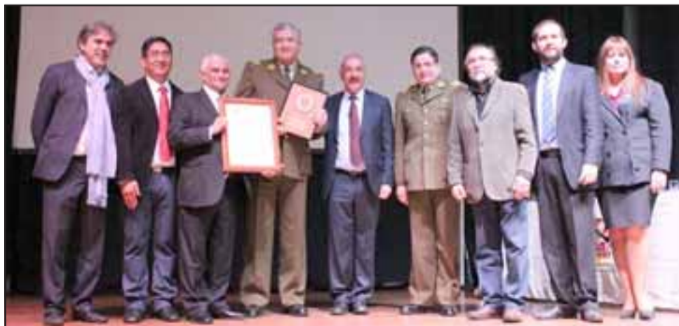
DISTINCION ESPECIAL. - Director nacional de Compras Públicas de Carabineros, general Roberto Cabrera Jerez.