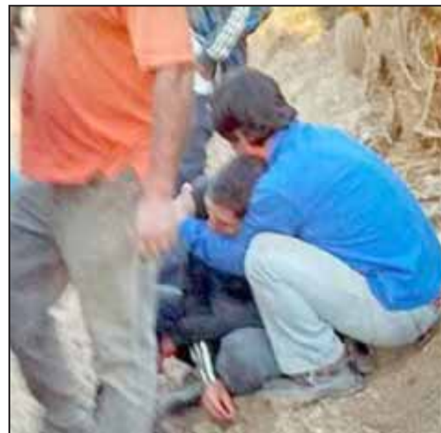
Profundo dolor entre los familiares del occiso el día del crimen.

No obstante, los jueces ordenaron un receso del juicio que se reanudará el día de hoy miércoles, donde participarán testigos y peri-