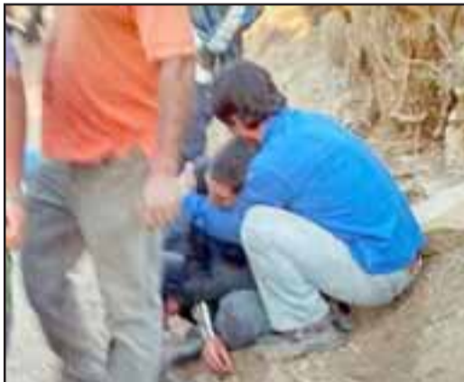
Profundo dolor entre familiares del occiso causó el crimen ocurrido en octubre de 2014

Grave incidente causó la muerte a uno de ellos