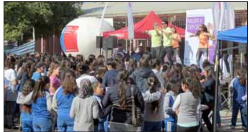
Fueron más de 200 alumnas del Liceo Corina Urbina de San Felipe bailaron animadamente por más de un hora.