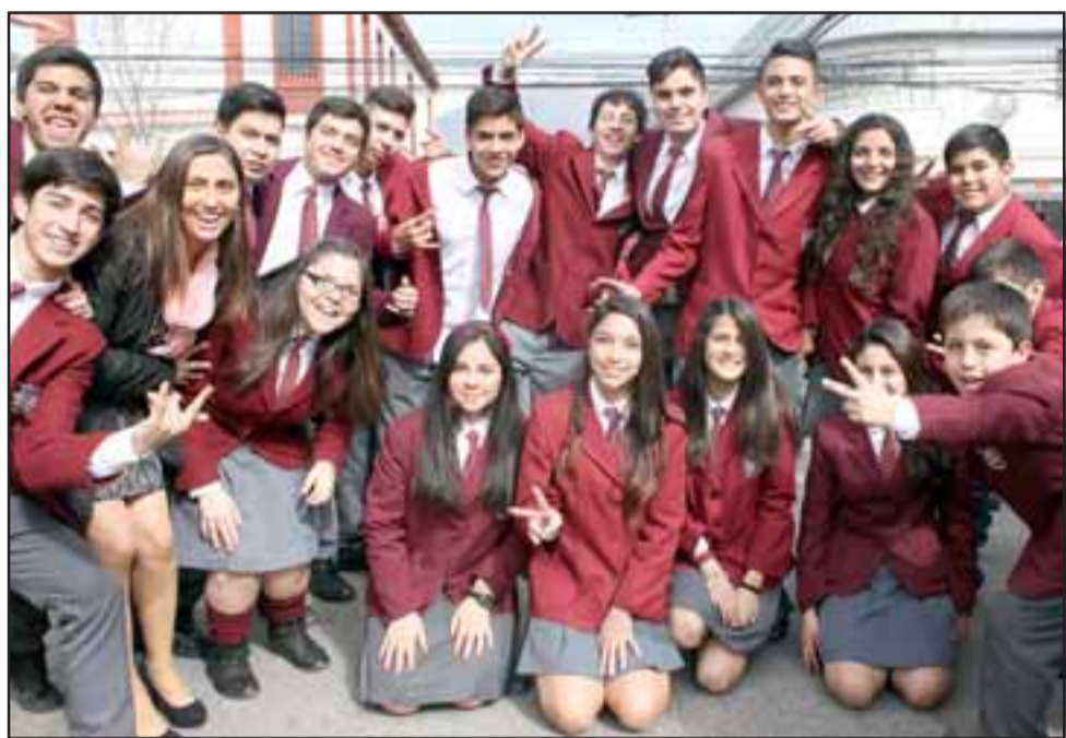
LOCURA JUVENIL. - Los jóvenes estudiantes del Colegio Portaliano también alegraron este desfile.

poco a poco pues «todos hemos palpado el crecimiento y desarrollo de nuestra ciudad en estos últimos años, cada día que ha pasado nuestro municipio ha trabajado para mejorar