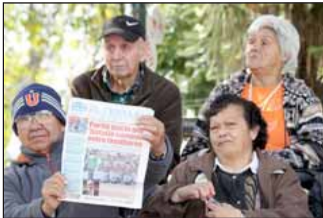
FIEL LECTOR.- Este sanfelipeño, fiel a Diario El Trabajo, logró llamar la atención de nuestras cámaras, pues nuestros lectores son nuestra razón de hacer periodismo desde 1929.

nuevo año de vida de la Tres Veces Heroica Ciudad, se