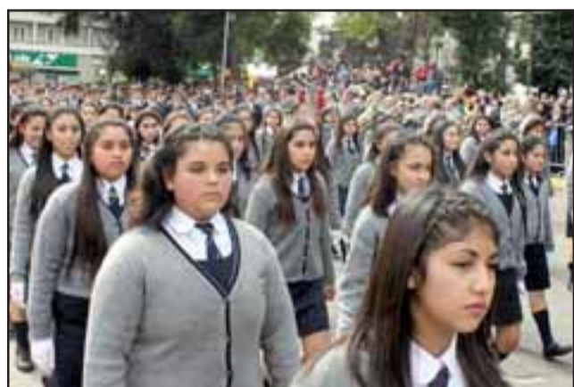
SAN FELIPE EN FRENESÍ. - Así de vibrante se vivió este colosal desfile cívico en el corazón de nuestra ciudad.