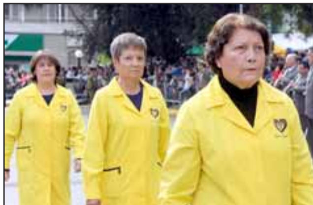
DAMAS DE AMARILLO.- Ellas son parte de Damas de Amarillo, agrupación de bien social que este año desfiló frente a las autoridades y público presente.