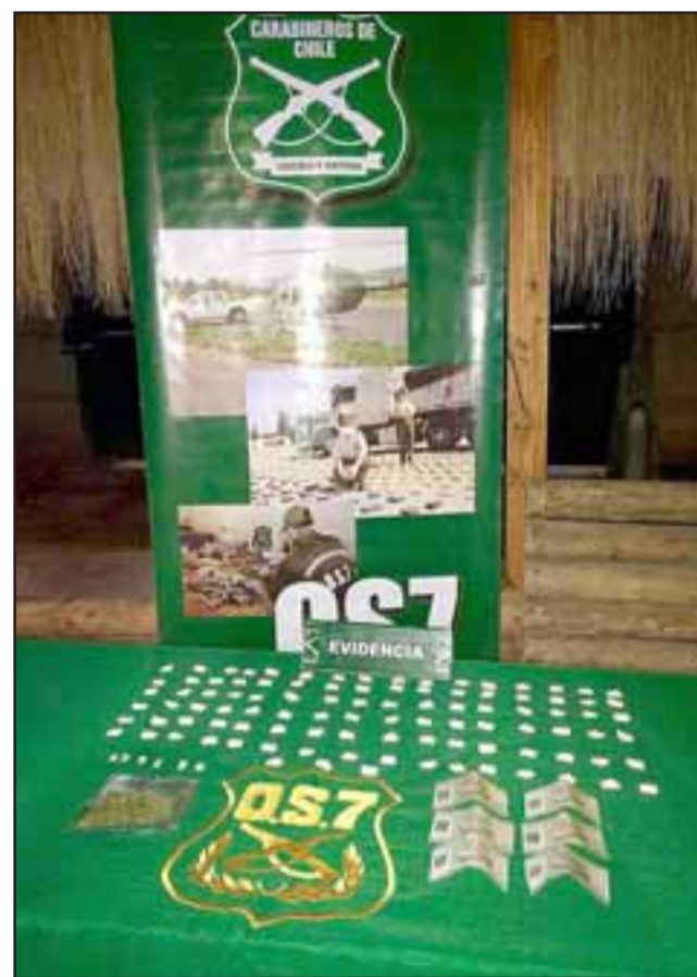
El operativo de OS7 se ejecutó la tarde de este martes en la población Nueva Algarrobal de San Felipe, incautando marihuana, pasta base y dinero en efectivo.