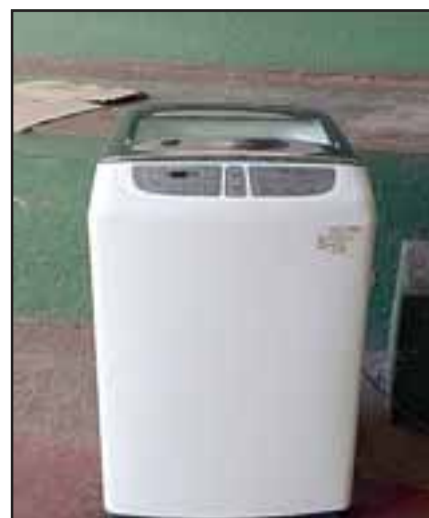
El tercer caso corresponde a E.A.A.P., de 30 años, quien fue sorprendido in fraganti , cuando se daba a la fuga portando consigo una lavadora, antes había sustraído desde un domicilio de la Villa Primavera.

El tercer caso corresponde al E.A.A.P., de 30 años, quien fue sorprendido de manera in fraganti , cuando se daba a la fuga