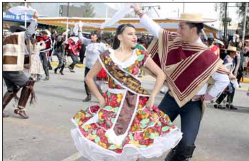
DESEQUILIBRANTE PAREJA. - Belleza, talento y juventud fueron derrochados por esta pareja de artistas sanfelipeños.

Las cámaras de Diario El Trabajo tomaron registro de cada detalle de tan espectacular desfile cívico. Aquí les compartimos algunas fotos de la actividad. Roberto González Short