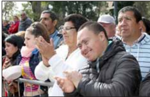
TODOS APLAUDEN.- El público aplaudió a más no poder, pocas veces hemos visto un desfile de aniversario como el de ayer miércoles.