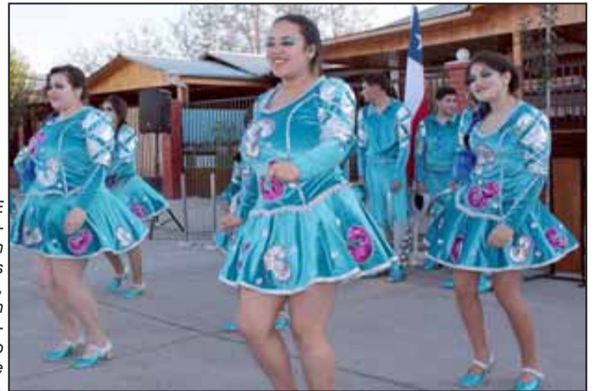
SIEMPRE BELLAS.- Ellas son las bellas caporales, también profesionales en todo lo que hacen.

co del 276 aniversario de la comuna, por lo que en Diario El Trabajo hoy le felicitamos públicamente.