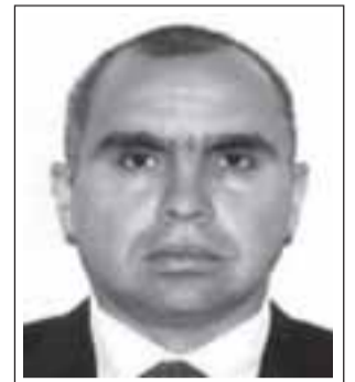
Por: Jorge Rubio Olivares, Abogado.

Tercero: Campañas de castación masivas, gratuitas e ineludibles, lo cual se convierta en política obligatoria para todas las municipalidades y así poder alcanzar un control sobre los nacimientos de animales y evitar los abandonos por parte de aquellos no sean capaces de responsabilizarse del cruce de sus mascotas o simplemente por no poder hacer cargo de la camada completa que paren nuestros animales y cuarta: impuestos altos a la compra de animales de raza de-