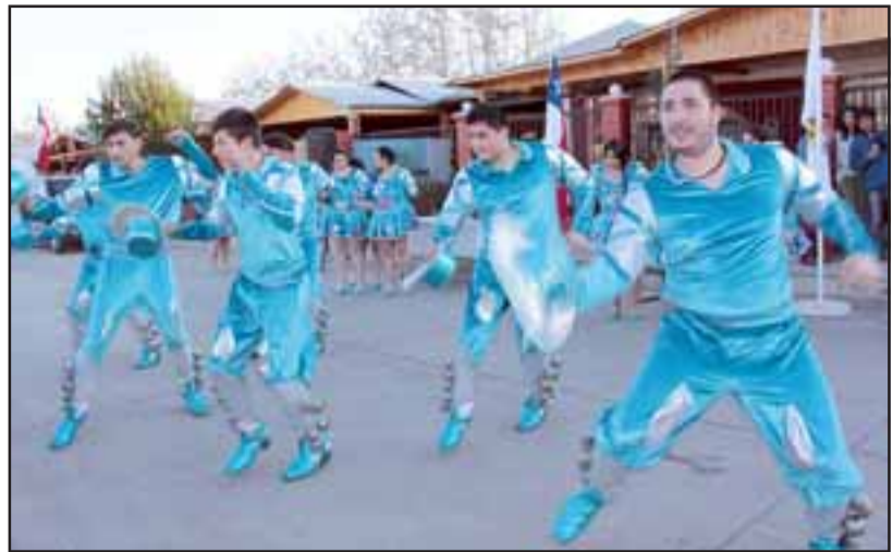
GRANDES CAPORALES.- Así bailan estos jóvenes artistas aconagüinos cuando son invitados a conquistar escenarios.