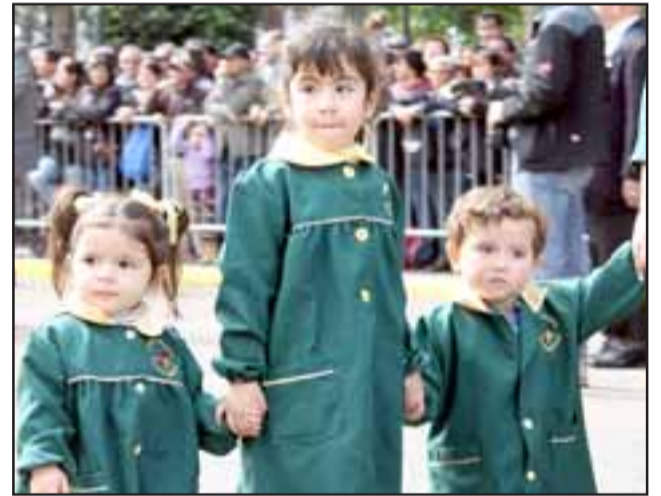
INSEPARABLES.- Estos pequeñitos de la escuela de lenguaje 'Cajita de Música', no se soltaron de sus manos nunca, están bien entrenados para poder salir a lugares concurridos.