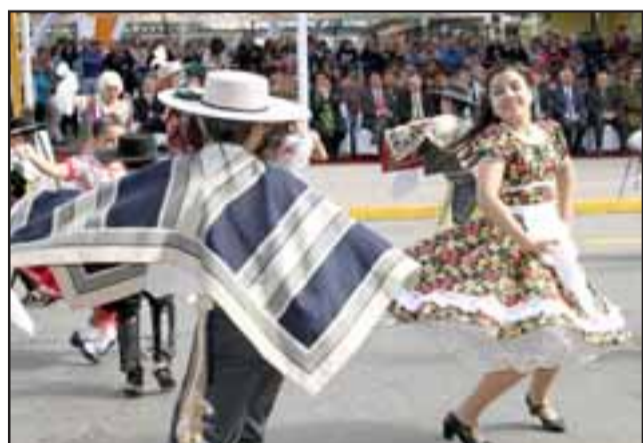
CAUTIVANTES. - La cueca fue el baile oficial de la jornada, bellas bailarinas y apuestos jóvenes engalanaron con su talento la gala de aniversario.