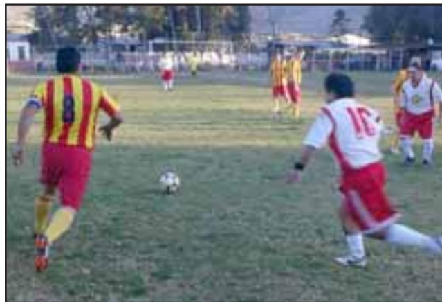
Luego de jugarse la cuarta fecha la cima del torneo quedó ocupada por dos equipos.

Eso es lo que puede concluirse luego de ver el sólido andar de PAC y la categórica victoria de Carlos Barrera sobre Andacollo, un conjunto que poco pudo hacer ante la nueva vedette del torneo.