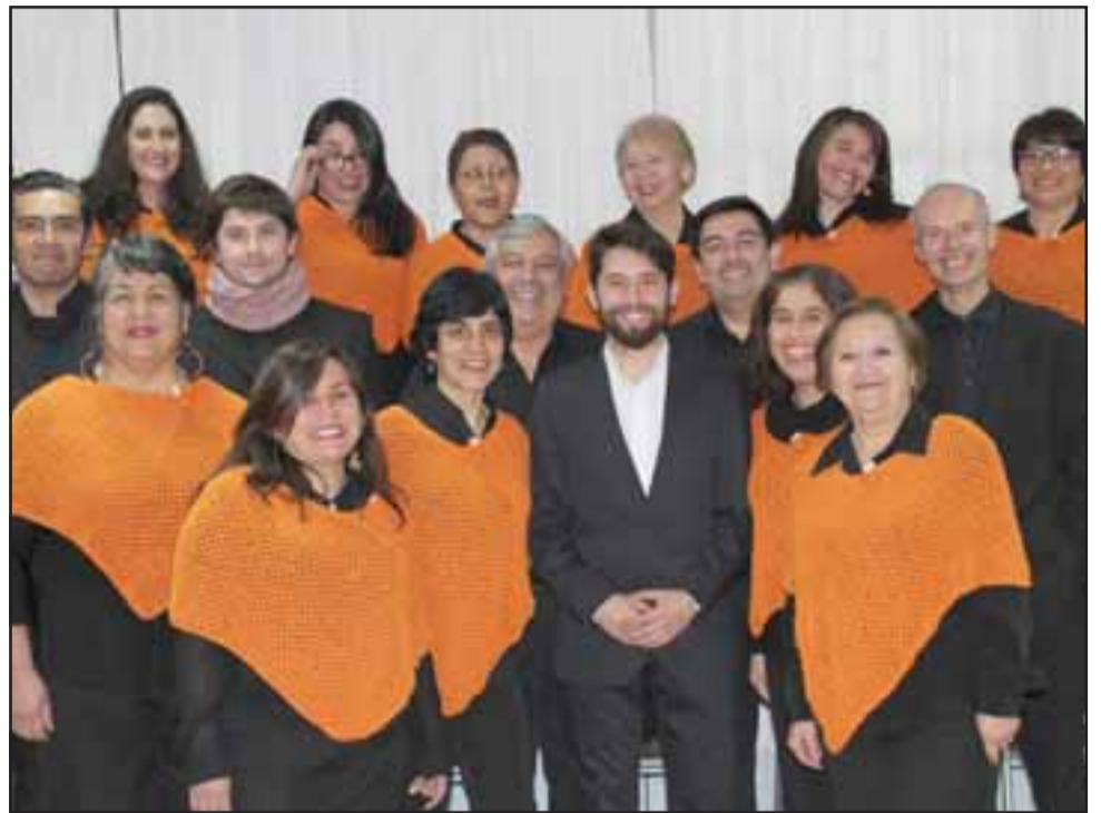
El actual Coro de Profesores de San Felipe.

Finalmente, Padilla informó que en esta ocasión participará como Coro Invitado, el Grupo Camerata Aconcagua y el Ballet Folclórico , ambos de San Felipe, destacando que la entrada es liberada por lo que se recomienda y agradece puntualidad para este gran Concierto Coral.