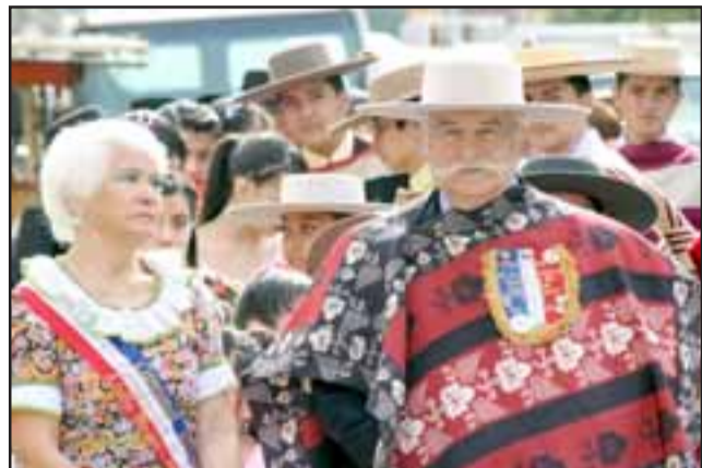
NUESTROS HUASOS. - Los más respetados huasos de nuestra provincia se hicieron presente para esta fecha tan especial.