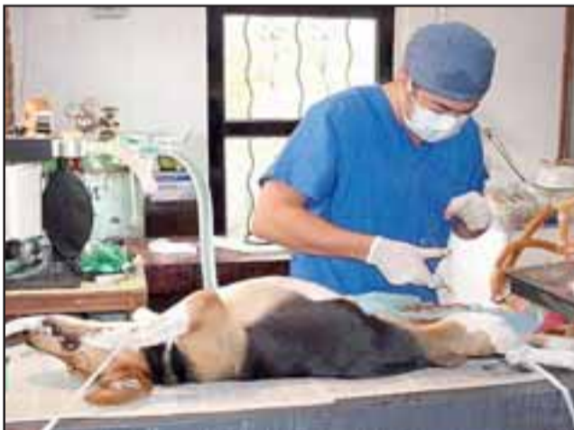
Serán aproximadamente mil mascotas las esterilizadas con veterinarios de manera gratuita en Panquehue.