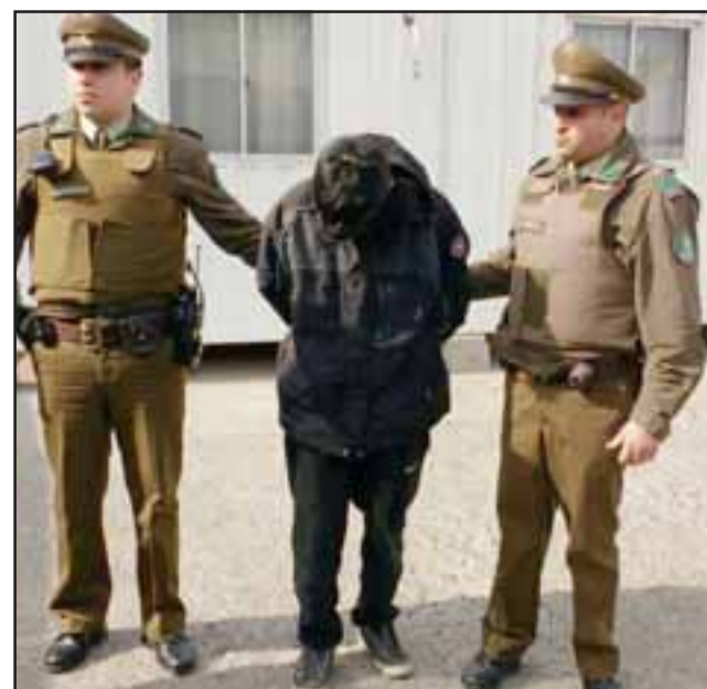
El imputado apodado 'El Conejo' fue detenido por Carabineros al interior de un local de juegos electrónicos en calle Cuarto Río de la comuna de Llay Llay.

El Tribunal otorgó la libertad del imputado de iniciales J.M.R.C. de 28 años de edad, ordenando sólo la cautelar de prohibición de acercamiento al local referido en el parte policial, fijando un plazo de investigación a la Fiscalía de 60 días,