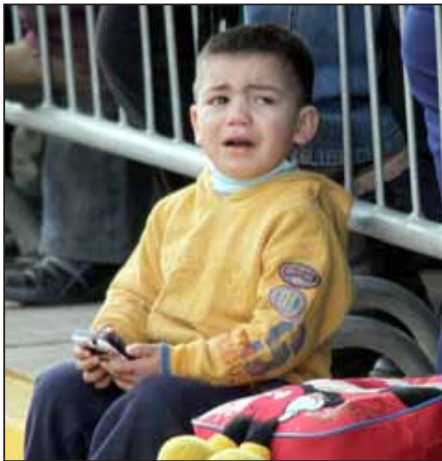
NO LO DISFRUTÓ.- Nuestras cámaras también registraron el desconuelo de este pequeñito, quien lloraba amargamente, quizás por algunos instantes se le perdió a sus papás. Lo cierto del caso es que no disfrutó el desfile.