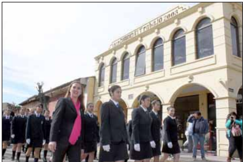
MUCHAS GRACIAS. - Los chicos de la Escuela Industrial, por iniciativa propia, decidieron ofrecer un desfile en honor a Diario El Trabajo frente al edificio de nuestro medio.

Al mismo tiempo, Freire recordó su primer discurso como primera autoridad comunal, en cual se comprometió para trabajar y luchar en pos del cumplimiento de los sueños de los sanfelipeños, promesa que –según dijo- se mantiene en pie y se ha ido concretando