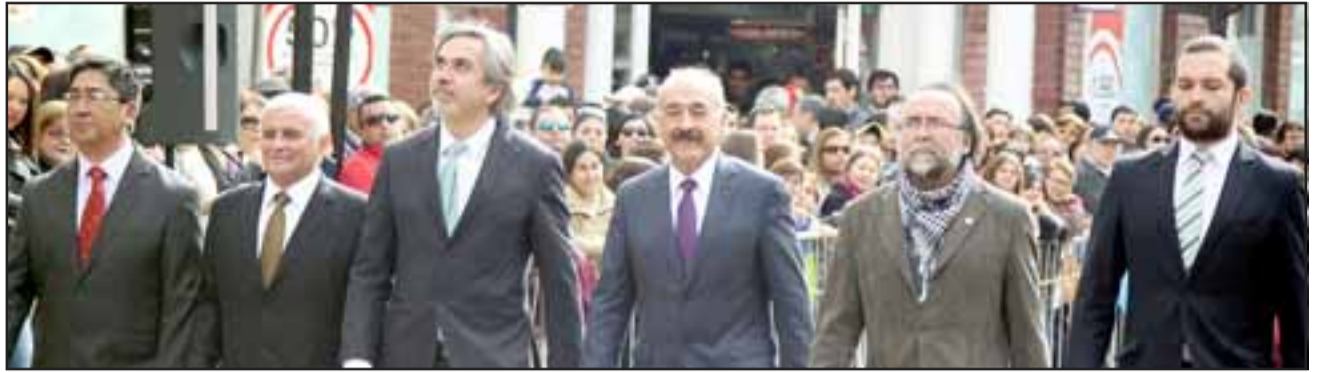
CONCEJO MUNICIPAL.- Aquí tenemos al Concejo Municipal de San Felipe, equipo de autoridades que también ayer desfilaron en celebración a nuestro 276° aniversario.

ta enviada al Rey de España Felipe II, describiría como "un lugar compuesto por pequeños valles, abundante cosecha y ganado; con dispersos poblados de mucho gentío, se esmeran