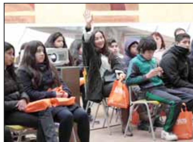
Alumnos de séptimo y octavo básico de la escuela Mateo Cokjlat, estuvieron presentes en un nuevo Andina Más Cerca, que por primera vez desde su inicio extiende su vinculación hacia San Felipe.

so que las mujeres puedan hacer tareas como la conducción de camiones de alto tonelaje.