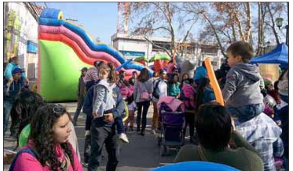
LOS BAJITOS FELICES.- Juegos inflables, concursos, pinta caritas y otras sorpresas son parte de la programación que el Municipio tiene contemplada para este fin de semana en la Plaza de Armas andina.