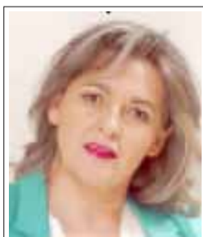
Por Patricia Boffa,

Esa labor debe ser realizada empatizando no con las autoridades, ni actuando en bloque con principio destructor, sino que empatizando con la comunidad y actuando en