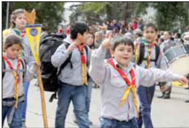
¿SIEMPRE LISTOS?- Así estaban estos pequeños Scouts sanfelipeños, alegres y con ganas de gritar sus consignas del grupo.