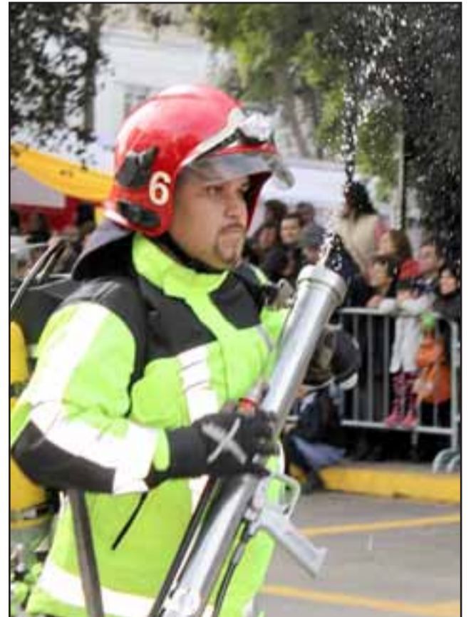
CUANDO MÁS LO NECESITABA.- A este valiente bombero se le ahogó la pistola que debía disparar una potente detonación de agua, al final sólo este chorrillo le salió.