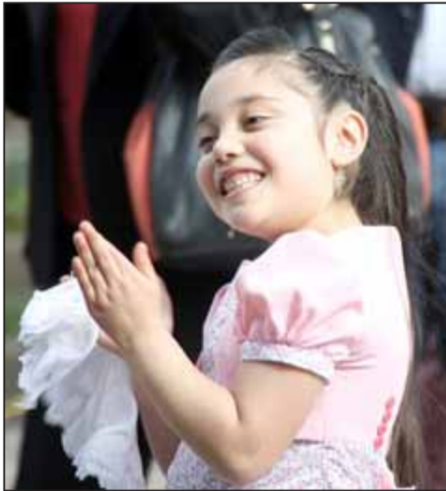
CAUTIVÓ AL PÚBLICO.- Esta preciosa niña cautivó a los presentes, pues nunca dejó de sonreír mientras duró su presentación.