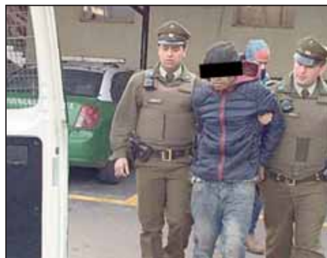
'El Cabeza de Lata' detenido por Carabineros tras cometer un nuevo delito que se suma a su prontuario delictivo, sin embargo la justicia determinó su libertad.