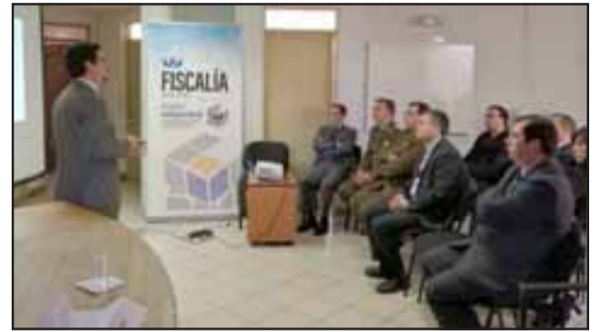
En dependencias de la Fiscalía de San Felipe se dio el vamos a nivel nacional, la Unidad Análisis Criminal y Foco Investigativo en San Felipe.

“En cuanto a la tasa delictual de delitos por robo por sorpresa, San Felipe ocupa la tercera ubicación de ocurrencia de delitos de robo por sor-