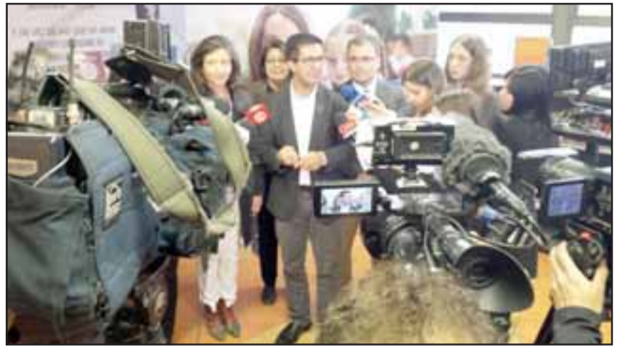
Carlos Henríquez, Secretario ejecutivo de la Agencia de Calidad de la Educa-

cripción voluntaria, autoaplicada por las escuelas, que entrega resultados inmediatos por estudiante, por estándar de aprendizaje y por habilidad, que reporta el progreso en el año y que orienta las prácticas de los docentes. Además, la información queda exclusivamente en poder de la escuela para la toma de decisiones pedagógicas y educativas, descartando comparaciones injus-