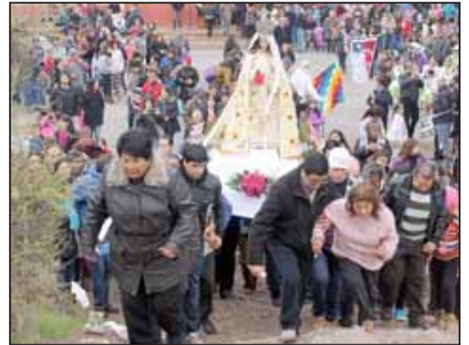
El domingo se celebrará la tradicional fiesta religiosa de la Virgen Nuestra Señora de las Nieves de Pocuro, donde cada año convoca a la procesión a cientos de vecinos y cofradías de músicos.