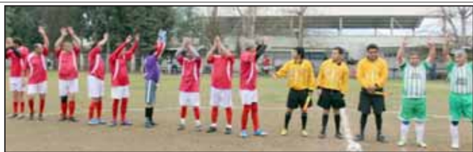
De manera ininterrumpida habrá fútbol aficionado en San Felipe y el Valle de Aconcagua.

De a poco Trasandino comienza a conformar su plantel para la próxima temporada de