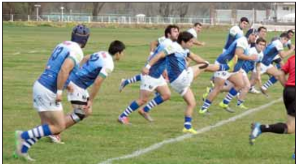
A los Halcones se les aproxima un fin de semana recargado.