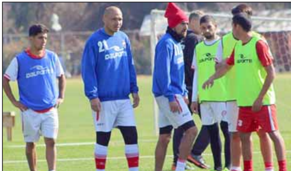
Unión San Felipe recibirá este domingo a Puerto Montt en el estadio Municipal.

Lunes 8 de agosto 19:30 horas, Unión La Cera – Curicó Unido