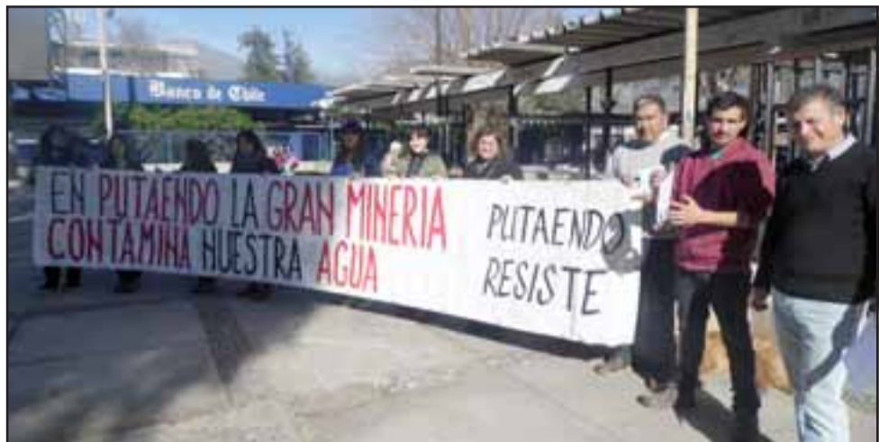
Nuevas caras se van sumando a la defensa del Agua en Putaendo.