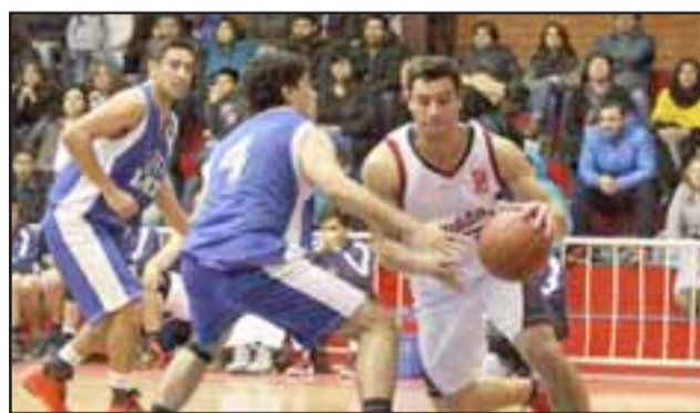
Los liceanos quieren ser los mejores de la Libcentro B.

El cuadrangular final se desarrollará durante todo el fin de semana por lo que de acuerdo a los resultados de la jornada inaugural se sabrá si Ceppi