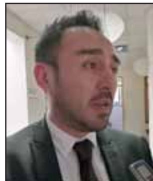
El subcomisario de la PDI, Humberto Cortés.

El oficial policial indicó, que se están analizando todas estas denuncias para lograr disminuir un núcleo de delincuentes que se encuentren perpetrando este tipo de ilícitos a fin de obtener personas detenidas y procesadas ante la justicia “ Básicamente hacemos un llamado a la comunidad a hacer las denuncias correspondientes porque nosotros podemos tener un universo de cien o doscientas denuncias pero quizás sean unas trescientas, las personas muchas veces no realizan las denuncias y nosotros perdemos información que es valiosa como la edad,