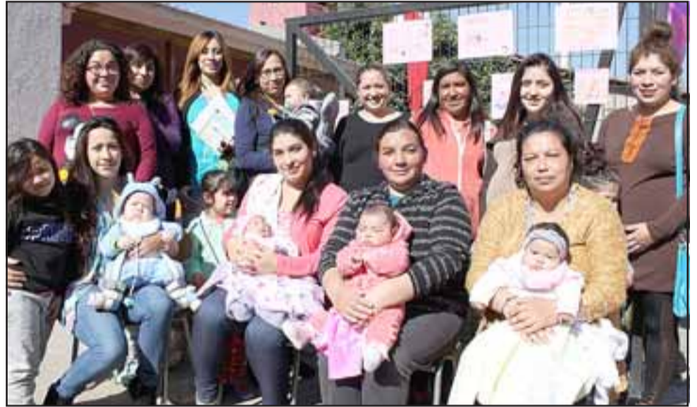
BELLAS MAMITAS. - Ellas son las mamitas de Curimón, quienes durante toda la semana fueron regaloneadas en el Cesfam de ese sector.