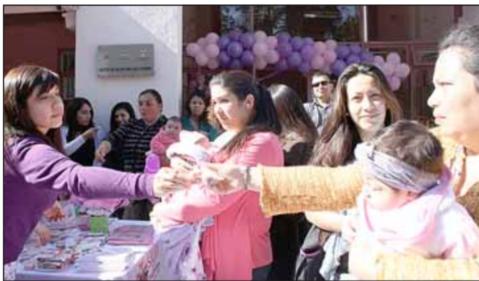
DULCE SEMANA. - En Curimón, las mamitas también disfrutaron de excelentes y nutritivos flanes, así fue el cierre de la actividad.