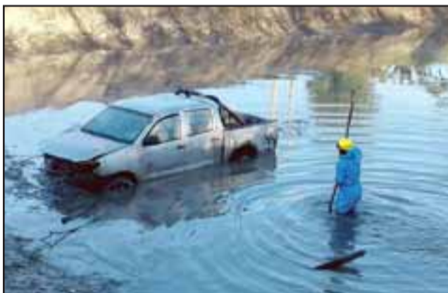
En la mañana del pasado viernes, apareció una camioneta marca Toyota, que había sido robada a su dueño, en la comuna de Santa María.

La SIP quedó a cargo de las diligencias para establecer si el vehículo eventualmente fue utilizado en la comisión de algún delito en la comuna de San Esteban.