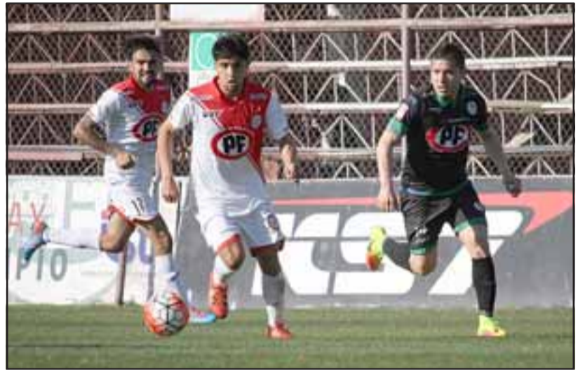
El equipo albirrojo tuvo un estreno feliz en casa al imponerse ayer por la cuenta mínima a Puerto Montt.