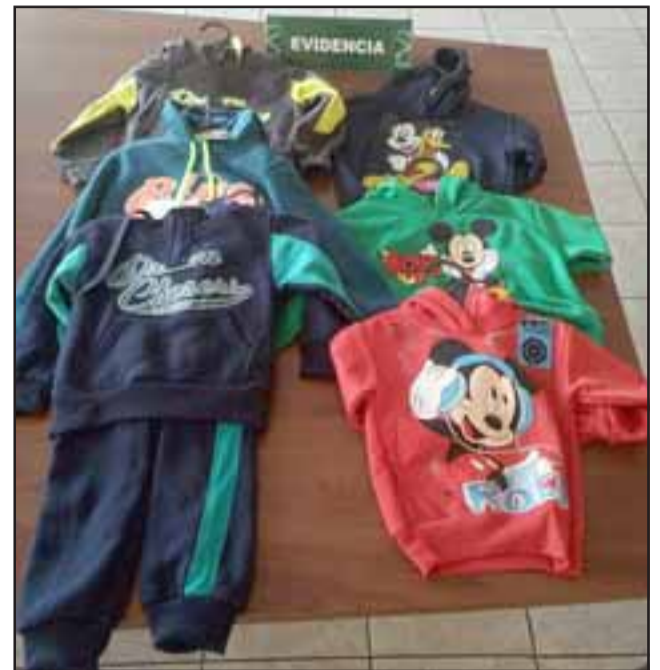
El antisocial fue capturado portando este vestuario para niños, robado desde el centro de la comuna de San Felipe.

Cabe mencionar que el imputado, el pasado 1 de mayo de este año, fue detenido tras ser sindicado como autor material del robo de dinero de una alcancía de la Fundación Las Rosas en un local del Espacio Urbano de Los Andes. En aquella ocasión el delincuente habría escalado el cierre perimetral para dirigirse hasta el patio de comi-