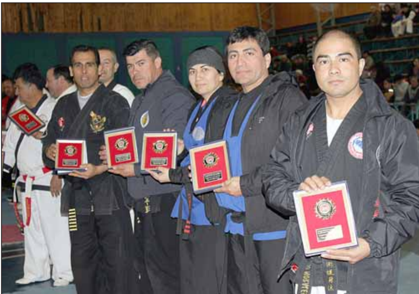
Alrededor de 30 Maestros, también fueron premiados por los organizadores del torneo.