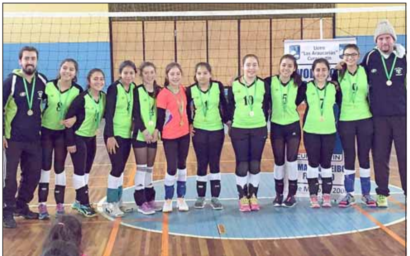
NUESTRAS CAMPEONAS. - Aquí tenemos a nuestras campeonas, ellas son las chicas U15 del Club San Felipe Voley de nuestro valle.

rán en una ciudad por determinar, esperamos sea en casa, para poder contar con el apoyo de los nues-