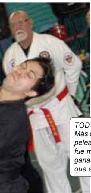
TODO POR NUESTRA COPA. - Más que una paliza, la potencia de pelea de estos cinturones negros fue más que profesional, pues las ganas de ganar la copa podía más que el mismo reglamento.