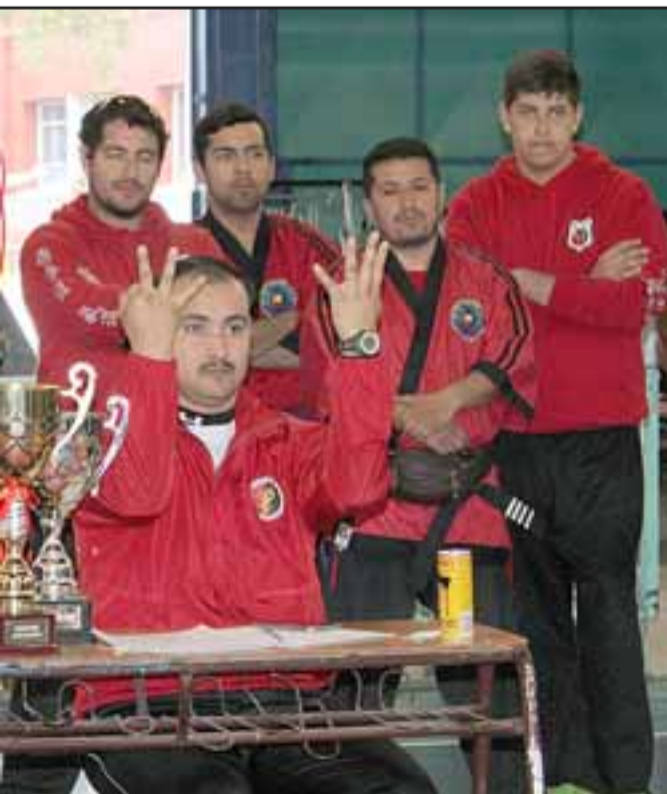
ente, al final ganó el mejor.