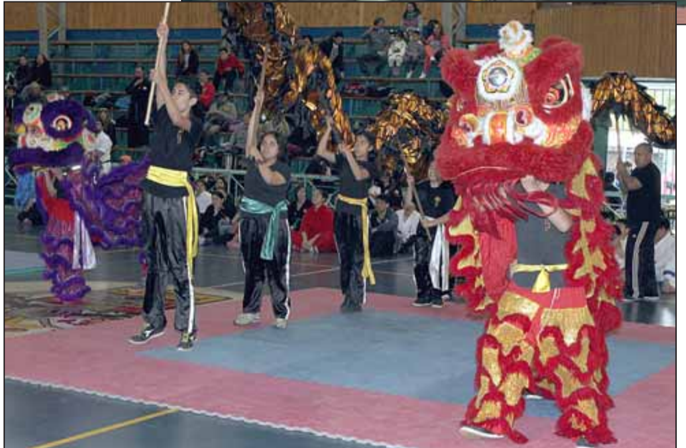
LEONES CHINOS. - Todo un colorido carnaval con leones chinos y bazucada oriental fue lo que se vivió para arrancar con esta jornada de Artes Marciales.