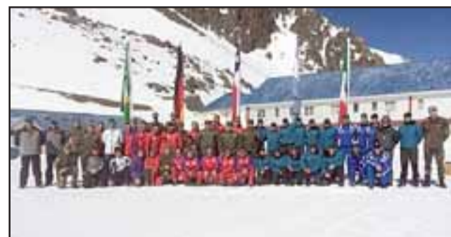
Las delegaciones participaron en la ceremonia de inauguración de esta nueva versión del torneo internacional, la que se realizó en Portillo.

Durante los días que dure la competencia, los participantes se medirán en disciplinas que contemplan el cross country, sprint, partida en masa, persecución y patrullas, tanto para hombres como mujeres.