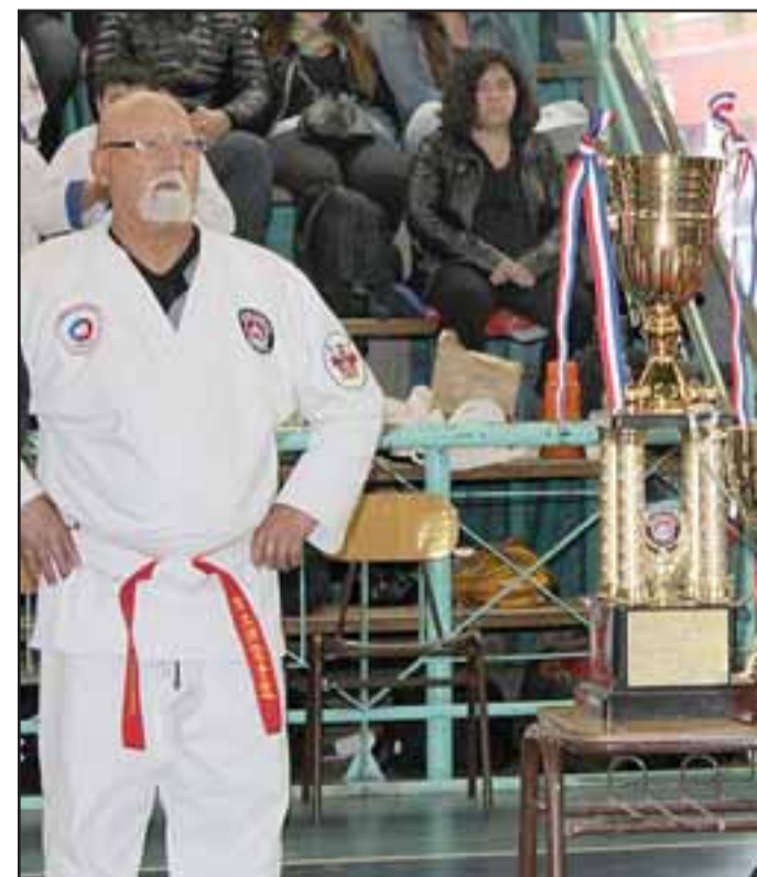
ÁRBITROS DE LUJO.- El arbitraje fue justo, equilibrado y diligente.