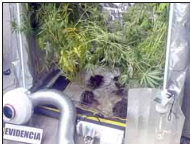
Buscando recuperar especies robadas se logró dar con un Cultivo Indoor de 28 plantas de cannabis sativa de entre 12 y 45 centímetros en sus respectivas macetas.

Fue condenado a 541 días de presidio con pena remitida al aceptar responsabilidad en los hechos.