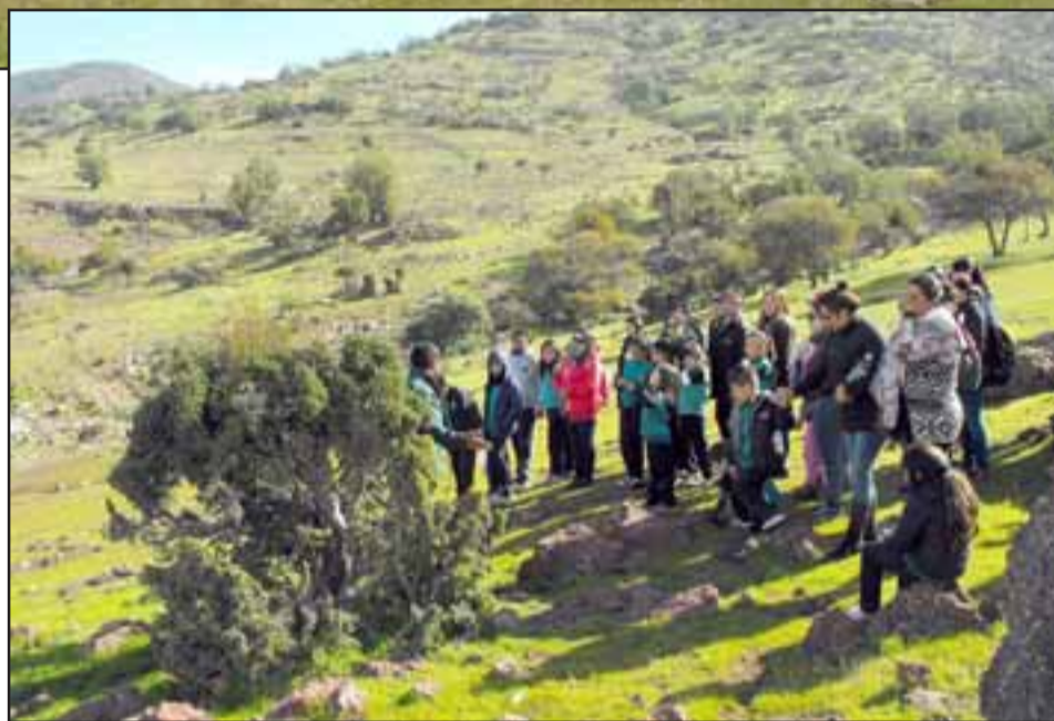
PETROGLIFOS. - Visita a los petroglifos del cerro Tucúquere de Putaendo.