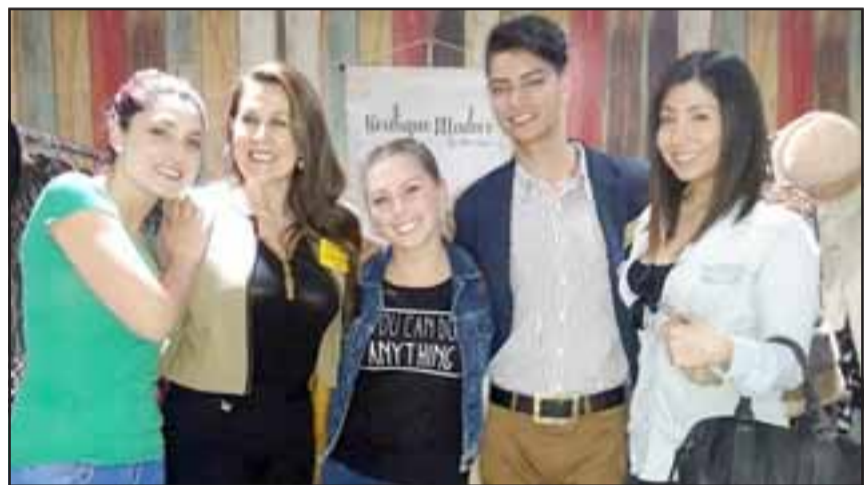
THE TEAM.- Las cámaras de Diario El Trabajo muestran a parte del equipo organizador.