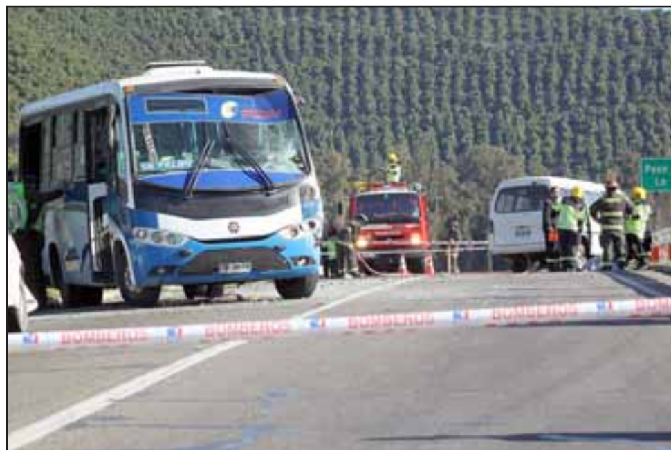
El accidente se originó cerca de las 15:00 horas de ayer martes en la ruta 60 CH, específicamente en el cruce Lo Campo de Panquehue.