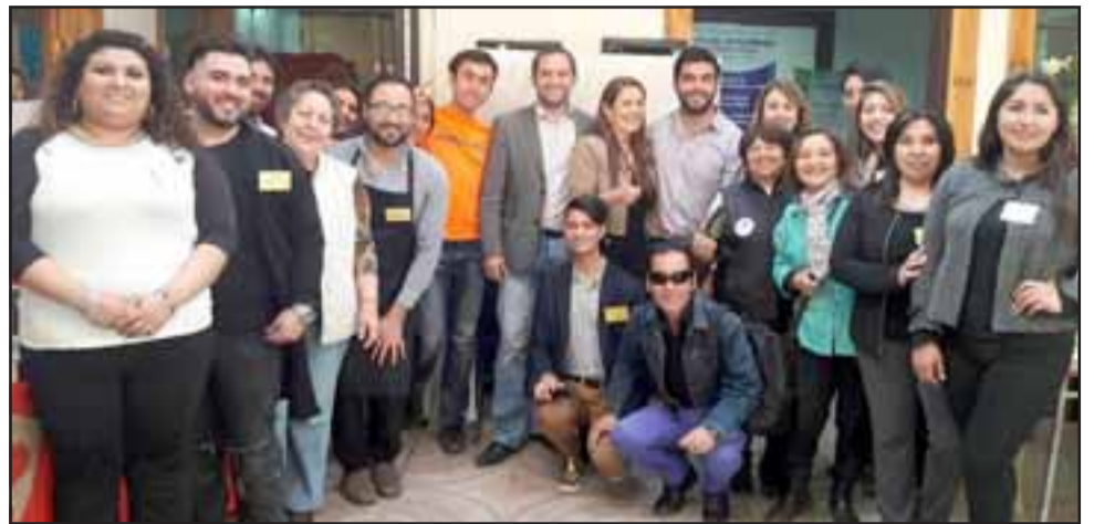
HASTA POLÍTICOS.- Gente de todas partes llegó al primer Fashion Day que se realizó en San Felipe este sábado.