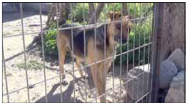
Esta perrita se salvó pero con evidente daño neuronal y sicomotor.

El sábado 13 de agosto a partir de las 9:00 horas: