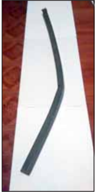
Carabineros de Catemu incautó este fierro de 70 cms. Que utilizó el antisocial para intimidar a la víctima.

Prisión preventiva fue la cautelar impuesta por el Juzgado de Garantía de San Felipe en contra de un sujeto que fue detenido por Carabineros, acusado de inti-