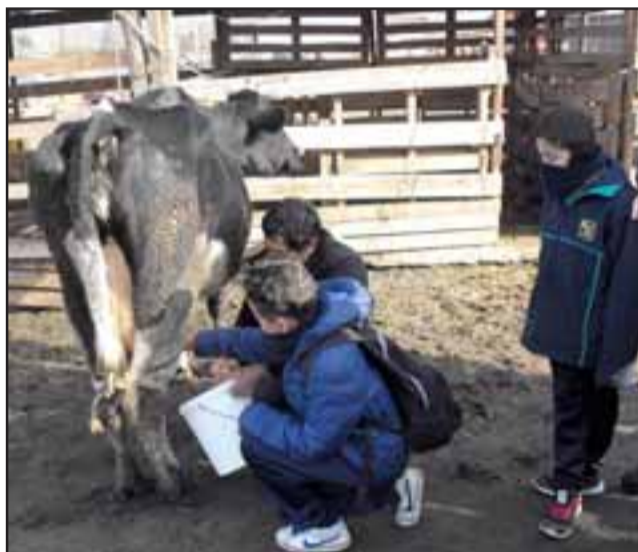
ORDEÑA MANUAL. - Algunos alumnos se dedicaron a aprendizaje de la técnica de extracción manual de leche