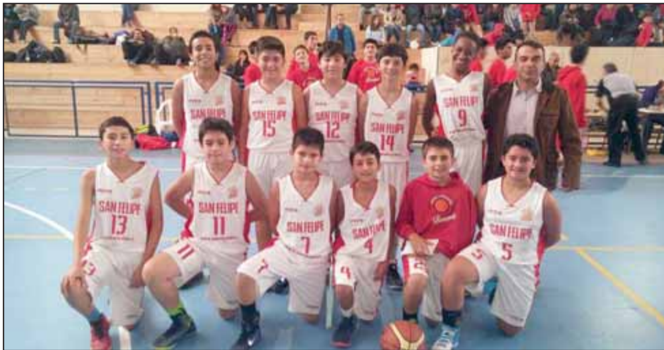
El equipo U13 de San Felipe Basket quedó tercero en el cuadrangular semifinal de la Libcentro B.