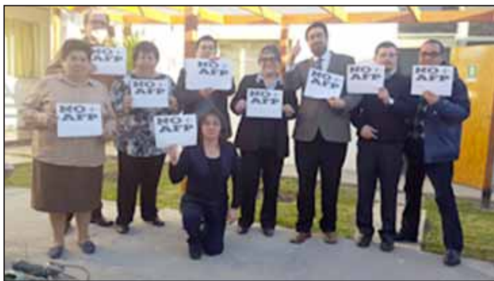
LUCHANDO. - Así se manifestaron estos funcionarios de la Asociación Funcionarios del Mineduc San Felipe-Los Andes (Andime).

Andime también nos hizo llegar un comunicado en donde destacan el aumento en la edad de jubilación por ejemplo, es desconocer claramente que hoy, el promedio de jubilación es a los 67 las mujeres y a los 69 los hombres y aun así, sus pensiones son miserables. Claro está que tan-