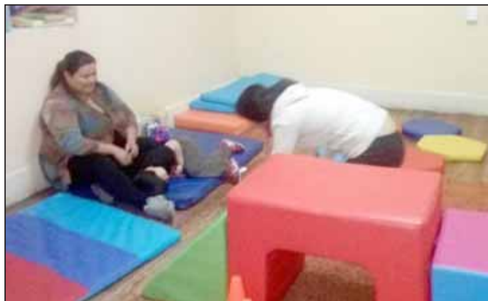
Una de las salas de la Casa Azul, donde se brinda parte del tratamiento a los niños con Trastorno del Espectro Autista, TEA.