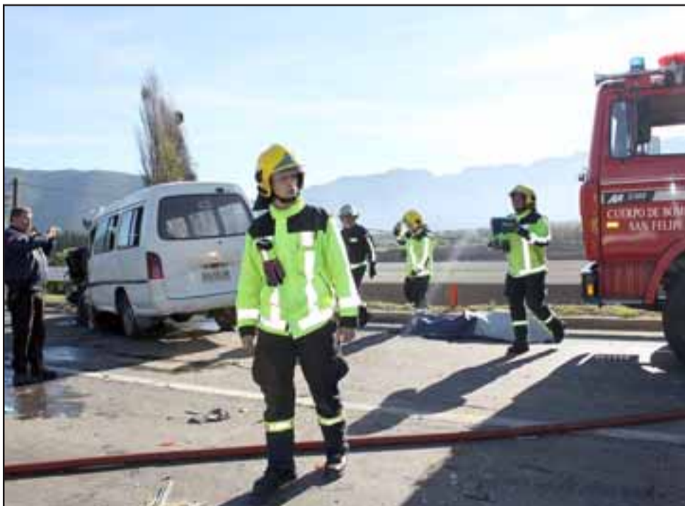
Personal de Bomberos de la Unidad de Rescate de Panquehue, asistió en la emergencia la tarde de ayer martes en la ruta 60 CH.