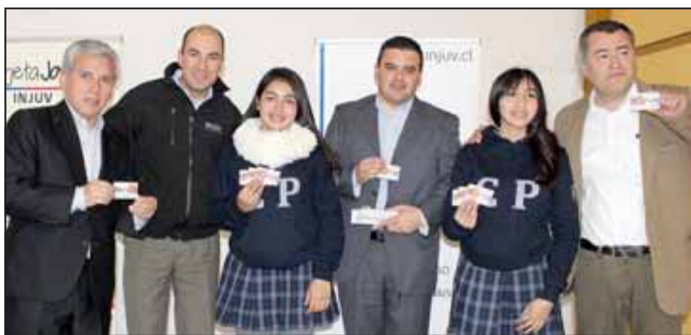
Con un desayuno público, que tuvo por asistentes a jóvenes de las comunas de San Felipe, las autoridades trataron temas de derechos laborales, acordándose la realización de talleres sobre seguridad laboral y liderazgo y comunicación efectiva.