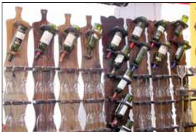
LICORERAS. - Estas licoreras artesanales de madera son las que fabrica este matrimonio para la venta.