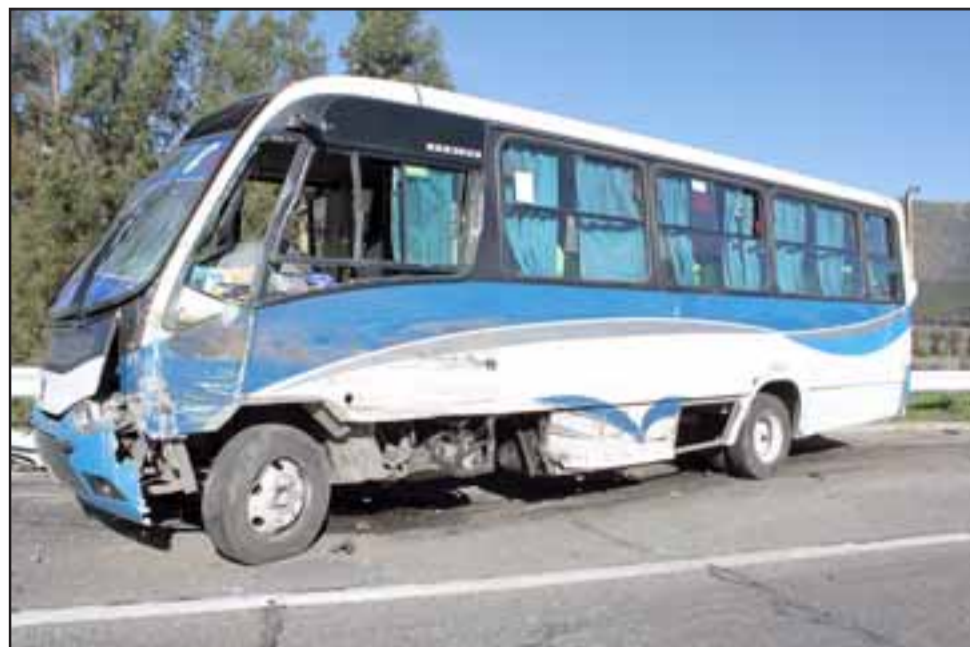
El microbús resultó con daños en la parte frontal, además de cerca de diez heridos y lesionados que debieron ser derivados hasta centros asistenciales.