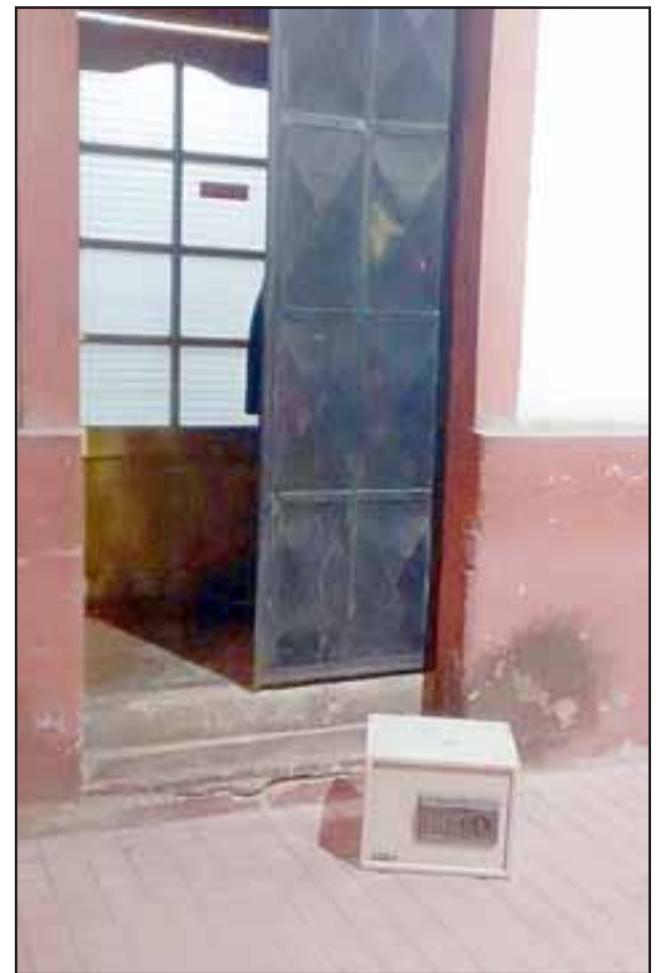
La caja fuerte contenía un millón de pesos, producto de la recaudación en el local de juegos ubicado en calle Ignacio Carrera Pinto de Catemu.

El Ministerio Público en su formalización, durante el control de detención, señaló ante el tribunal que la libertad del acusado representa un serio peligro para las víctimas y el resto de la sociedad, solicitando que se decretara la máxima cautelar de prisión preventiva, cuya medida fue acogida