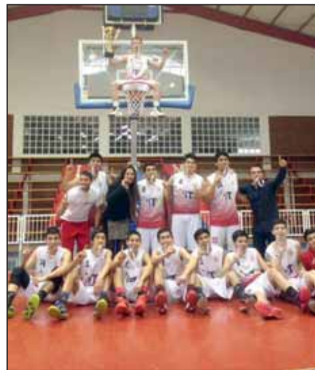
San Felipe Basket aprovechó su condición de local y se confirmó como es el mejor en la categoría U15 de la Libcentro B.