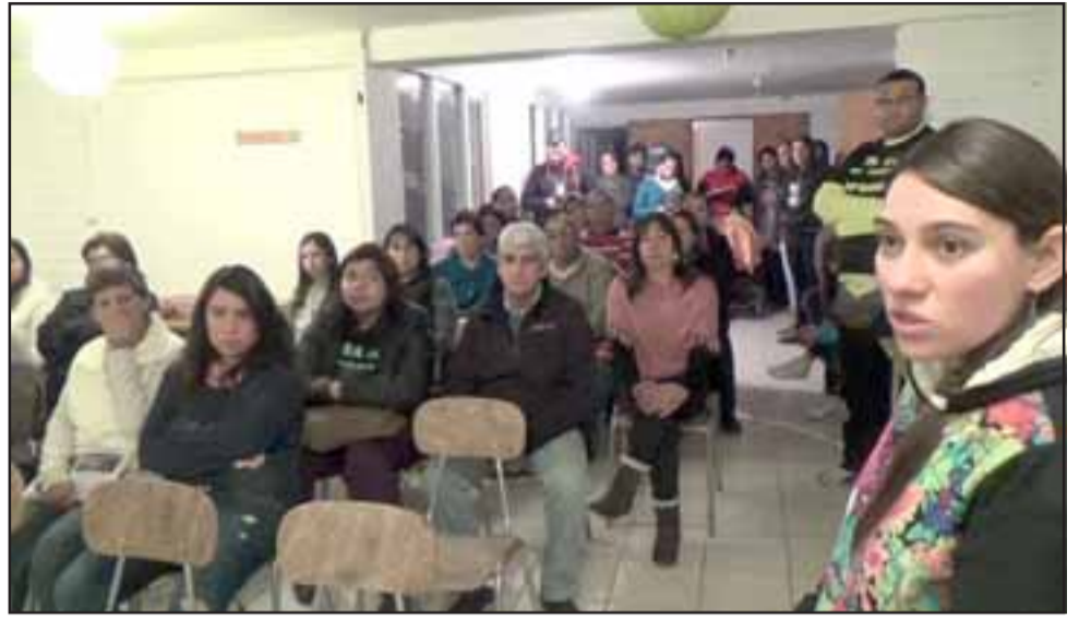
Una importante reunión se llevó a cabo en la sede de la junta de vecinos de Santa Filomena, con gran presencia de vecinos, quienes comentaron sobre la situación vivida en el envenenamiento masivo de mascotas en Jahuel.

Cabe destacar, que existen dos aristas de investigación más claras, una la posible intervención de crianceros y otra el actuar de de-