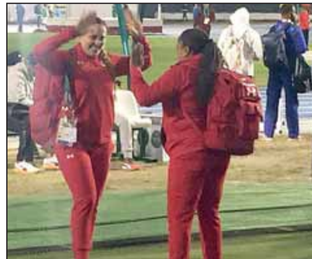
La atleta aconcagüina -en la imagen junto a su entrenadora- cumplió en Río con su objetivo personal de llegar a su segunda final olímpica.