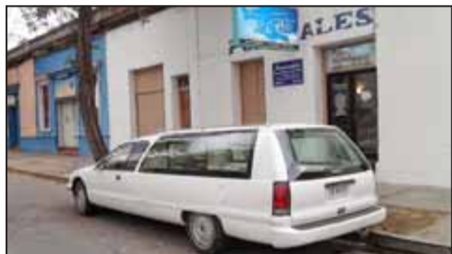
La funeraria Riffo se ubica en Av. Riquelme 9 en San Felipe. En este lugar los delincuentes fuertemente armados irrumpieron para robar dinero y otras especies de las víctimas.

Jairo Arenas Fuenzalida, aún angustiado y con impotencia reveló a través