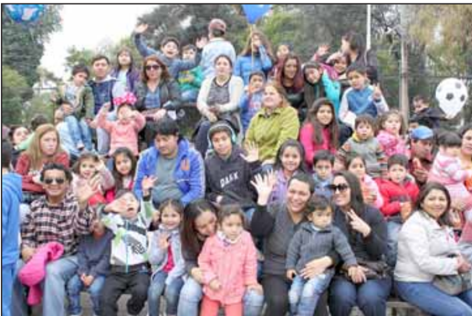
A LO GRANDE.- Por varias horas, familias enteras sanfelipeñas se olvidaron de todo para dedicar a sus hijos este rato de acompañamiento.