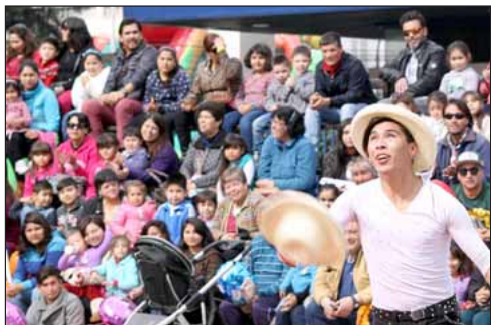
PURO TALENTO.- Este joven malabarista hizo de las suyas con los sombreros, las clavos con el público, que premió con alegría sus actuaciones.