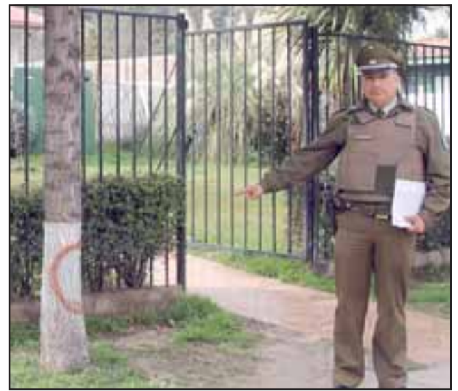
Un sujeto fue detenido la madrugada de este domingo luego de ser sorprendido rayando el frontis de la Tenencia de Carabineros de Putaendo.

ficó que J.E.E.H, quien registra domicilio en la alameda Alessandri, había rayado los árboles y una pandereta de la Tenencia de Carabineros, motivo por el cual fue detenido bajo los cargos de desórdenes y daño a la propiedad fiscal, y luego fue puesto en libertad por instrucción de la fiscalía.