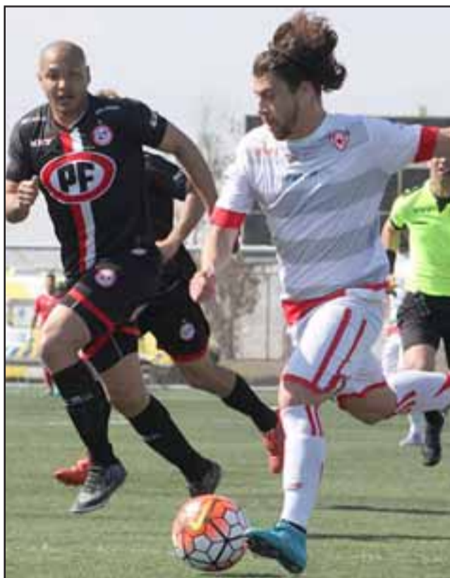
De manera inesperada Unión San Felipe fue vencido por Deportes Copiapó.