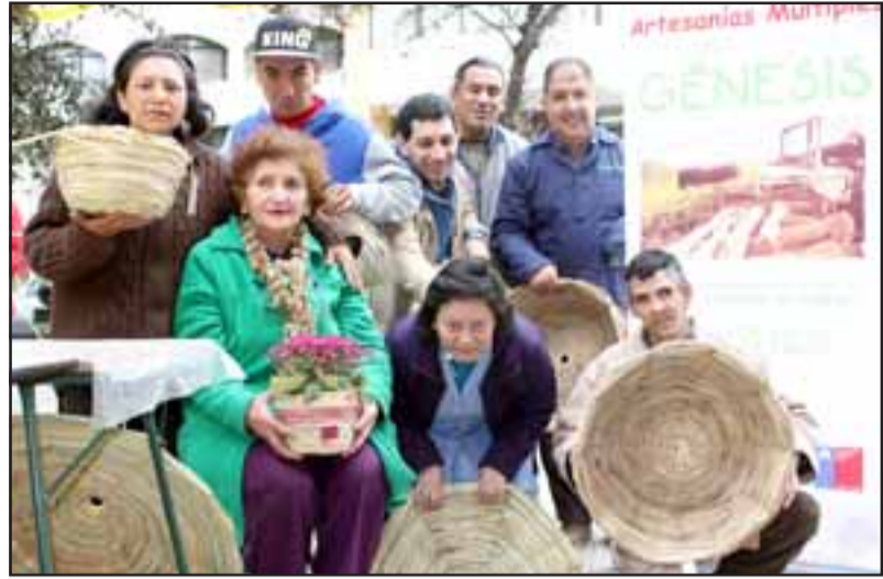
EMPRENDEDORES ARTESANOS.- Ellos son los artesanos del Taller Laboral Génesis, de San Felipe.

Esta semana será la última en que ellos estén trabajando y ofreciendo sus productos en la feria de la Plaza de Armas en San Felipe, en su taller se fabrican canastos, artesanías en platos de madera y cerámica, así como dibujos en papel y otras curiosidades artesanales en sartenes. Los interesados en acercarse y conocer este taller, pueden llamar al 962741668.