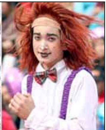
LOS PAJARITOS.- Ellos son Pajarito y su hijo Pajarito Jr. Dos payasos envolventes y que se dan a querer, aunque uno de ellos juega a ser 'el malo' de la película por gran rato.