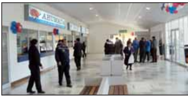
La oficina de Buses JM ubicada en el Terminal Rodoviario de San Felipe, fue víctima de la delincuencia la madrugada de este viernes.

Carabineros lo capturó cuando pretendía huir: