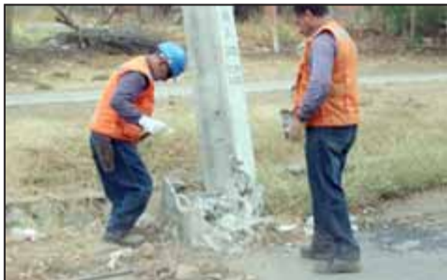
Conductor que en manifiesto estado de ebriedad guiaba su vehículo por el centro de la comuna, donde tras perder el control del móvil, impactó con el tensor de un poste del tendido eléctrico, generando un corte de suministro. (Foto referencial).