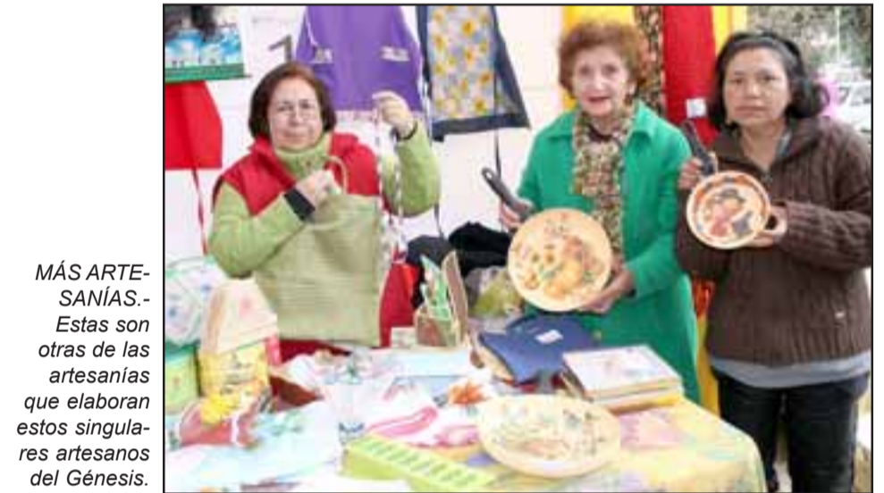
MÁS ARTESANÍAS.- Estas son otras de las artesanías que elaboran estos singulares artesanos del Génesis.