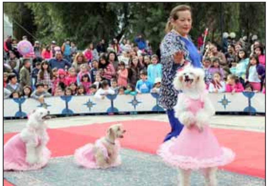
LAS PERRITAS.- Ellas fueron las estrellas del circo, pues bailaron, saltaron y hasta hicieron acrobacias sobre piezas de metal en movimiento.