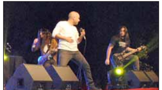
La banda de hard rock Blackcat se convirtió en la ganadora del concurso 'Aconcagua Vibra más Fuerte'.