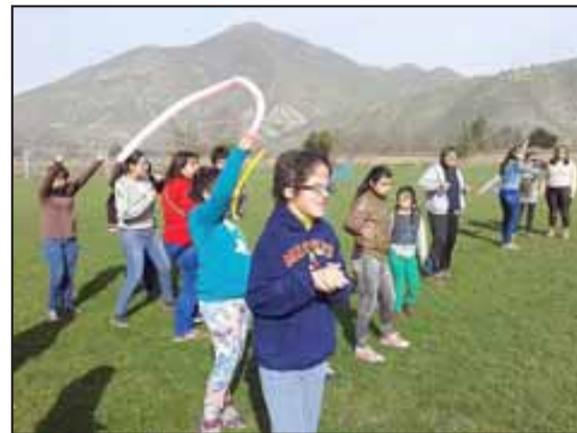
En el Centro de Eventos César se llevó a efecto la celebración del Día del Niño Diferente, actividad en la que tuvieron destacada participación diversas empresas y particulares.

Finalmente, el dirigente quiso instalar un desafío «al Centro de Eventos César, a Buses Guskar, a los Directores y dirigentes de los centros de padres y apoderados de los colegios y escuelas especiales de San Felipe, para que instauremos el viernes siguiente a la fecha oficial de celebración del día del niño, como el Día del Niño con Capacidades Distintas y Especiales en San Felipe... ¡Yo estoy disponible!».