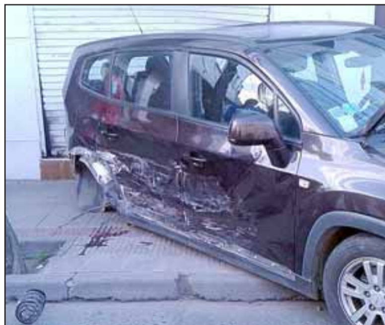
El Chevrolet Orlando se desplazaba por calle Traslaviña, siendo impactado en el costado derecho el jueves pasado en Traslaviña con Prat.

«Yo iba hacia la alameda Chacabuco y él venía por Prat hacia abajo (...) si ustedes se fijan me impactó en la parte de atrás y me hizo dar vuelta de remolino. Yo no tengo seguro, pero vamos a tratar de solucionarlo lo más cordial posible, esto de todas formas tiene que ir a juicio para determinar quien finalmente fue el que pasó con luz roja, quizá el arreglo del auto lo pueda pagar su seguro», detalló el conductor del Chevrolet.