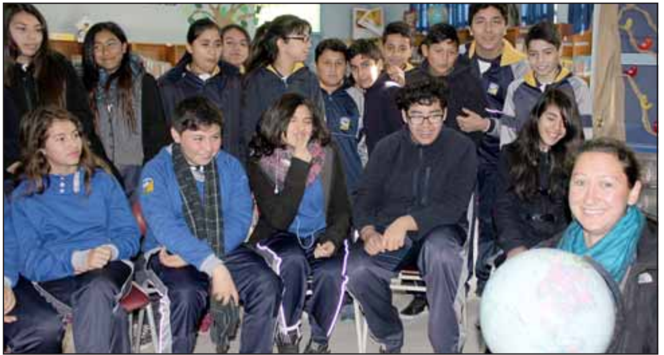
MUY CREATIVA. - Las cámaras de Diario El Trabajo toman registro de una de las clases que esta europea impartía ayer temprano a sus estudiantes en la Escuela José de San Martín.

voluntariado que hacemos algunas personas en el mundo. No somos pagados y lo hacemos con mucho gusto. Yo estaré hasta el 28 de noviembre en el país, por eso creo que debo aprovechar bastante el tiempo, para ayudar a estos chicos a mejorar su inglés, yo no les enseño gramática ni lectura, sólo a mejorar la pronunciación y la comprensión del idioma», dijo a Diario El Trabajo la europea.