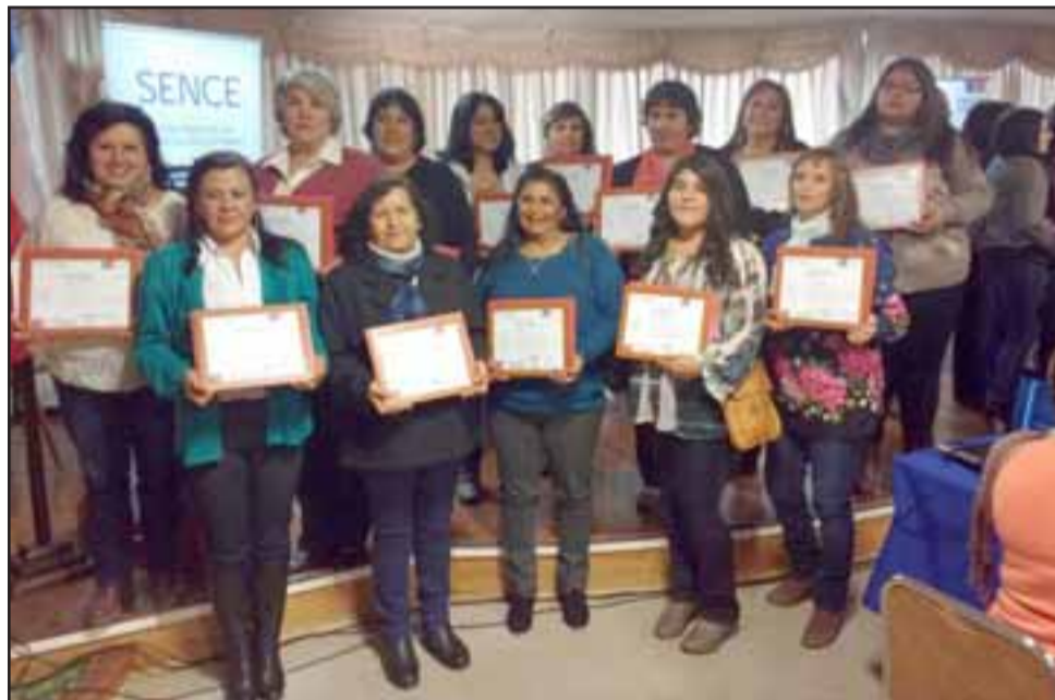
Fueron 15 las usuarias beneficiarias en una certificación de Indap-Sence, además de una compensación de 300 mil pesos para iniciar su proyecto, todo esto enmarcado en el programa Más Capaz Mujer Trabajadora.