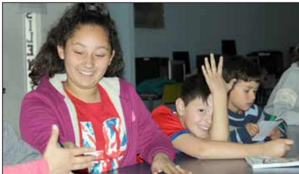
SOÑANDO. - Los estudiantes de esta escuela sanfelipeña están como locos con la posibilidad de pronto recibir una y muchas cartas escritas de otros chicos de su edad, pero que viven a más de 12.000 kilómetros de nuestra comuna.