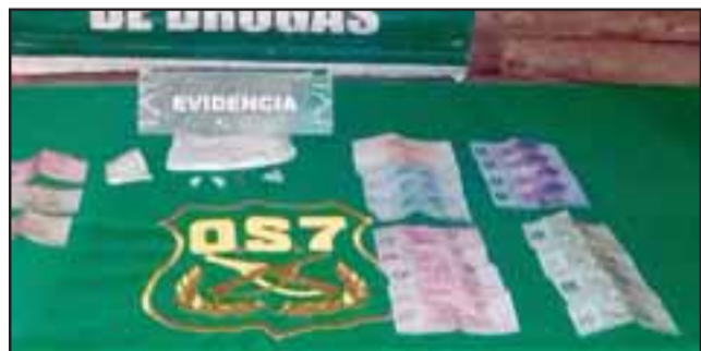
Las drogas fueron incautadas por el personal de OS7 de Carabineros desde un domicilio de la comuna de Llay Llay.