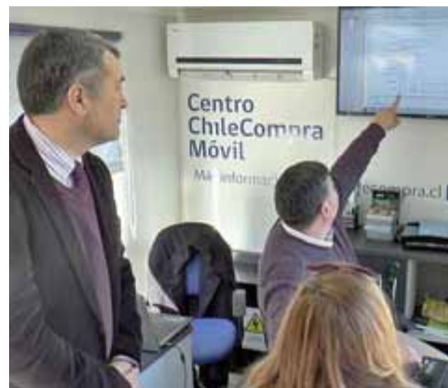
La Gobernación de San Felipe y ChileCompra instalan centro móvil en la Plaza Cívica.

llo, usuario que visitó el centro móvil, se mostró satisfecho con la instalación de esta oficina en la zona. “Yo soy de San Felipe, tengo mi negocio y dentro de mis ventas, el 90% los hago a través de ChileCompra. Este es un muy buen sistema de venta. Yo al menos me manejo bien en esta plataforma, pero nunca está demás resolver algunas dudas” sostuvo.