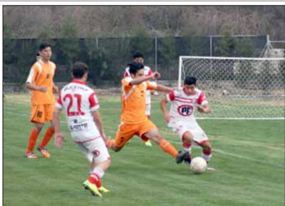
Los canteranos de Unión San Felipe tuvieron una jornada menos que regular ante Cobresal