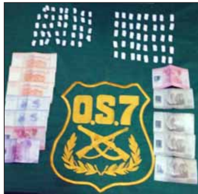
El OS7 de Carabineros incautó la droga en un operativo nocturno en la población Pedro Aguirre Cerda de San Felipe.