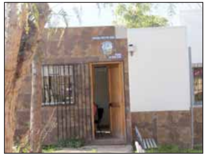
Comité de Agua Potable Rural (APR) de Las Coimas.

"Si yo estuviese entregando arranques domiciliarios a chalet como ella dice, que lo demuestre con papeles en mano y vamos las dos e invitamos a la prensa para darlo a conocer, porque aquí no se ha beneficiado a nadie por sobre otro vecino del sector y eso que ella dice es totalmente falso, y con respecto a la situación de la vecina de Alto Las Coimas, no co-