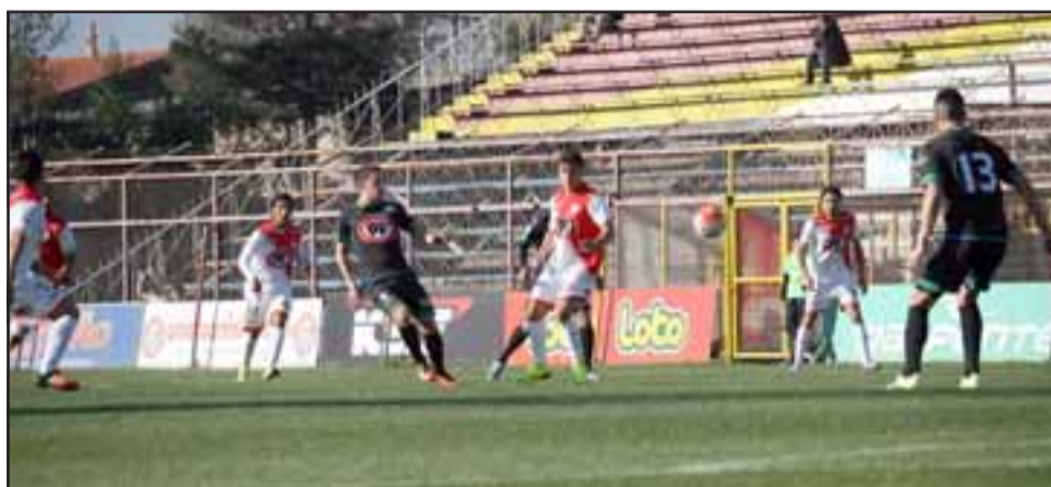
El domingo próximo Unión San Felipe será anfitrión en el estadio municipal.

17:00 horas, San Marcos – Coquimbo Unido