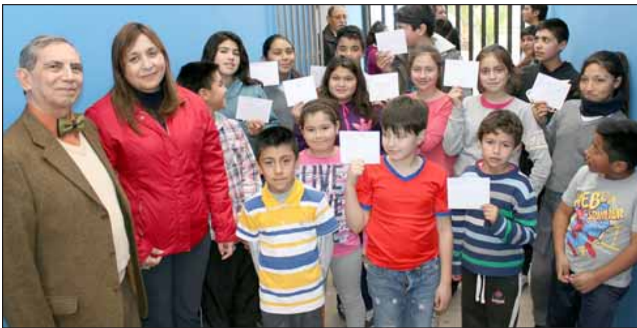
CARTAS PARA COSTA RICA. - Ellos son los niños sanfelipeños que han escrito cartas para intercambiarlas con escolares de escuelas de Puerto Limón, pues quieren conocer cómo se vive la vida escolar en ese país centroamericano.

Pero no sólo se trata de escribir cartas para amigos sus futuros amigos, también participaron en la elaboración de un video del proyecto, en donde ellos saludan a los escolares limonenses y les invitan personalmente a responder sus cartas.