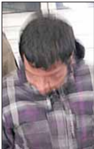
'El Cheo Patas Cortas', quien registra dos órdenes de detención vigentes por un asalto al chofer de un radiotaxi y robo en lugar habitado.

forma inmediata si es visto en algún sector de la comuna, toda vez que se trata de delincuente de alta peligrosidad.