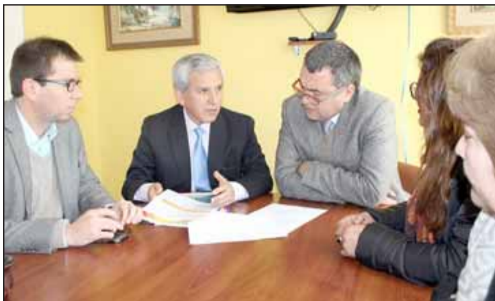
Enmarcado en la ejecución de un Registro Social de Personas en Situación de Calle en San Felipe, el seremi de Desarrollo Social se reunió con el gobernador provincial y un representante comunal para ultimar los detalles.

Con miras a este proceso en San Felipe, el seremi se reunió con el gobernador provincial y un representante comunal para ultimar los detalles. "Para nosotros es súper importante esto. Efectivamente con los sistemas antiguos de medición nuestras vecinas y vecinos en situación de calle no existían. Entonces hoy día el Registro Social de Hogares se transforma en el Registro Social Calle para saber precisamente cómo apoyarlos y ayudarlos. Hay un tema de solidaridad y de responsabilidad que tenemos, por eso para nosotros como gobierno es