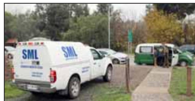
El sujeto fue encontrado por su hermano el pasado viernes cuando fue a visitarlo. (Foto Referencial).

El oficial de Carabineros agregó que los efectivos de la PDI descartaron la intervención de terceras personas y barajan como hipótesis del deceso causas naturales, lo que deberá ser dilucidado por el Servicio Médico Legal, que practicará la correspondiente autopsia.