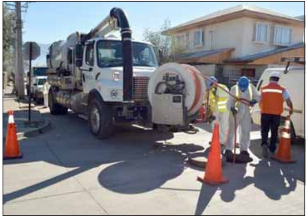
Esval considera el recambio de 350 metros de tubería en las calles céntricas de la comuna.

Finalmente, el ejecutivo destacó la coordinación realizada con las autoridades para la ejecución de estos trabajos, además del contacto con los dirigentes y vecinos del sector céntrico de Putaendo, a quienes se les informó a través de un 'puerta a puerta' de todos los pormenores.