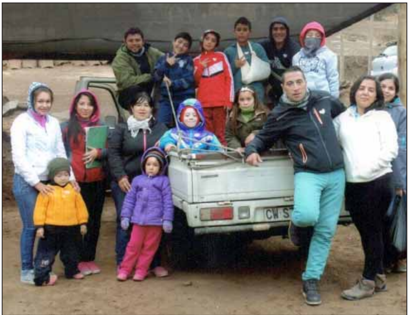
SIEMPRE GÉNESIS.- Aquí tenemos a varios de los integrantes de este colosal proyecto comunitario instalado en Las Cabras.

también juegos de Short-Track, carreras en bicicletas en circuitos cortos, dependiendo de la edad, habrá categorías Principiantes, Expertos, Mujeres y Open (todos juntos)".