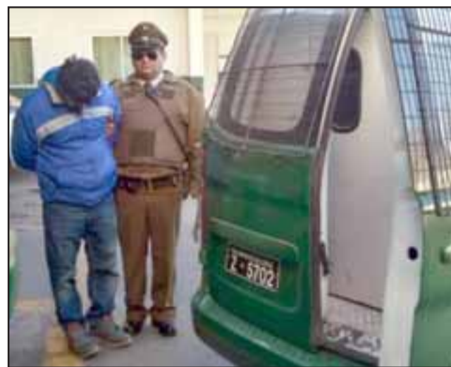
El imputado fue derivado hasta tribunales para enfrentar cargos por tráfico de drogas.

Pos instrucción de la Fiscalía el imputado individualizado con las iniciales D.A.S.M. de 39 años de edad, sin antecedentes policiales, fue derivado la mañana de ayer jueves hasta el Tribunal Mixto de Putaendo, para ser formalizado por el delito de tráfico de drogas, quedando a disposición del Ministerio Público de