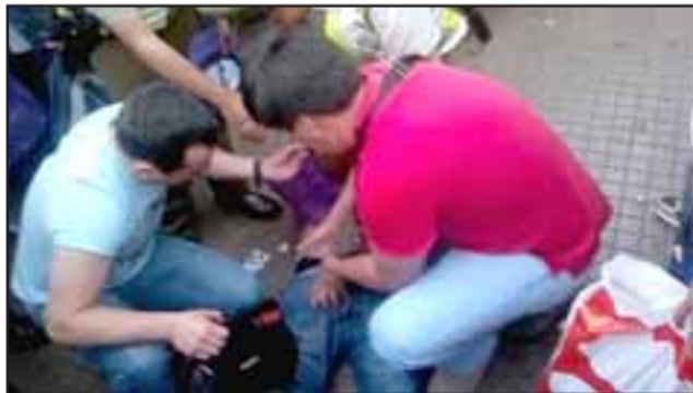
Un grupo de vecinos de la población Pedro Aguirre Cerda propinó una paliza al delincuente mientras esperaban a Carabineros que lo detuvo. (Foto Referencial).