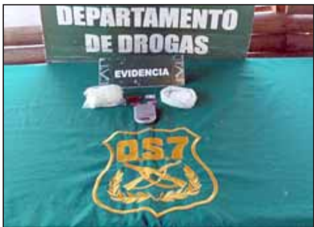
Un total de 1.600 dosis de cocaína pura incautó el OS7 de Carabineros, en un procedimiento policial que culminó con la detención de un sujeto.