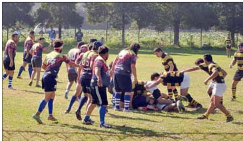
Los dos equipos de Los Halcones verán acción este sábado en el marco de los torneos Arusa y Valparaíso.

minutos y en dicho pleito los andinos buscaran dejar en el pasado la derrota sufrida ante Los Toros, en lo que fue su última presentación en el evento que reúne a varios equipos del deporte de la ovalada en la Región de Valparaíso.