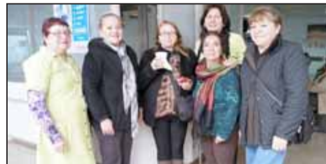
Pacientes de sectores rurales, reciben desayuno por parte del personal del Hospital San Camilo de San Felipe.

«Este proyecto lo teníamos en carpeta desde el año anterior y ahora, gracias a los fon-