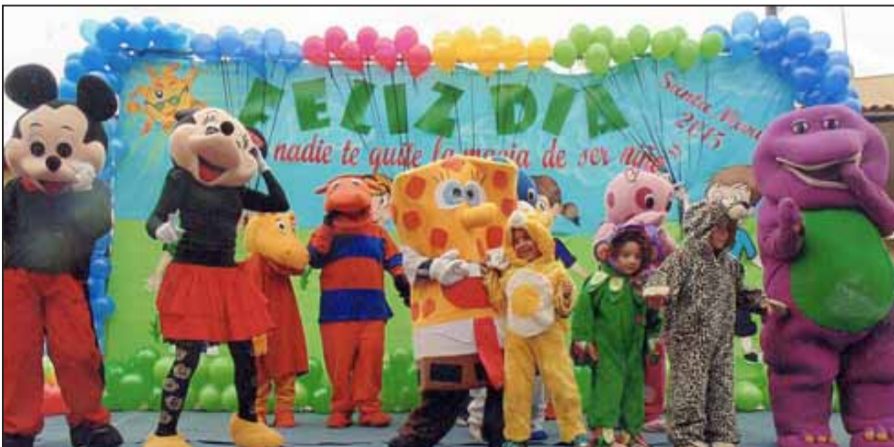
LOS DIEZ MONOS.- Estos son los monos creados por Génesis, para autofinanciarse con su propio esfuerzo y talentos.