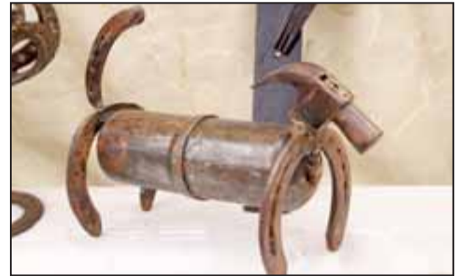
EL 'PERRO-MARTILLO'. - Este singular perrito llama bastante la atención, pues se trata de un perro-martillo, una raza muy extraña de perros metálicos que han descubierto.