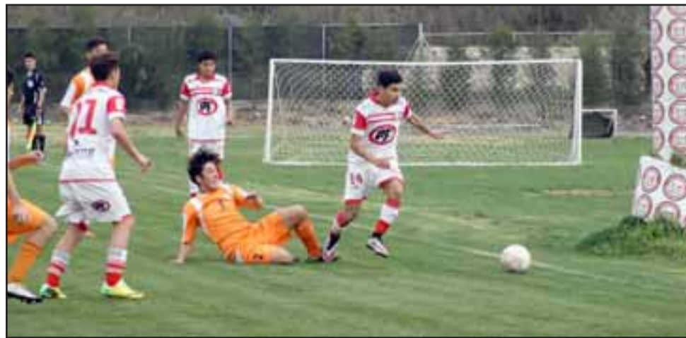
Este sábado en San Felipe y Los Andes los canteranos de Unión San Felipe y Trasandino animarán una nueva versión del clásico del Aconcagua.

12:45 horas, U17: Unión San Felipe – Trasandino