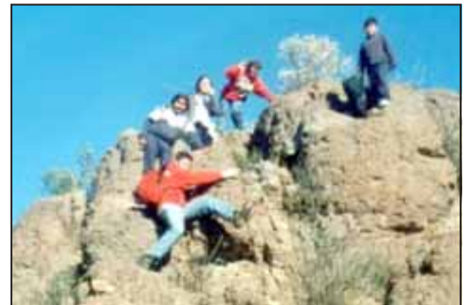
LOS INDIANA JONES.- Como lo muestra esta foto del recuerdo de 1999, la aventura es el sello personal de cada chico en esta agrupación.