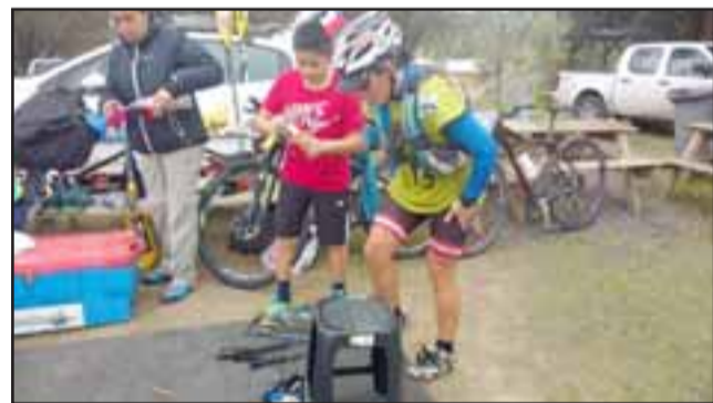
La deportista oriunda de Santa María irá a Australia con todos los gastos pagados.

La atleta santamariana está viviendo un momento feliz, ya que siente que todo su esfuerzo y sacrificio comienza a rendir frutos a nivel internacional, porque por primera vez desde que incursiona a nivel planetario, un team le ofrece costear todo, desde los pasajes aéreos, alojamiento y alimentación, cosa que significa un progreso gigantesco en su carrera. «Fue una gran sorpresa debido a que