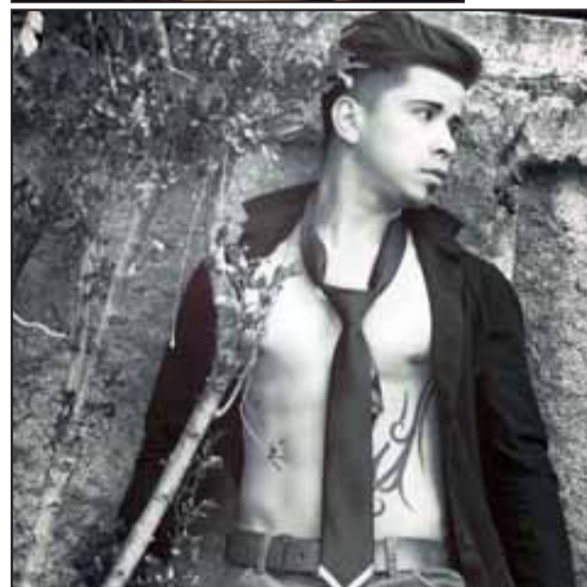
El sanfelipeño además aspira en convertirse en modelo publicitario.

milde y trabajador. Mis amigos dicen que soy la persona exacta porque si en el concurso tiene que ganar alguien, éste debe ser alguien humilde y que no