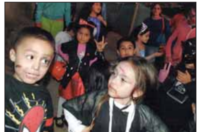
OTRAS ACTIVIDADES.- También En Halloween los niños de Génesis hacen de las suyas pidiendo golosinas.