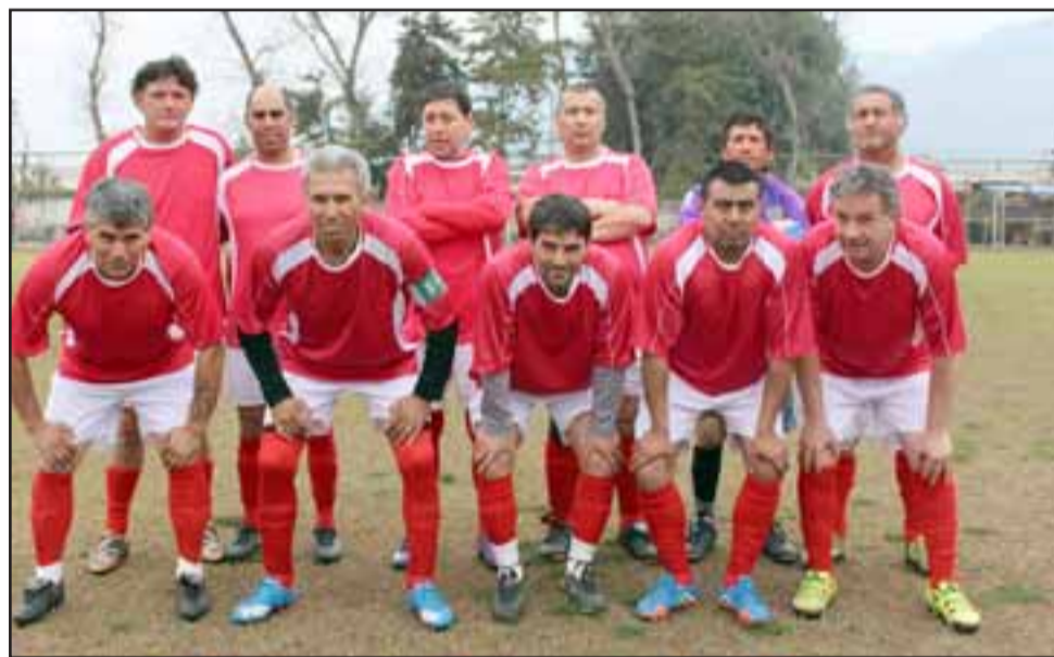
Aconcagua está en una expectante posición en el Clausura de la Liga Vecinal.

Complejo Cesar: 20 de Octubre – Deportivo GI; Los del Valle – Grupo Futbolistas; Derby 2000 – Bancarios; 3º de Línea – Casanet;