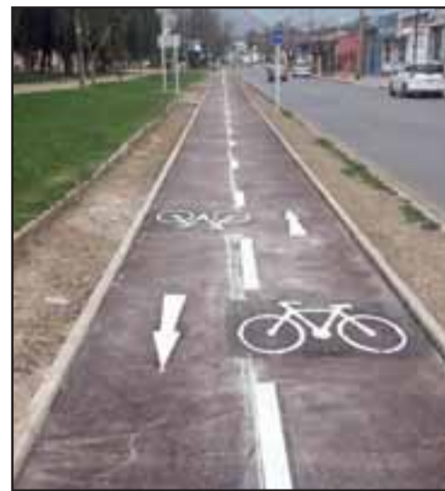
El proyecto de ciclovías que se ejecuta en San Felipe y que en su totalidad contempla la construcción de 9,6 kilómetros, pasará por distintos sectores de la comuna.

Y posterior a esa parte del proyecto se espera continuar con la construcción del tramo Tocornal, Prat, pasando por el centro