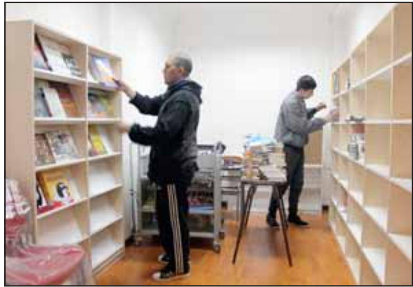
La biblioteca de la unidad sanfelipeña estará a cargo de un funcionario uniformado, quien, además, será acompañado por un recluso que lo ayudará en el funcionamiento de la dependencia.

La primera etapa que corresponde a la mejora del espacio físico está lista. Ahora viene la parte del reciclaje de los libros que pueden servir y que tiene cada unidad penal, luego de eso viene la implementación del mobiliario. Posteriormente, viene la inauguración que puede ser en octubre”, afirmó Paulina Manque.