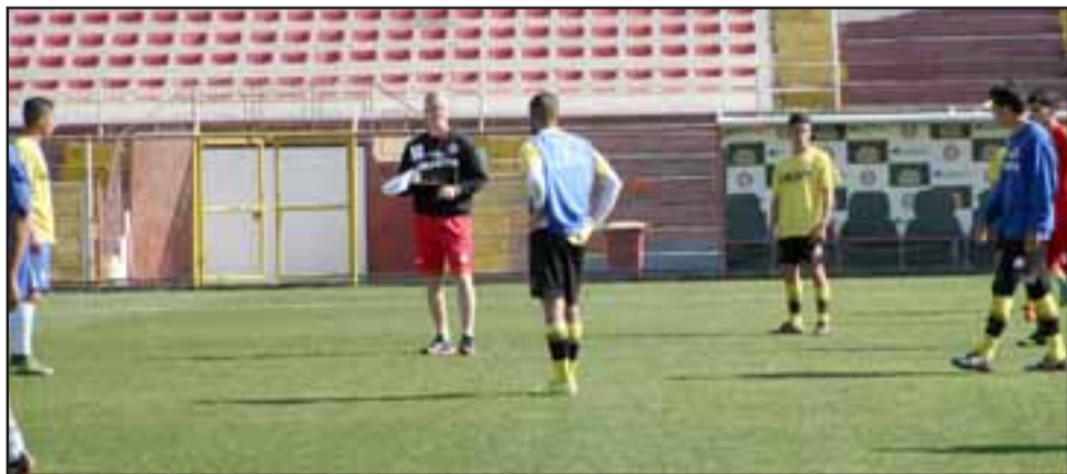
Frente a Cobreloa el Uní deberá dejar los tres puntos en casa para no ceder terreno en la parte alta de la tabla.

Las modificaciones deberían producirse en la zona de volantes, principalmen-