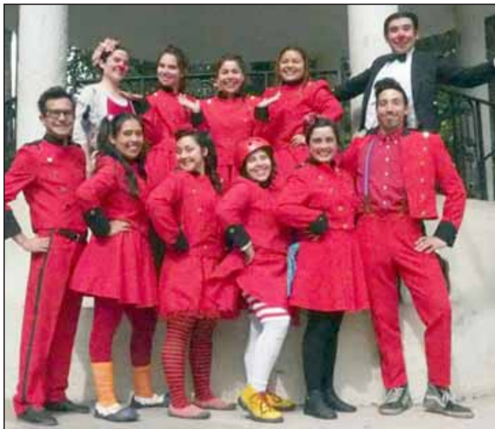
DICHOSOS.- Sonrientes posan los integrantes de la Agrupación Clownpamento.