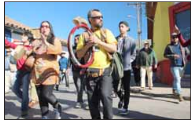
Una alta asistencia tuvo la marcha convocada la mañana del domingo, la cual se llenó de pregones y arengas, a través de comparsas, batucadas, bailes, banderas y lienzos que se tomaron las principales calles de Putaendo.

La marcha estuvo acompañada también por distintas organizaciones de Putaendo y Aconcagua, como la propia Coordinadora Putaendo Resiste, el Movimiento Putraintú, la Coordinadora Tres Ríos, el Sindicato de Temporeros