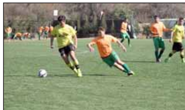
Esta tarde Trasandino y Unión San Felipe jugarán un partido amistoso en el Regional de Los Andes.