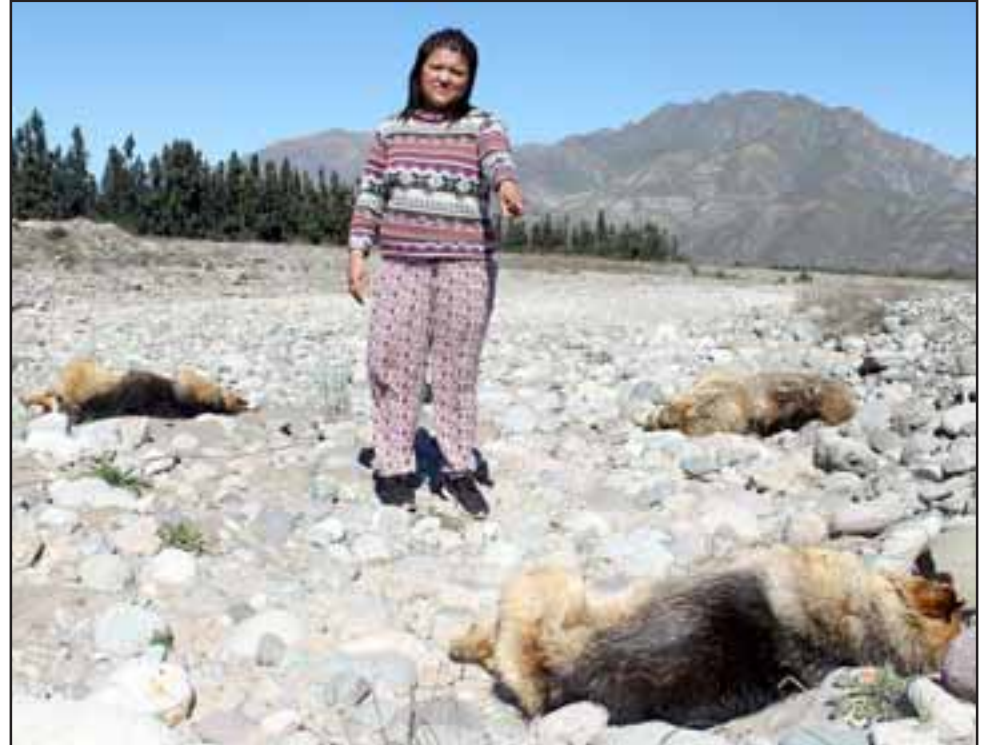
MATANZA.- Así luce la rivera del Río Putaendo en el sector 21 de Mayo, en vez de peces, lo que hay son perros muertos.

«Estoy y estamos todos muy apenados, en una semana nos han matado ya ocho perros a los vecinos, mi perro 'Cabezón' se soltó anoche, y también me lo envenenaron, he podido