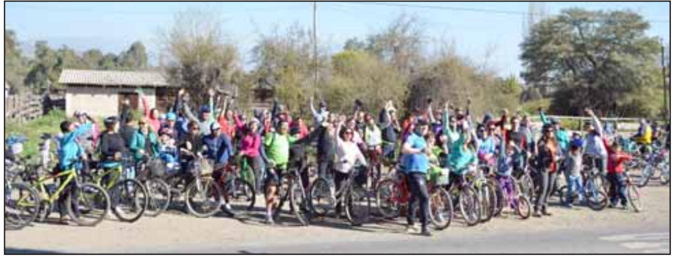
Con gran participación de los vecinos de Calle Larga y comunas aledañas, se inauguró el proyecto 'Pedaleando el Patrimonio', que consta de un paseo en bicicleta por lugares típicos de Calle Larga.

"Calle Larga, a pesar de ser una comuna muy pequeña hemos descubierto poco a poco que tiene una cantidad relevante de casas patrimoniales y que tiene un contexto histórico tremendo, por ejemplo esta la