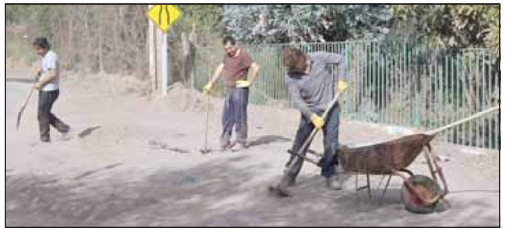
Durante la tarde del pasado sábado vecinos de Las Coimas se organizaron para tomar las herramientas necesarias, y apoyados por maquinaria enviada por la Municipalidad de Putaendo, comenzar la limpieza de calle O'Higgins.

La profesional agregó que en calle O'Higgins de Las Coimas, ya se habían desarrollado algunas intervenciones menores para