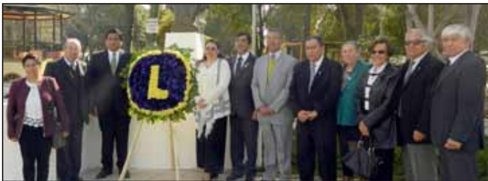
SIEMPRE O'HIGGINS.- Frente al busto del insigne personaje, autoridades y estudiantes de Santa María le rindieron tributo.