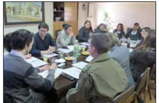
La reunión marcó el reinicio del trabajo en conjunto, entre la OPD de la ciudad, y organizaciones e instituciones que trabajan directamente con población infantojuvenil.