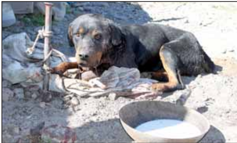
CABEZÓN.- Este perrito ayer al mediodía luchaba por su vida, luego que un desalmado lo envenenara con pan.