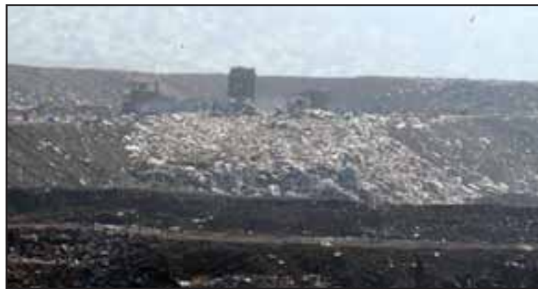
DURAS SANCIONES.- En serios aprietos está el relleno La Hormiga, empresa que desde hace meses viene siendo cuestionada por su accionar en el tema de manejo de desechos sólidos.

¡UPS!.- Así de claro establecen las autoridades que está mal manejando La Hormiga todo este tema.