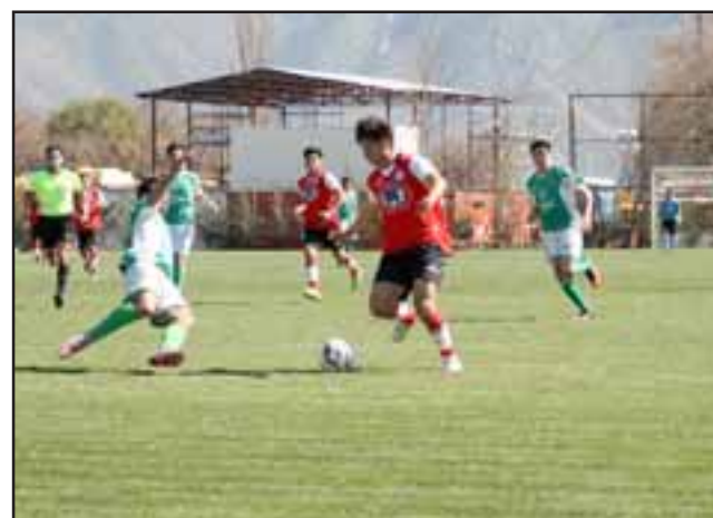
El domingo se enfrentaron en Los Andes y San Felipe, las series menores del Uní Uní y Trasandino.