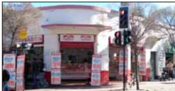
Delincuentes ingresaron al local de carne Suraron, ubicada en la esquina de calles Tres Carrera y Maipú en pleno centro de Los Andes.

Antisociales se habrían llevado piezas de carne.