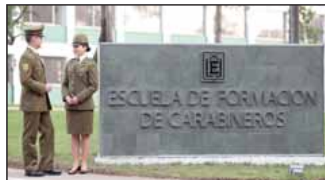
Interesados tienen hasta el 9 de septiembre para inscribirse y postular a una de las vacantes al curso que formará policías para trabajar exclusivamente en las oficinas de los cuarteles.

Finalmente, los interesados de las provincias de Los Andes y San Felipe, deben inscribirse perso-