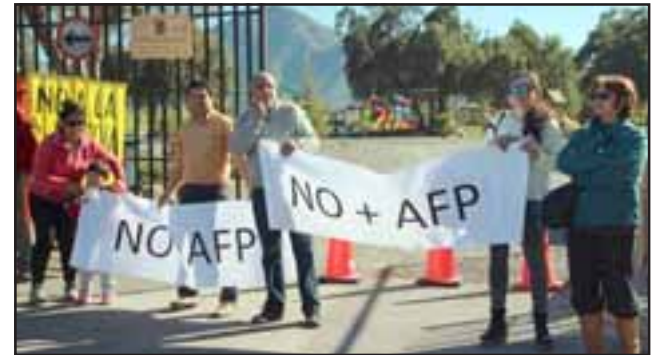
Familias completas se reunieron en Putaendo para exigir el fin al actual Sistema de Pensiones y a las A.F.P.

Aconcagua Unido, el Frente de Trabajadores por el Socialismo y la Juventud Revolucionaria Popular JRP3. En la ocasión sólo