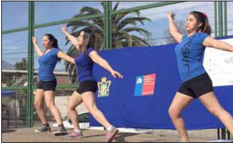
En la misma instancia se realizó una jornada de Zumba Fest, donde varios instructores estuvieron trabajando con los asistentes al evento.

es muy importante, por esta razón es primordial evitar las comidas demasiado saladas y las muy dulces, al igual que el tabaco y el alcohol. Otra recomendación que es importante repetir es la de procurar hacer ejercicio con regularidad, ya que con estas sencillas prácticas se evitan muchos problemas de salud, especialmente todos los que tienen que ver con las complicaciones del corazón.