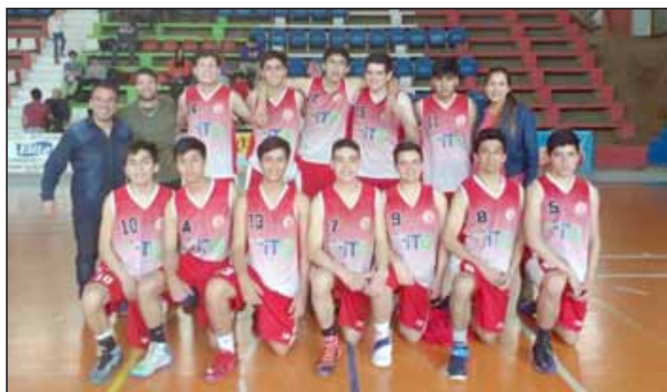
San Felipe Basket clasificó al cuadrangular final U17 de la Libcentro B.

U17: Unión San Felipe 4 - Trasandino 0 U19: Unión San Felipe 0 - Trasandino 1