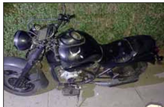
El vehículo de dos ruedas fue recuperado por Carabineros, tras la detención en flagrancia del imputado, quedando a disposición de la Fiscalía que investigará el caso.