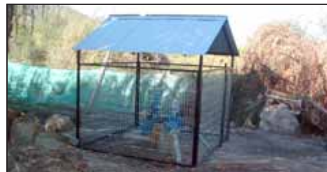
Desde el día sábado, vecinos desde el sector El Sauce a las Vizcachas, no cuentan con servicio de agua potable que es proveído por el APR del sector. (Foto referencial).

Por ello, los vecinos esperan una pronta solución a este problema, ya que con