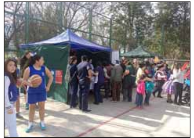
La feria, con una exposición de alimentos saludables, junto con la entrega de información relacionada al uso adecuado de alimentos para prevenir enfermedades o infartos al corazón, entre otras variadas y entretenidas actividades.

“Quiero destacar y hacer un público reconocimiento a los funcionarios de nuestro Cesfam, pues siendo un día sábado, hubo un compromiso para hacer entrega de información a los vecinos que acudieron a esta muestra, sobre todo en un tema tan importante como es la prevención de enfermeda-