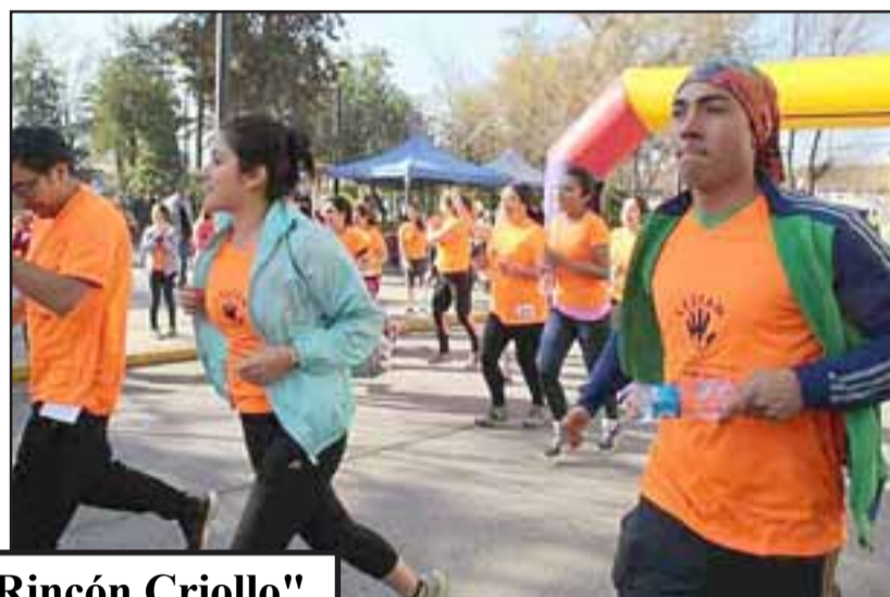
Más de 70 competidores participaron de esta iniciativa, los que recibieron hidratación, poleas y hasta una colación.

Los competidores, recibieron un premio por su importante participación, en esta actividad se volverá a realizara el próximo año.