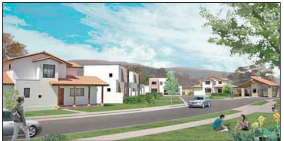
AÚN QUEDAN CASAS. - Así quedará finalmente este colosal proyecto habitacional Condominio Cumbres de Auco.

- "Todos los empresarios involucrados en este proyecto son gente aconcagüina; las empresas que construyen son Constructora e Inmobiliaria Alicahue Ltda. e Inmobiliaria Navarra, empresas que ya en Aconcagua llevan construidas más de 500 viviendas, aún quedan casas a la venta y esperamos que al igual que las familias que ya compraron la suya, en Aconcagua otros gru-