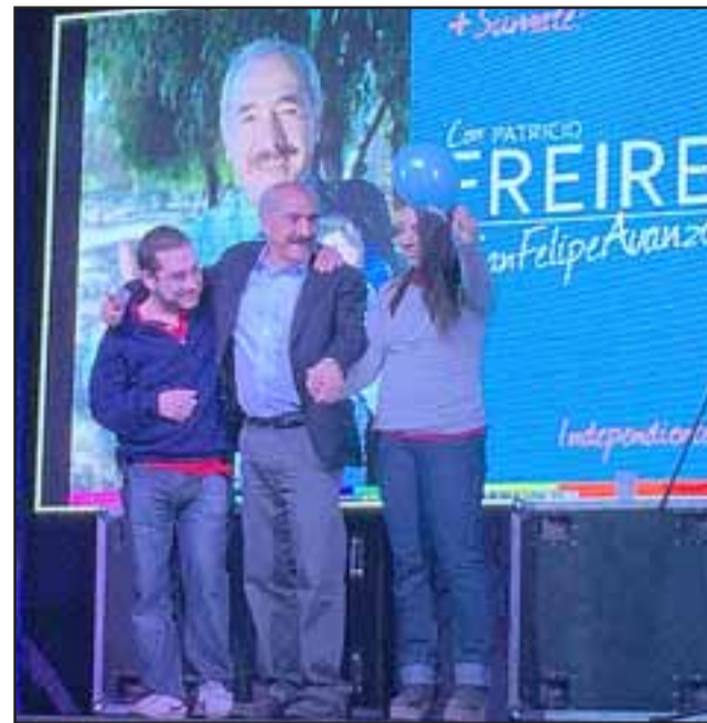
Feliz y muy entusiasmado se mostró el actual alcalde y candidato a la reelección Patricio Freire Canto, en el lanzamiento de su campaña realizada con un gran marco de público en la tarde del pasado viernes.

“Porque todas y todos, anhelamos una ciudad más linda, más limpia, más inclusiva, más respetuosa, una ciudad donde las mujeres sean respetadas, donde exista más trabajo, donde nuestros adultos mayores sigan siendo protagonistas del presente y del futuro, donde nuestros vecinos con discapacidad se desarrollen, donde nuestros niños y niñas, nuestros jóvenes, tengan no solo oportunidades, sino también espacios para crecer y para fortalecerse”, señaló Freire en su discurso.