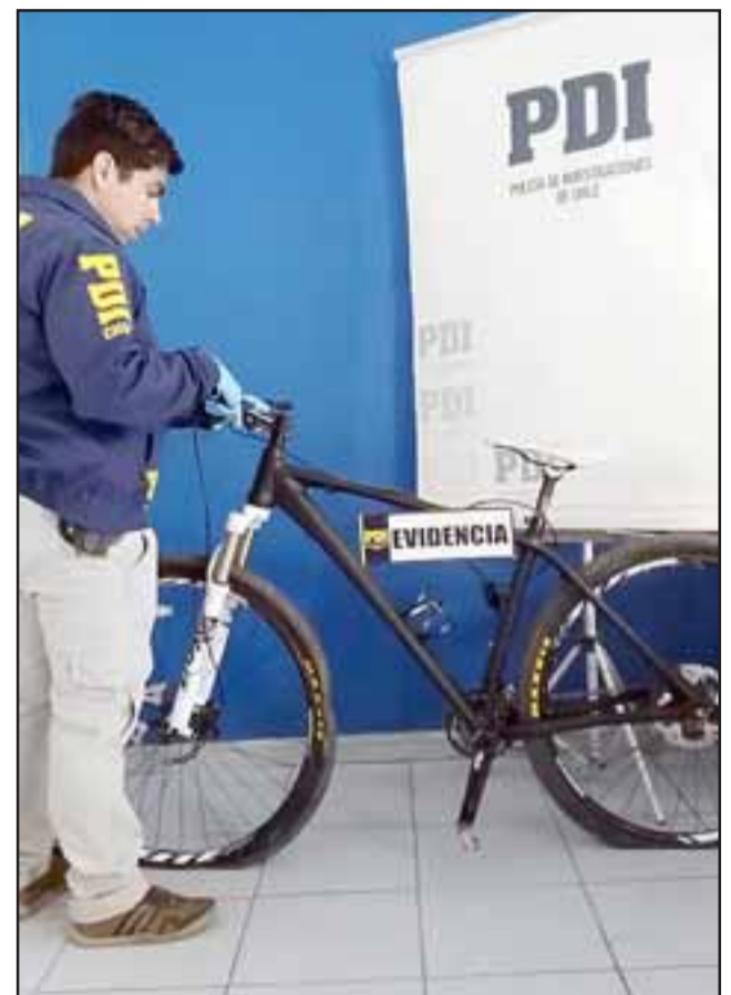
La bicicleta marca Mérida modelo Big Nine, tiene un avalúo en $1.800.000. La tarde de este viernes la PDI la incautó desde un domicilio luego que su verdadero propietario la denunció por robo desde julio de este año.