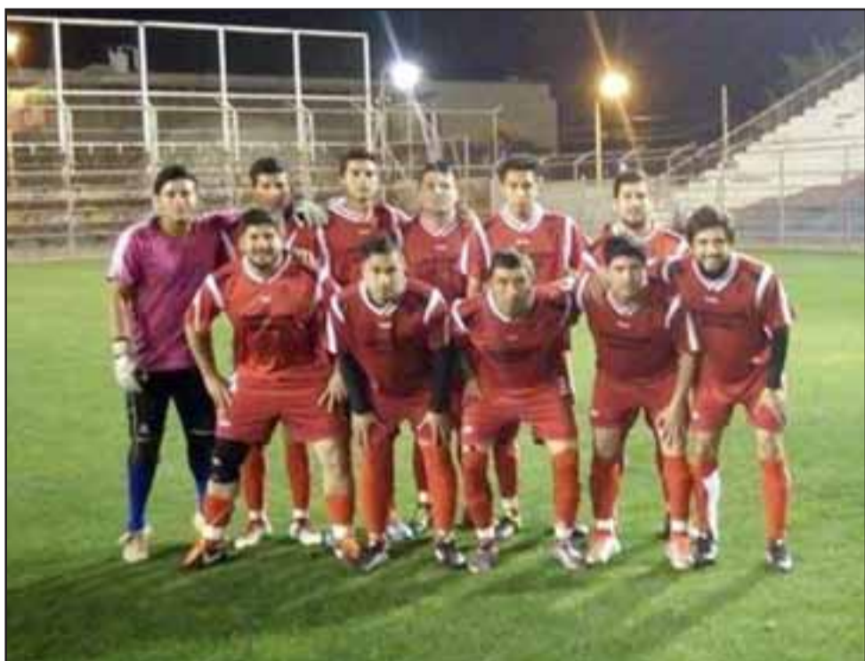
La selección de honor de San Felipe se impuso en la ida a su similar de Puchuncaví.