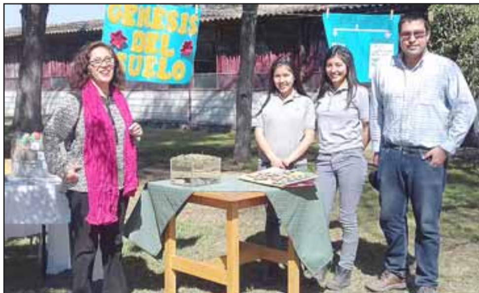
CLASES PUNTUALES.- Profesores y estudiantes participantes impartieron sus clases especializadas sobre temas específicos, en temas del suelo.