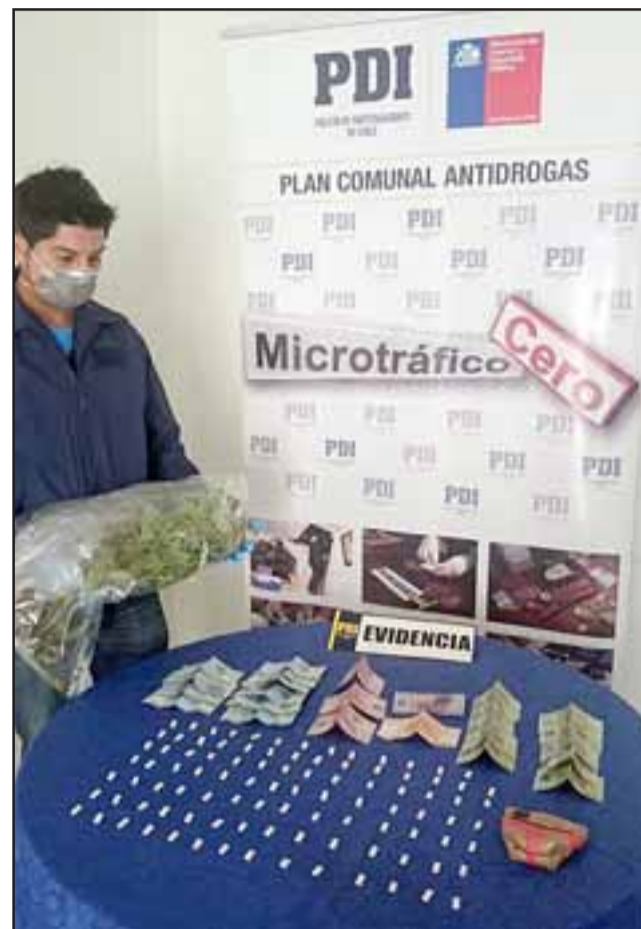
El Grupo Microtráfico Cero de la PDI de San Felipe incautó las sustancias ilícitas, plantas de Cannabis Sativa y el dinero en efectivo desde el interior de una vivienda en la población Manso de Velasco.

Según indicó la PDI a Diario El Trabajo , de acuerdo a las investigaciones policiales, la imputada se dedicaría a la comercialización de estas sustancias ilícitas a los adictos del sector, razones que motivaron a los vecinos a denunciar estos hechos a la policía