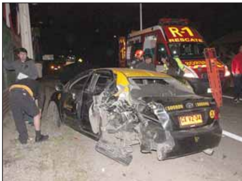
Con serios daños resultó un radio taxi perteneciente a la empresa Andacollo, luego que fuera impactado a alta velocidad en las afueras del Restaurant Casa Grande, mientras tomaba pasajeros la madrugada de éste domingo.

Hasta el lugar del accidente acudieron dos ambulancias del Samu y la unidad