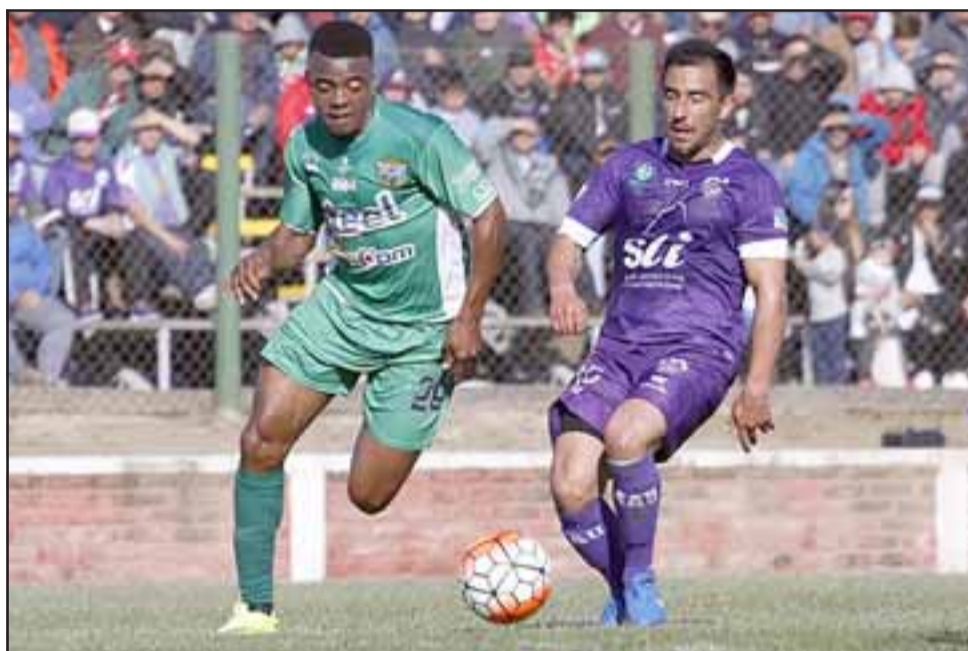
Un debut muy positivo tuvo Trasandino al imponerse a domicilio a San Antonio por un gol a cero.