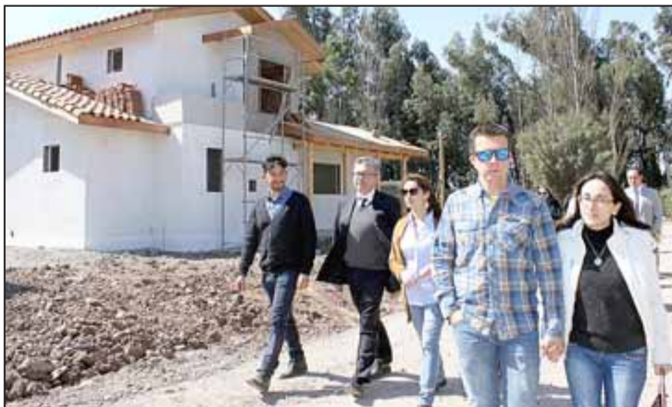
CLIENTES FISCALIZAN. - También los invitados realizaron un recorrido por el complejo que próximamente será su hogar permanente.

encaja perfectamente en la vida de aquellas personas que desean vivir en un ambiente tranquilo y seguro, que hoy nuestro reportaje apuntó hacia el conocer y presentar a nuestros lectores las mejores alternativas de vida saludables, que no están ni en el frío cemento de Santiago, y tampoco en las agitadas ciudades de nuestro gran Valle Aconcagua. Los interesados en más información sobre el proyecto Cumbres de Auco, pueden llamar al celular 964689813 .