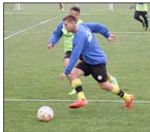
Unión San Felipe ha trabajado muy fuerte durante el prolongado receso de casi tres semanas.