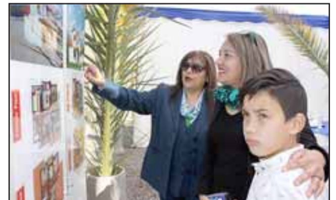
QUEDAN POCAS CASAS. - Familias enteras de Santiago y Aconcagua están maravilladas con este condominio, el que próximamente será inaugurado.