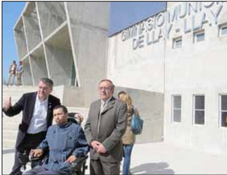
FRONTIS DEL GIMNASIO.- En la principal vía de ingreso al Gimnasio Municipal de Llay Llay, posan para las cámaras el gobernador de San Felipe, Eduardo León y el alcalde Mario Marillanca, en compañía de un vecino llayllaino.

León, expresó que como Gobierno están contentos “con lo que ocurrió en Llay Llay, este polideportivo agrega más recintos a una comuna que se ha destacado por su talento, (...) hoy estamos con Narcy Araya seleccionado nacional de Bocha, y él simboliza a muchos deportistas que están