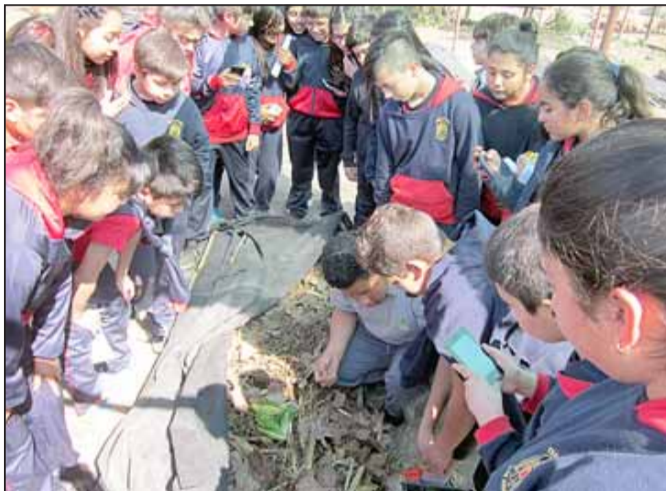
APRENDER JUGANDO.- Peques y grandes hicieron sus propios experimentos, comprender los suelos es muy importante en esta escuela sanfelipeña.