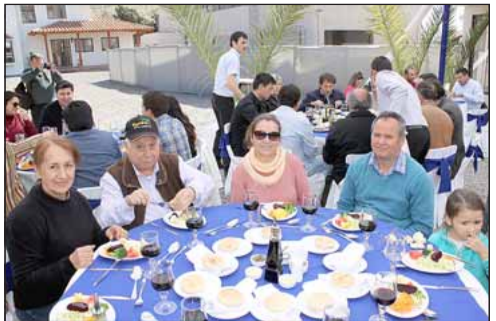
A CELEBRAR FAMILIA. - Con un delicioso almuerzo los futuros dueños, empresarios y autoridades, celebraron el inicio de esta última fase del proyecto.

pos familiares decidan aprovechar este gran proyecto, mucha gente de Santiago ya está comprando estas viviendas, también hay más familias de San Felipe, Los Andes, Calle Larga y de otros sectores del valle. Esperamos entre marzo y abril de 2017 poder estar inaugurando este complejo habitacional".