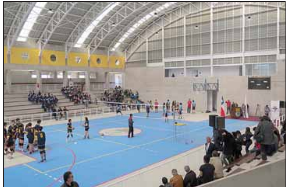
VOLEY.- Infaltable es el voleibol en este tipo de arenas, por lo cual se realizó un extenso juego, dando así el vamos en la misma cancha.