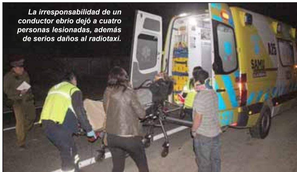
La irresponsabilidad de un conductor ebrio dejó a cuatro personas lesionadas, además de serios daños al radiotaxi.

de rescate de Bomberos de Putaendo, quienes lograron sacar a tres pasajeros desde el interior del móvil, mientras que el cuarto fue encontrado deambulando en las inmediaciones, desorientado y shockeado por la magnitud del impacto.